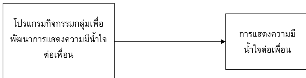
ภาพประกอบ 1 กรอบแนวคิดในการวิจัย

ในการวิจัย เรื่องผลของกิจกรรมกลุ่มเพื่อพัฒนาการแสดงความมีน้ำใจต่อเพื่อนของนักเรียนช่วงชั้นที่ 2 โรงเรียนเฉลิมมณีฉายวิทยาคาร จังหวัดสมุทรปราการ มีกรอบแนวคิดในการวิจัย ดังนี้