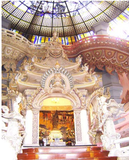
ภาพประกอบ 21 ภาพซุ้มพระธาตุ

ถ้วยเบญจรงค์หาซื้อได้จากจันทราไปละ 5 บาท และซื้อได้จากจังหวัดเพชรบุรี ราคา 50 - 70 บาท มีลวดลายสีสันแตกต่างกัน การประดับด้วยเครื่องกระเบื้อง มีวิวัฒนาการตั้งแต่สมัยรัชกาลที่ 3 (ของจีนจะบางกว่า)