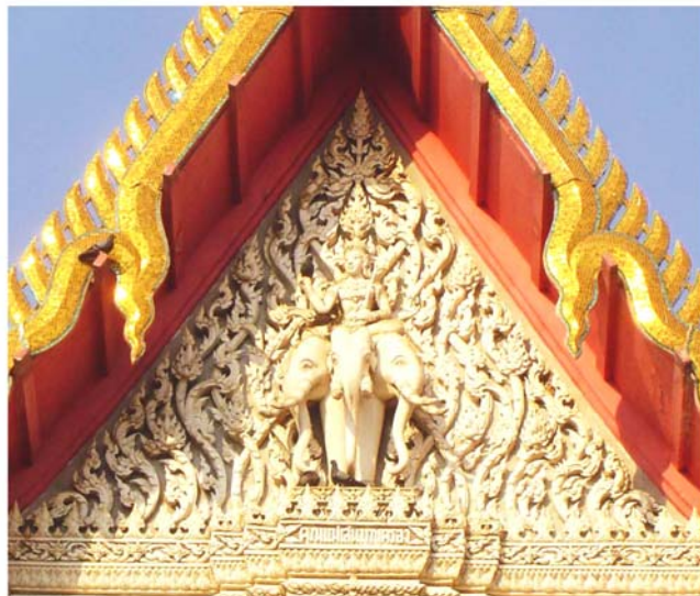
ภาพประกอบ 58 ภาพพระยะใกล้หน้าบันพระอุโบสถวัดเพชรสุวรรณ อ.บ้านแหลม จ.เพชรบุรี