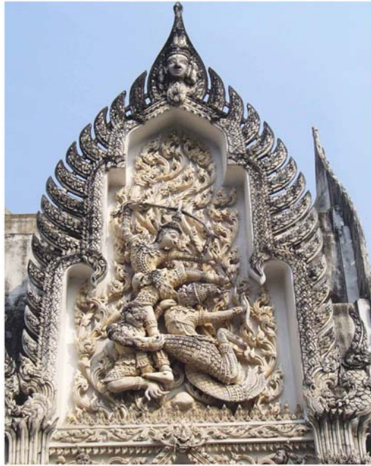
ภาพประกอบ 31 ภาพซุ้มวิหาร หลวงพ่อมี วัดพระทรง อ.เมือง จ.เพชรบุรี