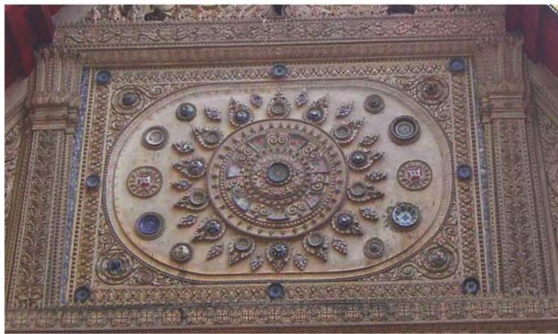
ภาพประกอบ 25 ภาพระยะไถ้หน้าบันพระอุโบสถวัดเขายี่สาร อ.อัมพวา จ.สมุทรสงคราม

หน้าบันพระอุโบสถวัดเขายี่สารประดับด้วยถ้วยชามเก่าที่มีราคาแพง การป้องกันการหลุดหล่นลงมาแตกเสียหาย ช่างปูนปั้นต้องปั้นลายมาบังคับถ้วยชามเหล่านั้นไว้ ถ้วยชามเหล่านี้ส่วนมากเป็นสมบัติของวัดที่เก็บกันต่อๆ มาจากเจ้าอาวาสก่อนๆ จึงมีคุณค่ามาก