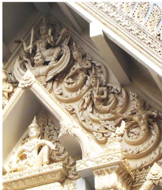
ภาพประกอบ 73 ภาพระยะไถ้ลายหน้าจั่ววิหารหน้าพระปรารค์ วัดมหาธาตุ จ.เพชรบุรี