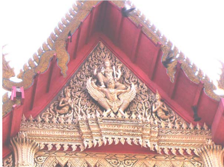
ภาพประกอบ 55 ภาพหน้าบันพระอุโบสถวัดในกลาง อ.บ้านแหลม จ.เพชรบุรี