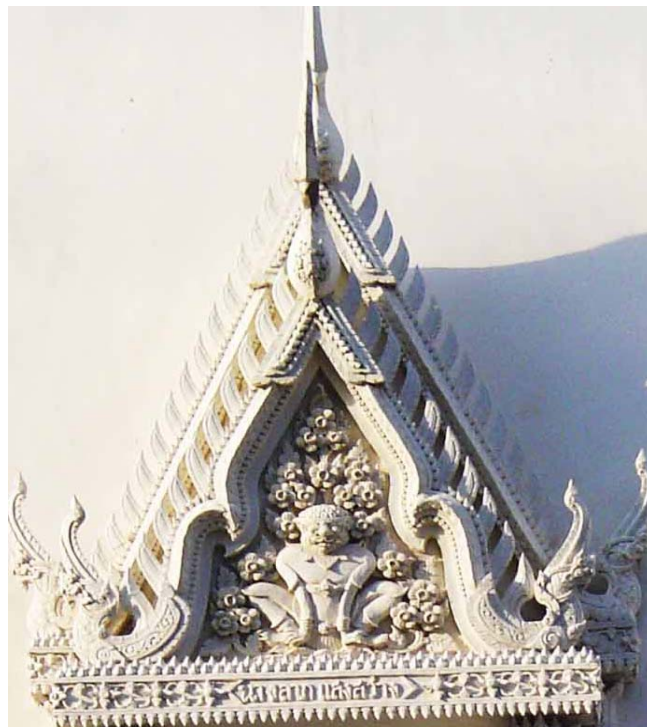
ภาพประกอบ 47 ภาพพระยะไถ้ซุ้มหน้าต่างวัดชีประเสริฐ อ.เมือง จ.เพชรบุรี