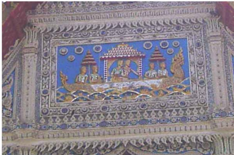
ภาพประกอบ 12 ภาพพระยะไกล้หน้าบัน พระอุโบสถวัดโตนดหลวง อ.ชะอำ จ.เพชรบุรี เป็นภาพพระนเรศวรมหาราช และพระเอกาทศรถทรงเบ็ด

ภาพหน้าบันพระอุโบสถวัดโตนดหลวง เป็นลักษณะปั้นปิดทองติดกระจก ปิดทองจะไม่มากนัก ทองร่วงเลือกที่จะโชว์ภาพให้ชัดเจนด้วยตัวภาพขาว และทอ้งฟ้าด้วยกระจกสีฟ้า เป็นภาพพระนเรศวรมหาราชและพระเอกาทศรถ ประทับเรือทรงเบ็ด และตัวพระอุโบสถของวัดโตนดหลวงเหมือนตั้งอยู่บนเรืออีกด้วยโดยกำแพงพระอุโบสถทำเป็นตัวเรือมีเสากระโดง ห้องเครื่องคือพระอุโบสถทั้งหลัง