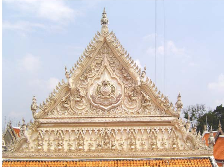
ภาพประกอบ 53 ภาพหน้าบันวิหารหลวง ด้านทิศตะวันตก วัดมหาธาตุ จ.เพชรบุรี