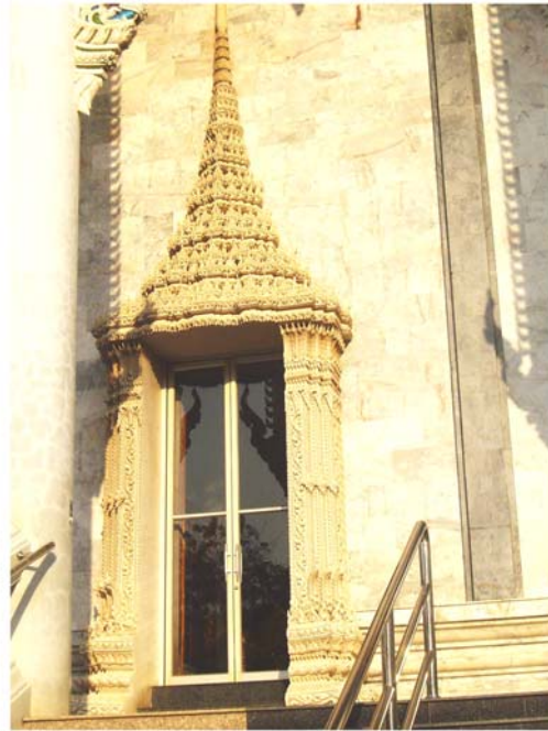
ภาพประกอบ 61 ภาพซุ้มประตูพระอุโบสถวัดสนามพราหมณ์ อ.เมือง จ.เพชรบุรี