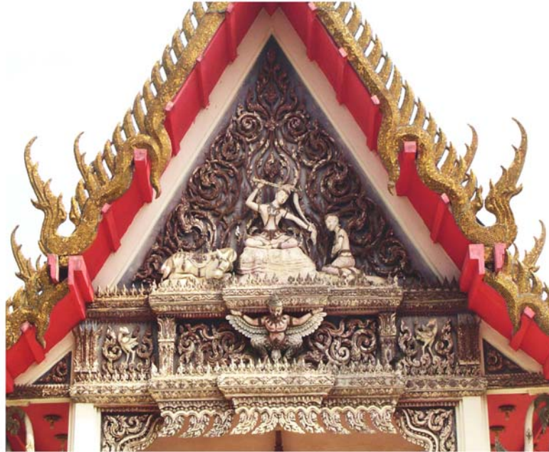
ภาพประกอบ 50 ภาพหน้าบันพระอุโบสถวัดโคก ด้านทิศตะวันตก อ.เมือง จ.เพชรบุรี