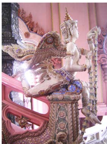
ภาพประกอบ 19 ภาพหัวเสาทางขึ้นบันไดทอง

บันไดเงินบันไดทอง ปูนปั้นประดับด้วยเครื่องกระเบื้อง คือถ้วยชามเบญจรงค์ทูป ราคาถ้วยใบละ 50 - 70 บาท และใบละ 700 - 800 บาท บันไดเงินใช้ปูนที่ทำจากหินฟลูออไรด์ ซึ่งจะมีสีขาว