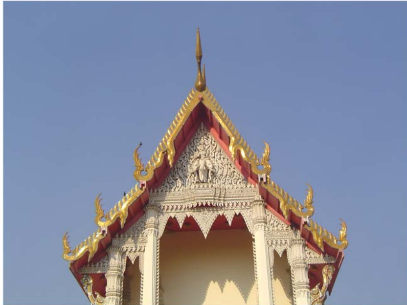
ภาพประกอบ 57 ภาพหน้าบันพระอุโบสถวัดเพชรสุวรรณ อ.บ้านแหลม จ.เพชรบุรี