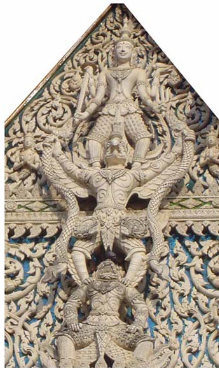
ภาพประกอบ 34 ภาพพระยะใกล้หน้าบันพระอุโบสถ วัดสนามพราหมณ์ อ.เมือง จ.เพชรบุรี