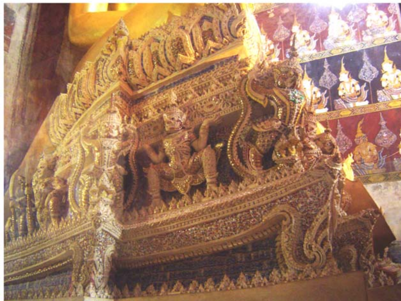
ภาพประกอบ 23 ภาพระยไถ้ฐานพระประธานในวิหารหลวง วัดมหาธาตุ จ.เพชรบุรี