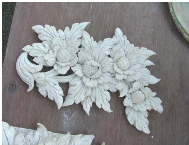
ภาพประกอบ 3 ตัวอย่างงานที่ทอรวง เอ็มโອษฐ สาคิตให้เด็กๆ และผู้ใหญ่ที่สนใจ