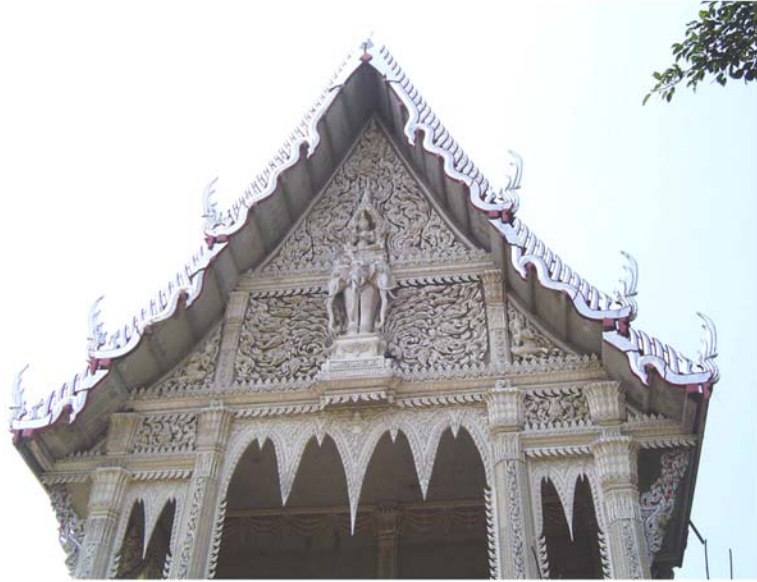
ภาพประกอบ 44 ภาพหน้าบันพระอุโบสถ วัดจันทรवास อ.เมือง จ.เพชรบุรี