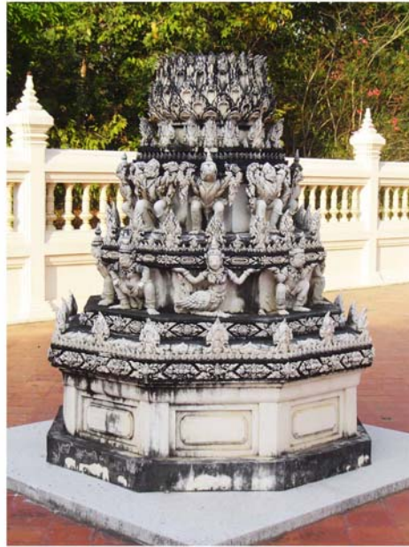
ภาพประกอบ 37 ภาพฐานเสมาวัดสนามพราหมณ์ อ.เมือง จ.เพชรบุรี