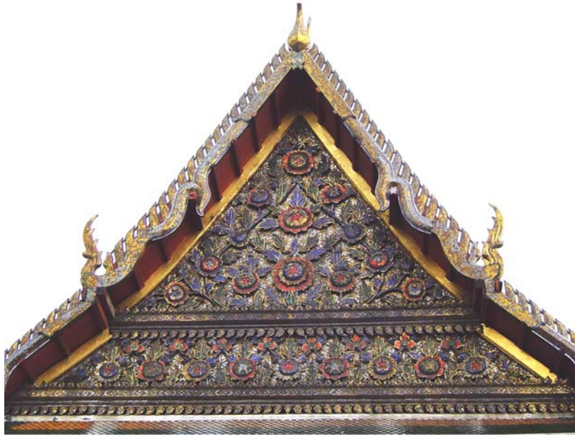
ภาพประกอบ 26 ภาพหน้าบันพระอุโบสถวัดประยูรวงศ์ กรุงเทพฯ