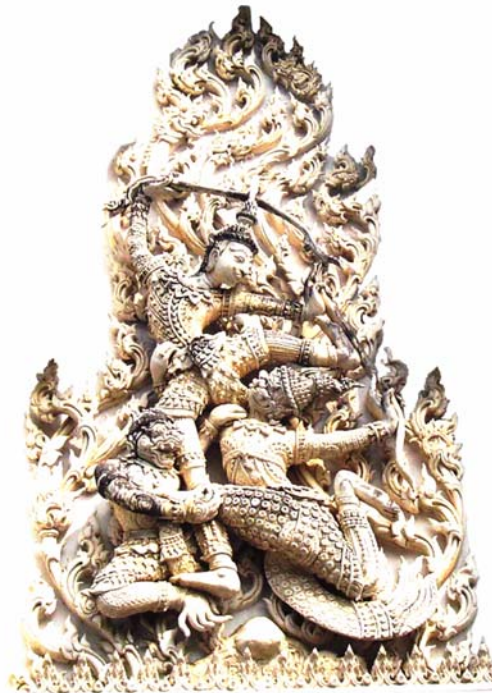
ภาพประกอบ 32 ภาพพระยะไถ่ซุ้มวิหาร หลวงพ่อมี วัดพระทรง อ.เมือง จ.เพชรบุรี