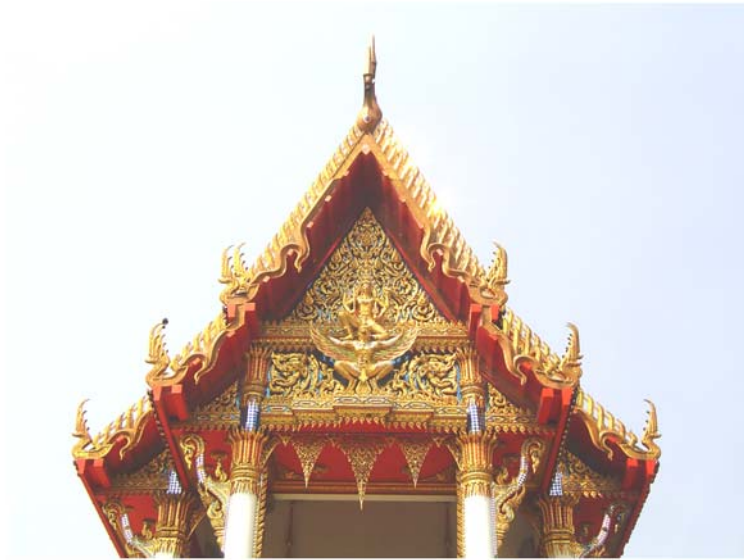
ภาพประกอบ 66 ภาพหน้าบันพระอุโบสถวัดใหญ่อ่างทอง อ.ปากท่อ จ.ราชบุรี