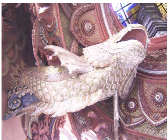
ภาพประกอบ 17 ภาพภายในชั้นล่างของพิพิธภัณฑ์ช้างเอราวัณ

ช้างเอราวัณเป็นช้างทรงของพระอินทร์ ประติมากรรมลอยตัวโครงสร้างภายนอกใช้แผ่นทองแดงบริสุทธิ์ ความสูงจากพื้นดินถึงยอด 43.60 เมตร สํารวย เอ็มโอบุ๊ ดูแลออกแบบตกแต่งภายในตัวช้าง แบ่งการจัดแสดงออกเป็นสามส่วน โดยใช้แนวคิด คติ ความเชื่อ ของหลักไตรภูมิ ซึ่งประกอบด้วยโลกบาดาล โลกมนุษย์และสวรรค์ ชั้นล่างเป็นชั้นแห่งโลกบาดาลกึ่งกลางใช้สัญลักษณ์รูปปั้นของพญานาค บริเวณรอบๆ เป็นสระอโนดาต มีโขดหินเรียงรายเป็นแนววงกลม