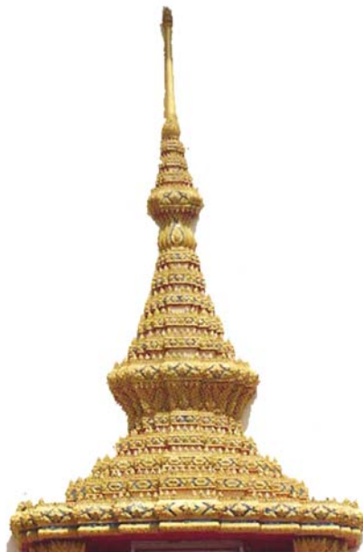
ภาพประกอบ 71 ภาพส่วนยอดซุ้มหน้าต่างพระอุโบสถวัดในกลาง อ.บ้านแหลม จ.เพชรบุรี