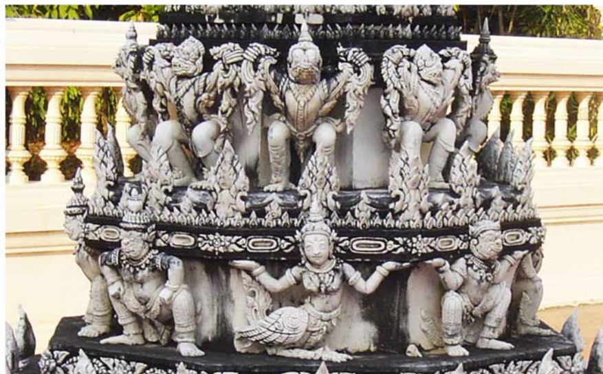
ภาพประกอบ 38 ภาพพระยะไถ้ฐานเสมาวัดสนามพราหมณ์ อ.เมือง จ.เพชรบุรี