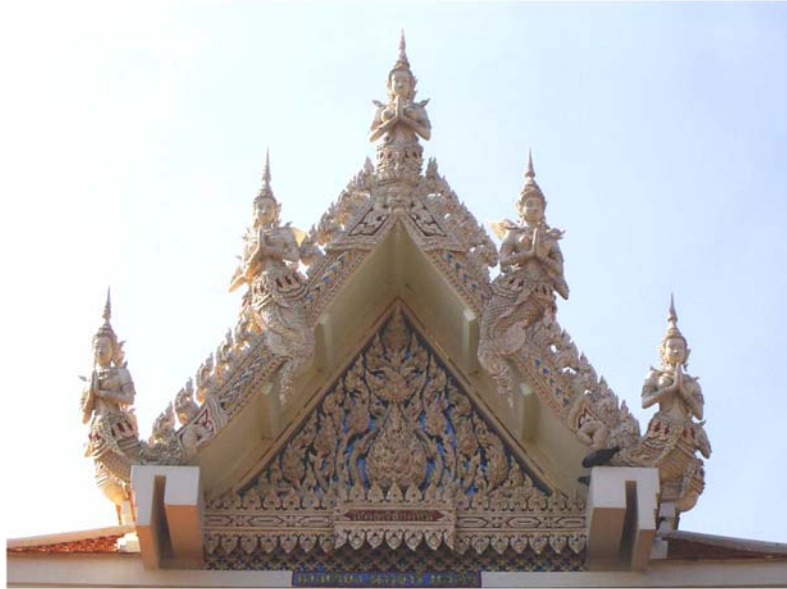
ภาพประกอบ 42 ภาพหน้าบันวิหารวัดลักษณาราม อ.บ้านแหลม จ.เพชรบุรี