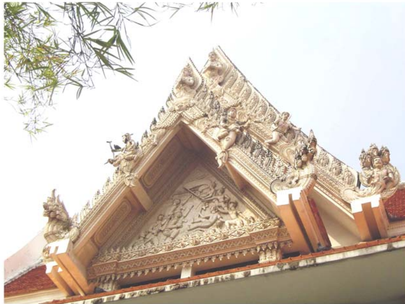
ภาพประกอบ 35 ภาพซ่อฟ้าศาลานางสาวอัมพร บุญประคอง วัดมหาธาตุ จ.เพชรบุรี