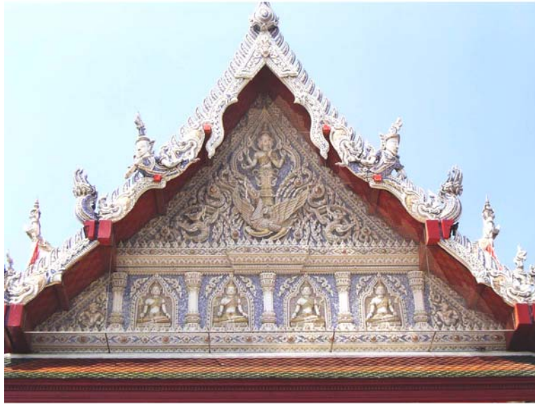
ภาพประกอบ 13 ภาพหน้าบันวัดกลางบางแก้ว อ.นครชัยศรี จ.นครปฐม