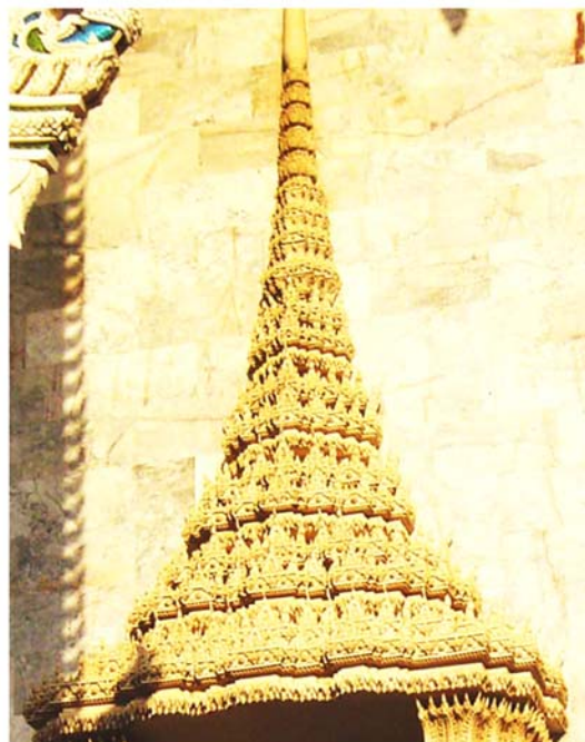
ภาพประกอบ 62 ภาพส่วนยอดซุ้มประตูอุโบสถ วัดสนามพราหมณ์ อ.เมือง จ.เพชรบุรี