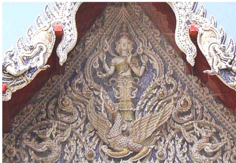
ภาพประกอบ 14 ภาพพระยะไถลหน้าบันวัดกลางบางแก้ว อ.นครชัยศรี จ.นครปฐม

วัดกลางบางแก้ว เป็นวัดที่ชื่อของทองร่วง เอ็มโษษฐ์ คงจะถูกจารึกไว้อีกนานแสนนาน เพราะเป็นฝีมือของทองร่วงทั้งวัด ทั้งพระอุโบสถ วิหาร ศาลา ฯลฯ และขณะนี้ก็ยังไม่แล้วเสร็จ ตั้งแต่กำแพงพระอุโบสถที่สื่อสะท้อนสังคมไว้มากมาย มีหกศาสนา มีศาสตาของศาสนาต่างๆ มีเรื่องราวที่สะท้อนสังคม เช่น มีไอซามา บิลลาเดน เขี่ยบบนอาคารเวิลด์เทรดเซ็นเตอร์ ที่วัดนี้ ทองร่วงนำเทคนิคประดับถ้วยเบญจรงค์มาใช้