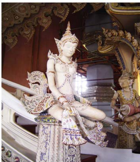
ภาพประกอบ 18 ภาพหัวเสาทางขึ้นบันไดเงิน

บันไดเงินบันไดทอง ปูนปั้นประดับด้วยเครื่องกระเบื้อง คือถ้วยชามเบญจรงค์ทูป ราคาถ้วยใบละ 50 - 70 บาท และใบละ 700 - 800 บาท บันไดเงินใช้ปูนที่ทำจากหินฟลูออไรด์ ซึ่งจะมีสีขาว