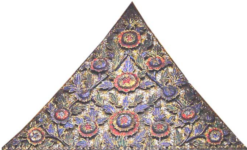
ภาพประกอบ 27 ภาพระยະไกล้หน้าบันพระอุโบสถวัดประยูรวงศ์ กรุงเทพฯ เป็นลวดลายดอกพุดตาน ประดับกระจกลี