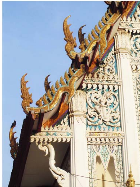
ภาพประกอบ 48 ภาพคูหาวัดชีประเสริฐ อ.เมือง จ.เพชรบุรี