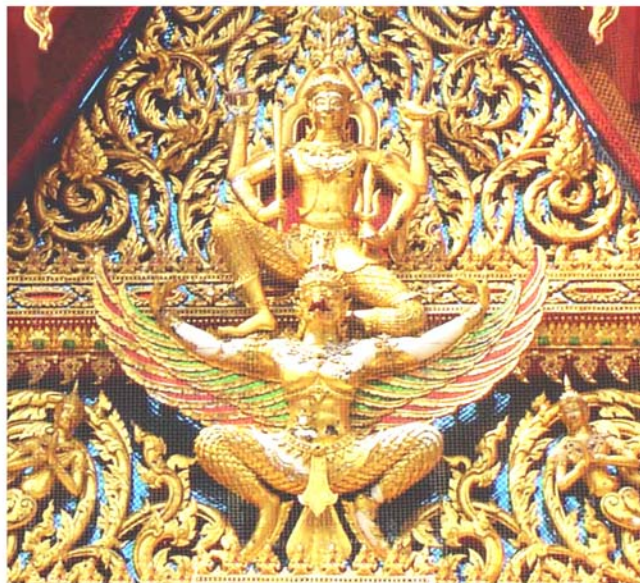
ภาพประกอบ 67 ภาพระยະใกล้หน้าบันพระอุโบสถวัดใหญ่อ่างทอง อ.ปากท่อ จ.ราชบุรี