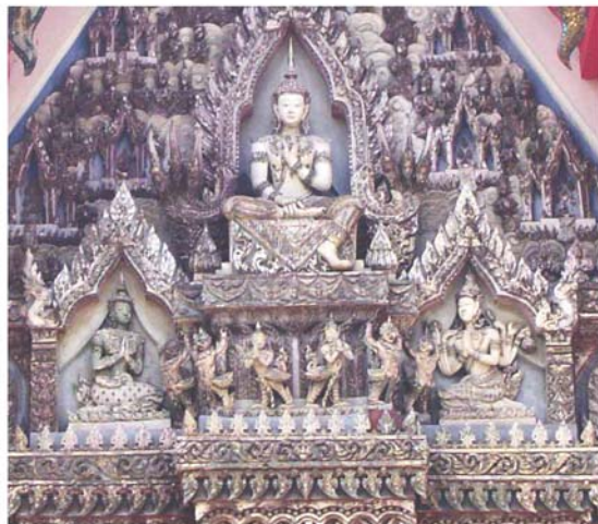
ภาพประกอบ 6 ภาพพระยะใกล้หน้าบันพระอุโบสถวัดโคก ด้านทิศตะวันออก อ.เมือง จ.เพชรบุรี

หน้าบันวัดโคกถือได้ว่าแปลกกว่าหน้าบันทั่วๆ ไป คือทองร่วง เอ็มโอษฐ์ ทดลองปั้นแบบที่เคยมีปรากฏอยู่ในสมัยอยุธยา คือทั้งหมดมีแต่ภาพ ไม่มีลาย ภาพจะเต็มพื้นที่สามเหลี่ยม