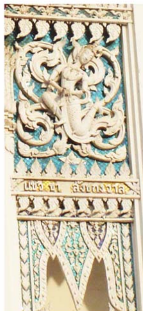
ภาพประกอบ 49 ภาพพระยะไถ้ คูหาวัดชีประเสริฐ อ.เมือง จ.เพชรบุรี