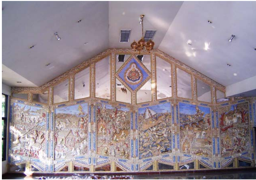
ภาพประกอบ 9 ปูนปั้นภาพพระมหาชนกละในร้านขนมแม่กิมไล้ อ.บ้านลาด จ.เพชรบุรี