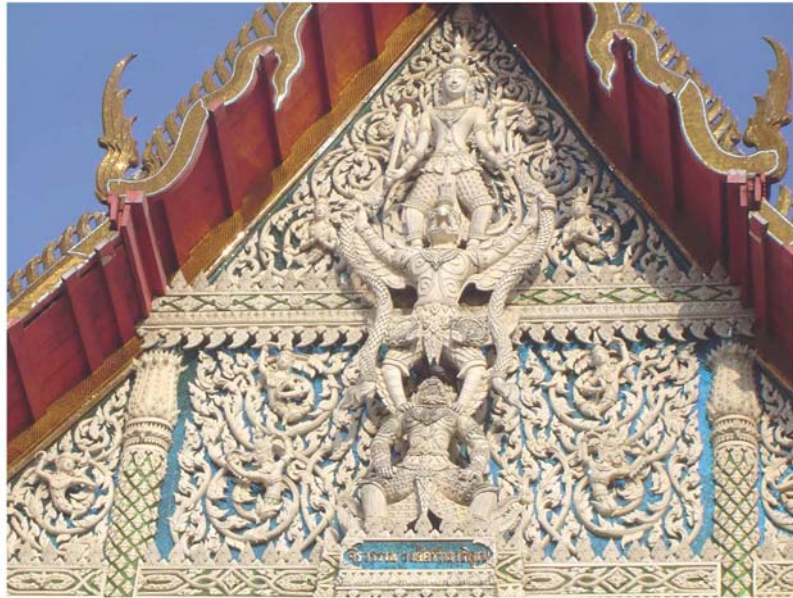
ภาพประกอบ 33 ภาพหน้าบันพระอุโบสถ วัดสนามพราหมณ์ อ.เมือง จ.เพชรบุรี