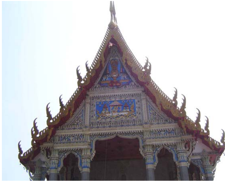
ภาพประกอบ 11 ภาพหน้าบัน พระอุโบสถวัดโตนดหลวง อ.ชะอำ จ.เพชรบุรี