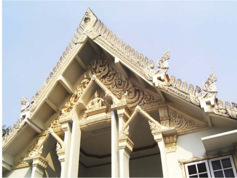
ภาพประกอบ 72 ภาพลายหน้าจั่ววิหารหน้าพระปรารค์ วัดมหาธาตุ จ.เพชรบุรี