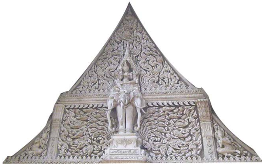
ภาพประกอบ 45 ภาพพระยะไถ้หน้าบันพระอุโบสถ วัดจันทรवास อ.เมือง จ.เพชรบุรี

หน้าบันวัดจันทรवासจะเห็นความเป็นเอกลักษณ์ของช่างสมบัติอย่างชัดเจนคือ ลายเปลวจะใหญ่ๆ และเคลื่อนไหวหรือสะบัดมาก