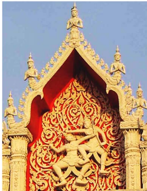
ภาพประกอบ 69 ภาพพระยะไถ้ซุ้มทางเข้าวัดจันทราวาส อ.เมือง จ.เพชรบุรี