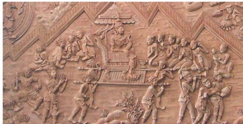
ภาพประกอบ 8 ภาพพระยะไถ้ล้อมล่างของภาพนูนต่ำ บริเวณห้องโถง โรงพยาบาลเพชรรัชต์ อ.เมือง จ.เพชรบุรี