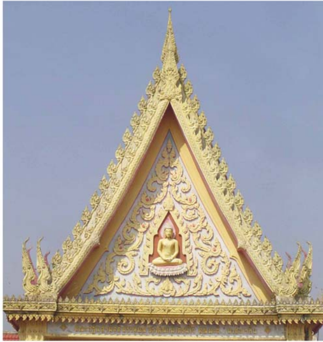
ภาพประกอบ 59 ภาพซุ้มประตูวัดศิระคาม อ.บ้านแหลม จ.เพชรบุรี