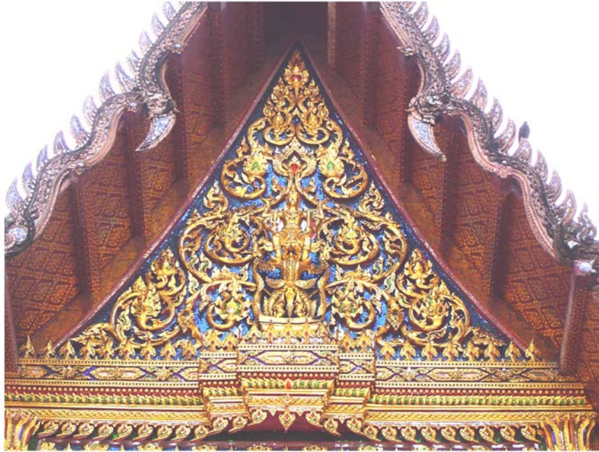
ภาพประกอบ 28 ภาพหน้าบันพระอุโบสถวัดอินทราวาส กรุงเทพฯ