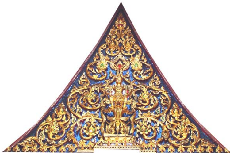
ภาพประกอบ 29 ภาพพระยะไถ้หน้าบันพระอุโบสถวัดอินทราวาส กรุงเทพฯ