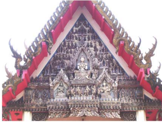
ภาพประกอบ 5 ภาพหน้าบันพระอุโบสถวัดโคก ด้านทิศตะวันออก อ.เมือง จ.เพชรบุรี