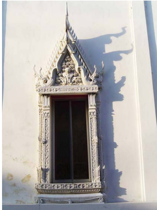
ภาพประกอบ 46 ภาพซุ้มหน้าต่างวัดชีประเสริฐ อ.เมือง จ.เพชรบุรี