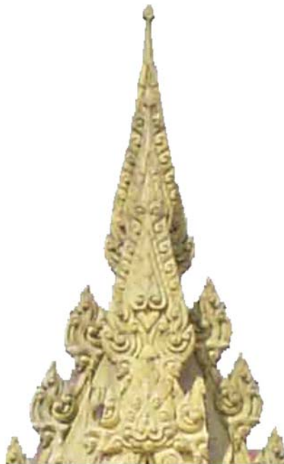
ภาพประกอบ 60 ภาพส่วนที่เป็นยอดแหลมของซุ้มประตูวัดศิระคาม อ.บ้านแหลม จ.เพชรบุรี