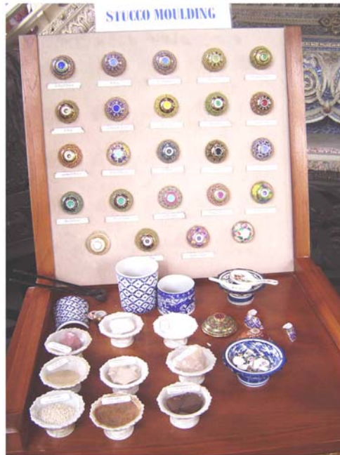
ภาพประกอบ 20 ภาพถ้วยเบญจรงค์ที่นำมาทาบประดับกับปูนปั้น

ถ้วยเบญจรงค์หาซื้อได้จากจันทราไปละ 5 บาท และซื้อได้จากจังหวัดเพชรบุรี ราคา 50 - 70 บาท มีลวดลายสีสันแตกต่างกัน การประดับด้วยเครื่องกระเบื้อง มีวิวัฒนาการตั้งแต่สมัยรัชกาลที่ 3 (ของจีนจะบางกว่า)