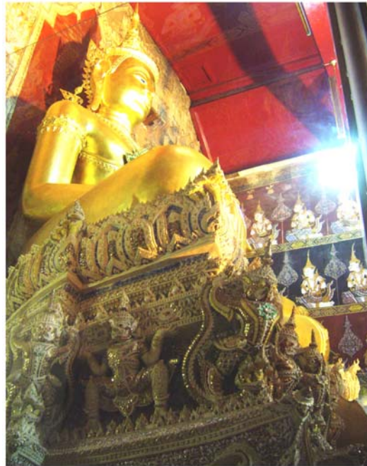
ภาพประกอบ 22 ภาพฐานพระประธานในวิหารหลวง วัดมหาธาตุ จ.เพชรบุรี