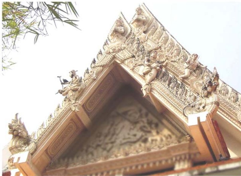
ภาพประกอบ 36 ภาพระยະไถ้ซ่อฟ้านางสาวอัมพร บุญประคอง วัดมหาธาตุ จ.เพชรบุรี