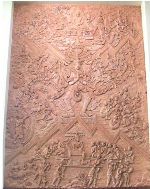
ภาพประกอบ 7 ภาพปูนปั้นนูนต่ำ บริเวณห้องโถง โรงพยาบาลเพชรรัชต์ อ.เมือง จ.เพชรบุรี