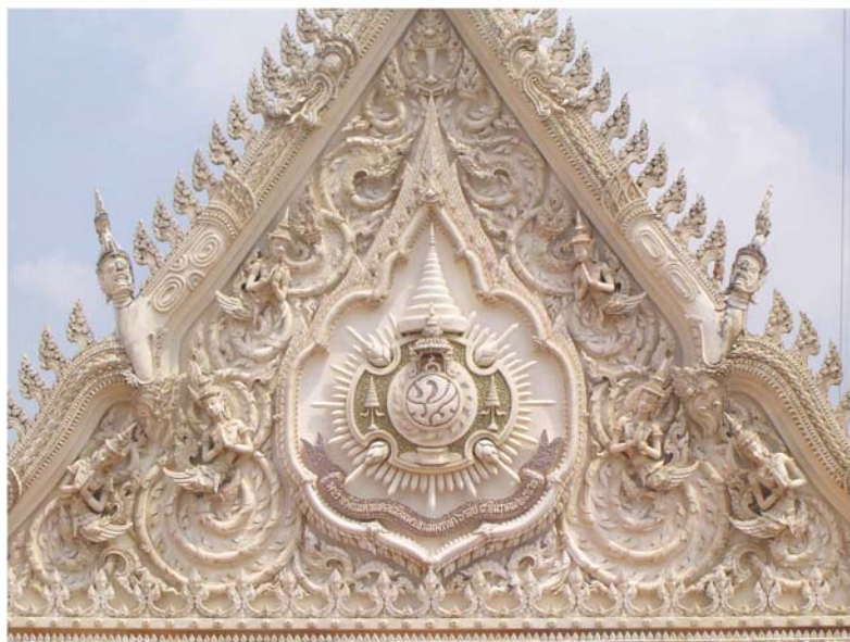
ภาพประกอบ 54 ภาพระยະไกล้หน้าบันวิหารหลวง ด้านทิศตะวันตก วัดมหาธาตุ จ.เพชรบุรี