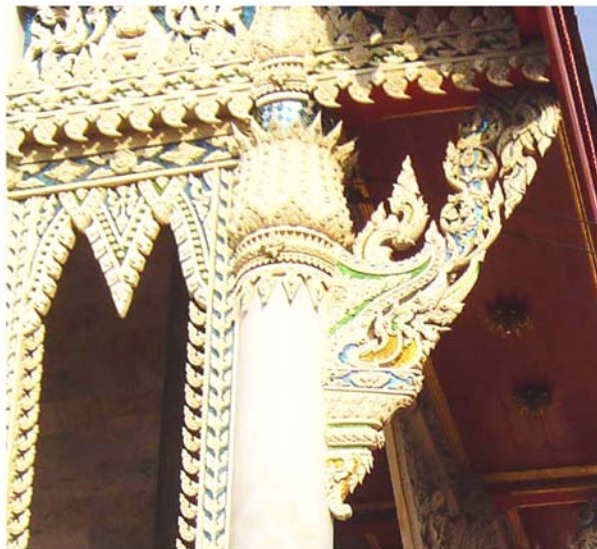
ภาพประกอบ 40 ภาพระยະไถ้คูหารอบพระอุโบสถ วัดสนามพราหมณ์ อ.เมือง จ.เพชรบุรี