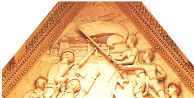
ภาพประกอบ 65 ภาพพระยะใกล้หน้าบันศาลนางสาวอัมพร บุญประคอง วัดมหาธาตุ จ.เพชรบุรี เป็นภาพเหตุการณ์ 14 ตุลาคม