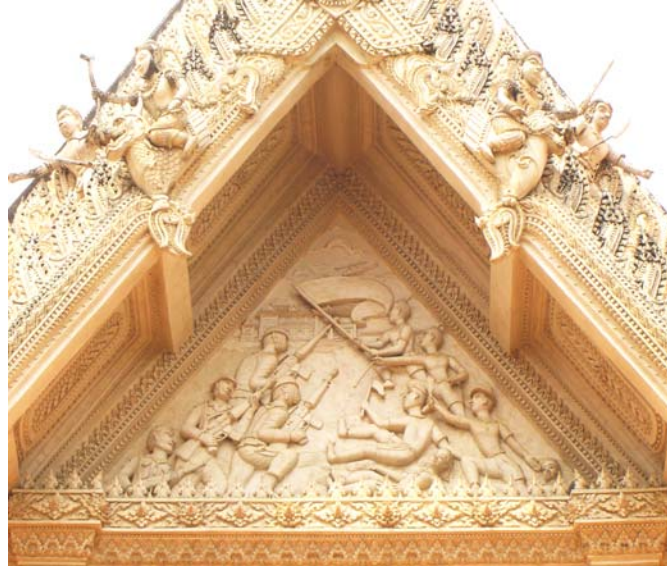
ภาพประกอบ 64 ภาพหน้าบันศาลนางสาวอัมพร บุญประคอง วัดมหาธาตุ จ.เพชรบุรี