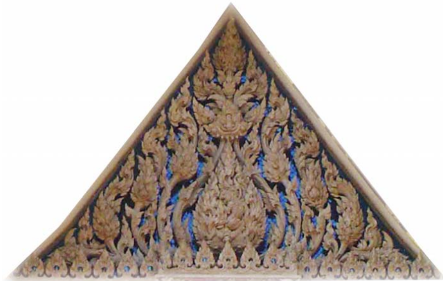
ภาพประกอบ 43 ภาพระยະไถ้หน้าบันวิหารวัดลักษณาราม อ.บ้านแหลม จ.เพชรบุรี