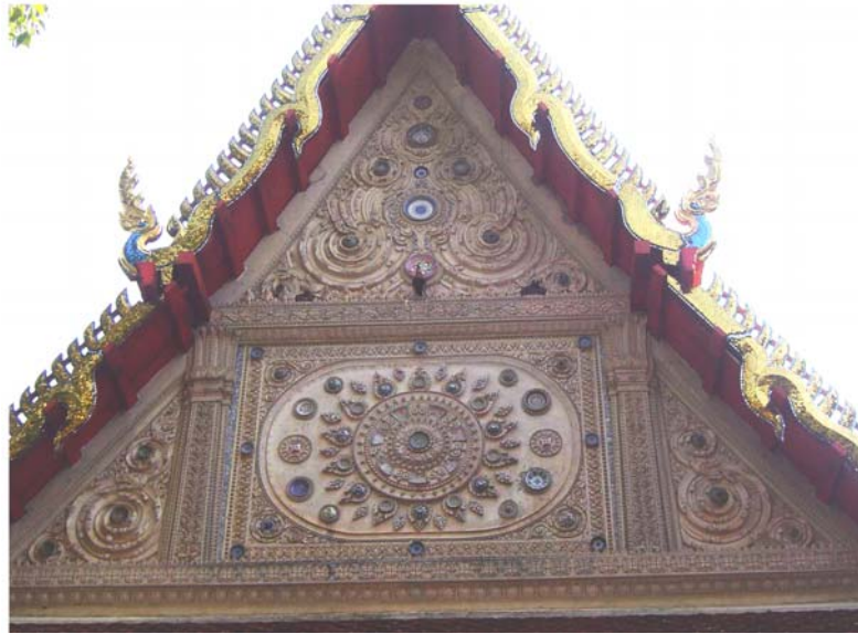
ภาพประกอบ 24 ภาพหน้าบันพระอุโบสถวัดเขายี่สาร อ.อัมพวา จ.สมุทรสงคราม