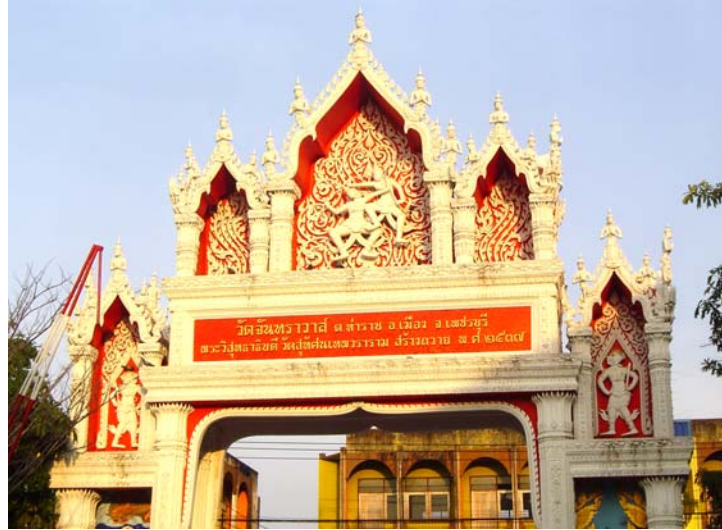
ภาพประกอบ 68 ภาพซุ้มทางเข้าวัดจันทราวาส อ.เมือง จ.เพชรบุรี