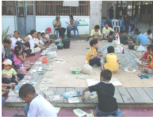
ภาพประกอบ 2 เด็กๆ ฝึกปั้นปูนสดบริเวณลานศิลปวัฒนธรรม เพชรบุรี