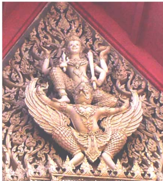
ภาพประกอบ 56 ภาพระยະไกล้หน้าบันพระอุโบสถวัดในกลาง อ.บ้านแหลม จ.เพชรบุรี