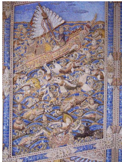
ภาพประกอบ 10 ภาพพระยะใกล้ภาพปูนปั้นพระมหาชนกละในร้านขนมแม่กิมไล้ อ.บ้านลาด จ.เพชรบุรี

ภาพพระมหาชนกละ เป็นภาพปูนปั้นขนาดต่ำประดับด้วยถ้วยชามเบญจรงค์ที่ทำให้เป็นชิ้นเล็ก ๆ ประดับไปตามภาพ ภาพสมบูรณทั้งหมด เป็นภาพที่มีรายละเอียดมาก จัดองค์ประกอบของภาพทั้งหกช่องได้อย่างสวยงามน่าชม นอกจากใช้ถ้วยชามเบญจรงค์แล้ว ยังใช้ช้อนมาประดับในภาพด้วย ตรงส่วนที่เป็นใบเรือ (ถ้วยชามเบญจรงค์ทำขึ้นใหม่ที่เพชรบุรี)