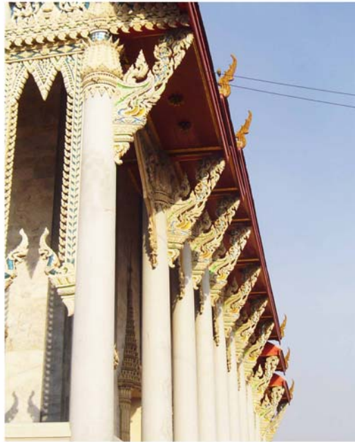
ภาพประกอบ 39 ภาพคูหารอบพระอุโบสถ วัดสนามพราหมณ์ อ.เมือง จ.เพชรบุรี