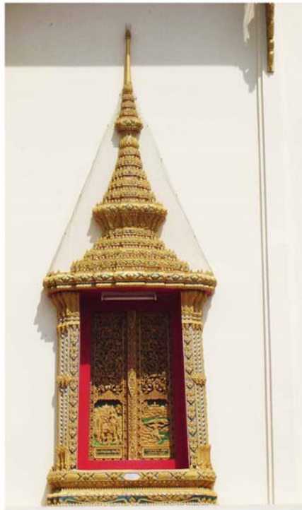
ภาพประกอบ 70 ภาพซุ้มหน้าต่างพระอุโบสถวัดในกลาง อ.บ้านแหลม จ.เพชรบุรี