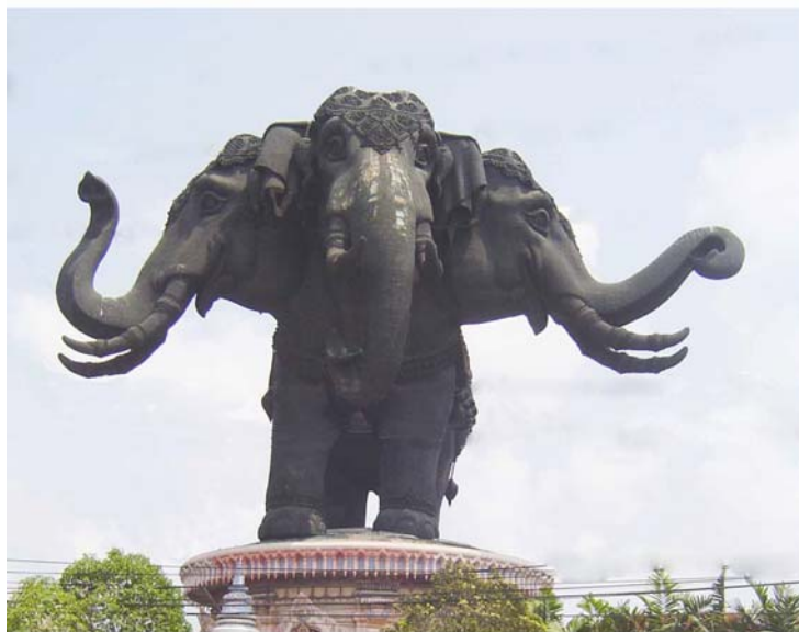
ภาพประกอบ 16 ภาพพิพิธภัณฑ์ช้างเอราวัณ

ช้างเอราวัณเป็นช้างทรงของพระอินทร์ ประติมากรรมลอยตัวโครงสร้างภายนอกใช้แผ่นทองแดงบริสุทธิ์ ความสูงจากพื้นดินถึงยอด 43.60 เมตร สํารวย เอ็มโอบุ๊ ดูแลออกแบบตกแต่งภายในตัวช้าง แบ่งการจัดแสดงออกเป็นสามส่วน โดยใช้แนวคิด คติ ความเชื่อ ของหลักไตรภูมิ ซึ่งประกอบด้วยโลกบาดาล โลกมนุษย์และสวรรค์ ชั้นล่างเป็นชั้นแห่งโลกบาดาลกึ่งกลางใช้สัญลักษณ์รูปปั้นของพญานาค บริเวณรอบๆ เป็นสระอโนดาต มีโขดหินเรียงรายเป็นแนววงกลม