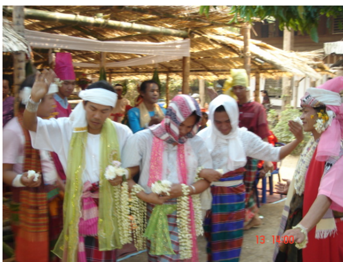
ภาพประกอบ 78 พิธีกรรมพ่อนผีสามตัว

ในพิธีกรรมลูกหลานภายในตระกูลที่ไม่มีหน้าที่เกี่ยวข้องในพิธีกรรม จะเดินแจกดอกไม้หอมต่าง ๆ ให้แก่ญาติและแขกที่มาร่วมในพิธีกรรม ผู้ที่พ่อนเป็นผี สามตัวเมื่อแต่งตัวเรียบร้อยแล้วก็จะเริ่มพ่อนออกมาจากผามพิธีกรรม โดยลักษณะจะยืนเรียงต่อกัน 3 คน เป็นแถวหน้ากระดาน ผีคนกลางจะใช้แขนทั้ง 2 ข้าง คล้องแขนผีคนที่อยู่ทางซ้ายและทางขวาเอาไว้ ผู้ที่เป็นผีทางซ้ายและทางขวาจะใช้มือข้างที่เหลืออยู่พ่อนรำเดินไปรอบต้นแก้วที่อยู่หน้าผามพิธี 3 รอบ