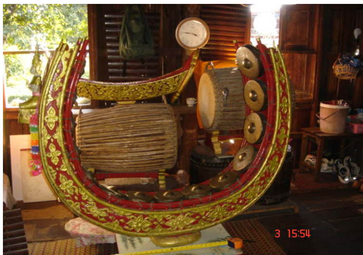
ภาพประกอบ 13 ซ็องวงใหญ่