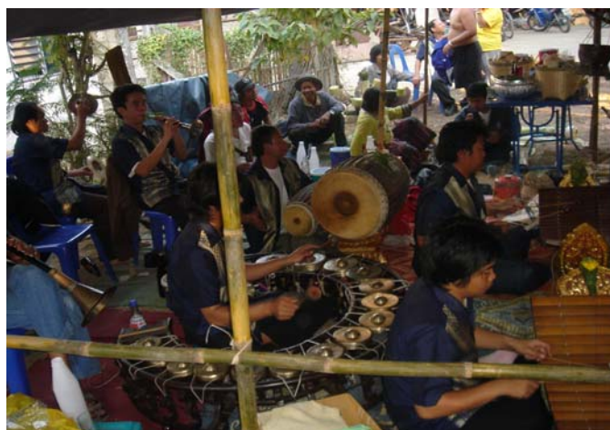
ภาพประกอบ 1 วงป่าดเมืองทั่วไป

วงปี่พาทย์ซึ่งชาวล้านนาเรียกว่า “ป่าดซ้อง” หรือ “ป่าด” ตามภาษาถิ่น วงป่าดซ้องนี้ปัจจุบันมีบทบาทในวันพ่อนผีมดและพ่อนผีเม็ง ของคนทรงซึ่งกระทำเดือนเก้าเหนือ (ระหว่างเดือนพฤษภาคมถึงเดือนมิถุนายน) เครื่องดนตรีในวงป่าดซ้องของภาคเหนือประกอบด้วยระนาด ซ้องวง และแนสองขนาด คือ “แนหลวง” กับ “แนหน้อย” ซึ่งเป็นเครื่องลมประเภทเป่าลิ้นคู่ แนทั้งสองมีรูปร่างลักษณะเหมือนกัน ต่างกันเฉพาะขนาด ในช่วงทำพิธีให้วักครูของคนทรง วงป่าดซ้องจะใช้เครื่องดนตรีตามประเพณีดั้งเดิมที่ระบุไว้ข้างต้น มาบรรเลงเพลงประกอบพิธีกรรม (ประสิทธิ์ เลี้ยวสิริพงศ์. 2542. ดนตรีพื้นบ้านไทยภาคเหนือ. หน้า 28.)