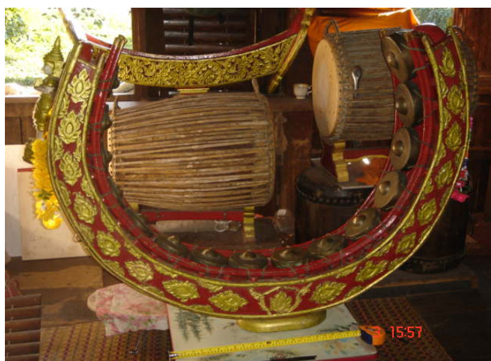
ภาพประกอบ 14 ซ็องวงเล็ก

ซ็องวงเล็กของวงปาดเมืองคณะวัดเขียงยืน จะมีลักษณะเช่นเดียวกับซ็องวงใหญ่ คือมีลักษณะคล้ายกับซ็องมอญวงเล็กของภาคกลาง โขนของซ็องวงเล็กในวงปาดเมืองคณะวัดเขียงยืนจะแกะเป็นรูปเทวดายืนพนมมือ ลูกซ็องทั้งหมดจะมี 15 ลูก ลูกซ็องลูกทวนจะมีเส้นผ่าศูนย์กลางประมาณ 14 เซนติเมตร ลูกซ็องลูกยอดจะมีเส้นผ่าศูนย์กลางประมาณ 10 เซนติเมตร ลักษณะของลูกซ็องจะเป็นซ็องตีซึ่งตั้งขึ้นพร้อมกับซ็องวงใหญ่ของวงปาดเมือง วัสดุที่ใช้ตีขึ้นเป็นลูกซ็องตีขึ้นจาก “ทองแข” หรือ “สำริด” เช่นเดียวกับซ็องวงใหญ่ ฉัตรซ็องจะมีลักษณะสั้นและแคบกว่าฉัตรซ็องมอญวงเล็กของภาคกลางเล็กน้อย ลูกซ็องจะมีเสียงเรียงกับเช่นเดียวกับซ็องวงเล็กใน ภาคกลาง