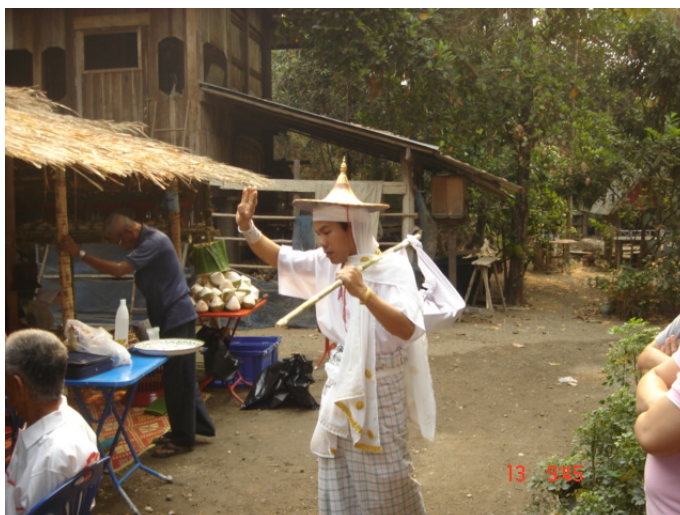
ภาพประกอบ 63 การเชิญถ้วยคู่

เมื่อนำถ้วยคู่ลงมาแล้วเก็บซึ่งเชิญถ้วยคู่ลงมา นั้น ก็จะแบกถ้วยคู่ไว้บนบ่าแล้วเดินไปฟ้อนรอบต้นแก้ว 3 รอบ ส่วนใต้ต้นแก้วที่อยู่หน้าผามพิธีกรรมนั้นก็มีหม้อน้ำดินเผาใส่น้ำไว้จนเต็มตั้งอยู่ 2 ใบ เมื่อเก็บฟ้อนครบ 3 รอบแล้วลูกหลานภายในตระกูลจะนำเอาไม้กระดาน 1 แผ่นมีความยาวประมาณ 1 เมตร นำมาพาดเชื่อมต่อระหว่างประตูผามจนมาถึงบริเวณใต้ต้นแก้วไม้กระดานนี้จะเรียกว่า “ซัว” หรือสะพานนั่นเอง นำเอามาวางไว้เพื่อให้ผีปู่ย่าขึ้นไปเหยียบบนซัวนั้นและให้ลูกหลานภายในตระกูลได้ต้อนรับและแสดงความกตัญญูต่อผีปู่ย่า โดยการตักน้ำในหม้อน้ำดินเผาใบหนึ่งล้างเท้าให้กับผีปู่ย่า เมื่อลูกหลานล้างเท้าให้กับผีปู่ย่าแล้วผีปู่ย่าที่เข้าทรงเก็บก็จะตักน้ำในหม้อน้ำดินเผาอีกใบหนึ่งล้างมือให้ลูกหลานพร้อมกับให้พรให้ลูกหลานอยู่เย็นเป็นสุข