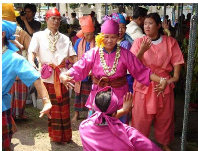
ภาพประกอบ 32 การแสดงการพอนผี

การที่จะแยกแยะประเพณีการพอนผีมดออกจากประเพณีการพอนผีเม็งได้นั้น จากคำบอกเล่าที่สืบต่อกันมา มีข้อแตกต่างระหว่างการพอนผีมดและผีเม็งที่สังเกตได้โดยง่ายคือ การพอนผีเม็งนั้นเป็นการพอนผีของตระกูลนักรบ จึงมีพิธีกรรมค่อนข้างเป็นขั้นตอนที่ละเอียดและยุ่งยากมากกว่าการพอนผีมด