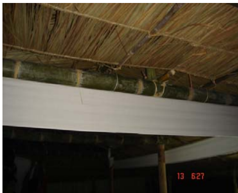
ภาพประกอบ 44 ผ้าเวียนผาม

นอกจากจะผูกผ้าเทินหิ้งแล้วจะต้องมีผ้าอีกผืนหนึ่งผูกไว้เหนือช่อกลางผามพิธีกรรมมีลักษณะเป็นสี่เหลี่ยมจัตุรัสเช่นเดียวกับผ้าเทินหิ้งแต่มีขนาดใหญ่กว่า ตำแหน่งที่จะผูกผ้าผืนนี้คือจะผูกไว้ด้านบนเหนือช่อกลางผามพิธีกรรมและจะเรียกผ้าผืนนี้ว่า “ผ้าเทินกลาง”