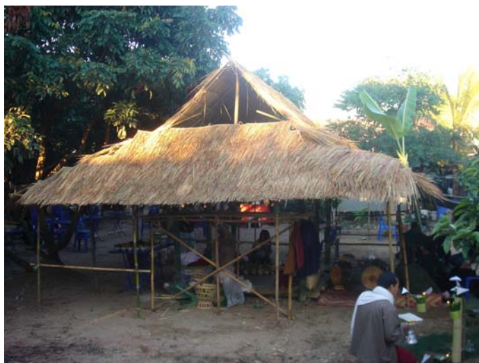
ภาพประกอบ 33 ผามพิธีกรรมที่ใช้ในการฟ้อนผีเม็ง

การปลูกผาม หรือประรำพิธีก็จะแตกต่างกันออกไป ผามของผีเม็งนั้นจะถูกสร้างให้มีหลังคาเป็นทรงแหลมคล้ายกระโจม แขนผางพื้นที่จะเป็นสี่เหลี่ยมจัตุรัสและจะเรียกผามแบบนี้ว่า “ผามจ้อง” ส่วนผามของผีมดนั้นจะถูกสร้างแบบเรียบง่าย โดยจะตั้งเสาขึ้นสี่ต้นทำเป็นมุมรูปสี่เหลี่ยมจัตุรัสแล้วใช้ใบตองตึงหรือทางมะพร้าววางทับกันด้านบนให้เรียบแบนเสมอกันทำเป็นหลังคา และจะเรียกผามแบบนี้ว่า “ผามเปียง”