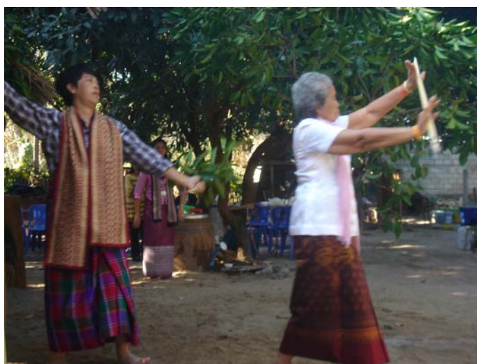
ภาพประกอบ 65 การพ่อนอาวุธของผีปู่ย่า

หลังจากแต่งตัวให้เก้าผีเรียบร้อยแล้ว เก้าผีจะทำการห้อยผ้าจ้องที่อยู่ภายในผามพิธีกรรมเพื่อแสดงให้เห็นว่าผีปู่ย่าได้ลงทรงอย่างสมบูรณ์แล้ว เก้าผีที่ทรงผีปู่ย่าอยู่นั้นก็จะเดินออกไปพ่อนรอบต้นแก้วที่อยู่หน้าผามพิธีกรรมและลูกหลานภายในตระกูลจะทยอยส่งอาวุธทั้ง 4 ชนิดให้ผีปู่ย่า ผีปู่ย่าก็จะรับอาวุธแต่ละอย่างมาพ่อนโดยเริ่มจาก ดาบจริงพ่อนรอบต้นแก้ว 1 รอบ ดาบไม้ ไม้พลอง และใบดอกแก้วอีกอย่างละ 1 รอบ เมื่อเก้าผีพ่อนอาวุธครบทั้ง 4 อย่างแล้วก็จะส่งคืนอาวุธทั้งหมดให้ลูกหลาน จากนั้นก็จะพ่อนกลับเข้าไปในผามพิธีกรรมเช่นเดิม