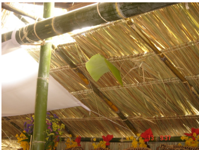
ภาพประกอบ 67 พัดใบตอง

หลังจากพิธีกรรมกุมบาตฺรเสร็จสิ้นลงเรียบร้อยแล้ววงป่าดเมืองจะต้องระยะเวลาให้เหลือพอสำหรับพิธีการฟ้อนด้วยและควรจะให้การฟ้อนด้วยเรียบร้อยภายในเวลา 9.00 น. พิธีกรรมการฟ้อนด้วยคือการนำเอาเครื่องเช่นที่จัดใส่ถ้วยเล็ก ๆ อยู่บนหิ้งผีปู่ย่านำลงมาฟ้อนรอบต้นแก้วที่อยู่หน้าผามพิธีกรรม โดยจะใช้ลูกหลานภายในตระกูลและแขกที่มาร่วมในงานหลาย ๆ คนนำถ้วยของเช่นมาถือไว้ในมือแล้วทำการฟ้อนรอบต้นแก้ว วงป่าดเมืองก็จะเป็นผู้กำหนดเวลาในการฟ้อนด้วยอีกเช่นกัน และจะกำหนดการฟ้อนเป็นช่วง ๆ เรียกว่า “ยก” โดยมากแล้วใน 1 ยกของการฟ้อนจะใช้เพลงไม่เกิน 3 เพลง และทุกครั้งที่ยก 1 ยกก็จะลงท้ายด้วยการฟ้อนอาวุธ 4 ชนิดที่ได้กล่าวไว้แล้วข้างต้นทุกยกไป