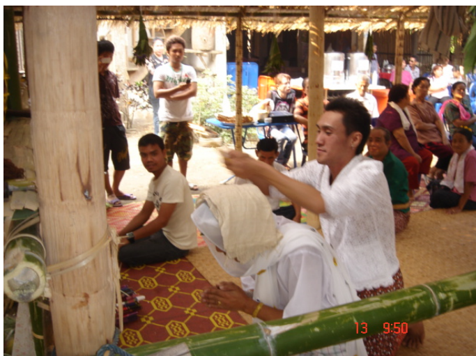
ภาพประกอบ 64 การเวียนเทียนรอบศีรชะเก้าผี

หลังจากแต่งตัวให้เก้าผีเรียบร้อยแล้ว เก้าผีจะทำการห้อยผ้าจ้องที่อยู่ภายในผามพิธีกรรมเพื่อแสดงให้เห็นว่าผีปู่ย่าได้ลงทรงอย่างสมบูรณ์แล้ว เก้าผีที่ทรงผีปู่ย่าอยู่นั้นก็จะเดินออกไปพ่อนรอบต้นแก้วที่อยู่หน้าผามพิธีกรรมและลูกหลานภายในตระกูลจะทยอยส่งอาวุธทั้ง 4 ชนิดให้ผีปู่ย่า ผีปู่ย่าก็จะรับอาวุธแต่ละอย่างมาพ่อนโดยเริ่มจาก ดาบจริงพ่อนรอบต้นแก้ว 1 รอบ ดาบไม้ ไม้พลอง และใบดอกแก้วอีกอย่างละ 1 รอบ เมื่อเก้าผีพ่อนอาวุธครบทั้ง 4 อย่างแล้วก็จะส่งคืนอาวุธทั้งหมดให้ลูกหลาน จากนั้นก็จะพ่อนกลับเข้าไปในผามพิธีกรรมเช่นเดิม