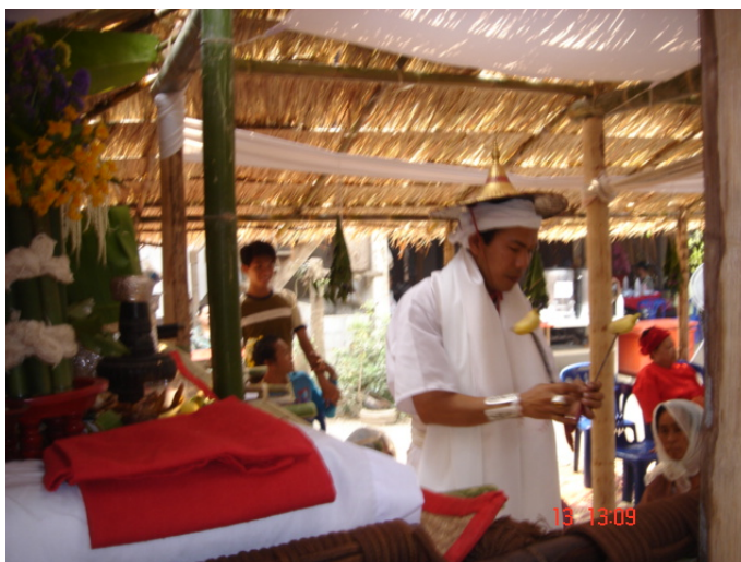
ภาพประกอบ 74 การพ้อนฝีกุลา

กุลาที่จะยื่นมีดนั้นให้กับลูกหลานภายในตระกูลที่นั่งล้อมวงกันอยู่เพื่อทำอาการกริยาตมสิ่งของที่ติดอยู่บนปลายมีดนั้นเช่นกัน ฝีกุลาจะยื่นของเช่นนั้นให้กับผู้ที่มีอายุโสมมากที่สุด ในตระกูลก่อน ไล่เรียงอายุจนไปถึงคนที่มีอายุน้อยที่สุด เมื่อฝีกุลายื่นของเช่นนั้นไปในทางผู้ใดแล้วผู้นั้นจะต้องเอ่ยคำว่า “หอม” พร้อมกับทำอาการสูดตมไปด้วย ทำเช่นนั้นจนครบตามจำนวนของลูกหลานภายในตระกูล และจะต้องนำของเช่นนั้นกลับวางคืนที่กะละมังหลังจากให้ทุกคนภายในผามพิธีกรรม สูดตมเรียบร้อยแล้ว