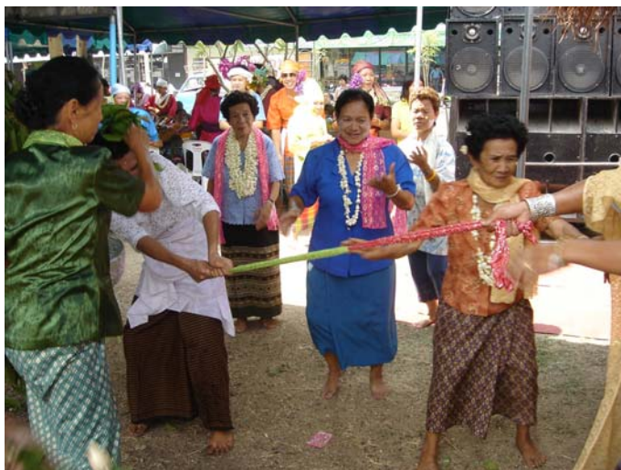
ภาพประกอบ 82 การเล่นชนไก่

เจ้าบ้านเป็นผู้ชนะ ไก่บ้านอื่นที่มาทำชิงจะต้องยอมแพ้โดยเป็นมารยาทที่รู้จักกัน หลังจากที่อยู่แพ้ชนะกันแล้วไก่ที่เป็นฝ่ายชนะจะเข้าไปในผามพิธีกรรม ฝัปปูย่าที่นั่งรออยู่ในผามพิธีกรรมก็จะผูกข้อมือกับเจ้าของไก่ชนที่ชนะพร้อมกับมอบรางวัลเพื่อรับไก่ที่ถือว่าเป็นไก่มงคลนั้นเอาไว้