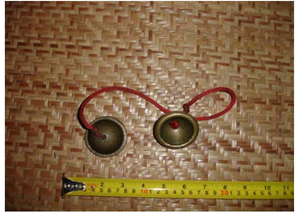
ภาพประกอบ 23 ฉิ่ง