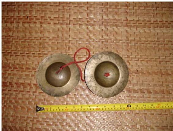
ภาพประกอบ 24 สว่าน้อย หรือ ฉาบเล็ก

สว่า เป็นภาษาล้านนาซึ่งใช้เรียก “ฉาบ” ฉาบที่ใช้ในวงปาดเมืองจะมีอยู่ 3 ขนาด คือ สว่าน้อย สว่ากลาง สว่าหลวง เป็นเครื่องดนตรีที่ช่วยเพิ่มสีสันในการบรรเลง ทำให้ทำนองเพลงแต่ละเพลงในการประกอบพิธีกรรมฟังออกมาแล้วมีความสว่างตามบทเพลงหรือถ้าเพลงใดมีความสนุกสนานก็จะช่วยทำให้เพลงนั้นสนุกสนานมากยิ่งขึ้น