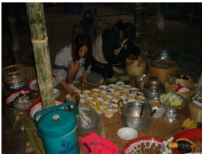
ภาพประกอบ 38 การดาคร้ว

วันที่ 3 การเตรียมพิธีกรรมการพ่อนผีมืด ผีเม็งเรียกว่า “วันดา” การเตรียมการจะเริ่มตั้งแต่เวลา 6.00 น. ของเช้าวันดา ลูกหลานฝ่ายชายภายในตระกูลจะเริ่มช่วยกันปลูกผามพิธีกรรม โดยเริ่มจากการขุดหลุมฝังเสาไม้หมากก่อนเป็นอันดับแรก จากนั้นก็จะช่วยกันขึ้นโครงวางซื่อผามและมุงหลังคาจนแล้วเสร็จ จึงพักรับประทานอาหารกลางวัน