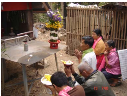
ภาพประกอบ 50 การเชิญผีปู่ย่า

หลังจากที่วงป้าดเมืองบรรเลงเพลงไหมโรงจบลง วงป้าดก็จะบรรเลงเพลงที่ 2 ต่อทันที เพลงที่บรรเลงเป็นเพลงที่ 2 นั้นคือ “เพลงฉัตร” ซึ่งในขณะที่วงป้าดเมืองบรรเลงเพลงฉัตรอยู่นั้น หญิงอาวุโสภายในตระกูล หรือ “เก๊าผี” จะเดินนำลูกหลานภายในตระกูลทั้งชายและหญิงขึ้นไปเชิญผีปู่ย่าลงมาจากหิ้งที่อยู่ภายในห้องนอนของเก๊าผีเอง ผีปู่ย่าที่เชิญลงมานี้จะถูกแทนด้วยกระบอกไม้ไผ่จำนวน 12 กระบอกที่เรียกว่า “บอกเหม็ง” โดยจะมัดรวมกันไว้ทั้ง 12 กระบอกด้วยด้ายสายสิญจน์ บอกเหม็งนี้จะถูกตกแต่งอย่างสวยงามด้วยดอกไม้หลายชนิด