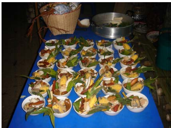
ภาพประกอบ 68 ถ้วยพ็อน