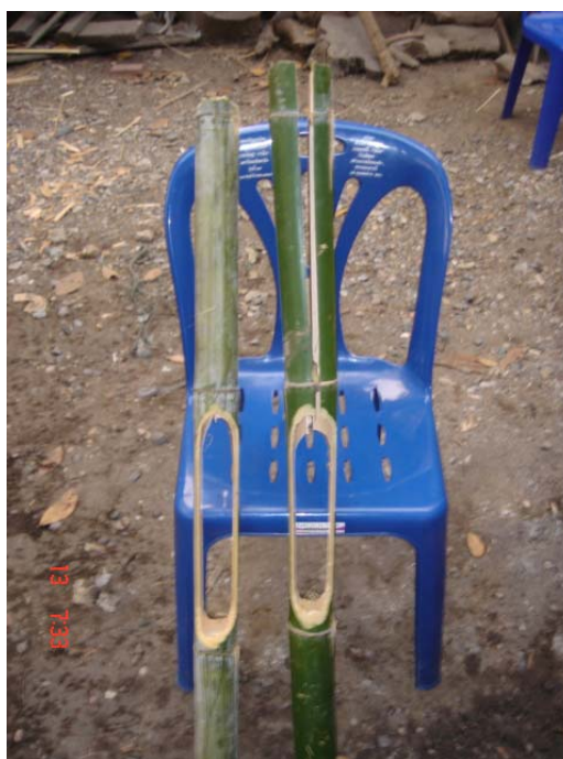
ภาพประกอบ 27 ไม้ขนาบ

ไม้ขนาบเป็นเครื่องดนตรีที่ใช้ตบให้จังหวะแกว่งป่าด ซึ่งจะตบตามจังหวะเสียง “ฉับ” ของฉิ่ง ทำมาจากไม้ไผ่ยาวประมาณ 76 เซนติเมตร ฝาดครึ่งแต่ไม่ให้ไม้ไผ่ขาดออกจากกัน ไม้ไผ่ที่นำมาใช้จะเป็นไม้ไผ่สดหรือไม้ไผ่แห้งก็ได้