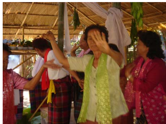
ภาพประกอบ 69 การพ็อนถ้วย

เมื่อการพ็อนถ้วยเสร็จเรียบร้อยแล้ว ถ้าการพ็อนถ้วยเสร็จเร็วและยังเหลือเวลาในภาคเช้านั้นก็จะมี การพ็อนคั่นระหว่างพิธีกรรมเพื่อความบันเทิง ทั้งผีสายตระกูลเดียวกันและผีที่เป็นแขกมาร่วมในงาน การพ็อนนี้จะเรียกว่า “การพ็อนปล่อย” การพ็อนปล่อยนี้จะไม่มีการตั้งโต๊ะอะไรมากนัก ผู้ที่เป็นร่างทรงหรือผีที่เป็นแขกมาร่วมในงานซึ่งอาจจะเป็นตระกูลพ็อนผีตระกูลอื่นจะร่วมกันพ็อนอย่างสนุกสนาน เมื่อถึงช่วงเวลาที่เรียกว่าพ็อนปล่อยนี้ ร่างทรงที่มาร่วมในงานก็จะเดินเข้าไปโหนผ้าจ้องที่อยู่ใต้วามพิธีกรรม เมื่อโหนผ้าจ้องแล้วร่างทรงต่าง ๆ ก็จะออกมาช่วยกันพ็อนรอบต้นแก้วหน้าวามพิธีกรรมอย่างสนุกสนาน มีการพ็อนรำหยอกล้อเล่นกัน ช่วงเวลาพ็อนปล่อยนี้จะขึ้นอยู่กับเจ้าภาพหรือลูกหลานที่เป็นหัวหน้าครอบครัวในตระกูลนั้นโดยจะกำกับดูแลให้เวลาเป็นไปในช่วงเวลาที่เหมาะสม เมื่อพิธีกรรมแต่ละช่วงจบลงแต่เวลายังพอมีก็จะมีช่วงเวลาพ็อนปล่อยนี้เพื่อให้ร่างทรงที่มาร่วมในงานได้สนุกสนานเพิ่มขึ้นหลายช่วง และการพ็อนปล่อยนี้จะจบลงด้วยการพ็อนอาวุธ 4 ชนิดของแก้วผีหรือลูกหลานภายในตระกูล เช่นเดียวกับพิธีกรรมการพ็อนในช่วงพิธีกรรมอื่น ๆ