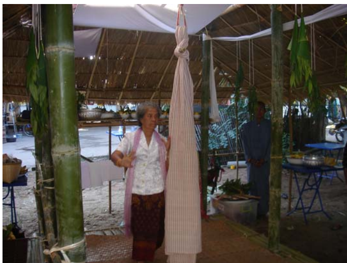
ภาพประกอบ 55 การฟ้อนของผีปู่ย่า

การฟ้อนผีปู่ย่าเก้าผีจะต้องนำอาวุธทั้ง 4 ประเภท ที่ออกไปฟ้อนเพื่อเป็นสัญญาณในการลงจับแต่ละยกได้แก่ ตามจริง 1 คู่ ดาบไม้ไผ่ 1 คู่ ไม้พลองขนาด 1 เมตร 1 คู่ และกิ่งของต้นดอกแก้ว มัดรวมกัน 1 คู่ เมื่อเก้าผีนำเอาอาวุธ 4 ประเภทนี้ออกมาฟ้อนรอบต้นแก้วประมาณ 3 - 4 รอบ แล้ว และฟ้อนกลับเข้าไปในผามพิธีกรรมอีกครั้ง วงป่าดเมืองจะบรรเลงทอเพลงลงจับให้ถือว่าเป็นการเสร็จสิ้นการฟ้อนผีจับ 1 ยก