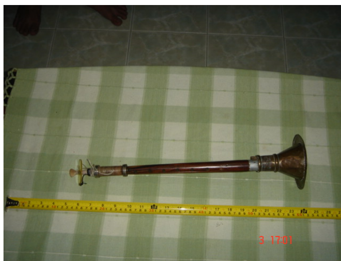
ภาพประกอบ 18 แนน้อย

แนน้อย เป็นเครื่องดนตรีที่เป็นเครื่องนำอีกชิ้นหนึ่งในวงปี่พาทย์ เป็นเครื่องเป่าประเภท ลิ้นคู่ กิ่งขึ้นจากไม้เนื้อแข็ง เช่น ไม้ชิงชัน ไม้ประดู่ ไม้พยุง กิ่งให้มีขนาดความยาวไม่เกิน 25 เซนติเมตร ปลายด้านหนึ่งโต อีกด้านหนึ่งมีขนาดเล็ก ด้านที่โตกว่าจะมีโลหะเป็นทรงกรวยทำขึ้นจาก ทองเหลืองครอบอยู่เป็นลำโพง ด้านที่เล็กจะมีรูเสียบท่อโลหะกลมยาวซึ่งมีลิ้นที่ทำจากใบตาลสองชั้น ประกบอยู่ และผูกด้วยเชือกจนแน่น ท่อโลหะนี้จะเรียกว่า “หลิ” บนเลขของแนน้อยจะเจาะรูปิดเปิด เสียงทั้งหมด 6 หรือ 7 รู แล้วแต่ท้องถิ่นที่ใช้ ถ้าเป็นแถบจังหวัดเชียงใหม่ จะเจาะรูปิดเปิดเสียงนี้ 7 รู ถ้าเป็นแถบจังหวัดลำปาง จังหวัดน่าน จะเจาะรูแนน้อยนี้ทั้งหมด 6 รู เป็นต้น