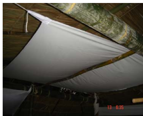
ภาพประกอบ 46 ผ้าเทินกลาง