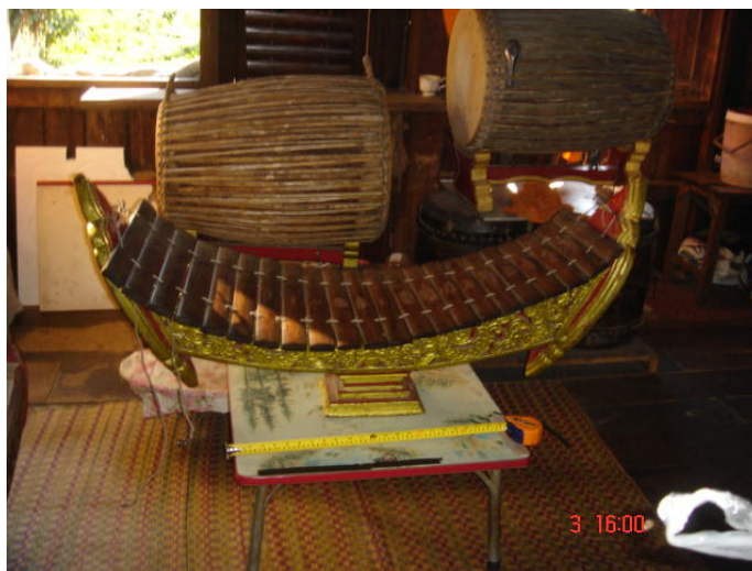
ภาพประกอบ 15 ปาดเอก หรือ ระนาดเอก

ปาดเอก หรือ ระนาดเอก เป็นเครื่องดนตรีที่เป็นเครื่องนำในวงปาดเมือง ทำมาจากแก่นไม้เนื้อแข็ง เช่น ไม้มะค่า ไม้ชิงชัน หรือที่ชาวล้านนาจะเรียกว่า “ไม้เกร็ด” เหล่านี้มีความหนาประมาณ 1.5 เซนติเมตร ลูกต้นหรือลูกทวนของปาดเอกจะมีขนาดความยาวประมาณ 40 เซนติเมตรกว้างประมาณ 5 เซนติเมตร ลูกยอดจะมีขนาดยาวประมาณ 30 เซนติเมตร เหล่าเป็นรูปสี่เหลี่ยมผืนผ้าตามยาว ลูกระนาดจะมีจำนวน 22 ลูก แต่ละลูกจะถูกตัดให้มีความยาวลดหลั่นกันลงไปและเป็นการการตั้งเสียงระนาดแต่ละลูกโดยไม่ใช่ตะกั่วถ่วงเสียง เจาะรูหัวท้ายที่ลูกระนาดแต่ละลูกแล้วร้อยด้วยเชือกร้อยเรียงต่อกันเป็นผืนแขวนไว้บนรางไม้ซึ่งประกอบขึ้นคล้ายรูป เรือลำบ้านมีฐานรอง ปาดเอกหรือระนาดเอกนี้สำหรับวงปาดเมืองแล้วนั้นจะใช้ไม้แข็งตัวอย่างเดียวเนื่องจากต้องการเสียงที่ดังมาก