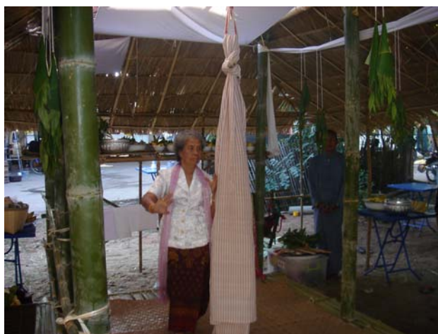
ภาพประกอบ 29 ผีปู่ย่า

ผีมดและผีเม็งเป็นผีประจำตระกูลที่จัดอยู่ในเครือผีบรรพบุรุษหรือผีปู่ย่า ซึ่งมักจะพบว่ามีการนับถือกันอยู่ในเขตชุมชนเมืองเป็นส่วนใหญ่ เนื่องจากเป็นผีของคนในเมืองที่สืบเชื้อสายมาจากตระกูลเจ้านายและขุนนางในล้านนาสมัยก่อน ตระกูลของผีมดผีเม็งมักสืบเชื้อสายไปได้ไกลและผีปู่ย่าของตระกูลผีมดผีเม็งจะมีชื่อเรียกขานเป็นชื่อเจ้านายที่อยู่ในตำนาน ซึ่งจะแตกต่างจากผีปู่ย่าโดยทั่วไปที่ไม่มีชื่อเรียกขานเฉพาะ ตระกูลที่นับถือผีมดผีเม็งทุกวันนี้มีเหลืออยู่ไม่มากนัก ส่วนใหญ่มักจะพบอยู่ในแถบจังหวัดเชียงใหม่ ลำพูน และลำปาง แต่สำหรับจังหวัดอื่นๆที่ใกล้เคียงแทบจะไม่ปรากฏเลย