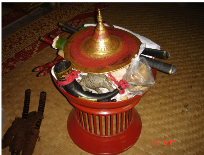
ภาพประกอบ 76 กุ๊บละแอบและของใช้ภายในพิธีกรรมฟ้อนผี

ผีเจ้าเซียงใหม่จะแต่งตัวจากในผามพิธีกรรมเมื่อเริ่มพิธีในขั้นตอนนี้วงป่าดเมืองจะเริ่มบรรเลงเพลงผีเจ้าเซียงใหม่ก็จะออกมาจากผามพิธีกรรมเพื่อทำการฟ้อนรอบต้นแก้วที่อยู่หน้าผามพิธีกรรม เพลงที่ใช้บรรเลงประกอบพิธีกรรมช่วงนี้คือเพลงเหยงหลวง เมื่อผีเจ้าเซียงใหม่ออกมาแล้วก็จะเดินไปฟ้อนรอบต้นแก้วหน้าผามพิธีกรรม 3 รอบ ผู้ที่เป็นแม่ตั้งหรือเจ้าพิธีจะเตรียมอาวุธ 4 ชนิดไว้ให้ หลังจากผีเจ้าเซียงใหม่ฟ้อนรอบต้นแก้วครบ 3 รอบแล้ว แม่ตั้งก็จะทยอยยื่นอาวุธทั้ง 4 ให้กับผีเจ้าเซียงใหม่ที่ละชนิด เมื่อผีเจ้าเซียงใหม่รับอาวุธมาแล้วก็จะนำกลับไปฟ้อนรอบต้นแก้วอีกครั้งหนึ่ง ฟ้อนเช่นนี้จนครบอาวุธทุกชนิด และถือว่าเป็นการเสร็จสิ้นพิธีกรรมการฟ้อนผีเจ้าเซียงใหม่