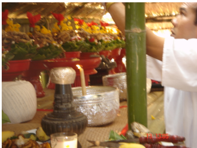
ภาพประกอบ 72 การบูชาเทียน

เมื่อนำถ้วยปากปั้นครอบลงไปที่สูงเรียบร้อยแล้ว วงป่าดเมืองจะเปลี่ยนเพลงให้มีจังหวะเร็วขึ้น คือเพลง “ผีมดห้อยผ้า” แก้วผีและลูกหลานในตระกูลจะลุกขึ้นฟ้อนรำ ลูกหลานในตระกูลบางคนจะถูกวิญญาณผู้ล่วงลับไปแล้วในตระกูลเข้าทรงในตอนนั้น การฟ้อนนี้จะใช้เวลาในการฟ้อนประมาณ 2-3 เพลง แล้วแต่เวลาจะมีมากพอหรือไม่ทั้งนี้ขึ้นอยู่กับวงป่าดเมืองเป็นผู้กำหนดเพลงและเวลาด้วย เมื่อวงป่าดเมืองเห็นสมควรแก่เวลาในช่วงนั้นแล้วก็จะให้สัญญาณโดยการทอดเพลงลงจบ แม่ตั้งจะยื่นอาวุธทั้ง 4 อย่างให้แก้วผีเพื่อทำการฟ้อน หลังจากฟ้อนอาวุธทั้ง 4 อย่างครบแล้วก็จะถือว่าพิธีการบูชาเทียนเสร็จสิ้นลง