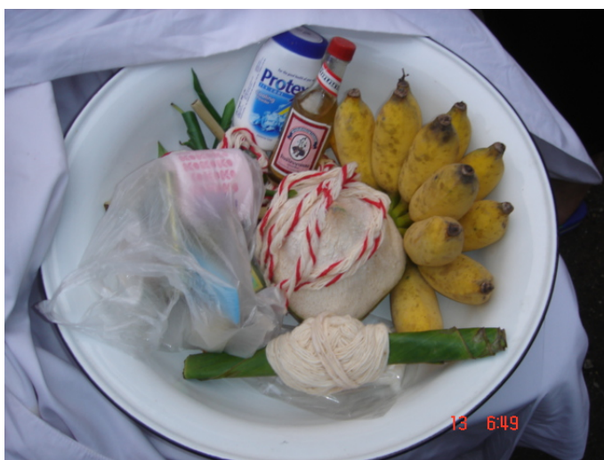
ภาพประกอบ 62 ถ้วยคู่

เมื่อใส่ของต่าง ๆ เหล่านี้ลงไปในกะละมังนั้นแล้ว กะละมังจะถูกห่อด้วยผ้าขาวผืนใหญ่ โดยผ้าขาวนั้นจะต้องเหลือชายไว้ให้ยาวเพื่อที่จะได้มัดเป็นหู คล้ายกับไท่ไส่ของในภาคกลาง พอผูกผ้าขาวเป็นหูแล้วจึงใช้ไม้ไผ่ยาวประมาณ 1.20 เมตร สอดไปที่หูผ้าขาวนั้น ไม้ไผ่นี้จะเป็นคานสำหรับแบกกะละมังนั้น