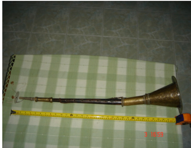
ภาพประกอบ 19 แนนหลวง