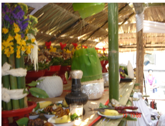
ภาพประกอบ 73 เทียนที่ถูกถ้วยปากปั้นครอบไว้

เมื่อนำถ้วยปากปั้นครอบลงไปที่สูงเรียบร้อยแล้ว วงป่าดเมืองจะเปลี่ยนเพลงให้มีจังหวะเร็วขึ้น คือเพลง “ผีมดห้อยผ้า” แก้วผีและลูกหลานในตระกูลจะลุกขึ้นฟ้อนรำ ลูกหลานในตระกูลบางคนจะถูกวิญญาณผู้ล่วงลับไปแล้วในตระกูลเข้าทรงในตอนนั้น การฟ้อนนี้จะใช้เวลาในการฟ้อนประมาณ 2-3 เพลง แล้วแต่เวลาจะมีมากพอหรือไม่ทั้งนี้ขึ้นอยู่กับวงป่าดเมืองเป็นผู้กำหนดเพลงและเวลาด้วย เมื่อวงป่าดเมืองเห็นสมควรแก่เวลาในช่วงนั้นแล้วก็จะให้สัญญาณโดยการทอดเพลงลงจบ แม่ตั้งจะยื่นอาวุธทั้ง 4 อย่างให้แก้วผีเพื่อทำการฟ้อน หลังจากฟ้อนอาวุธทั้ง 4 อย่างครบแล้วก็จะถือว่าพิธีการบูชาเทียนเสร็จสิ้นลง