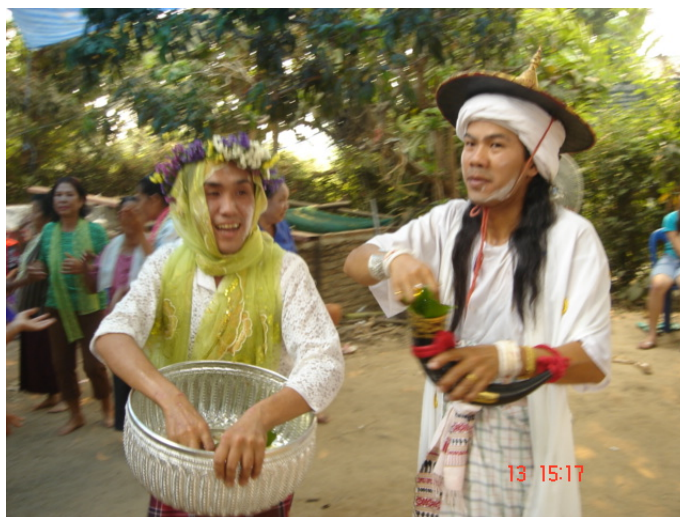
ภาพประกอบ 81 การเล่นน้ำปีใหม่หรือการฟ้อนผีป่าวผีสาว

การปล่อยในช่วงบ่ายนี้วงป่าดเมืองจะกำหนดเวลาให้อยู่ภายในเวลาไม่เกิน 16.00 น. จากเวลา 16.00 น. นี้ พิธีกรรมต่อจากการฟ้อนปล่อยจะเป็นพิธีการเล่นน้ำปีใหม่ หรือพิธีเล่นน้ำสงกรานต์ของภาคกลาง บางตระกูลจะเรียกพิธีกรรมนี้ว่าการฟ้อนผีป่าวผีสาว แต่การปฏิบัติของผีที่ฟ้อนในพิธีอาจจะไม่เหมือนกันในบางตระกูล