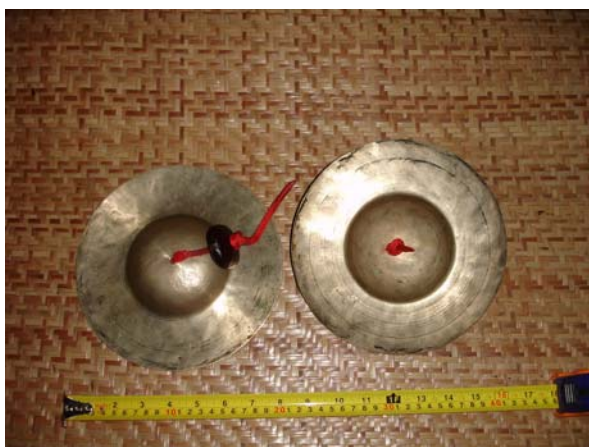
ภาพประกอบ 26 สว่าหลวง หรือ ฉาบใหญ่