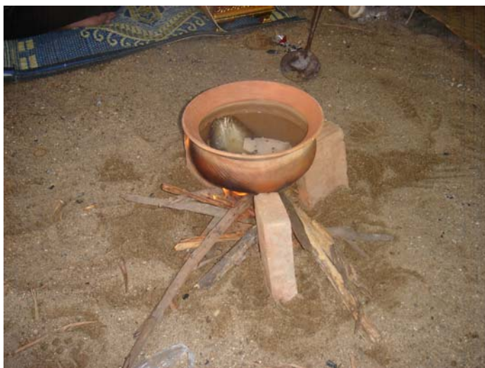
ภาพประกอบ 34 การแสดงการต้มน้ำอ้า

ปัจจุบันตระกูลผีมีตส่วนใหญ่จะอยู่ในแถบจังหวัดลำพูน และจังหวัดลำปางเป็นส่วนมาก ส่วนตระกูลของผีเม็งนั้นจะอยู่ในแถบจังหวัดเชียงใหม่ จังหวัดเชียงราย และจังหวัดลำพูนด้วย บางส่วน ตระกูลที่ยังมีความเหนียวแน่นในประเพณีการพ้อนผีเม็ง ปัจจุบันและยังสืบทอดประเพณีดั้งเดิมเอาไว้ นั่น อยู่ในจังหวัดเชียงใหม่คือ ตระกูลผีเม็งบ้านชัยมงคล และตระกูลผีเม็งบ้านช้างม้อย