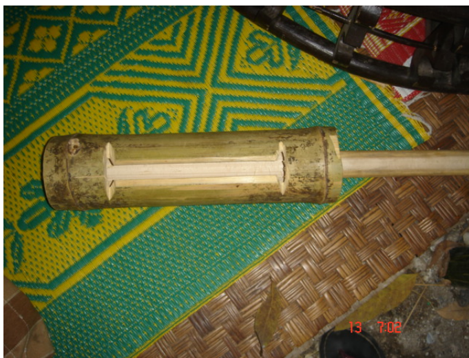
ภาพประกอบ 28 กะโหลก หรือ เกราะ

กะโหลก หรือ เกราะ เป็นเครื่องดนตรีที่ใช้เคาะให้จังหวะแก่วงป่าดอีกชนิดหนึ่ง ซึ่งจะเคาะตามจังหวะเสียง “ฉับ” ของฉิ่งเช่นเดียวกับไม้ฆานาบ ทำมาจากไม้ไผ่ยาวประมาณ 50 เซนติเมตร โดยใช้ไม้ไผ่ทั้งปล้องนำมาเจาะรูเป็นรูสี่เหลี่ยมผืนผ้า เมื่อเคาะจะมีเสียงดังก้องออกมาจากช่องที่เจาะไว้