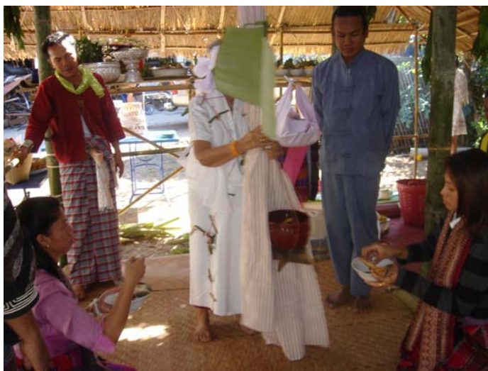
ภาพประกอบ 66 พิธีกุมบาตร

พิธีกรรมกุมบาตรนี้มีความหมายแฝงโดยนัยว่า สมัยตอนที่ผีปู่ย่ายังมีชีวิตอยู่ได้ทำการบวชเรียนเป็นพระหรือถือศีล เมื่อศึกออกมาแล้วก็มีความรู้ติดตัวออกมาจากวัด ผีปู่ย่าจะนำความรู้ที่ได้รับมาใช้สร้างประโยชน์ให้แก่สังคมหรือชุมชน แก่ครอบครัวที่ตนอาศัยอยู่ เมื่อตายไปแล้วคุณงามความดีต่าง ๆ ก็ยังเป็นทีเล่าขานสืบต่อกันมาภายในตระกูล ขั้นตอนในการพอนผีที่ใช้ผ้าขาวคลุมศีรษะให้แก่เก้าผีนั้น แล้วนำเทียนมาครอบศีรษะของเก้าผี ขั้นตอนนั้นถือว่าเป็นการจำลองการบวชของผีปู่ย่าและกิจของสงฆ์อย่างหนึ่งก็คือการบิณฑบาต ชาวล้านนาจะเรียกว่า “การกุมบาตร” พิธีกรรมนี้ยังถือว่าการเชื่อมโยงระหว่างความเชื่อเรื่องผีบรรพบุรุษกับพระพุทธศาสนาอีกด้วย