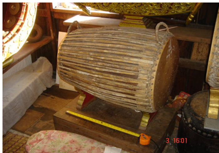
ภาพประกอบ 20 กลองเต่งตึง

กลองเต่งตึง เป็นกลองที่ใช้ตีกำกับจังหวะภายในวงปี่ดเมือง มีรูปร่างและขนาดใกล้เคียงกับ ตะโพนมอญ หุ่นกลองกลึงเป็นรูปทรงกระบอกบั้งตรงกลางคล้ายถังไม้หุ้มหนังสองหน้าด้วยหนังวัว มีหน้าด้านหนึ่งใหญ่ อีกด้านหนึ่งเล็ก หน้ากลองด้านเล็กมีเส้นผ่าศูนย์กลางประมาณ 46 เซนติเมตร หน้ากลองด้านใหญ่มีเส้นผ่าศูนย์กลางประมาณ 51 เซนติเมตร ความยาวของหุ่นกลองประมาณ 76 เซนติเมตร กลองเต่งตึงนี้จะถูกเรียกชื่อตามเสียงกลองที่ดังออกมา โดยผู้ที่บรรเลงโดยทั่วไปจะรู้จักกันว่า หน้าเล็กของกลองนั้นจะมีเสียงดัง “เต่ง” ส่วนหน้าใหญ่ของกลองนั้นจะมีเสียงดัง “ตึง” เมื่อนำเสียงมารวมกันจึงถูกใช้เรียกเป็นชื่อของกลองชนิดนี้