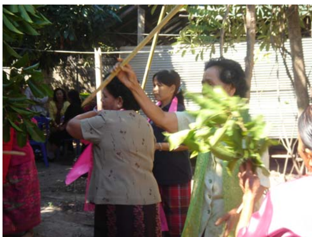
ภาพประกอบ 70 การพ็อนปล่อย

เมื่อการพ็อนถ้วยเสร็จเรียบร้อยแล้ว ถ้าการพ็อนถ้วยเสร็จเร็วและยังเหลือเวลาในภาคเช้านั้นก็จะมี การพ็อนคั่นระหว่างพิธีกรรมเพื่อความบันเทิง ทั้งผีสายตระกูลเดียวกันและผีที่เป็นแขกมาร่วมในงาน การพ็อนนี้จะเรียกว่า “การพ็อนปล่อย” การพ็อนปล่อยนี้จะไม่มีการตั้งโต๊ะอะไรมากนัก ผู้ที่เป็นร่างทรงหรือผีที่เป็นแขกมาร่วมในงานซึ่งอาจจะเป็นตระกูลพ็อนผีตระกูลอื่นจะร่วมกันพ็อนอย่างสนุกสนาน เมื่อถึงช่วงเวลาที่เรียกว่าพ็อนปล่อยนี้ ร่างทรงที่มาร่วมในงานก็จะเดินเข้าไปโหนผ้าจ้องที่อยู่ใต้วามพิธีกรรม เมื่อโหนผ้าจ้องแล้วร่างทรงต่าง ๆ ก็จะออกมาช่วยกันพ็อนรอบต้นแก้วหน้าวามพิธีกรรมอย่างสนุกสนาน มีการพ็อนรำหยอกล้อเล่นกัน ช่วงเวลาพ็อนปล่อยนี้จะขึ้นอยู่กับเจ้าภาพหรือลูกหลานที่เป็นหัวหน้าครอบครัวในตระกูลนั้นโดยจะกำกับดูแลให้เวลาเป็นไปในช่วงเวลาที่เหมาะสม เมื่อพิธีกรรมแต่ละช่วงจบลงแต่เวลายังพอมีก็จะมีช่วงเวลาพ็อนปล่อยนี้เพื่อให้ร่างทรงที่มาร่วมในงานได้สนุกสนานเพิ่มขึ้นหลายช่วง และการพ็อนปล่อยนี้จะจบลงด้วยการพ็อนอาวุธ 4 ชนิดของแก้วผีหรือลูกหลานภายในตระกูล เช่นเดียวกับพิธีกรรมการพ็อนในช่วงพิธีกรรมอื่น ๆ