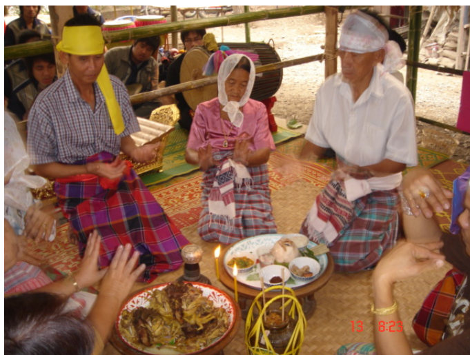
ภาพประกอบ 58 การเลี้ยงข้าวผีปู่ย่า

ร่างทรงของผีปู่ย่าไม่มีการขบเคี้ยวอาหารที่นำมาเลี้ยง เพราะถือว่าอาหารจะไม่ตกไปถึงผีปู่ย่าที่กำลังทรงอยู่ ผีปู่ย่าที่อยู่ในร่างของม้าขี่ จึงใช้การดมอาหารแทนการขบเคี้ยวอาหาร ถ้าเป็นยาสูบ สุรา น้ำมะพร้าว ของที่เป็นเครื่องดื่มต่างๆ จะทำการสูบหรือดื่มโดยตรง เข้าใจว่าเพื่อให้ร่างทรง หรือ ม้าขี่อยู่ได้ตลอดทั้งวัน เพราะคนที่เป็นม้าขี่และร่างทรงจะไม่สามารถกินอะไรได้เลยตลอดการเข้าทรง นั้น ดังนั้นร่างทรงจำเป็นที่จะต้องได้รับน้ำให้เพียงพอ