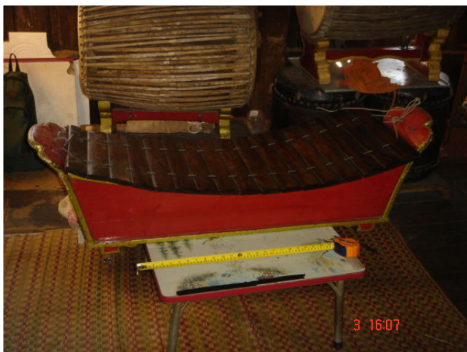
ภาพประกอบ 16 ป่าดทุ้ม หรือ ระนาดทุ้ม