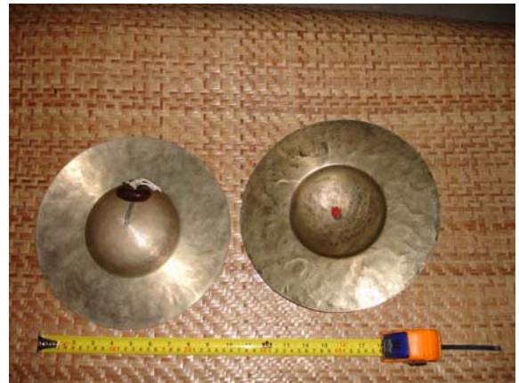
ภาพประกอบ 25 สว่ากลาง หรือ ฉาบกลาง