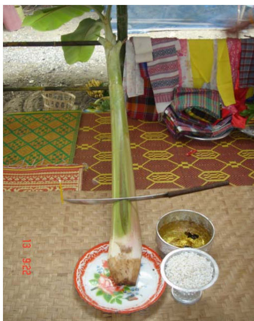
ภาพประกอบ 59 หั่วกล้วย

หลังจากทำความสะอาดต้นกล้วยที่เตรียมไว้เรียบร้อยแล้ว ลูกหรือหลานฝ่ายชายในตระกูลจะแบกต้นกล้วยนั้นเข้ามาในผามพิธีกรรม หันส่วนที่เป็นก้านและใบพาดไว้ที่ราวใต้หิ้งผีปู่ย่า นำธูปมาวางรับส่วนที่เป็นหั่วกล้วยเอาไว้ วางไว้ให้ตำแหน่งของหั่วกล้วยอยู่กลางผามพอดี เตรียมน้ำขมิ้น ส้มป่อยใส่สลุง หรือขันเงินใบใหญ่ 1 ใบ เตรียมสลุงอีก 1 ใบ เพื่อใส่ข้าวตอกที่เตรียมไว้จนเต็ม เตรียมพานดอกไม้อีก 1 ใบ ใส่ดอกไม้รูปเทียนเอาไว้ นำของทั้งหมดมาวางไว้หน้าหั่วกล้วย จากนั้นนำดาบ 1 เล่มมาสับไว้ตรงกลางต้นกล้วย หันปลายดาบชี้ไปทางวงป่าดเมือง หรือทางทิศเหนือของผาม และนำเทียน 1 เล่ม มาติดไว้ที่ปลายดาบพร้อมกับจุดเทียนเล่มนั้น