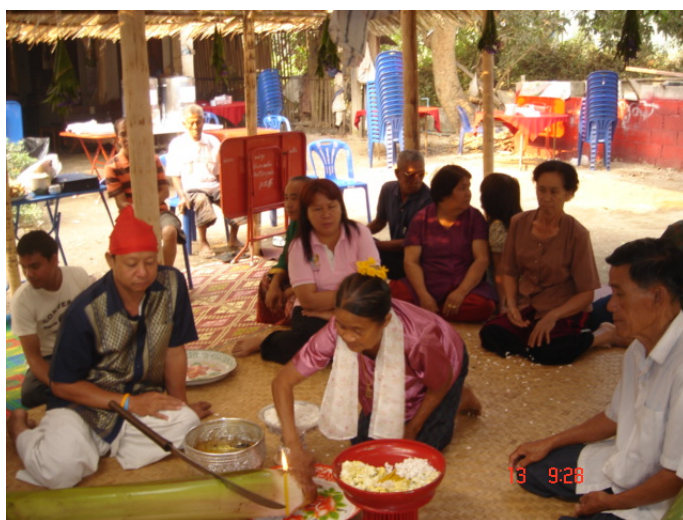
ภาพประกอบ 60 พิธีกรรมไหว้หัวกล้วย

เมื่อแก้วผีในตระกูลทำการสักการะหัวกล้วยเรียบร้อยแล้ว ลูกหลานภายในตระกูลก็จะทำเช่นเดียวกันจนครบจำนวนลูกหลานภายในตระกูลทั้งหมด ในขณะที่ทำพิธีให้หัวกล้วยอยู่นั้นวงป่าดเมืองจะหยุดเล่น เพื่อให้พิธีกรรมดำเนินไปด้วยความสงบ