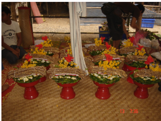
ภาพประกอบ 41 การปูเสื่อและจัดชั้นตั้งภายในผามพิธีกรรม

การปลูกสร้างผามพิธีกรรมนั้นมีข้อห้ามเอาไว้ว่า ไม่ให้ใช้ตะปูตอกไม้เพื่อปลูกสร้างผามพิธีกรรมเพราะจะถือว่าผิดผี ผิดจากประเพณีที่เคยเป็นมา แต่ในความเป็นจริงแล้วนั้นเมื่อประกอบพิธีฟ้อนผีเรียบร้อยแล้วจะต้องทำการรื้อถอนผามพิธีกรรมให้แล้วเสร็จภายในวันนั้นเลย ซึ่งเป็นประเพณีในการฟ้อนผี อาจเพราะเพื่อความสะดวกในการรื้อถอนผามพิธีกรรมออกให้เรียบร้อยแล้วตามเวลาที่กำหนดจึงมีข้อห้ามไม่ให้ใช้ตะปูในการปลูกสร้างผามพิธีกรรม