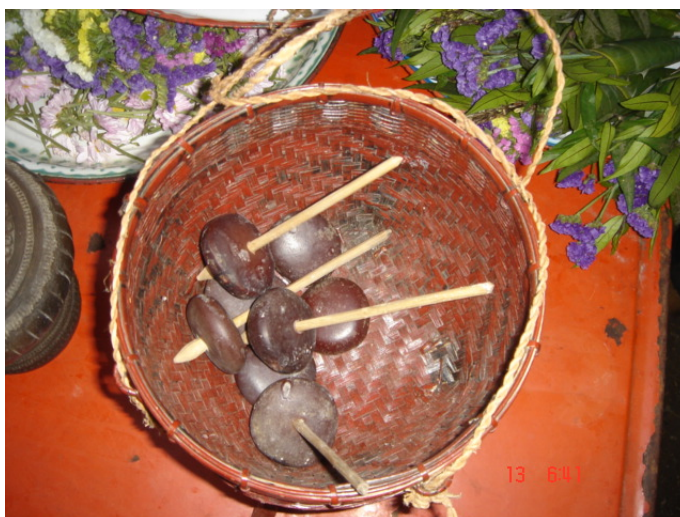
ภาพประกอบ 80 ลูกสะบ้าที่ผีสามตัวใช้เล่น

เมื่อผีสามตัวติดไม้ตีแจกจ่ายให้กับลูกหลานภายในตระกูลเรียบร้อยแล้ว ลูกหลานภายในตระกูลก็จะยกส้อมรับกับข้าวออก และจะนำอุปกรณ์การเล่นสะบ้าออกมาผีสามตัวจะเล่นสะบ้ากับลูกหลานอย่างสนุกสนาน อุปกรณ์ที่ใช้จะเป็นผลสะบ้าเสียบแกนกลางด้วยไม้ไผ่ทำเป็นลักษณะเหมือนกับลูกข่าง ลูกสะบ้าหนึ่งชุดจะมีสี่ลูก และจะมีลูกสะบ้าอีกหนึ่งชุด ซึ่งชุดที่สองนี้จะไม่มีการเสียบแกนกลางที่ทำด้วยไม้ไผ่ ผีสามตัวจะหมุนก้านลูกข่างที่ทำจากลูกสะบ้าชุดแรกให้หมุนอยู่กลางผาม พิธีกรรมลูกหลานภายในตระกูลจะโยนลูกสะบ้าชุดที่สองให้กระทบกับลูกข่างที่ผีสามตัวหมุนอยู่เมื่อลูกสะบ้ากระทบกับลูกข่างที่หมุนอยู่แล้วหยุดจะถือว่าผีสามตัวแพ้เป็นการเล่นสะบ้าแบบโบราณ การเล่นสะบ้านี้จะเล่นกันอย่างสนุกสนานครื้นเครง