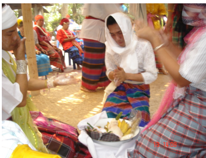
ภาพประกอบ 79 การแต่งตัวของผีสามตัว

เมื่อการแลกเปลี่ยนดอกไม้กับผีสามตัวเรียบร้อยแล้ว ผีสามตัวก็จะพอนในกิริยาอาการ เช่นเดิมจากที่พอนออกมาจากผาม พอนเดินกลับเข้าไปภายในผามพิธีกรรมอีกครั้ง จากนั้นผีสามตัว จะนั่งล้อมวงกันภายในผาม แม่ตั้งที่อยู่ในผามพิธีกรรมจะส่งกระจก หวี และแป้งดินสอพอง ให้กับผีสามตัว ผีสามตัวก็จะรับเอาสิ่งของต่าง ๆ นั้น มาแต่งตัวโดยจะยื่นของแต่งตัวต่าง ๆ เหล่านั้นเปลี่ยนกันไปตามผลัดกันส่งกระจกบ้าง ผลัดกันทาแป้งบ้าง ผลัดกันหวีผมบ้าง ถือว่าเป็นการแต่งตัวเพื่อให้สวยงาม ทำให้สภาพแวดล้อมในพิธีมีความสวยงามตามไปด้วย ทำให้บรรยากาศภายในงาน สนุกสนาน เพราะผีสามตัวจะช่วยกันแต่งตัวและเล่นกันไปอย่างสนุกสนาน ในขณะที่นางพ้าดเมืองก็จะบรรเลงเพลงปราสาทไหว หรือเพลงแห่หงษ์หลวงไปเรื่อย ๆ