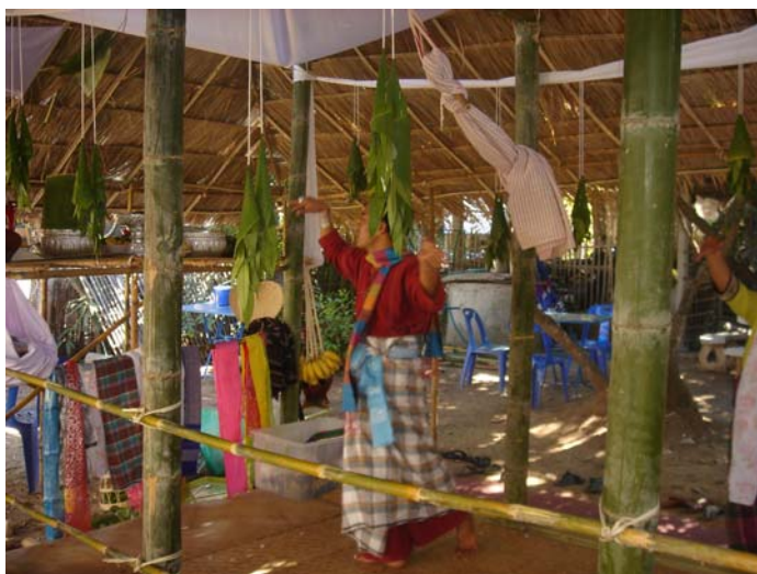
ภาพประกอบ 48 การแขวนใบเกียงพะเม็ง

หลังจากดูหลักฐานภาพในตระกูลช่วยกันแขวนใบเกียงพะเม็งแล้ว หัวหน้าวงป่าดเมืองก็จะจัดเตรียม “หมอน้ำฮ้ำ” โดยก่อเตาไฟชั่วคราวขึ้น ซึ่งเตานั้นจะใช้อิฐ 3 ก้อนมาก่อขึ้นเป็นขาตั้ง โดยจะวางอิฐในแนวตั้งลักษณะเป็นเตาไฟ 3 ขา จากนั้นก็นำหมอน้ำฮ้ำมาวางบนเตาไฟนั้น แต่จะยังไม่ก่อไฟ เพราะเนื่องจากจะต้องรอให้เริ่มเข้าสู่พิธีกรรมเสียก่อนจึงจะจุดไฟในเตาได้