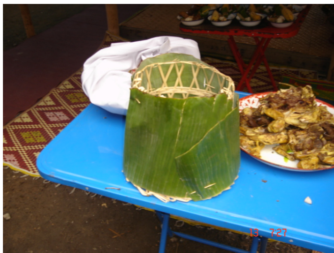
ภาพประกอบ 61 ก๋วยปากปิ่น

ใบตองใบที่ 2 จะถูกนำเอาไปรองกระทง 3 ใบ ที่จัดเตรียมไว้เพื่อใส่หอยวกกล้วย ที่ทำเป็นยำห้วยวกกล้วยเพื่อเลี้ยงผีปู่ย่าบนหิ้งภายในผามพิธีกรรม และใบตองใบที่ 3 ที่เหลืออยู่ จะเอาไปทำพัดก้านกล้วย พัดที่ทำจากใบตองนี้จะเอาไปใช้ใน “พิธีกุมบาตร” และ “พิธีบูชาเทียน”