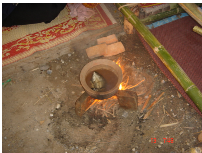
ภาพประกอบ 40 หม้อน้ำฮ้ำที่กำลังถูกต้ม

ตระกูลที่เป็นผีเม็งจะมีความเชื่อว่า หม้อน้ำฮ้ำที่ถูกต้มอยู่ภายในผามพิธีกรรมถือว่าเป็นของสำคัญมาก ระหว่างการประกอบพิธีกรรมตลอดทั้งวัน ตั้งแต่พิธีกรรมแรกจนถึงพิธีกรรมสุดท้าย ห้ามผู้ใดทำหม้อน้ำฮ้ำแตกเป็นอันขาด ถ้ามีผู้ทำหม้อต้มน้ำฮ้ำนี้แตกในระหว่างประกอบพิธีกรรมจะถือว่าเกิดความอัปมงคลขึ้น จะต้องล้มนเลิกพิธีกรรมการพอนผีในวันนั้นและจะต้องหาฤกษ์ หาวันจัดพิธีกรรมการพอนผีขึ้นใหม่ในภายหลัง หากมีผู้ทำหม้อน้ำฮ้ำแตกแล้วไม่จัดพิธีกรรมขึ้นใหม่ทดแทน เชื่อกันว่าจะเกิดความไม่ดีขึ้นในบ้านหรือภายในตระกูล เช่น อาจมีคนภายในตระกูลเจ็บป่วยอย่างหนัก จนถึงกับเสียชีวิต หรืออาจจะทำมาค้าขายไม่คล่อง กิจการการค้าขาย ธุรกิจภายในตระกูลต้องล้มเหลว เป็นต้น