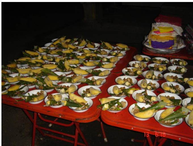
ภาพประกอบ 54 ถ้วยสำหรับพิธีการพ่อนถ้วย

หลังจากนำสิ่งของทุกอย่างไปวางไว้บนหิ้งเรียบร้อยแล้ว ขั้นตอนนี้วงป่าดเมืองจะเปลี่ยนเพลงจาก “เพลงฉัตร” ที่มีจังหวะช้าเป็น “เพลงฝัดห้อยผ้า” ซึ่งมีจังหวะที่เร็วขึ้น ในขณะที่วงป่าดเมืองบรรเลงเพลงฝัดห้อยผ้านี้เอง ลูกหลานภายในตระกูลทั้งหมดที่มีสายเลือดใกล้เคียงกัน หรือบุคคลภายในครอบครัวก็จะทำการโหนดผ้าจ่องที่ผูกไว้กลางผามพิธีกรรม และการโหนดผ้าจ่องนี้ก็ต้องให้ผู้ที่เป็นเจ้าฝัดเป็นผู้โหนดก่อนเป็นคนแรก