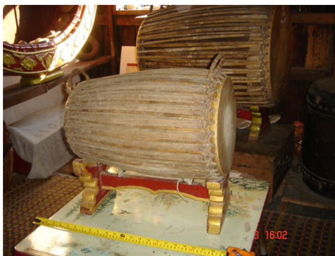
ภาพประกอบ 21 กลองปั้ง

กลองปั้ง เป็นกลองที่ใช้ตีประกอบจังหวะควบคู่ไปกับกลองเต่งตั้งในวงปาดเมือง มีลักษณะคล้ายกับเป็นกลองที่ใช้กำหนดจังหวะย่อยภายในเพลง ลักษณะของกลองปั้งจะคล้ายกับตะโพนไทย แต่มีขนาดเล็กกว่านิดหน่อย กลองปั้งนี้จะมี 2 หน้า หน้าเล็กและหน้าใหญ่เช่นเดียวกับกลองเต่งตั้ง หุ้มด้วยหนังวัวทั้ง 2 หน้า หน้ากลองด้านเล็กจะมีเส้นผ่าศูนย์กลางประมาณ 20 เซนติเมตร หน้ากลองหน้าใหญ่จะมีเส้นผ่าศูนย์กลางประมาณ 26 เซนติเมตร ความยาวของหุ่นกลองประมาณ 51 เซนติเมตร ที่ได้ชื่อวากลองปั้งนี้เนื่องมาจากการเรียกตามเสียงของกลองเช่นเดียวกับกลองเต่งตั้ง หน้ากลองหน้าที่ใหญ่จะมีเสียงดัง “ปั้ง” ส่วนหน้ากลองหน้าทีเล็กจะมีเสียงดัง “ปั้ง”