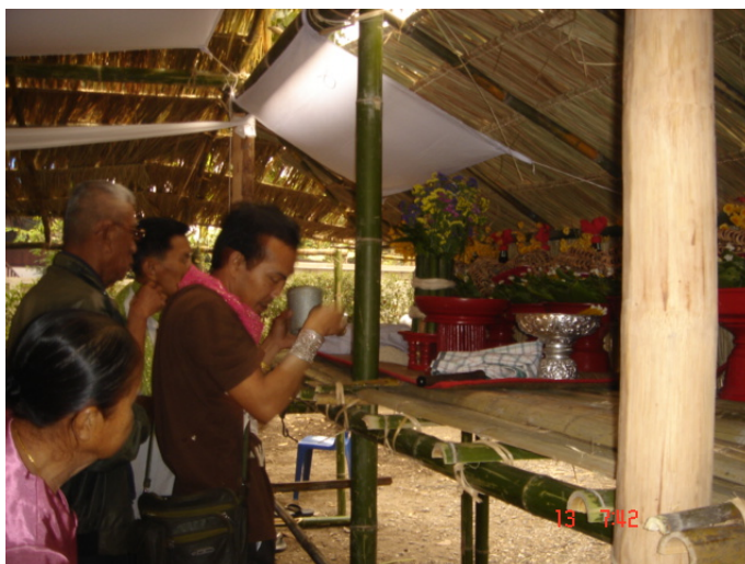
ภาพประกอบ 52 การเชิญผีปู่ย่าขึ้นหิ้ง

บริเวณข้างผามพิธีกรรมใกล้เคียงกับบริเวณที่ตั้งของวงป่าดเมือง จะมีพื้นที่สำหรับตั้งเตาไฟชั่วคราว บนเตาจะตั้งหม้อต้มน้ำสาเอาไว้ ในหม้อต้มน้ำสา นั้นจะใส่ปลาช่อนตากแห้งเอาไว้ 1 ตัว มีน้ำสะอาดใส่ไว้พอประมาณ นำน้ำปลาร้าใส่ตามลงไปประมาณ 1 ช้อน เมื่อเชิญผีปู่ย่าขึ้นหิ้งเรียบร้อยแล้ว เตาไฟชั่วคราวที่ใช้ต้มหม้อน้ำสาก็จะถูกจุดไฟขึ้นโดยเจ้าบ้านที่เป็นเจ้าภาพในการพอนผีในวันนั้น และต้มจนน้ำปลาร้าในหม้อเดือด