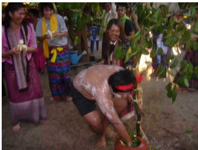
ภาพประกอบ 84 พิธีการคล้องช้าง

หลังจากความสนุกสนานต่างๆได้ผ่านไปแล้ว ลูกหลานภายในตระกูลที่สามารถคล้องช้างได้ก็จะตั้งช้างเข้าไปในผามพิธีกรรม เก้าอี้ที่ทรงฝักฝักจะนั่งรออยู่ภายในผามพิธีกรรม เมื่อลูกหลานที่คล้องช้างได้นำผู้ที่เป็นช้างเข้าไปหาฝักฝักที่นั่งอยู่ภายในผามพิธีกรรม ฝักฝักก็จะใช้ดาบสายสิญจน์ผูกข้อมือให้กับช้างพร้อมกับลูบน้ำมันส้มป่อย ป้อนกล้วยและทาน้ำมันมะพร้าวที่ผมให้แก่ผู้ที่เป็นช้าง จากนั้นก็จะให้รางวัลเป็นกล้วย 1 หวี มะพร้าว 1 ลูก พร้อมกับซองเงินรางวัลอีก 1 ซอง เป็นการรับขวัญและยอมรับผู้ที่เป็นช้างว่าเป็นช้างมงคลที่ลูกหลานได้คล้องมาให้ ขั้นตอนการคล้องช้างนี้เป็นขั้นตอนที่ระลึกถึงเมื่อสมัยที่ผีบรรพบุรุษจะต้องออกไปคล้องช้างป่ามาฝึกเพื่อนำมาชักลากไม้ เป็นการระลึกถึงความยากลำบากของผีบรรพบุรุษในอดีต และเมื่อฝักฝักรับขวัญผู้ที่เป็นช้างเรียบร้อยแล้วพิธีการคล้องช้างก็จะเสร็จสิ้นลง