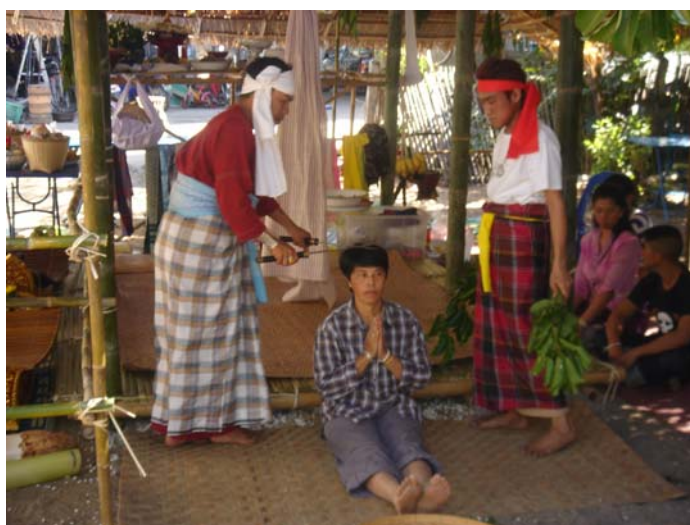
ภาพประกอบ 71 พิธีการปิดฤกษ์