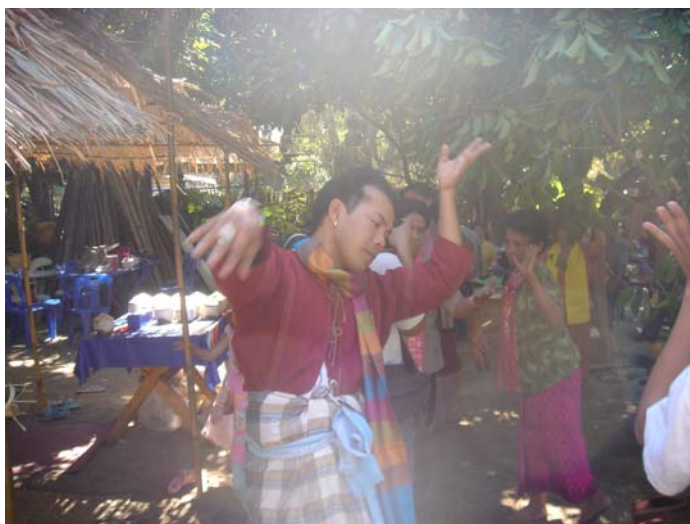
ภาพประกอบ 57 การฟ้อนตุม

เมื่อลูกหลานภายในตระกูลไหนผ้าจ้องแล้ว การฟ้อนผีที่ต่อจากพิธีการเชิญผีปู่ย่าขึ้นหิ้งเรียบร้อยแล้วจะเรียกพิธีการฟ้อนนี้ว่า “การฟ้อนตุม” ซึ่งการฟ้อนตุมเป็นการฟ้อนของลูกหลานภายในตระกูลที่มีสายเลือดใกล้เคียงกัน เพื่อต้อนรับผีปู่ย่าที่ลงมาร่วมสนุกและร่วมฟ้อนกับลูกหลานภายในตระกูล โดยถือว่าการฟ้อนตุมของลูกหลานเป็นการฟ้อนในยกที่ 2 ของพิธีกรรมช่วงเช้า