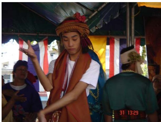
ภาพประกอบ 30 ผีมด

คำว่า “ผีมด” นั้น ชาวล้านนาจะให้คำจำกัดความว่า คือ ผีบรรพบุรุษของสามัญชน หรือชนชั้นไพร่ของชาวไทยล้านนาโดยทั่วไป เมื่อมีชีวิตเคยสร้างคุณประโยชน์แก่ลูกหลานภายในตระกูลจนเป็นที่นับถือของคนทั่วไป เมื่อเสียชีวิตไปแล้วจึงได้รับการยกย่องให้เป็นผู้คุ้มครองดูแลลูกหลานภายในตระกูล และส่วนใหญ่นั้ก็มักจะเป็นบรรพบุรุษของฝ่ายหญิง