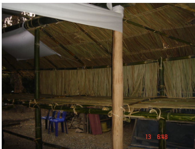
ภาพประกอบ 42 หิ้งผีปู่ย่าภายในผามพิธีกรรม

ผามพิธีกรรมถือว่าเป็นสถานที่ศักดิ์สิทธิ์ ก่อนจะเริ่มพิธีกรรม ถ้าพิธีกรรมต่างๆยังไม่เริ่มต้นห้ามผู้ใดนำเอาผ้าถุง เครื่องแต่งตัวต่างๆ วัตถุสิ่งของใดๆ ไปวางไว้บนหิ้งหรือพาดไว้บนราวผ้าภายในผามพิธีกรรม เพราะจะถือว่าผามพิธีกรรมนั้นถูกใช้แล้วและเป็นผามพิธีกรรมที่ไม่สะอาด