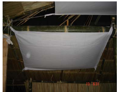
ภาพประกอบ 45 ผ้าเทินหิ้ง