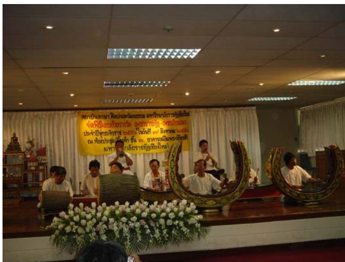
ภาพประกอบ 2 วงป้าตเมืองคณะวัดเชียงยืน

วงป้าตหรือวงปี่พาทย์ของคณะวัดเชียงยืนเป็นวงตรีที่เก่าแก่ในจังหวัดเชียงใหม่ที่สามารถบรรเลงเพลงประกอบพิธีกรรมการพืชมงคลผีเม็งได้อย่างถูกต้องตามประเพณีดั้งเดิมมาเป็นระยะเวลายาวนาน