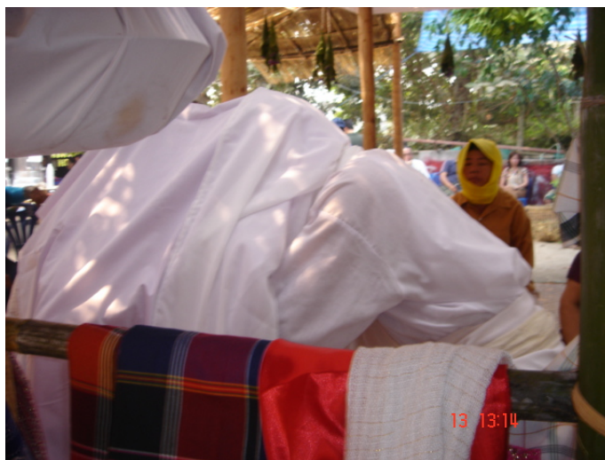
ภาพประกอบ 75 การคาบปลาแห้งของผีภูเขา

เมื่อแมวที่แสดงโดยลูกหลานคาบปลาแห้งมาได้แล้ว ก็จะคาบปลาแห้งนั้นวิ่งเข้าไปในห้องของ เก้าอี้ และจะนำเอาปลาแห้งคาบวางไว้ที่กลางที่นอนของเก้าอี้ ปลาแห้งนั้นจะถูกเรียกว่า “ปลาเงิน ปลาทอง” หลังจากแมวคาบปลาแห้งวางไว้บนที่นอนแล้ว แมวนั้นก็ถือว่านำเงินทอง โชคลาภเข้าสู่ บ้านและจะถือว่าเสร็จสิ้นพิธีกรรมในการพ้อนผีภูเขา ต่อจากนั้นจะเป็นการพ้อนปล่อย 1 รอบ วงป่าด เมืองจะต้องกะเวลาการพ้อนปล่อยในรอบนี้ให้อยู่ในเวลาไม่เกินบ่าย 2 โมง