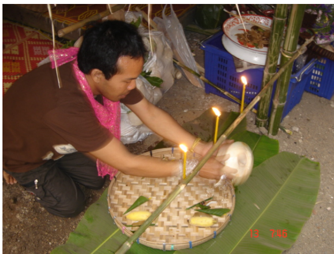
ภาพประกอบ 53 พิธีกรรมการสืบผี

เมื่อพิธีกรรมสืบผีเสร็จเรียบร้อยแล้ว ลูกหลานจะช่วยกันนำเอาถ้วยฟ่อนที่ใส่เครื่องเซ่นเอาไว้ตามจำนวนที่ประเพณีของแต่ละตระกูลที่ได้สืบทอดกันมาภายในตระกูล อาจไม่เท่ากันในแต่ละตระกูลเพราะแต่ละตระกูลก็จะนับถือผีไม่เหมือนกัน ถ้วยที่ใช้ฟ่อนจะถูกนำไปวางไว้บนหิ้งของผีปู่ย่า ลูกหลานทุกคนในตระกูลจะช่วยกันจัดเรียง และนำเอาถ้วยฟ่อนขึ้นไปวางไว้บนหิ้งอย่างรวดเร็วจนครบตามจำนวนที่ได้จัดเตรียมเอาไว้ ภายในถ้วยฟ่อนจะถูกบรรจุไปด้วยอาหารคาว – หวานต่างๆ อย่างละเล็กละน้อย ซึ่งเป็นอาหารที่ถูกกำหนดไว้ในประเพณีการฟ่อนผี อาหารคาว – หวานต่างๆ ประกอบไปด้วยอาหารดังนี้