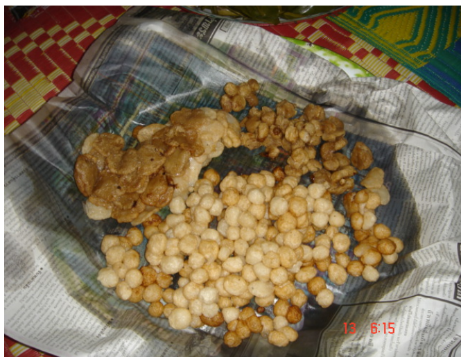
ภาพประกอบ 39 ขนมแพ้ง่าย

ชาวบ้านในบริเวณใกล้เคียงที่เจ้าภาพได้บอกเชิญเอาไว้ รวมไปถึงผู้เฒ่าผู้แก่ในละแวกนั้น ซึ่งส่วนมากจะเป็นผู้หญิงก็จะทยอยกันมาที่บ้านงานฟ้อนผี ผู้ที่มาในตอนปลายของวันคืนนี้ก็จะมาช่วยกันจัดเตรียมของให้ภายในพิธีกรรมทุกอย่าง เช่น เตรียมใบตองทำกรวยดอกไม้ ต้มของเช่นข้าว ทำขนมต่างๆ รวมไปถึงการทำกับข้าวเลี้ยงแขกที่มาช่วยภายในงานด้วย เป็นต้น ของให้ในพิธีกรรมทุกอย่างจะถูกจัดเตรียมให้เรียบร้อยภายในวันคืน และจะต้องเรียบร้อยก่อนเวลาพระอาทิตย์ตกดิน เพราะถือว่าเป็น สิริมงคลแก่เจ้าของบ้านและลูกหลานภายในตระกูลทำให้มีความเจริญรุ่งเรือง