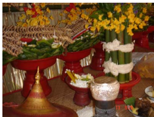
ภาพประกอบ 51 บอกเหม็ง