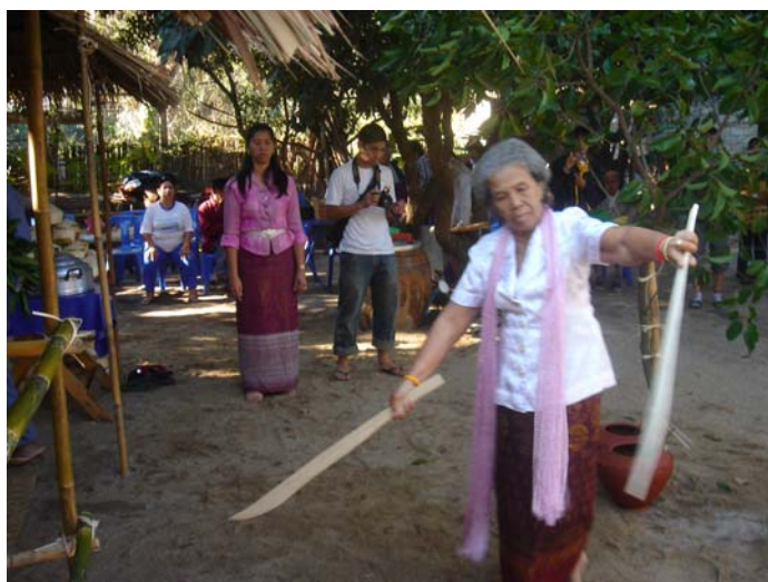
ภาพประกอบ 56 การฟ้อนอาวุธทั้ง 4 ประเภท

การฟ้อนผีปู่ย่าเก้าผีจะต้องนำอาวุธทั้ง 4 ประเภท ที่ออกไปฟ้อนเพื่อเป็นสัญญาณในการลงจับแต่ละยกได้แก่ ตามจริง 1 คู่ ดาบไม้ไผ่ 1 คู่ ไม้พลองขนาด 1 เมตร 1 คู่ และกิ่งของต้นดอกแก้ว มัดรวมกัน 1 คู่ เมื่อเก้าผีนำเอาอาวุธ 4 ประเภทนี้ออกมาฟ้อนรอบต้นแก้วประมาณ 3 - 4 รอบ แล้ว และฟ้อนกลับเข้าไปในผามพิธีกรรมอีกครั้ง วงป่าดเมืองจะบรรเลงทอเพลงลงจับให้ถือว่าเป็นการเสร็จสิ้นการฟ้อนผีจับ 1 ยก