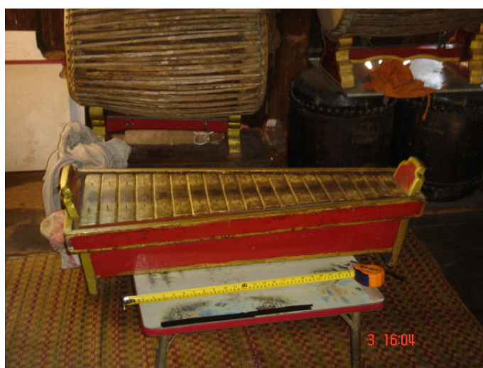
ภาพประกอบ 17 ป่าดเหล็ก หรือ ระนาดเอกเหล็ก

ป่าดเหล็กหรือระนาดเอกเหล็ก เป็นเครื่องดนตรีที่จะบรรเลงไปพร้อมกับป่าดเอก ป่าดเหล็กนี้จะมีเสียงดังกังวานทำขึ้นจากเหล็กทรงล้อเกวียน นำมาตัดและหลอมไฟ ทบขึ้นรูปให้ได้เสียงตามความต้องการ จำนวนลูกระนาดจะมีทั้งหมด 19 ลูก ลูกต้นจะมีความยาวประมาณ 25 เซนติเมตร ลูกระนาดลูกยอดจะมีความยาวประมาณ 19 เซนติเมตร ลูกระนาดจะถูกนำมาเรียงต่อกัน เจาะรูหัวท้ายแล้วใช้ตะปูตอกยึดไว้กับรางระนาดที่ประกอบขึ้นจากไม้เป็นรูปคล้ายหีบไม้สีเหลี่ยมผืนผ้า ซึ่งได้ลูกระนาดแต่ละลูกจะถูกรองด้วยไม้เนื้ออ่อนหรือหวาย ไม้เนื้ออ่อนหรือหวายนี้จะทำให้เสียงของป่าดเหล็กมีความดังกังวานมากยิ่งขึ้น ไม้ที่ใช้ดีจะทำมาจากหนังควายตากแห้ง ตัดให้เป็นรูปวงกลมแล้วเสียบแกนกลางด้วยก้านไม้ไผ่