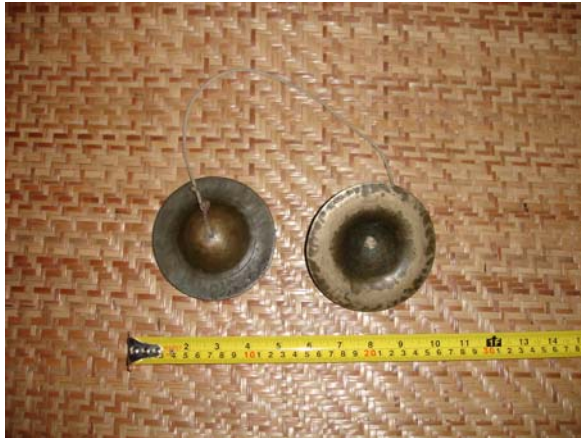
ภาพประกอบ 22 สิ่ง