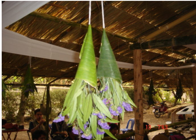
ภาพประกอบ 35 กรวยใบตองใส่ใบกล้วยพะเม็ง

แม่ตั้งในการประกอบพิธีกรรมการพ้อนผีนั้นจะเป็นที่รู้จักกันดีในหมู่ของตระกูลผู้ที่สืบทอดการพ้อนผีมดและผีเม็งเท่านั้น และจะมีแม่ตั้งไม่กี่คนที่สามารถประกอบพิธีกรรมได้อย่างสมบูรณ์โดยไม่มีข้อบกพร่อง ผู้ที่ทำหน้าที่เป็นแม่ตั้ง 2 ท่าน ที่รู้จักกันดีในหมู่ของตระกูลผู้พ้อนผี คือ นางสดใส หงส์ทอง อายุ 78 ปี และนายสมบุญ พรหมปัน อายุ 36 ปี ทั้ง 2 ท่านนี้เป็นผู้ที่มีความรู้ในเรื่องของการพ้อนผีเป็นอย่างดี และทำหน้าที่เป็นแม่ตั้งให้กับตระกูลการพ้อนผีในหลายตระกูลมีประสบการณ์เกี่ยวกับการเป็นแม่ตั้งและการพ้อนผีเป็นอย่างมาก