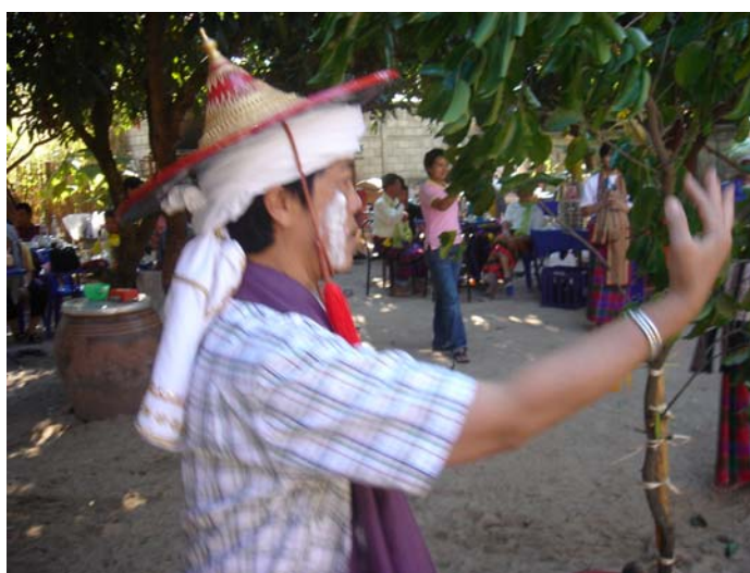
ภาพประกอบ 77 พิธีการฟ้อนผีเจ้าเซียงใหม่

ผีเจ้าเซียงใหม่จะแต่งตัวจากในผามพิธีกรรมเมื่อเริ่มพิธีในขั้นตอนนี้วงป่าดเมืองจะเริ่มบรรเลงเพลงผีเจ้าเซียงใหม่ก็จะออกมาจากผามพิธีกรรมเพื่อทำการฟ้อนรอบต้นแก้วที่อยู่หน้าผามพิธีกรรม เพลงที่ใช้บรรเลงประกอบพิธีกรรมช่วงนี้คือเพลงเหยงหลวง เมื่อผีเจ้าเซียงใหม่ออกมาแล้วก็จะเดินไปฟ้อนรอบต้นแก้วหน้าผามพิธีกรรม 3 รอบ ผู้ที่เป็นแม่ตั้งหรือเจ้าพิธีจะเตรียมอาวุธ 4 ชนิดไว้ให้ หลังจากผีเจ้าเซียงใหม่ฟ้อนรอบต้นแก้วครบ 3 รอบแล้ว แม่ตั้งก็จะทยอยยื่นอาวุธทั้ง 4 ให้กับผีเจ้าเซียงใหม่ที่ละชนิด เมื่อผีเจ้าเซียงใหม่รับอาวุธมาแล้วก็จะนำกลับไปฟ้อนรอบต้นแก้วอีกครั้งหนึ่ง ฟ้อนเช่นนี้จนครบอาวุธทุกชนิด และถือว่าเป็นการเสร็จสิ้นพิธีกรรมการฟ้อนผีเจ้าเซียงใหม่