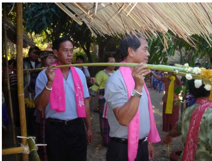
ภาพประกอบ 83 การแห่บอไฟ

พิธีกรรมต่อจากการแห่บอไฟแล้ว จะเป็นพิธีกรรม “การคล้องช้าง” พิธีกรรมนี้จะต้องมีผู้แสดงเป็นช้าง เจ้าภาพหรือเจ้าบ้านจะเลือกจากแขกที่มาร่วมภายในงาน ลูกหลานภายในตระกูลหรือนักดนตรีวงปาดเมือง ผู้ที่เป็นช้างจะต้องเลือกผู้ที่มีรูปร่างใหญ่โต กำยำแข็งแรง และผู้ที่เป็นช้างในช่วงพิธีกรรมนี้เวลาอยู่ในพิธีกรรมจะต้องเปลือยกายท่อนบนออก บางตระกูลการฟ้อนผีก็จะให้ผู้ที่เป็นช้างทาตัวด้วยน้ำมันเพื่อทำให้ตัวลื่นก็มี ผู้ที่แสดงเป็นช้างนั้นเมื่อเริ่มพิธีจะต้องเดินออกมาจากด้านหลังของผามพิธีกรรมและมานั่งรออยู่บริเวณใต้ต้นดอกแก้วหน้าผามพิธีกรรม เมื่อเริ่มพิธีกรรมผู้ที่เป็นช้างจะต้องพยายามหนีผู้ที่จะเข้ามาเพื่อใช้ผ้าคล้องตน ลูกหลานภายในตระกูลซึ่งส่วนมากจะคัดแต่ผู้ที่เป็นผู้หญิงจำนวนประมาณ 10 คน มาแต่งตัวด้วยการนุ่งสะโหร่ง ในมือจะถือผ้าที่มีความยาวประมาณ 1 เมตร คนละผืน เมื่อเริ่มการคล้องช้างลูกหลานที่เป็นผู้หญิงที่ถูกคัดเลือกจะเริ่มเอาน้ำมาสาดผู้ที่เป็นช้างและสาดเล่นกันอย่างสนุกสนาน บางคนก็ไล่ต้อนเพื่อคล้องผู้ที่เป็นช้างไล่กันเป็นที่สนุกสนาน จนเมื่อมีผู้ที่สามารถคล้องช้างได้สำเร็จและพยายามดึงช้างเข้าไปในผามพิธีกรรมผู้ที่เป็นช้างจะถูกดึงเข้าไปในผามพิธีกรรมและจะถูกนำไปให้แก่ผีปู่ย่าที่นั่งรออยู่ภายในผามพิธีกรรม