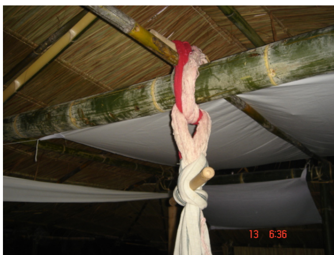
ภาพประกอบ 47 การมัดผ้าจ้อง

การมัดผ้าจ้องจะต้องกะความยาวของผ้าให้สูงกว่าพื้นของผามพิธีกรรม กล่าวคือความยาวของผ้าจ้องเมื่อมัดเสร็จเรียบร้อยแล้วจะต้องไม่ยาวลากถึงพื้นของผามพิธีกรรม หรือวัดจากความยาวของเสาผามก็ได้ ถ้าเสาผามมีความสูงอยู่ที่ 2 เมตรครึ่ง ผ้าจ้องก็จะต้องมีความยาว 2 เมตรพอดี เป็นต้น การผูกผ้าทั้งหมดนั้น ทั้งผ้าเวียนผาม ผ้าเทินหึ่ง ผ้าเทินกลาง และผ้าจ้องนี้จะทำมาจากผ้าดิบสีขาวทั้งหมด การผูกผ้าต่างๆเหล่านี้จะมีความหมายแฝงอยู่คือ เป็นการแสดงถึงความบริสุทธิ์ของผามที่ใช้ประกอบพิธีกรรม