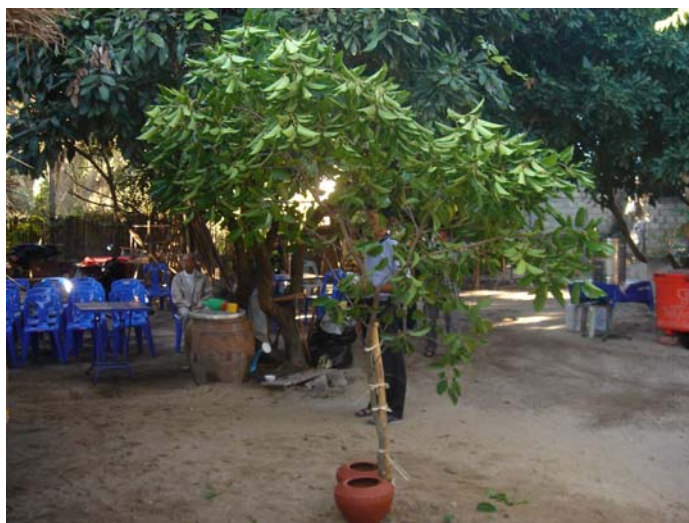
ภาพประกอบ 49 การฝังต้นดอกแก้ว