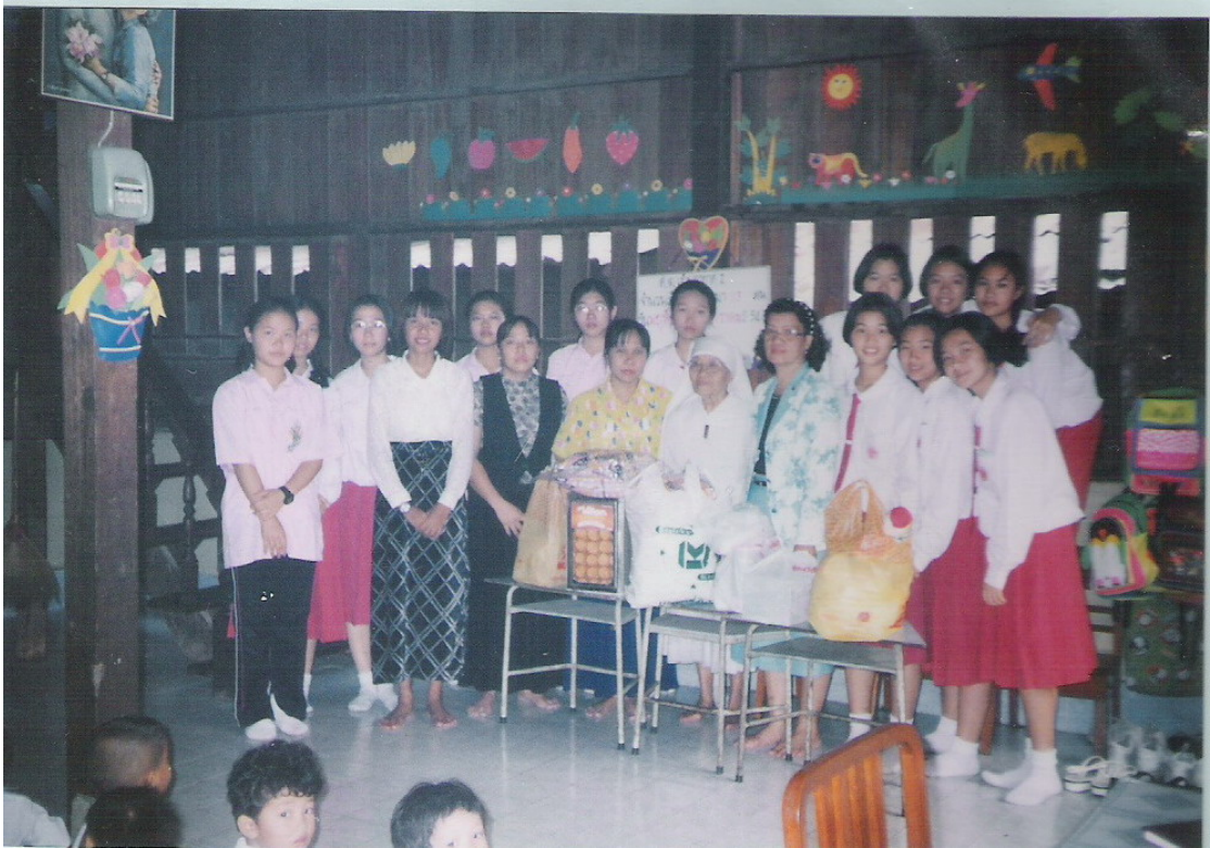
ภาพประกอบ 12 กิจกรรมที่สถานสงเคราะห์เด็กพิการและทุพพลภาพ ปากเกร็ด. 2540.