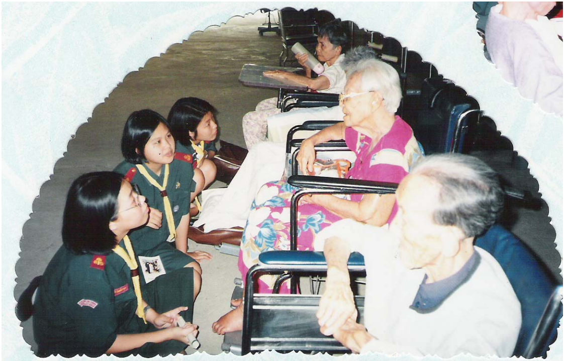
ภาพประกอบ 15 กิจกรรมที่บ้านพักคนชรา จังหวัดปทุมธานี. 2545.