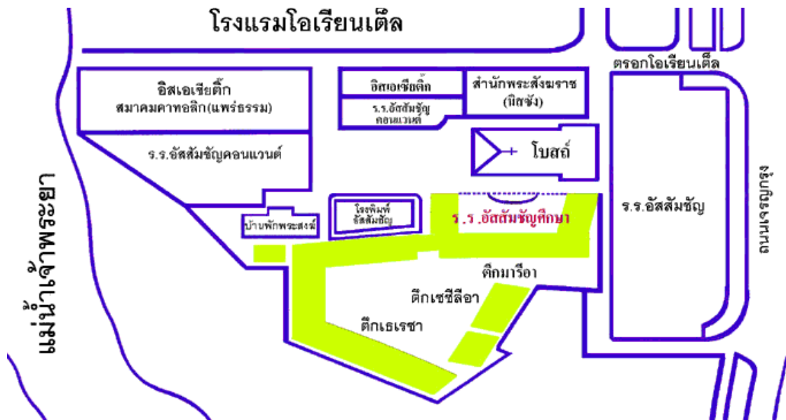
ภาพประกอบ 3 แผนที่ที่ตั้งโรงเรียนอัสสัมชัญศึกษาและอาสนวิหารอัสสัมชัญ