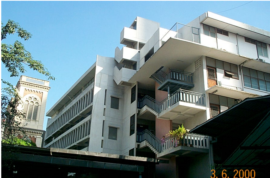
ภาพประกอบ 2 แสดงที่ตั้งโรงเรียนอัสสัมชัญศึกษา ซึ่งตั้งอยู่ทางทิศใต้ของอาสนวิหาร อัสสัมชัญ