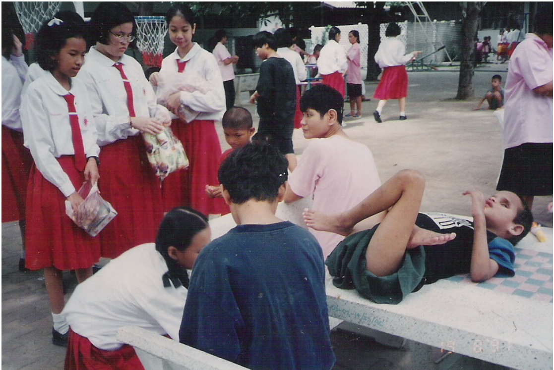
ภาพประกอบ 14 กิจกรรมที่บ้านเฟื่องฟ้า. 2545.