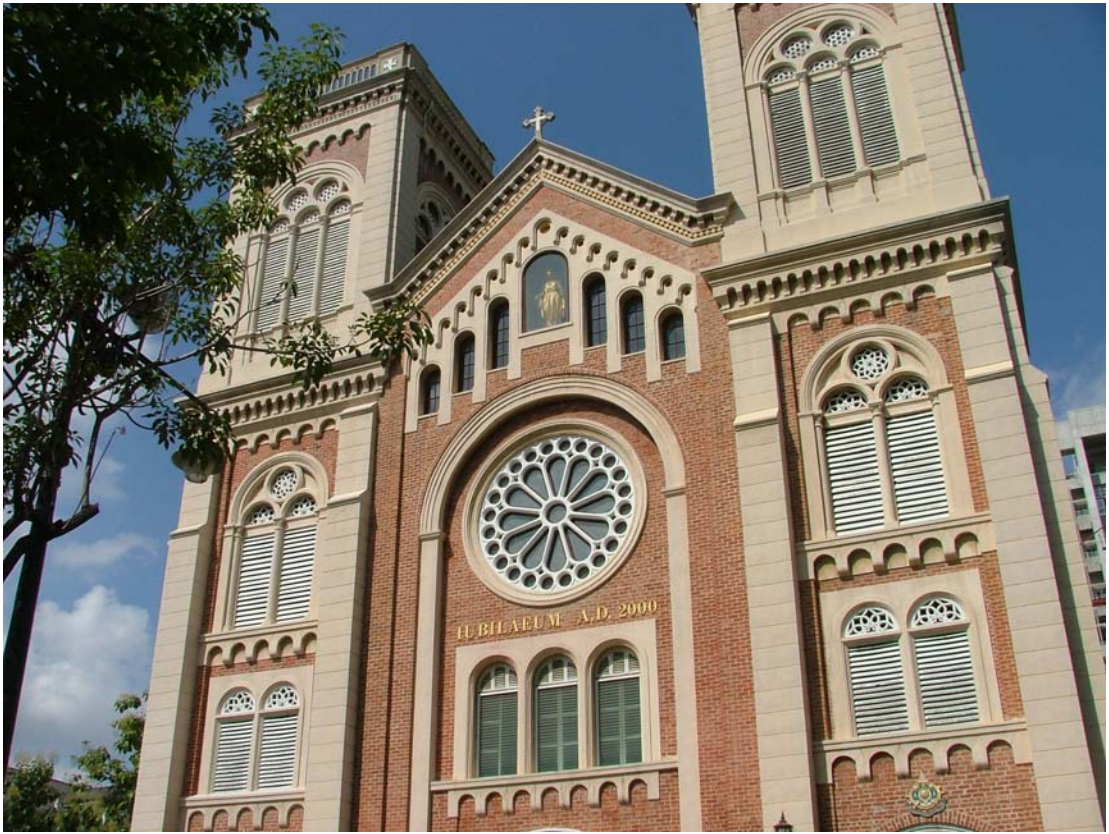
ภาพประกอบ 4 อาสนวิหารอัสสัมชัญ (ถ่ายภาพที่อาสนวิหารอัสสัมชัญ, 2545)