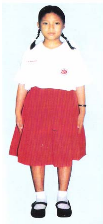
ภาพประกอบ 9 เครื่องแต่งกายของนักเรียนระดับชั้นประถมศึกษา เลื้อยสีขาว กระโปรงสีแดง ถุงเท้าสีขาว รองเท้านักเรียนสีดำ