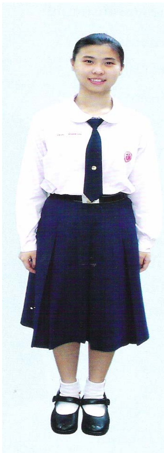
ภาพประกอบ 11 เครื่องแต่งกายของนักเรียนระดับชั้นมัธยมศึกษาตอนปลาย เลื้อยสีขาวแขนยาว เนคไทสีกรมท่า กระโปรงสีกรมท่า ถุงเท้าสีขาว รองเท้านักเรียนสีดำ