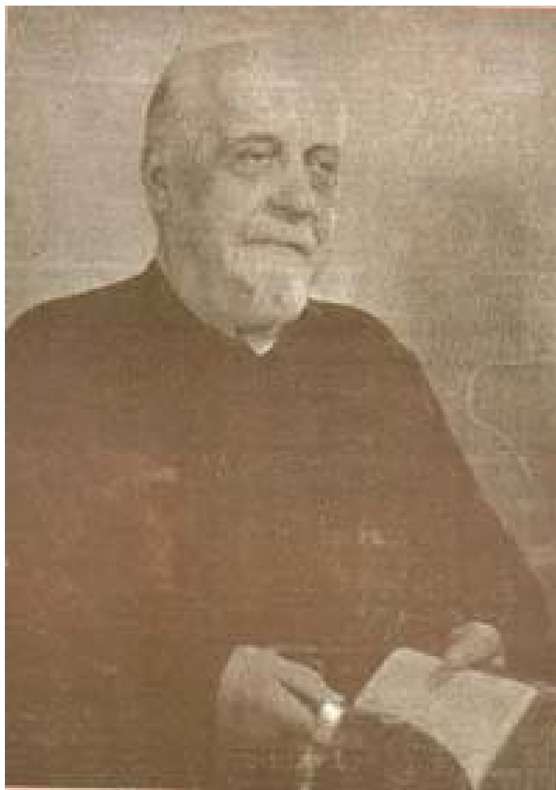
ภาพประกอบ 5 บาทหลวงเปรูตอง ผู้ก่อตั้งโรงเรียนอัสสัมชัญศึกษา (www.as.ac.th.)