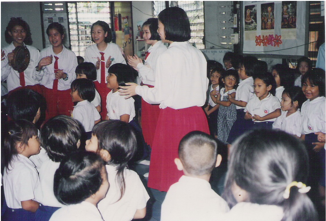
ภาพประกอบ 13 กิจกรรมที่ศูนย์เด็กเล็ก เชื้อเพลิงนอก คลองเตย. 2543.