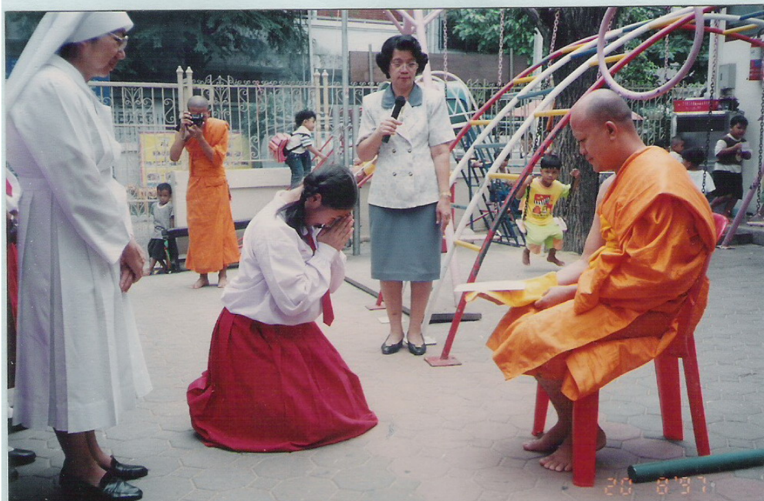
ภาพประกอบ 16 กิจกรรมที่มูลนิธิกลุ่มแสงเทียน เขตธนบุรี. 2540.