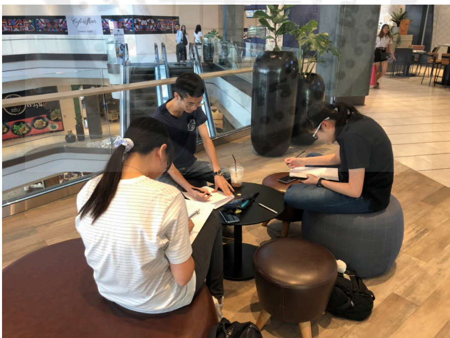
รูปที่ 2 การตอบแบบสอบถามจากกลุ่มผู้ที่เข้าใช้บริการ co-working space ที่ Singha Complex