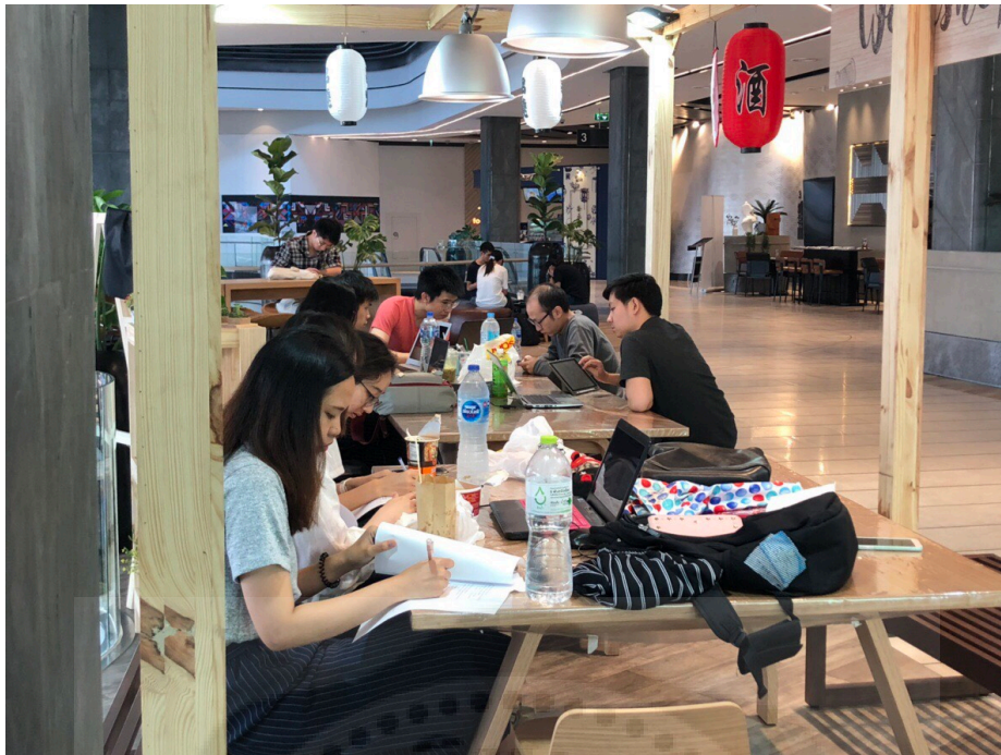
รูปที่ 3 การตอบแบบสอบถามจากกลุ่มผู้ที่เข้าใช้บริการ co-working space ที่ Singha Complex