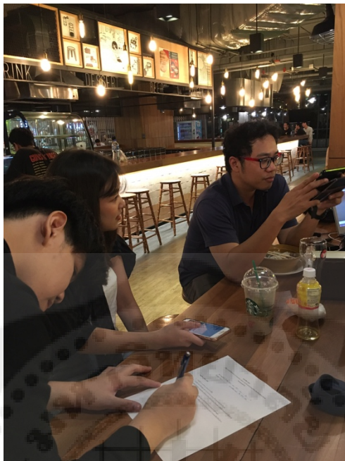
รูปที่ 1 การสัมภาษณ์จากกลุ่มผู้ที่เข้าใช้บริการ co-working space ที่ The Street Ratchada

ภาพการปฏิบัติงาน ในการลงพื้นที่เก็บข้อมูลแบบสอบถามและสัมภาษณ์