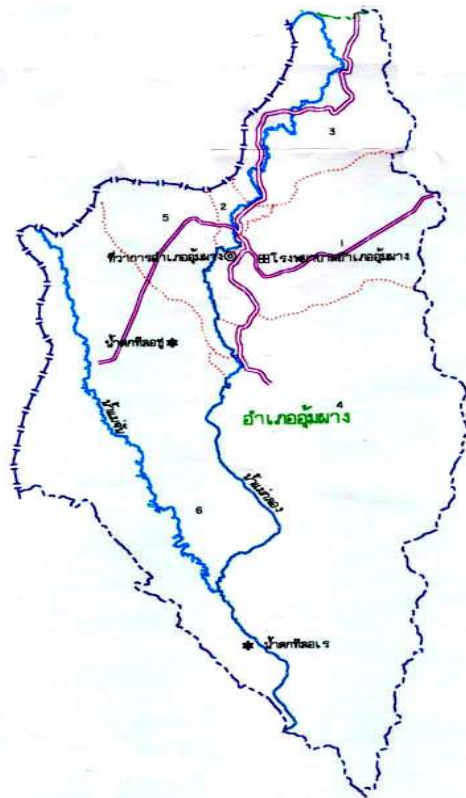
ภาพประกอบ 2 แผนที่อำเภออุ้มผาง