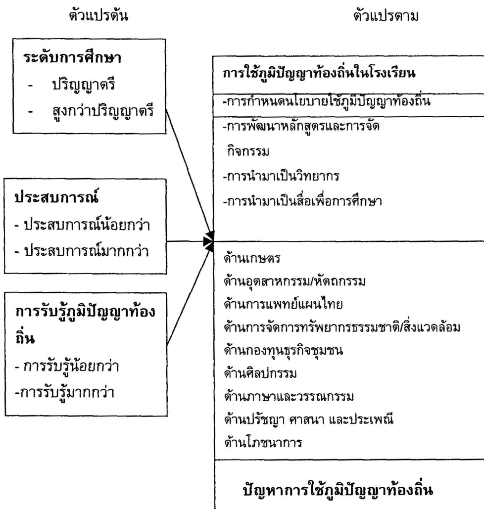
ภาพประกอบ 1 กรอบความคิดในการวิจัย