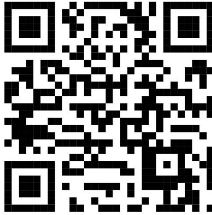
ภาพที่ 8 รหัสคิวอาร์ (QR Code) แผนที่ท่องเที่ยวชุมชนนางเลิ้ง

ทางคณะผู้จัดทำ นำเสนอการท่องเที่ยวแบบ One day Trip เพื่อเป็นตัวอย่างในการใช้แผนที่ท่องเที่ยว โดยจัดทำเป็น “เส้นทางเลิ้งรสศิลป์” ซึ่งเป็นเส้นทางท่องเที่ยวภายในชุมชนนางเลิ้งแบบ One Day Trip ที่นำเสนออัตลักษณ์ของชุมชนนางเลิ้ง ประกอบด้วย วัดสุนทรธรรมทาน-ตรอกละคร-บ้านนราศิลป์-ศาลาเฉลิมธานี-ตลาดนางเลิ้ง-ศาลเสด็จพ่อกกรรมหลวงชุมพรฯ-MATDOT Art Center-วัดโสมนัสราชวรวิหาร โดยสถานที่เหล่านี้นำมาออกแบบเป็นเส้นทางท่องเที่ยวเพื่อส่งเสริมการท่องเที่ยวเชิงศิลปะ วัฒนธรรม และอาหารของชุมชนนางเลิ้ง