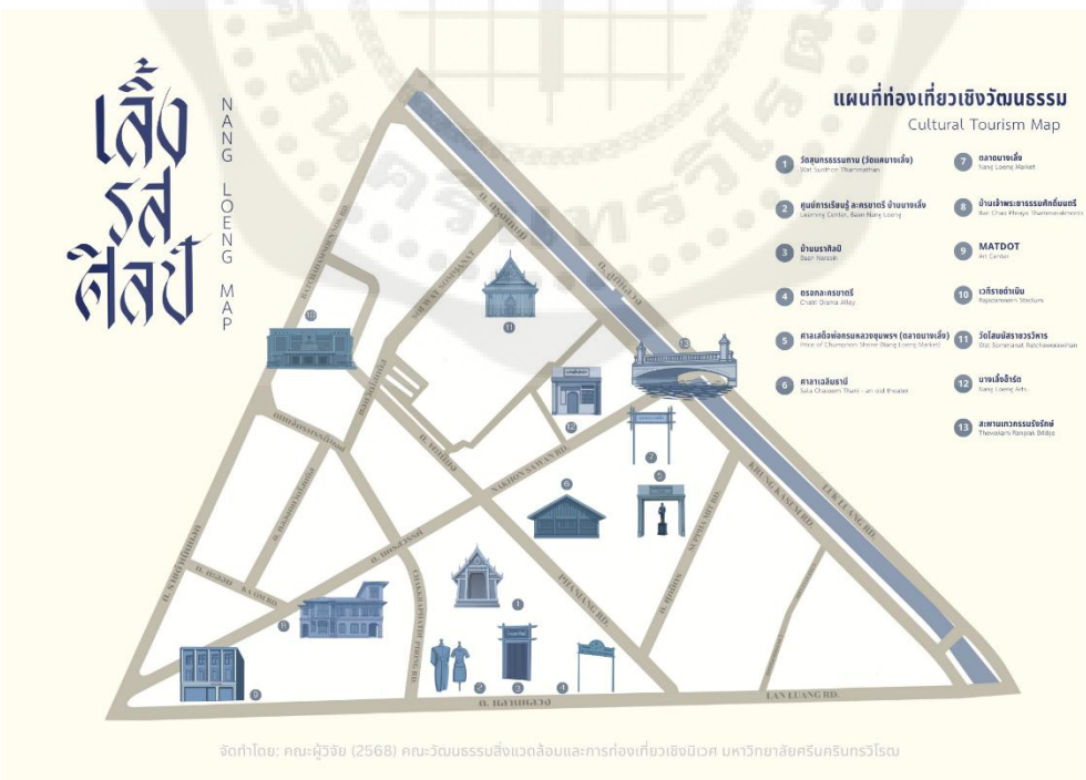
จัดทำโดย: คณะผู้วิจัย (2568) คณะวัฒนธรรมสิ่งแวดล้อมและการท่องเที่ยวเชิงนิเวศ มหาวิทยาลัยศรีนครินทรวิโรฒ