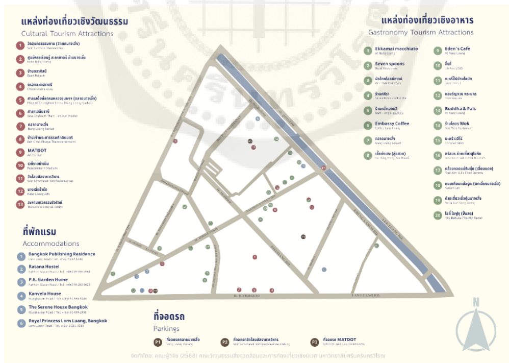
ภาพที่ 3 แผนที่ท่องเที่ยวชุมชนนางเลิ้งด้านศิลปวัฒนธรรมและด้านอาหาร