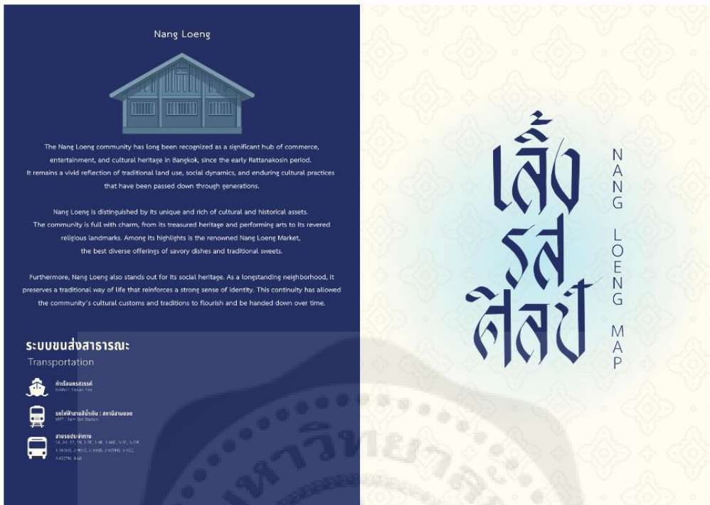
ภาพที่ 2 หน้าปกแผนที่ท่องเที่ยวชุมชนนางเลิ้ง สำหรับพัฒนาเป็นแผ่นพับ