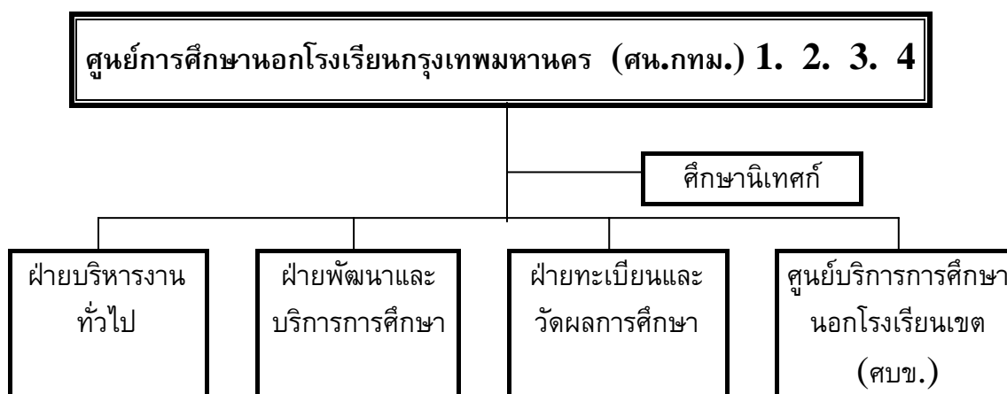
ภาพประกอบ 1 โครงสร้างศูนย์การศึกษานอกโรงเรียนกรุงเทพมหานคร (ศน.กทม.)

ปัจจุบันศูนย์การศึกษานอกโรงเรียนกรุงเทพมหานคร (ศน.กทม.) แบ่งเป็น 4 ศูนย์ และมีหน่วยงานย่อยลงไป ดังโครงสร้างต่อไปนี้ (กรมการศึกษานอกโรงเรียน. 2546ค: ไม่ปรากฏเลขหน้า)