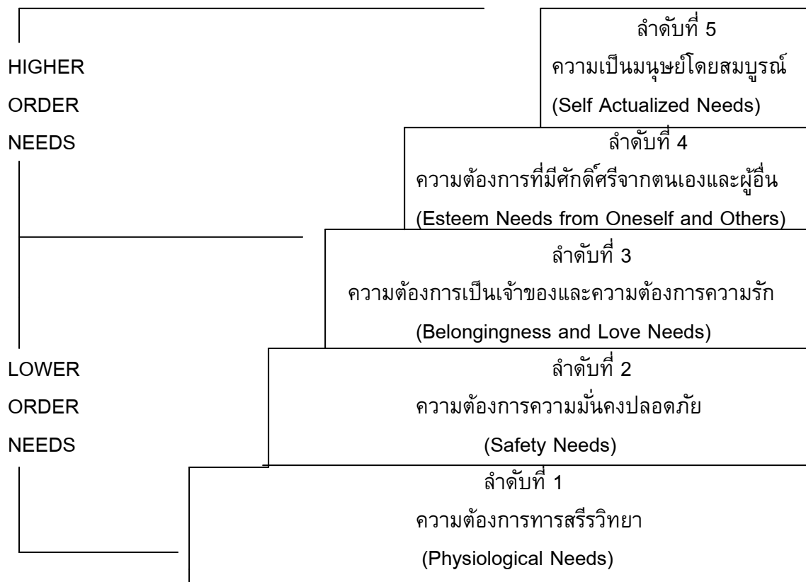
ทฤษฎีลำดับขั้นแรงจูงใจของมาสโลว์ (Maslow)

5. ทฤษฎีลำดับขั้นแรงจูงใจของมาสโลว์ (Maslow. 1970: 35 – 46) เป็นทฤษฎีที่มีชื่อเสียงของมาสโลว์ อธิบายว่า แรงจูงใจของมนุษย์มีลำดับขั้นตอนตั้งแต่ขั้นต่ำจนถึงขั้นสูงมีทั้งหมด 5 ขั้นตอนด้วยกัน คือ ความต้องการทางสรีรวิทยา (Physiological Needs) ความต้องการความปลอดภัย (Safety Needs) ความต้องการเป็นเจ้าของและความต้องการความรัก (Belongingness and Love Needs) ความต้องการมีศักดิ์ศรีจากตนเอง และผู้อื่น (Esteem Needs from Oneself and Others) ความต้องการเป็นมนุษย์โดยสมบูรณ์ (Self Actualized Needs) แรงจูงใจระดับต้นต้องได้รับการตอบสนองก่อน แรงจูงใจลำดับสูงจึงจะพัฒนาตามมาโดยลำดับ