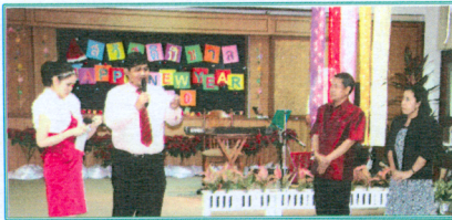
โครงการอนุรักษ์ศิลปวัฒนธรรมไทย “งานวันขึ้นปีใหม่” ส่งท้ายปีเก่าต้อนรับปีใหม่ จัดโดย สำนักงานคณบดีคณะมนุษยศาสตร์ ๓๐ ธันวาคม ๒๕๕๒