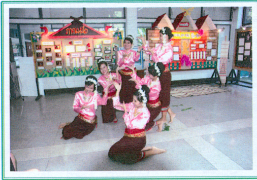
โครงการอนุรักษ์ภาษาถิ่นไทย จัดโดย นิสิตวิชาโทภาษาศาสตร์ ๒๒ ธันวาคม ๒๕๕๒