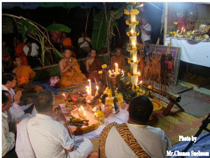
ภาพประกอบ 15

พิธีสงฆ์ พระสงฆ์ที่นิมนต์มาในพิธีมกนิคม จำนวน 5 รูปโดยพิธีในส่วนนี้จะเริ่มขึ้นในเวลาตอนเย็น หรือที่เรียกกันว่า เวลานครุขุมรัง ของวันพฤหัสบดี ในพิธีสงฆ์ครูผู้ประกอบพิธีและศิษย์ที่เข้าร่วมพิธี กราบครูและครอบมือ ตลอดแขกผู้มีเกียรติมาร่วมในพิธีทุกคนร่วมพิธีกรรมทางศาสนาเริ่มด้วยพระสงฆ์ 5 รูปประจำอาสนะสงฆ์แล้วประธานจุดธูปเทียนบูชาพระรัตนตรัย สมทานศีลพระสงฆ์สวดชัยมงคลคาถาจบแล้ว สวดชยันโต ประพรมน้ำพระพุทธมนต์เป็นอันเสร็จพิธีกรรมทางศาสนา สำหรับครูผู้ประกอบพิธี เมื่อจบการสมทานศีลแล้วจะขอลาพระสงฆ์ออกมาทำพิธีขอที่ตรงหน้าโรงหนังตะลุงเสร็จแล้วจึงขึ้นโรงหนังตะลุงซึ่งเหตุผลที่ต้องมีพิธีสงฆ์นั้น ก็เพื่อที่จะให้ผู้เข้าร่วมพิธีทุกคนได้ชำระร่างกายและจิตใจให้มีความบริสุทธิ์ ด้วยการสดับบทสวดและรับน้ำพระพุทธมนต์ก่อนการเข้าพิธีอันสำคัญในลำดับต่อไป