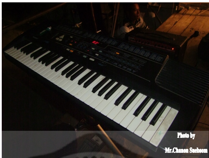
ภาพประกอบ 55 คีย์บอร์ด

คีย์บอร์ด เป็นเครื่องดนตรีประเภทที่มีลักษณะเป็นแป้นแต่ที่กดจะมีลักษณะคล้ายกับเปียโน สร้างเสียงเมื่อคีย์ถูกกด โดย จะมีการผลิตเสียงผ่านกระแสไฟฟ้า โหมดเสียงโดยคีย์บอร์ดจะมีให้เลือกเสียงตั้งแต่เสียง เปียโน , ฮาร์ปซิคอร์ด, กีตาร์, แคลฟวิคอร์ดออร์แกน, ทรอมโบน, ทรัมเป็ต, แซกโซโฟน, กีตาร์เบส, แอคคอร์ดียน และเสียงสังเคราะห์ชนิดต่างๆ