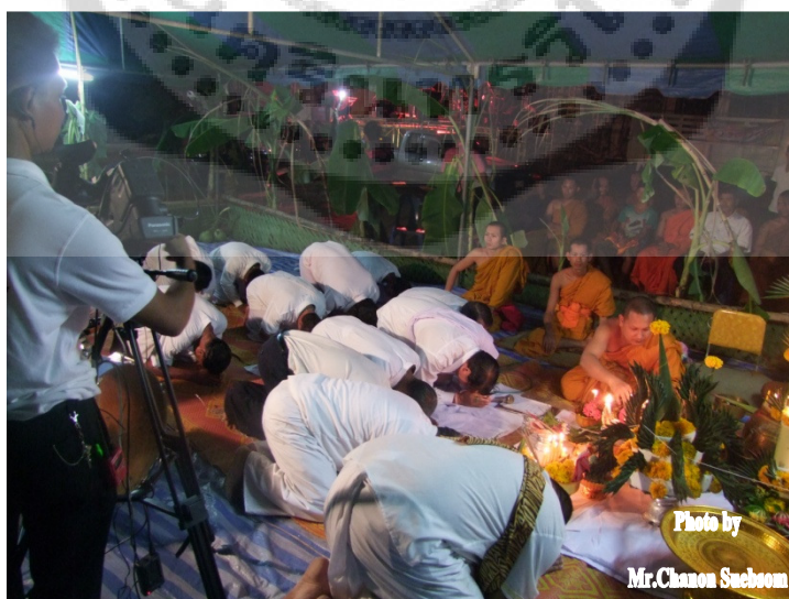
ภาพประกอบ 13