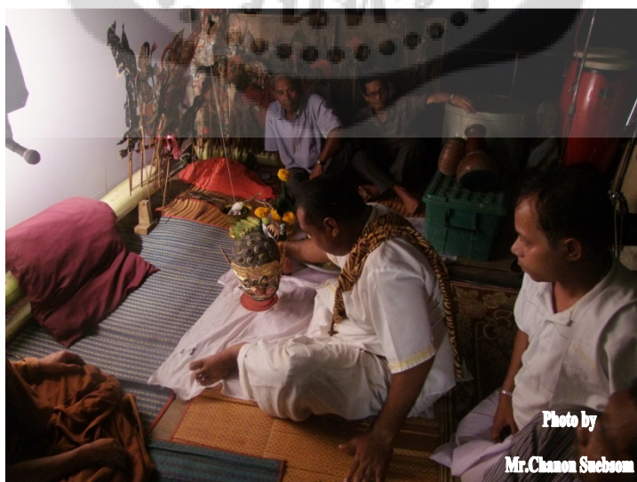
ภาพประกอบ 16

พิธีสงฆ์ พระสงฆ์ที่นิมนต์มาในพิธีมกนิคม จำนวน 5 รูปโดยพิธีในส่วนนี้จะเริ่มขึ้นในเวลาตอนเย็น หรือที่เรียกกันว่า เวลานครุขุมรัง ของวันพฤหัสบดี ในพิธีสงฆ์ครูผู้ประกอบพิธีและศิษย์ที่เข้าร่วมพิธี กราบครูและครอบมือ ตลอดแขกผู้มีเกียรติมาร่วมในพิธีทุกคนร่วมพิธีกรรมทางศาสนาเริ่มด้วยพระสงฆ์ 5 รูปประจำอาสนะสงฆ์แล้วประธานจุดธูปเทียนบูชาพระรัตนตรัย สมทานศีลพระสงฆ์สวดชัยมงคลคาถาจบแล้ว สวดชยันโต ประพรมน้ำพระพุทธมนต์เป็นอันเสร็จพิธีกรรมทางศาสนา สำหรับครูผู้ประกอบพิธี เมื่อจบการสมทานศีลแล้วจะขอลาพระสงฆ์ออกมาทำพิธีขอที่ตรงหน้าโรงหนังตะลุงเสร็จแล้วจึงขึ้นโรงหนังตะลุงซึ่งเหตุผลที่ต้องมีพิธีสงฆ์นั้น ก็เพื่อที่จะให้ผู้เข้าร่วมพิธีทุกคนได้ชำระร่างกายและจิตใจให้มีความบริสุทธิ์ ด้วยการสดับบทสวดและรับน้ำพระพุทธมนต์ก่อนการเข้าพิธีอันสำคัญในลำดับต่อไป