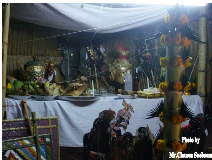
ภาพประกอบ 5

พานครุ เป็นชื่อเรียกสิ่งของที่ผู้เข้าร่วมพิธีไหว้ครูหนังสือตั้ง ผู้เข้ารับการครอบมือหนังสือตั้งจัดนำมามอบให้ครูผู้ประกอบพิธีเป็นเครื่องบูชาครู โดยใช้พานหรือภาชนะอื่นอาทิ จานหรือขัน ใส่เครื่องบูชาครู ประกอบด้วย ดอกไม้ 9 ดอก โดยมากนิยมใช้ดอกที่มีชื่อเป็นมงคล เช่น ดอกดาวเรือง ดอกบานไม่รู้โรย เทียน 9 เล่ม รูป 9 ดอก หมาก พลู 9 คำ กิตราด หมายถึงเงินที่ใช้เป็นเครื่องบูชาครู หรือเงินกำนัลครู ส่วนมากมักนิยมใช้ลงท้ายด้วย 9 อาทิจ สดงศ์ 9 บาท 39 บาท 59 บาท ซึ่งปัจจุบันนิยมใช้จำนวน 399 บาท สำหรับศิษย์ที่เข้าครอบมือ