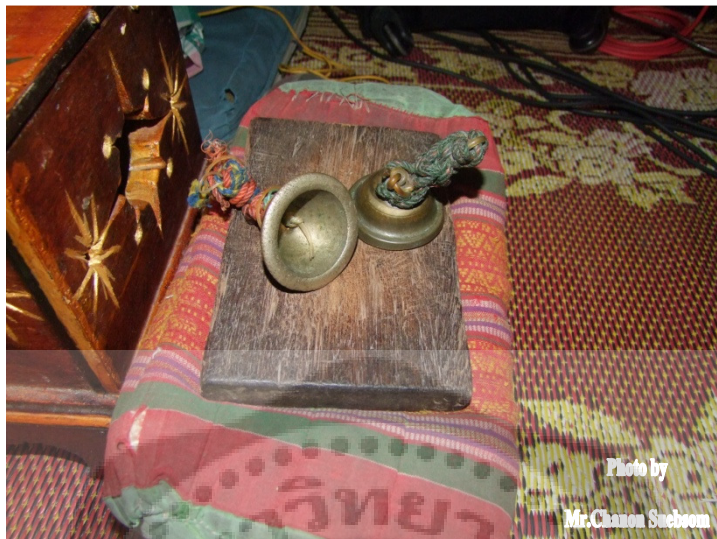
ภาพประกอบ 42 ฉิ่ง