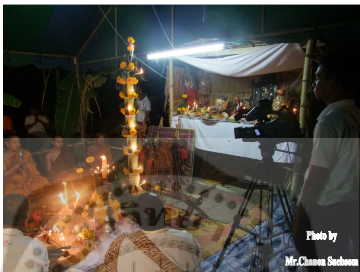
ภาพประกอบ 11

สรรเสริญถึง ครู อาจารย์ ของหนังตะลุง อาทิ ครูฤาษี ครูพิราพหน้าทอง ครูหนังตะลุง เพื่อเชิญมารับเครื่องสังเวย อีกทั้งเชื้อเชิญอำนาจ อานุภาพของครู อาจารย์สิ่งศักดิ์สิทธิ์พระพุทธรูป พระธรรมคุณ พระสังฆคุณ ให้มาประจำในมณฑลพิธี ตลอดจนเชิญให้เข้าสิงสถิตอยู่ในตัวของครูผู้ประกอบพิธี อันจะได้เป็นผู้นำประกอบพิธีไหว้ครู เสร็จแล้วจึงถวายเครื่องเช่นสังเวย ลาเครื่องเช่นสังเวยและเช่นรูปเป็นอันเสร็จพิธี