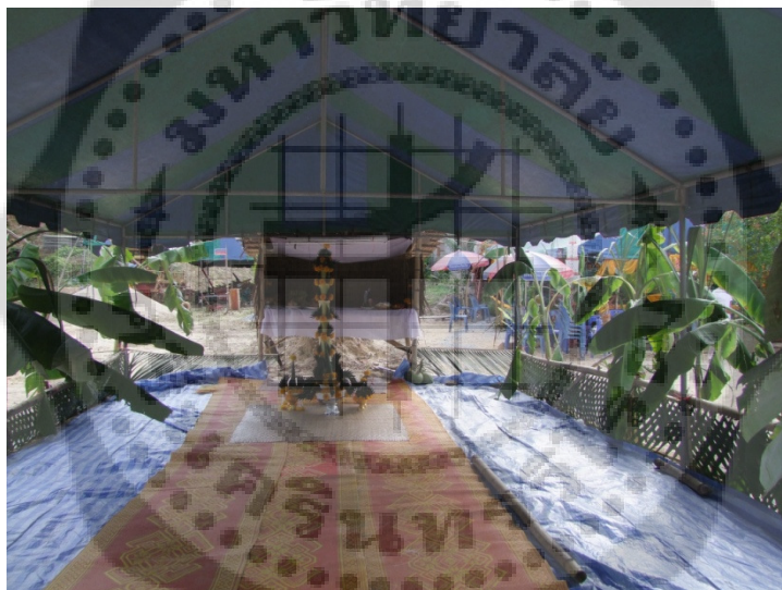
ภาพประกอบ 4

1.50 เมตร ยาว 2.50 เมตร ด้านหน้าใช้ผ้าขาวบางจึงเป็นจอ จอกว้างและยาวประมาณ 5 x 10 ฟุต ในโรงมี ตะเกียงน้ำมันไขสัตว์หรือตะเกียงน้ำมันมะพร้าว หรือตะเกียงเจ้าพายุหรือดวงไฟแขวนไว้ใกล้จอสูงจากพื้นราว 1 ฟุตเศษและห่างจากจอราว 1 ศอก นอกจากนี้ยังมีต้นกล้วยวางไว้ข้างฝาทั้งสองข้างของโรง เพื่อไว้ปักพักรูปหนัง ประเภทรูปเบ็ดเตล็ด ส่วนบนเพดานโรงจะมีเชือกขึงไว้สำหรับแขวนรูปหนังประเภทรูปที่สำคัญ ซึ่งมีรูปพระรูปนางเป็นต้น สำหรับจอหนัง ทำด้วยผ้าขาว รูปสี่เหลี่ยมขนาดประมาณ 1.8 x 2.3 เมตร ทั้ง 4 ด้านมอบริมด้วยผ้าสี เช่น แดง น้ำเงิน ขนาดกว้าง 4 - 5 นิ้ว มีห่วงผ้าเรียกว่า หูรามเย็บไว้เป็นระยะโดยรอบ หูรามแต่ละอันจะผูกเชือกยาวประมาณ 2 ฟุต 5 นิ้ว เรียกว่า หนวดราม สำหรับผูกขึงไปประมาณ 1 ฟุตจะดี ตะเกียงนับว่าเป็นเส้นแบ่งแดนกับแดนมนุษย์ เวลาเชิดรูปมีเฉพาะรูปฤาษี เทวดา และรูปที่มีฤทธาภาพเท่านั้นที่เชิดเลยเส้นนี้ได้ การสร้างโรงหนังตะลุงและจัดเตรียมสถานที่ในการประกอบพิธีไหว้ครู โดยนักดนตรีในวงหนังตะลุงจะเป็นผู้สร้างโรงหนังและจัดเตรียมสถานที่บริเวณโรงแสดงหนังตะลุง เป็นสถานที่ประกอบพิธี