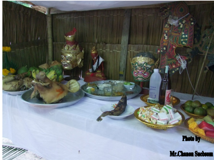
ภาพประกอบ 21