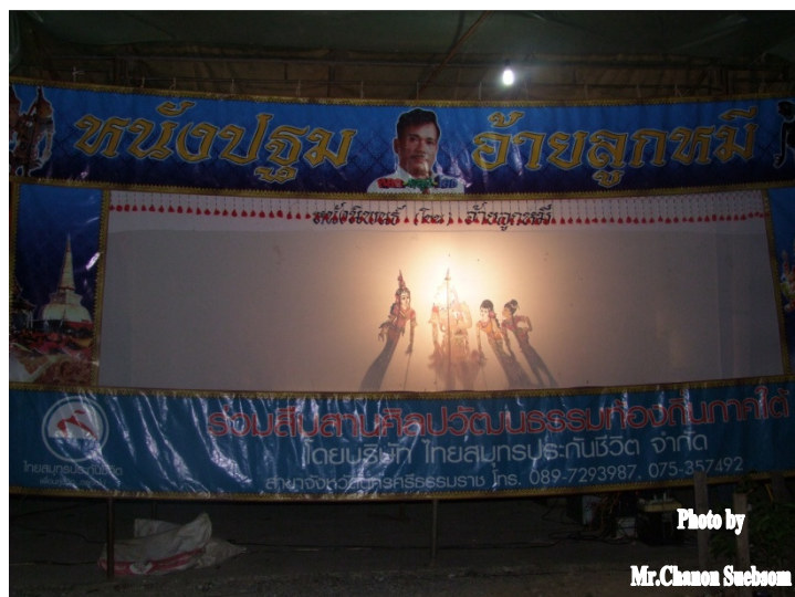
ภาพประกอบ 20

หนังปฐมอ้ายลูกหมี่และลูกศิษย์ที่รับการครอบมือทำการแสดงเพื่อทำความเคารพและรำลึกถึงครูบาอาจารย์ที่สั่งสอนและเพื่อให้ผู้ที่มาในพิธีได้รับชมหนังตะลุง ผู้ชมส่วนมากเป็นลูกศิษย์ของครูหนังตะลุงผู้ประกอบพิธีไหว้ครูและพิธีครอบมือและแขกผู้มีเกียรติที่ให้ความเคารพและศรัทธาต่อครูหนังตะลุง ส่วนผู้เข้าร่วมพิธีทุกคนจะต้องแต่งกายชุดสีขาวเพื่อแสดงให้เห็นว่าเป็นผู้มีจิตใจที่บริสุทธิ์ผุดผ่องและพร้อมพิธีไหว้ครูและรับครอบมือและแสดงความกตัญญูต่อครู อาจารย์