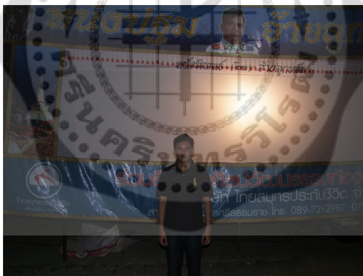
โรงหนังตะลุงคณะหนังปฐมอ้ายลูกหมี่