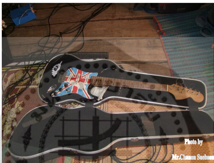
ภาพประกอบ 49 กีตาร์ไฟฟ้า

กีตาร์ไฟฟ้า เป็นเครื่องดนตรีประเภทเครื่องสาย โครงสร้างของกีตาร์ สายกีตาร์ทำด้วยเหล็กบริเวณด้านล่างของปลายสายข้างหนึ่งซึ่งเรียกว่า ขดลวดรับเสียง (pick-up coil) ติดตั้งไว้จากหลักการเหนี่ยวนำแม่เหล็ก เมื่อสายกีตาร์สั่น เส้นแรงแม่เหล็กจะเกิดการเปลี่ยนแปลงไปด้วย การเปลี่ยนแปลงของเส้นแรงแม่เหล็กนี้เมื่อผ่านขดลวดรับเสียงจะเหนี่ยวนำให้เกิดกระแสไฟฟ้าตามความถี่ของเสียงที่สอดคล้องกัน กระแสไฟฟ้าที่จะผ่านไปยังเครื่องขยายเสียงทำให้เกิดเสียงออกมา