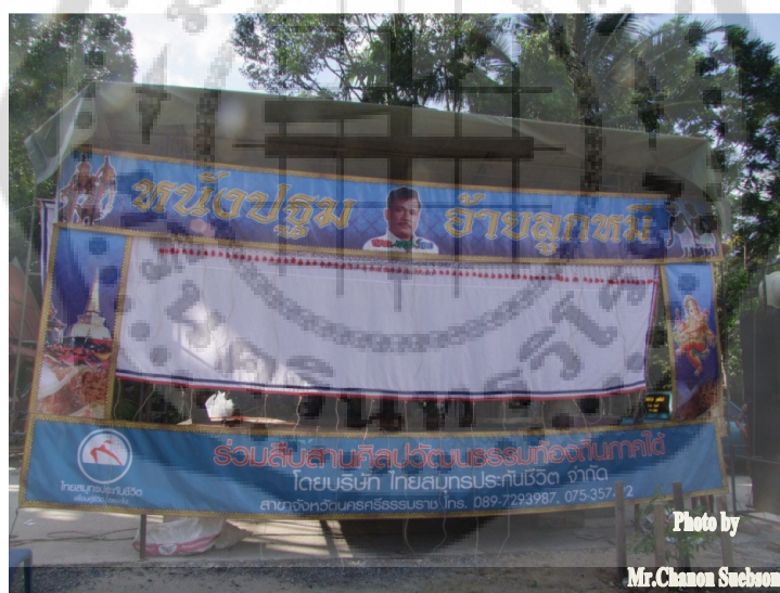
ภาพประกอบ 3

โรงหนังตะลุงที่ใช้เป็นสถานที่ประกอบพิธีไหว้ครูหนังตะลุง การปลูกสร้างโรงหนังควรมีความเหมาะสมกับสภาพของงาน กล่าวคือ หากมีผู้เข้าร่วมประกอบพิธีไหว้ครูหรือครอบมือจำนวนมากโรงก็อาจจะต้องปรับเปลี่ยนให้มีขนาดใหญ่กว่าโรงหนังตะลุงที่ปลูกสร้างแบบเดิมกล่าวคือปลูกเป็นแบบชั่วคราว สูงจากพื้นประมาณ 1.50 เมตร ตัวโรงพื้นที่ประมาณ 9-10 ตารางเมตร โรงและอุปกรณ์ประกอบโรงหนังตะลุง ต้องยกเสา 4 เสา (ใช้ไม้ค้ำเพิ่มจากเสาได้) พื้นยกสูงเลยศีรษะผู้ใหญ่เล็กน้อย และให้ลาดต่ำไปข้างหน้านิดหน่อย หลังคาเป็นแบบเพิงหมาแหงน กั้นด้านข้างและด้านหลังอย่างหยาบๆ ด้านหลังทำช่องประตูพาดบันไดขึ้นโรง ส่วนฝานิยมกั้นด้วยทางมะพร้าวหรือวัสดุอื่นๆที่หาได้ง่ายในท้องถิ่น หลังคาทำแบบเพิงหมาแหงนมาจาก เสาทำด้วยไม้หมากพื้นทำด้วยไม้ฟากซึ่งผ่าจากไม้หมากให้เป็นซีกหรือไม้กระดาน เมื่อจะทำการแสดงใช้เสาค้ำ (เสื่อทำด้วยค้ำ) ทุบฟากอีกชั้นหนึ่งแต่การปรับเปลี่ยนไปตามสภาพสังคม กล่าวคือ จะใช้แบบโรงสำเร็จรูปที่ใช้เหล็กเป็นส่วนประกอบแทนไม้และใช้ผ้าเต็นท์มุงหลังคาแทนจาก ก่อนที่จะลงมือปลูกสร้างโรงหนังตะลุง ต้องเลือกพื้นที่ที่เหมาะสมเพราะมีข้อห้ามตามความเชื่อมากมายเป็น ต้นว่าห้ามหันไปทางทิศตะวันตกหรือที่เศษศพ ห้ามปลูกโรงค่อมกัณหา ตอ หรือ แอ่งน้ำ และห้ามปลูก ระหว่างต้นไม้ใหญ่ถ้าละเมิดห้ามแล้วจะถือว่าเป็นสิริมงคล