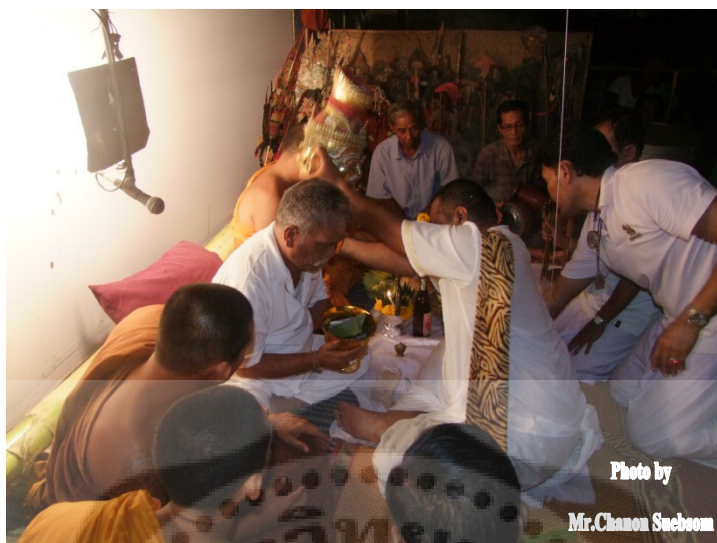
ภาพประกอบ 17

การทำพิธีส่งครูลงโรง ซึ่งในพิธีนี้จะมีนายหนังแค่เพียงหนึ่งคนเป็นผู้ทำพิธี นายหนังจะนั่งต่อหน้าโต๊ะหมู่บูชาและกล่าววาทต่อพ่อแก่ ซึ่งเชื่อว่าเป็นครูหนังตะลุงคนแรก