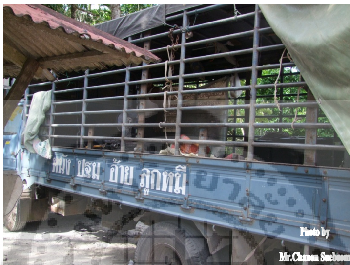
ภาพประกอบ 1

รถบรรทุก 6 ล้อสำหรับหนังตะลุงคณะปฐมอ้ายลูกหมี่ ไว้เพื่อสำหรับบรรทุกส่วนประกอบของการสร้างเวที อุปกรณ์ที่ใช้ในพิธีไหว้ครูและเครื่องดนตรีทั้งหมด