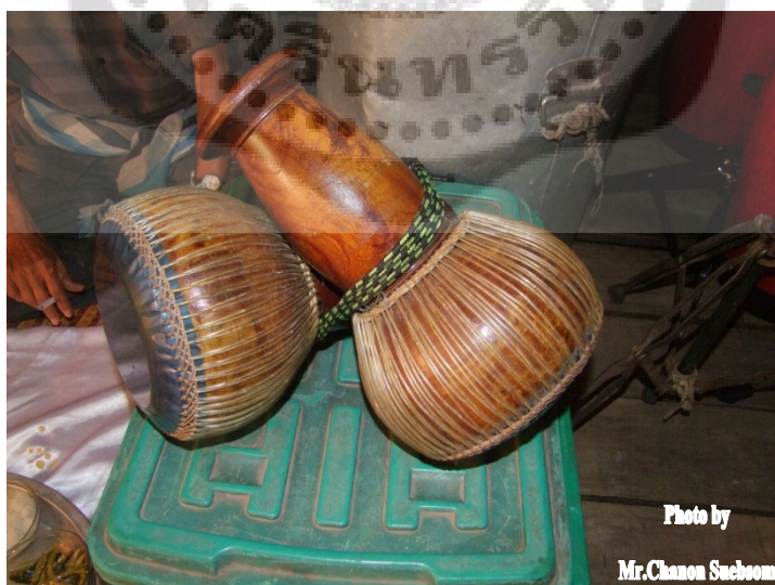
ภาพประกอบ 44 ทับ