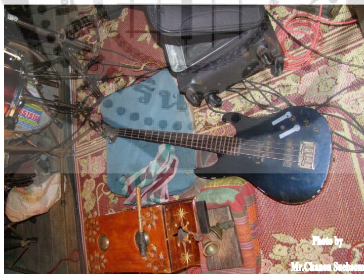
ภาพประกอบ 50 กีตาร์เบสไฟฟ้า

กีตาร์เบสไฟฟ้า เป็นเครื่องดนตรีประเภทสาย โครงสร้างของกีตาร์เบส สายกีตาร์เบสทำด้วยเหล็ก บริเวณด้านล่างของปลายสายข้างหนึ่งซึ่งเรียกว่า ขดลวดรับเสียง ติดตั้งไว้จากหลักการเหนี่ยวนำแม่เหล็ก เมื่อสายกีตาร์สั่น เส้นแรงแม่เหล็กจะเกิดการเปลี่ยนแปลงไปด้วย การเปลี่ยนแปลงของเส้นแรงแม่เหล็กนี้เมื่อผ่านขดลวดรับเสียงจะเหนี่ยวนำให้เกิดกระแสไฟฟ้าตามความถี่ของเสียงที่สอดคล้อง