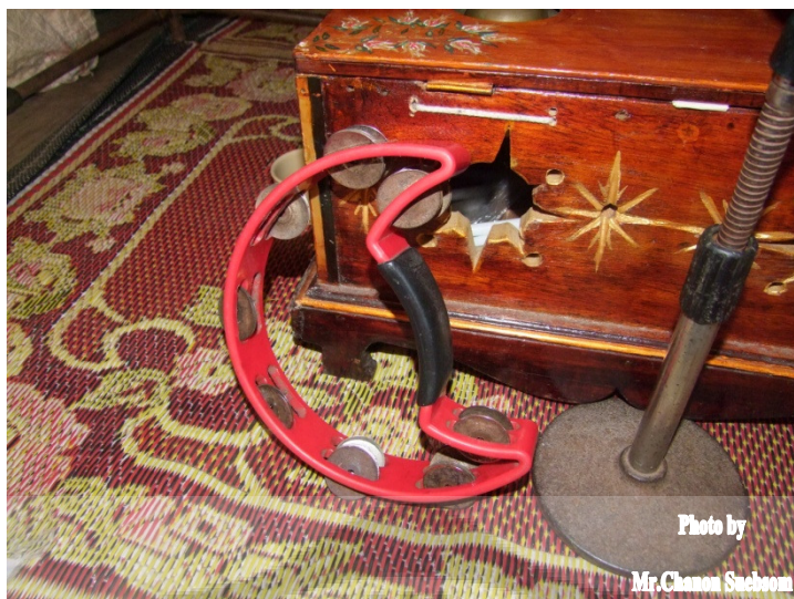
ภาพประกอบ 45 แทมบูริน

แทมบูริน เป็นเครื่องดนตรีประเภทตีกระทบจังหวะ ประกอบด้วยขอบกลมเหมือนขอบกลองขนาดเล็กประมาณ 10 นิ้ว ขอบอาจทำด้วยไม้ พลาสติก หรือโลหะ รอบ ๆ ขอบติดด้วยแผ่นโลหะประกบกัน 2 แผ่น ใช้การตีกระทบกับฝ่ามือหรือส้นเข่าให้เกิดเสียงดังกรู๊งกรู๊งเพื่อประกอบจังหวะให้เกิดความสนุกสนานสดชื่น แทมบูรินที่ใช้ในหนังตะลุงมีเส้นผ่านศูนย์กลาง 22 เซนติเมตร ความสูงวัดจากขอบ 5 เซนติเมตร