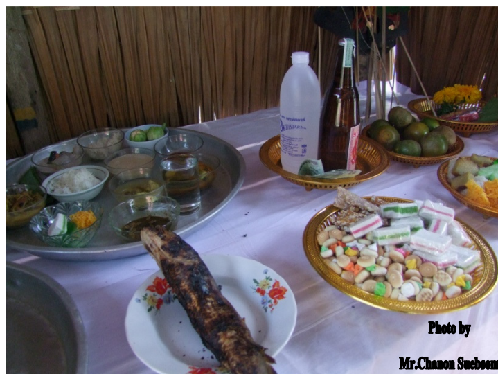
ภาพประกอบ 25

18.ปลา่างมีหัวมีหาง ใช้ทำการเซ่นไหว้ซึ่งถือว่าหากได้เซ่นไหว้ปลา่างมีหัวมีหางแล้วจะมี ล่องลอยเวียนวนผู้ชมจะชอบการแสดง เปรียบเสมือนการพูดที่ไพเราะน่าฟัง