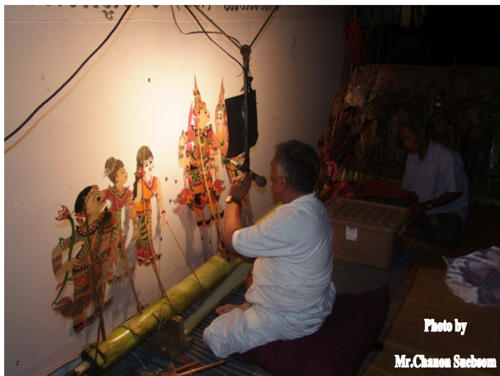
ภาพประกอบ 19

ในการแสดงหนังตะลุงจะใช้ต้นกล้วยอย่างน้อย 2 ต้น ต้นแรกจะตั้งไว้หลังจอหนังตรงหน้านายหนังไว้สำหรับปักรูปขณะดำเนินการแสดง อีกต้นหนึ่งค้ำไว้ที่ด้านข้างของโรง นิยมตั้งไว้ด้านขวาของตัวหนัง โดยแผงหนังวางติดผนังแล้วปักรูปไว้บนต้นกล้วย ติดแผงเตรียมไว้หยิบไปใช้แสดงตามเรื่อง ขั้นตอนนี้เรียกว่าแตกแผง