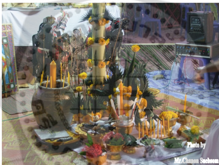
ภาพประกอบ 7

พิธี การขึ้นโรง หลังจากที่ขอที่จากพระภูมิเจ้าที่หน้าโรงหนังตะลุงแล้ว ครูผู้ประกอบพิธีจะเดินไปข้างหลังโรงหนังตะลุง โดยก่อนที่จะขึ้นโรงหนังครูผู้ประกอบพิธีจะกล่าวคำทักทายเจ้าโรงขึ้นก่อนว่าตัวเจ้าโรงท่านยังหรือ ยัง สังขาดังโลกัง ชนानीติ โลกะวิฑู ข้าพเจ้าจะขอเข้าโรงหนังเพื่อทำพิธีในคืนนี้ ขอให้มิมงคล ทำอะไรให้สมความปรารถนาของข้าพเจ้าเถิด จากนั้นก็จะสังเกตทางศูนย์จันทร์ หมายถึงสังเกตระบบการหายใจว่าจุมูกทางข้างใดหายใจคล่องหากข้างใดหายใจคล่องก็ให้อาเท้าข้างนั้นเหยียบบันไดโรงหนังก่อนแล้วขึ้นไปบนโรงหนัง ขณะย่างเท้าขึ้นโรงหนังต้องบริกรรมคาถาว่า ออ หนอ พระพุทฺธัง ยุค พระอะระหัง ออ หนอ พระธัมมัง ยุคพระอะระหัง ออ หนอ พระสังฆัง ยุคพระอะระหัง สัมมาสัมพุทฺธโ จากนั้นจึงกลับมาส่งมือรับศิษย์ที่จะเข้าครอบมือขึ้นตามไปบนโรง พิธีขอที่ เป็นการบอกกล่าวต่อพระภูมิเจ้าที่ โดยหลังจากครูผู้ประกอบพิธีไหว้ครูสมาทานศีลแล้ว ก็จะลาพระออกสงฆ์ไปจัดรูป เทียน บอกกล่าวตรงหน้าโรงหนังตะลุง จากนั้นจึงไปขึ้นโรงหนังตะลุง