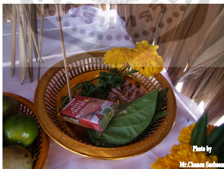
ภาพประกอบ 26

19.1ข้าวสวย (ข้าวปากหม้อ) ใช้สำหรับเซ่นบูชาครู 19.2 แกงกะทิไ้กับหยวกกล้วย 19.3ต้มกะทิหยวก กล้วย 19.4 ต้มกระตูดกหมักกับผักกาดดอง 19.5 แกงไตปลา 19.6 ผักสด 19.7ขนมหวานข้าวเหนียวน้ำทุเรียน 19.8 วุ้นกะทิกับฝอยทอง 19.9 น้ำดื่ม