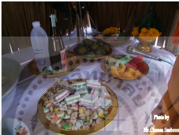
ภาพประกอบ 24