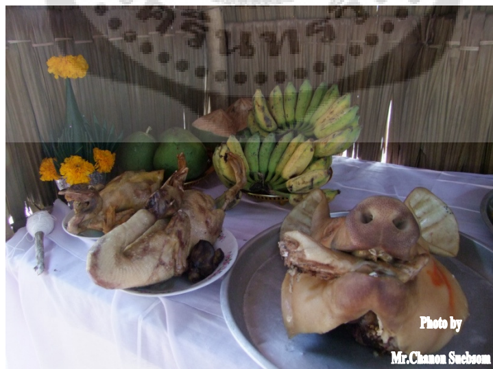
ภาพประกอบ 23