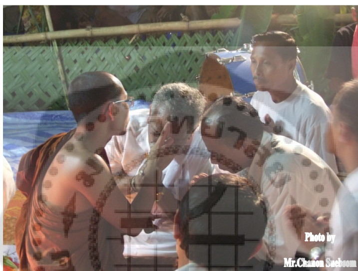
ภาพประกอบ 14

พิธีกราบครู การกราบครูเริ่มจากครูผู้ประกอบพิธีนำศิษย์กราบครู 3 ครั้ง การกราบครูของหนังตะลุง จะมีความแตกต่างไปจากการกราบทั่วไป กล่าวคือ เริ่มด้วยการยื่นประนมมือ จากนั้นกล่าวคำบูชาครูพิราพ หน้าทองว่า อินิมา สักกาเรนะ ครูพิราพหน้าทอง ทัสสะ ปุเชมิ 1 เที้ยว จบแล้วนั่งคุกเข่าลงกราบเบญจางคประดิษฐ์ จากนั้นจึงลุกขึ้นยืน โดยเอามือลูจากเท้า ขา สะเอว ลำตัว เมื่อถึงหน้าอกก็ให้เอามือทั้งสองไขว้กัน แล้วประนมมือไหว้ดังเดิม จากนั้นกล่าวคำบูชาครูพิราพหน้าทอง ปฏิบัติเช่นนี้จนครบ 9 ครั้ง ถือว่าเสร็จพิธีกราบครู หากมีผู้กราบครูจำนวนมาก ก็อาจให้ผู้ที่เป็นผู้ช่วยหรือนายหนังตะลุงที่ผ่านพิธีครอบมือมาก่อนแล้วเป็นผู้นำกราบครู