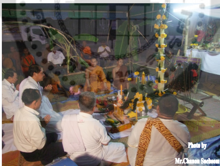
ภาพประกอบ 10

การจุดเทียนชัย ประธานในพิธีจุดเทียนชัย เทียนยอดบายศรี เพื่อเป็นการสักการะสิ่งศักดิ์สิทธิ์ ขณะจุดเทียน คนตรีบรรเลงเพลงสาธุการ พระสงฆ์สวดชัยมงคลคาถา การบูชารัตนตรัย บูชาเทวดาและเสกน้ำมนต์ ครูผู้ประกอบพิธีเริ่มบูชาพระรัตนตรัย จบแล้วกล่าวบทชุมนุมเทวดาร่ายบทธรณีสาร เสกน้ำมนต์ เสกแป้งกระแจะพิธีเชิญครู คนตรีบรรเลงเพลงมหากุญ