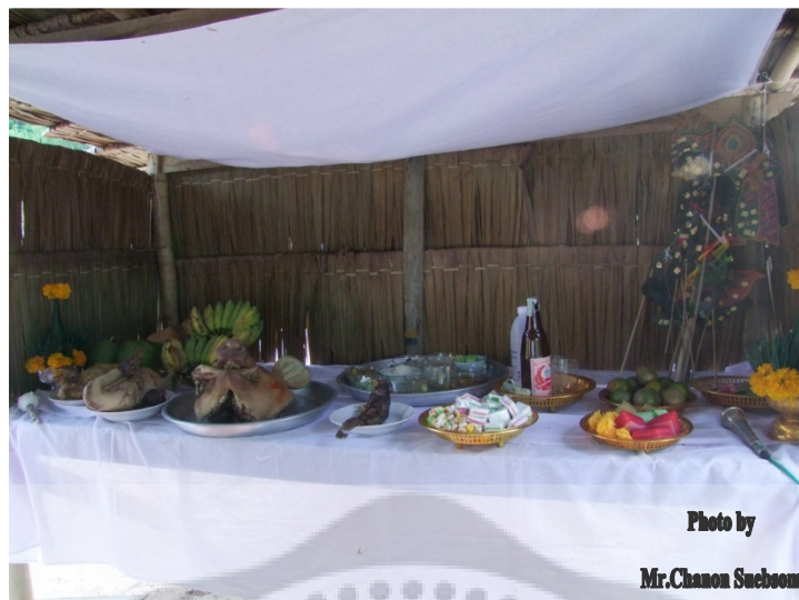
ภาพประกอบ 27

21.หมาก พลุ ดอกดาวเรือง เป็นเครื่องเซ่นไหว้บรรพบุรุษและบรมครูตะลุง