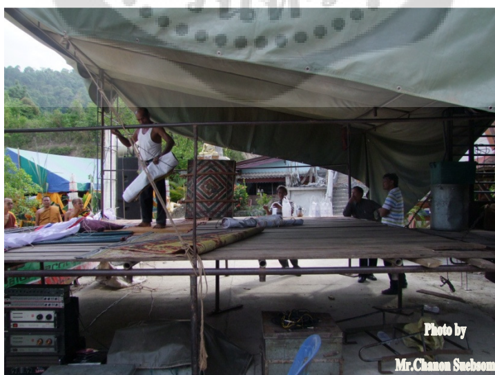
ภาพประกอบ 2

รถบรรทุก 6 ล้อสำหรับหนังตะลุงคณะปฐมอ้ายลูกหมี่ ไว้เพื่อสำหรับบรรทุกส่วนประกอบของการสร้างเวที อุปกรณ์ที่ใช้ในพิธีไหว้ครูและเครื่องดนตรีทั้งหมด