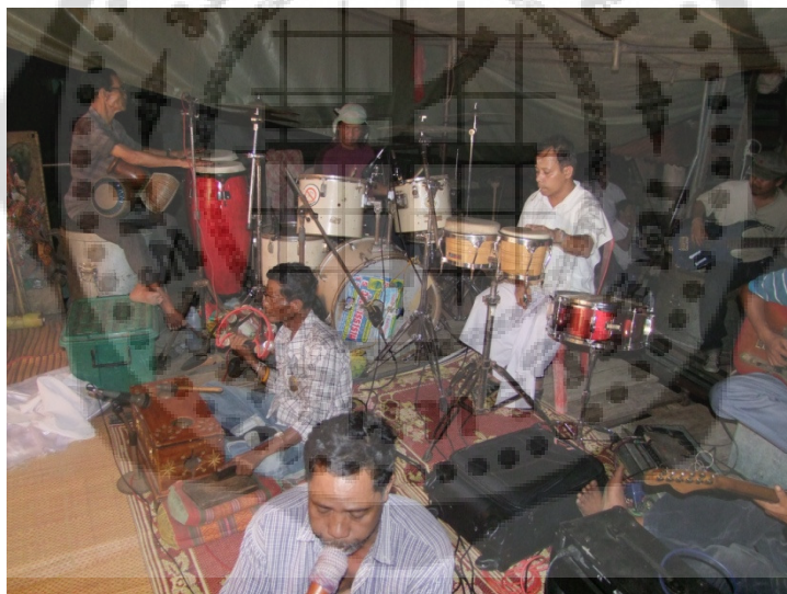
นักดนตรีบรรเลงในขณะที่ทำพิธีครอบครู