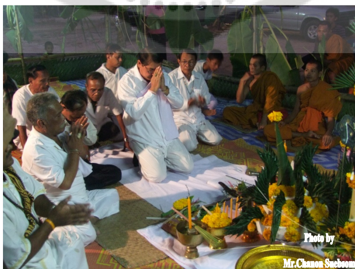
ภาพประกอบ 12

ปะรำพิธีสงฆ์ เป็นส่วนที่จัดแยกออกจากส่วนของโรงหนังตะลุง แต่จะอยู่บริเวณใกล้เคียงกัน โดยปลูกสร้างอยู่ทางด้านขวา ทิศใต้ ของโรงหนังตะลุงที่ใช้ประกอบพิธีไหว้ครูหนังตะลุง ภายในปะรำพิธีสงฆ์ จัดยกพื้นให้มีความสูงพอประมาณ ปลูกเสื่อและอาสนะสงฆ์จำนวน 5 ที่ ส่วนหัวสุดของพื้นที่ยกขึ้นจัดวางโต๊ะหมู่บูชา พระพุทธรูป แจกัน ดอกไม้ รูปเทียน โยงสายสิญจน์จากพระพุทธรูปมาวนหม้อน้ำมนต์