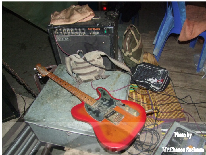
ภาพประกอบ 48 กีตาร์ไฟฟ้า

กีตาร์ไฟฟ้า เป็นเครื่องดนตรีประเภทเครื่องสาย โครงสร้างของกีตาร์ สายกีตาร์ทำด้วยเหล็กบริเวณด้านล่างของปลายสายข้างหนึ่งซึ่งเรียกว่า ขดลวดรับเสียง (pick-up coil) ติดตั้งไว้จากหลักการเหนี่ยวนำแม่เหล็ก เมื่อสายกีตาร์สั่น เส้นแรงแม่เหล็กจะเกิดการเปลี่ยนแปลงไปด้วย การเปลี่ยนแปลงของเส้นแรงแม่เหล็กนี้เมื่อผ่านขดลวดรับเสียงจะเหนี่ยวนำให้เกิดกระแสไฟฟ้าตามความถี่ของเสียงที่สอดคล้องกัน กระแสไฟฟ้าที่จะผ่านไปยังเครื่องขยายเสียงทำให้เกิดเสียงออกมา