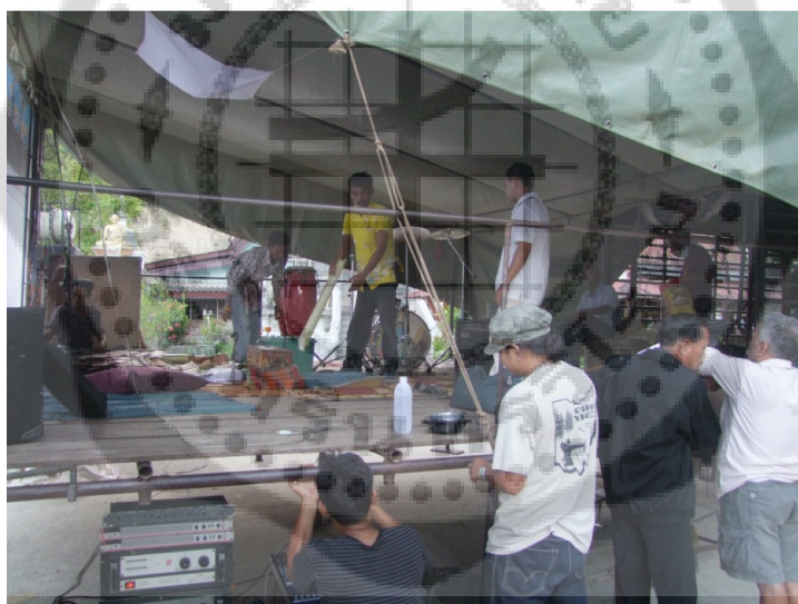
นักดนตรีในวงหนังปฐมอายุลูกหมีช่วยกันจัดตั้งเวทีและเครื่องดนตรี