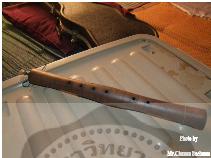
ภาพประกอบ 47 ปี่นอก

ปี่นอก 1 เล่าเป็นเครื่องดนตรีประเภทเครื่องเป่าเพียงชิ้นเดียวของวง ปี่นอกเป็นปี่ที่มีเสียงสูงสุดในบรรดาเครื่องเป่าตระกูลปี่ ลักษณะมีขนาดเล็กและเสียงแหลม ปี่นอกที่ใช้ในหนังตะลุงมีความยาวประมาณ 31 เซนติเมตร มีความกว้างประมาณ 3.5 เซนติเมตร มีลักษณะบานหัวบานท้ายเช่นเดียวกับปี่ใน บริเวณเลาปี่ที่ป่องเจาะรู 6 รู หนังตะลุงนิยมใช้ปี่เสียงสูงที่มีระดับเสียงเข้ากับเสียงโหม่งทางภาคใต้นิยมเรียกว่า ปี่ยอด ตัวปี่ทำจากไม้ชมพู ไม้ประดู่ก็นิยม ปากปี่ทำด้วยใบตาลหรือใบลาน