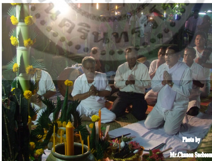
ภาพประกอบ 6

พานครุ เป็นชื่อเรียกสิ่งของที่ผู้เข้าร่วมพิธีไหว้ครูหนังสือตั้ง ผู้เข้ารับการครอบมือหนังสือตั้งจัดนำมามอบให้ครูผู้ประกอบพิธีเป็นเครื่องบูชาครู โดยใช้พานหรือภาชนะอื่นอาทิ จานหรือขัน ใส่เครื่องบูชาครู ประกอบด้วย ดอกไม้ 9 ดอก โดยมากนิยมใช้ดอกที่มีชื่อเป็นมงคล เช่น ดอกดาวเรือง ดอกบานไม่รู้โรย เทียน 9 เล่ม รูป 9 ดอก หมาก พลู 9 คำ กิตราด หมายถึงเงินที่ใช้เป็นเครื่องบูชาครู หรือเงินกำนัลครู ส่วนมากมักนิยมใช้ลงท้ายด้วย 9 อาทิจ สดงศ์ 9 บาท 39 บาท 59 บาท ซึ่งปัจจุบันนิยมใช้จำนวน 399 บาท สำหรับศิษย์ที่เข้าครอบมือ