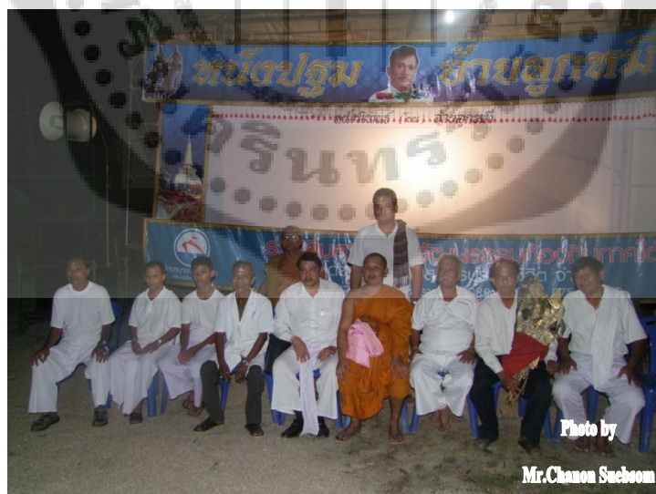
ภาพประกอบ 21

หนังปฐมอ้ายลูกหมี่และลูกศิษย์ที่รับการครอบมือทำการแสดงเพื่อทำความเคารพและรำลึกถึงครูบาอาจารย์ที่สั่งสอนและเพื่อให้ผู้ที่มาในพิธีได้รับชมหนังตะลุง ผู้ชมส่วนมากเป็นลูกศิษย์ของครูหนังตะลุงผู้ประกอบพิธีไหว้ครูและพิธีครอบมือและแขกผู้มีเกียรติที่ให้ความเคารพและศรัทธาต่อครูหนังตะลุง ส่วนผู้เข้าร่วมพิธีทุกคนจะต้องแต่งกายชุดสีขาวเพื่อแสดงให้เห็นว่าเป็นผู้มีจิตใจที่บริสุทธิ์ผุดผ่องและพร้อมพิธีไหว้ครูและรับครอบมือและแสดงความกตัญญูต่อครู อาจารย์