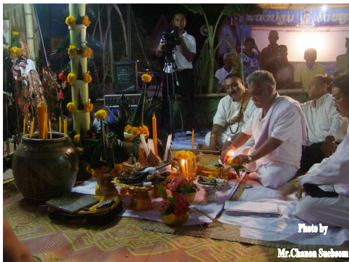
ภาพประกอบ 9

การจุดเทียนชัย ประธานในพิธีจุดเทียนชัย เทียนยอดบายศรี เพื่อเป็นการสักการะสิ่งศักดิ์สิทธิ์ ขณะจุดเทียน คนตรีบรรเลงเพลงสาธุการ พระสงฆ์สวดชัยมงคลคาถา การบูชารัตนตรัย บูชาเทวดาและเสกน้ำมนต์ ครูผู้ประกอบพิธีเริ่มบูชาพระรัตนตรัย จบแล้วกล่าวบทชุมนุมเทวดาร่ายบทธรณีสาร เสกน้ำมนต์ เสกแป้งกระแจะพิธีเชิญครู คนตรีบรรเลงเพลงมหากุญ