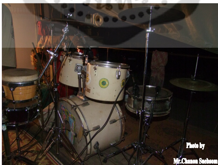
ภาพประกอบ 46 กลองชุด