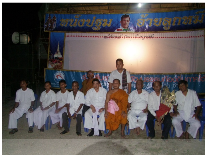
นายหนังร่วมถ่ายรูปเป็นที่ระลึก