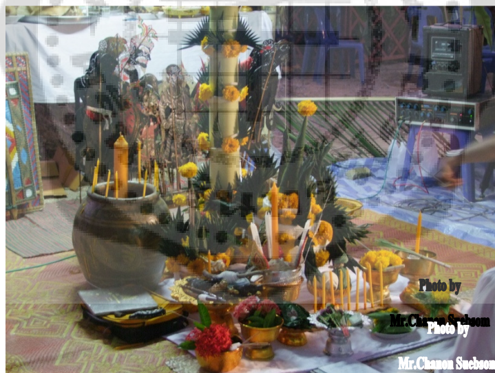
ภาพประกอบ 28

22.ผ้าขาวทำพาดานหนึ่งผืน ใช้กราบครูหนึ่งผืน