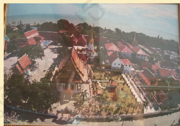
ภาพถ่ายบริเวณวัดจากมุมสูง

โดยในพิพิธภัณฑ์จะเก็บของที่ได้รับ มอบมา ทั้งจากชาวบ้านและหน่วยงานรัฐ พวกเราตื่นเต้นกับสิ่งของในพิพิธภัณฑ์ มาก เพราะแต่ละชิ้นล้วนมีที่มาแตกต่างกัน และน่าสนใจ