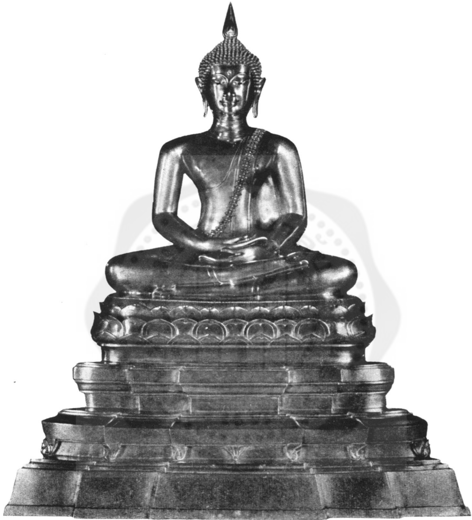
ปางที่ ๑๐ สมาธิ หรือ ตรัสรู้ (พระพุทธรูปปางสมาธิ ในพิพิธภัณฑ์สถานแห่งชาติ)