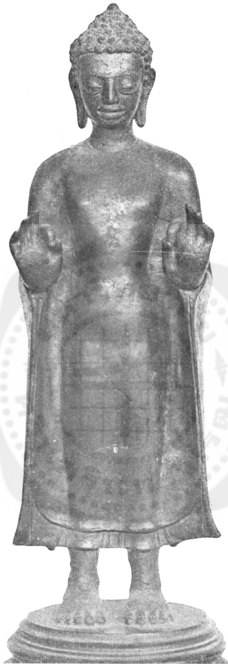
ปางที่ ๓๒ เสด็จลงจากดาวดึงส์ (ในพระที่นั่งอัมพรสถาน พระราชวังดุสิต)