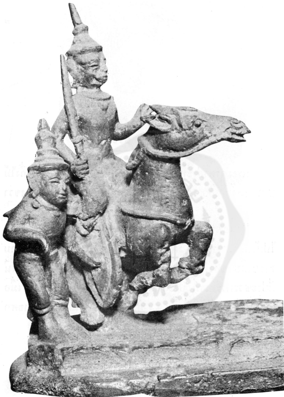
ปางที่ ๒ มหาพิเนชกรมณ (ในพิพิธภัณฑสถานแห่งชาติ)