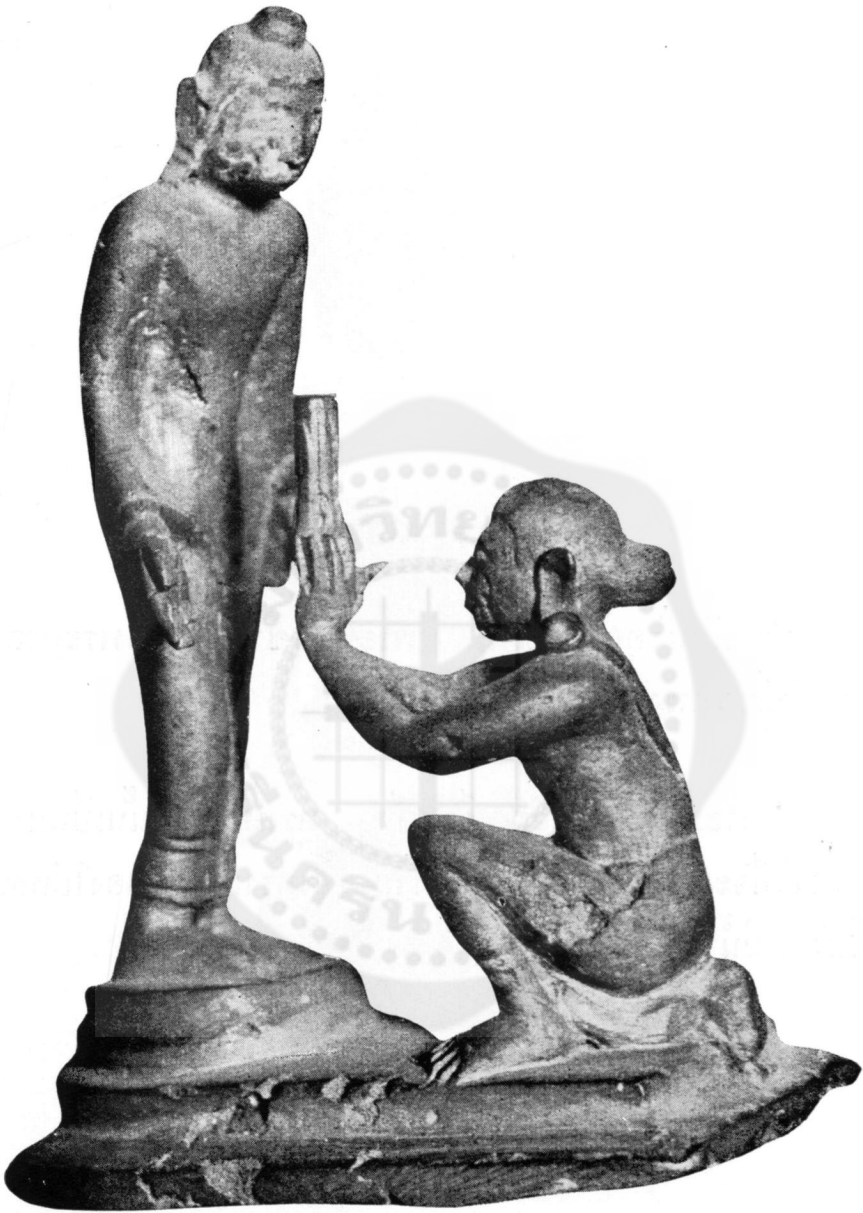
ปางที่ ๘ ทรงรับหญ้าคา (ในพิพิธภัณฑ์สถานแห่งชาติ)