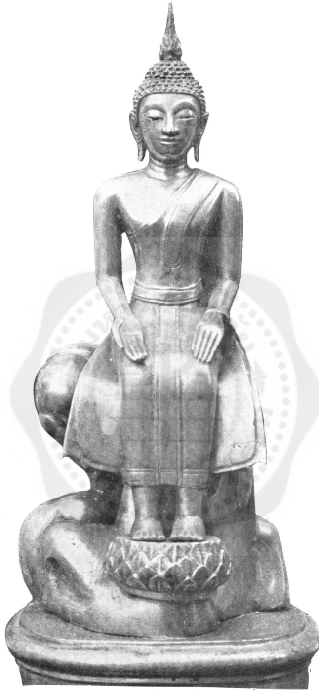
ปางที่ ๓๕ ปาเลไลยก์