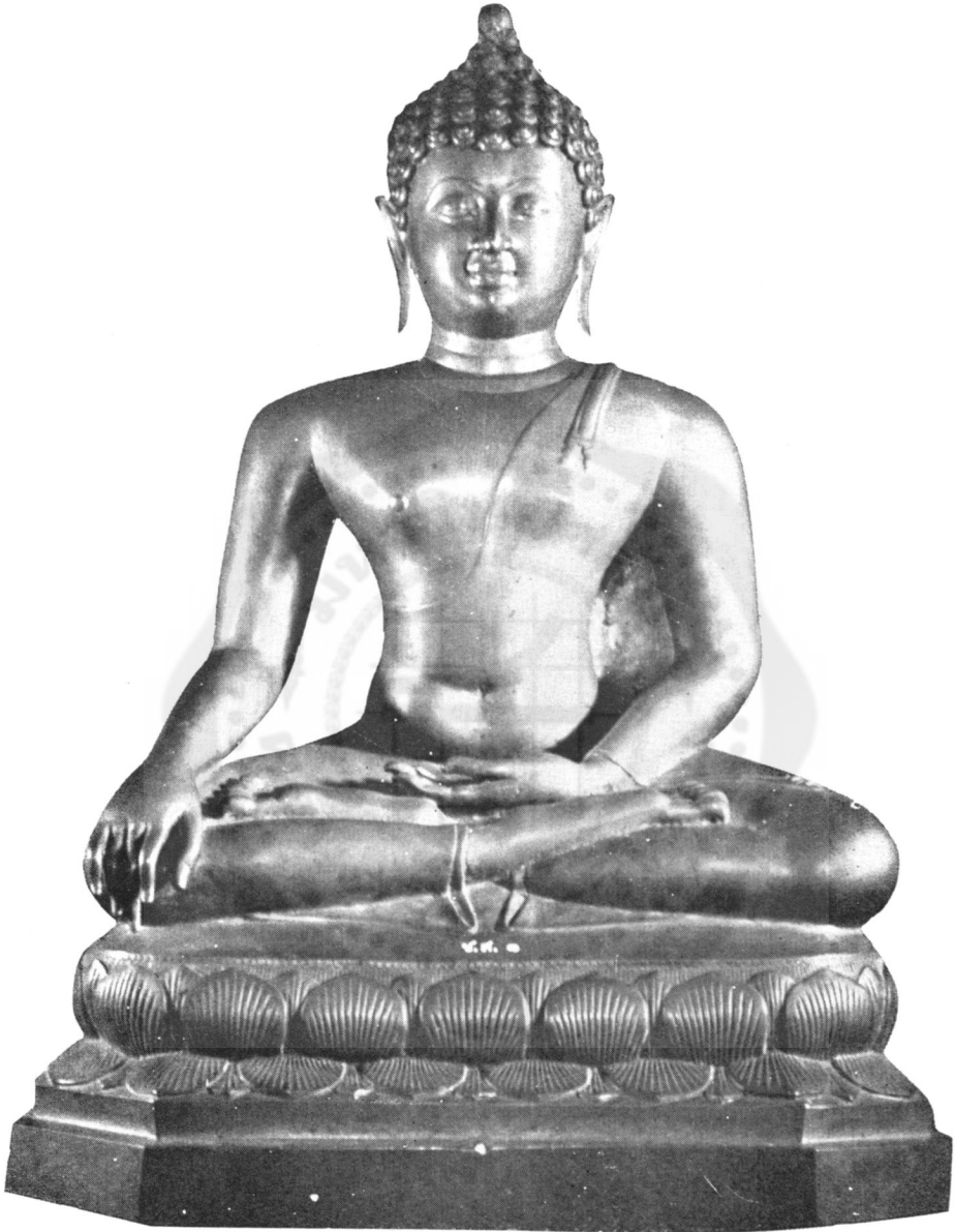
ปางที่ ๕ มารวิชัย หรือ ตรัสรู้ (ในพิพิธภัณฑ์สถานแห่งชาติ)