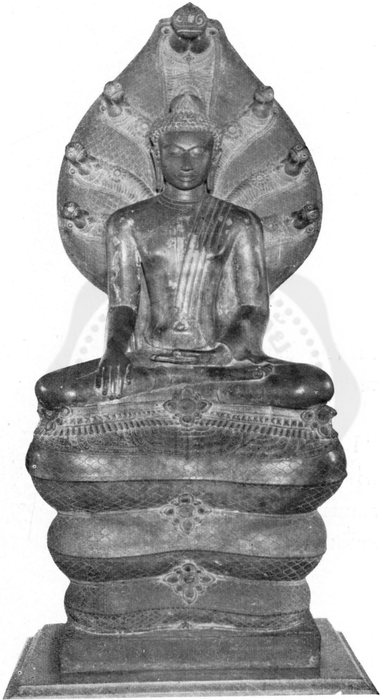
ปางที่ ๑๔ นาคปรก (ในพิพิธภัณฑ์สถานแห่งชาติ)