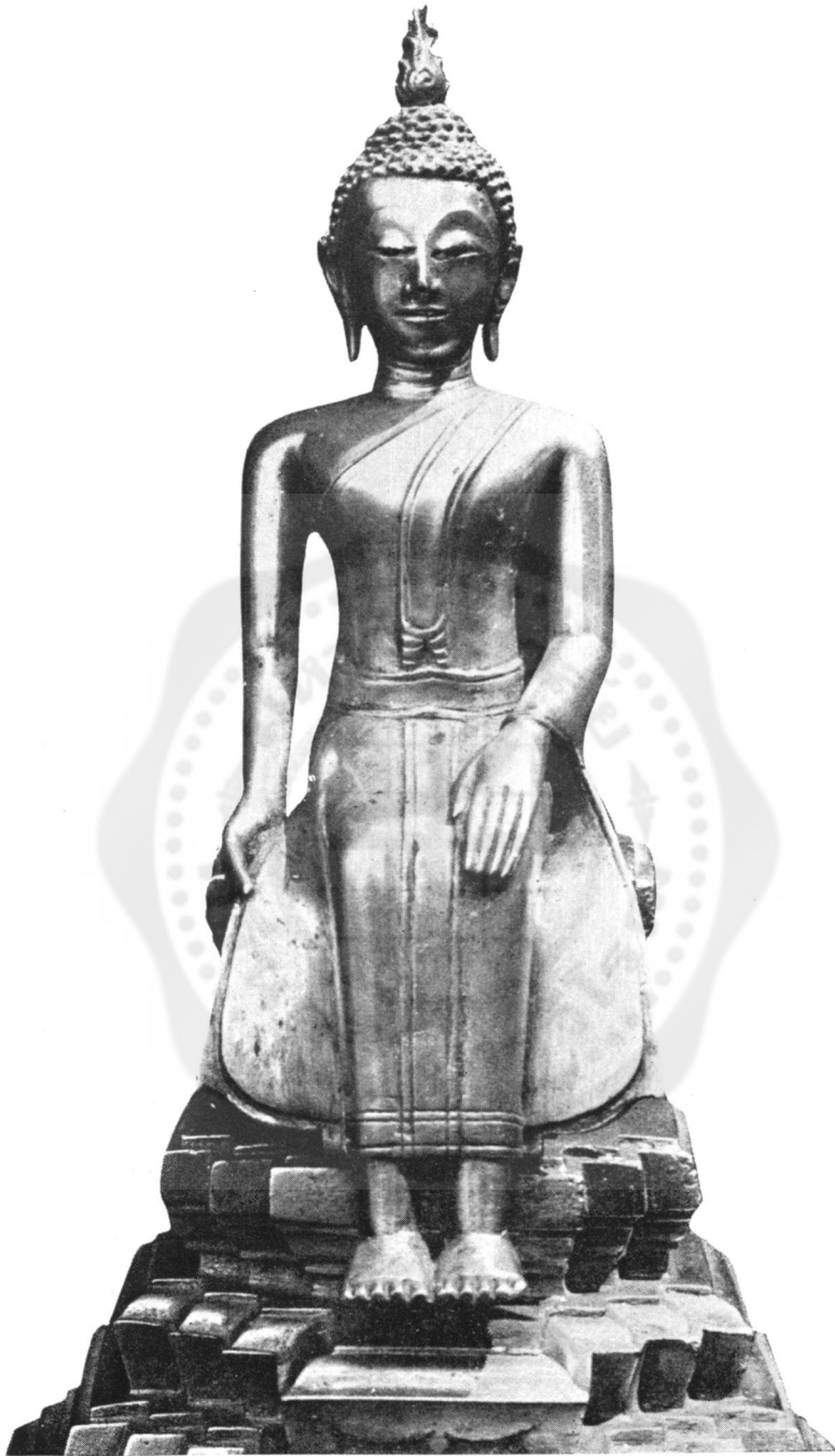
ปางที่ ๒๕ ประทับเรือขนาน (ในทอราขกรมานุสร วัดพระศรีรัตนศาสดาราม)