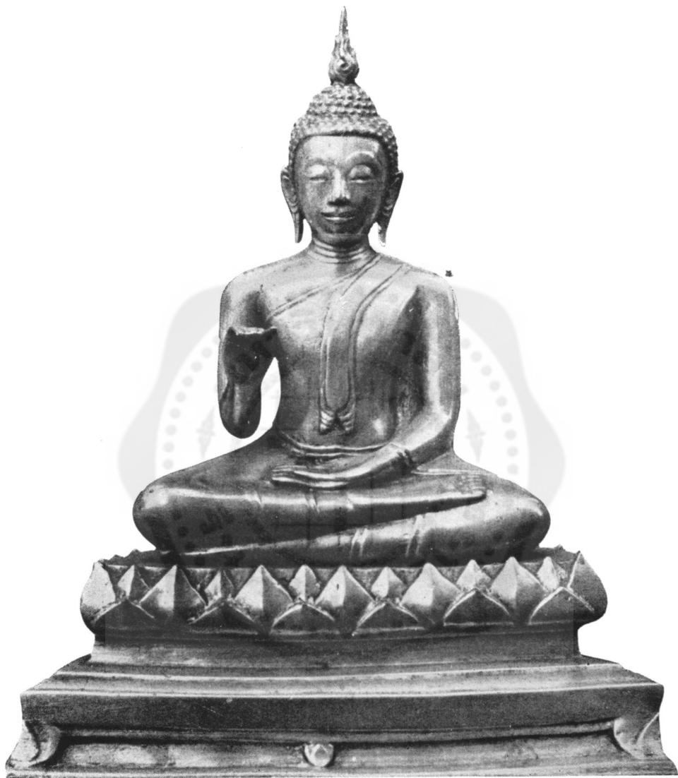
ปางที่ ๒๑ ประทานเอหิภิกขุ (ในทอราขกรมานุสร วัดพระศรีรัตนศาสดาราม)