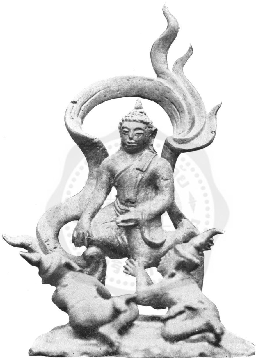
ปางที่ ๒๖ แสดงอิทธิปาฏิหาริย์ (ในพิพิธภัณฑสถานแห่งชาติ)