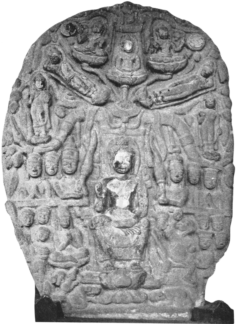
ปางที่ ๒๕ แสดงยมกปาฏิหาริย์ (ในพิพิธภัณฑสถานแห่งชาติ)