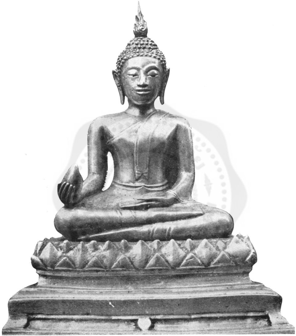
ปางที่ ๒๘ ทรงรับผลมะม่วง (ในทอราขกรมานุสร วัดพระศรีรัตนศาสดาราม)