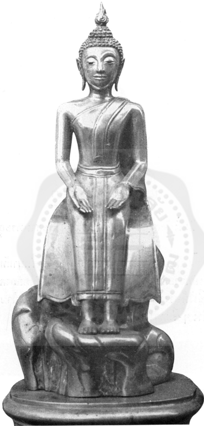
ปางที่ ๕ ทรงรับมธุปายาส (ในทอราชกรมานุสร วัดพระศรีรัตนศาสดาราม)