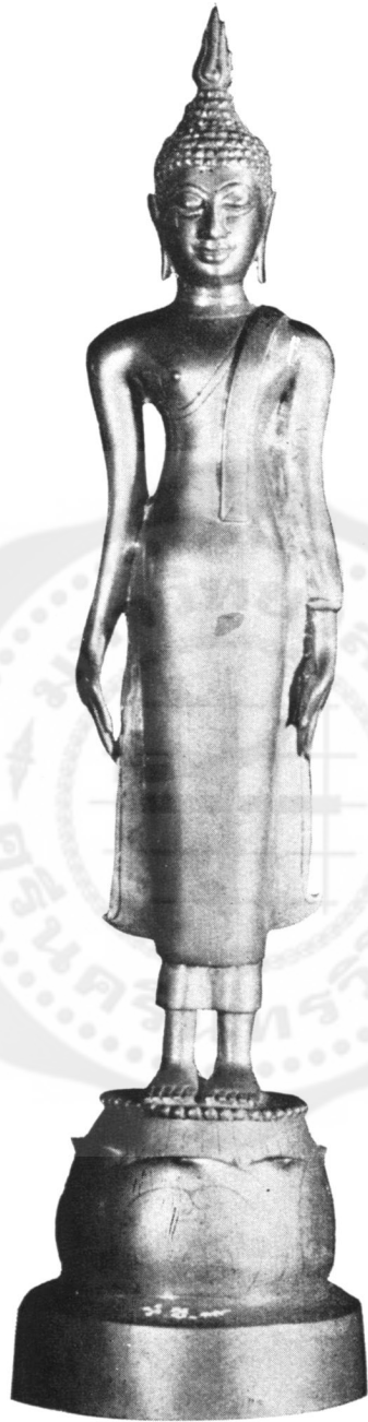
ปางที่ ๓๕ ประทับยืน