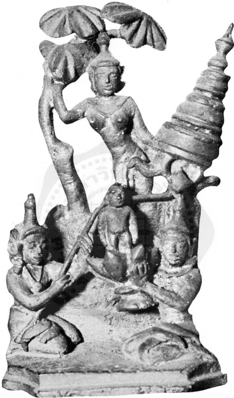
ปางที่ ๑ ประสูติ (ในพิพิธภักตสถานแห่งชาติ)