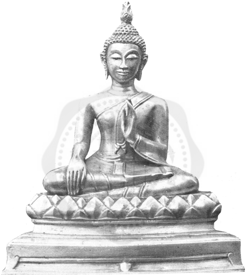
ปางที่ ๔๔ แสดงโอฬาริกนิมิต (ในทอราขรمانุสร วัดพระศรีรัตนศาสดาราม)