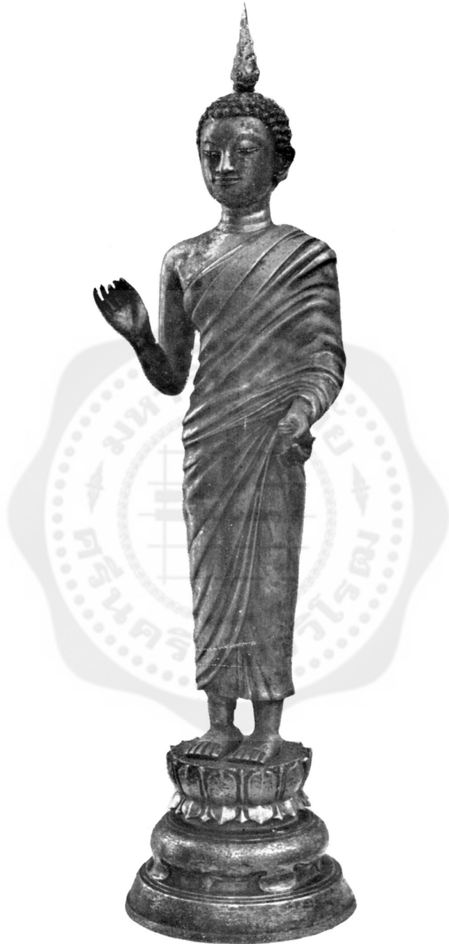
พระคันธารราษฎร์