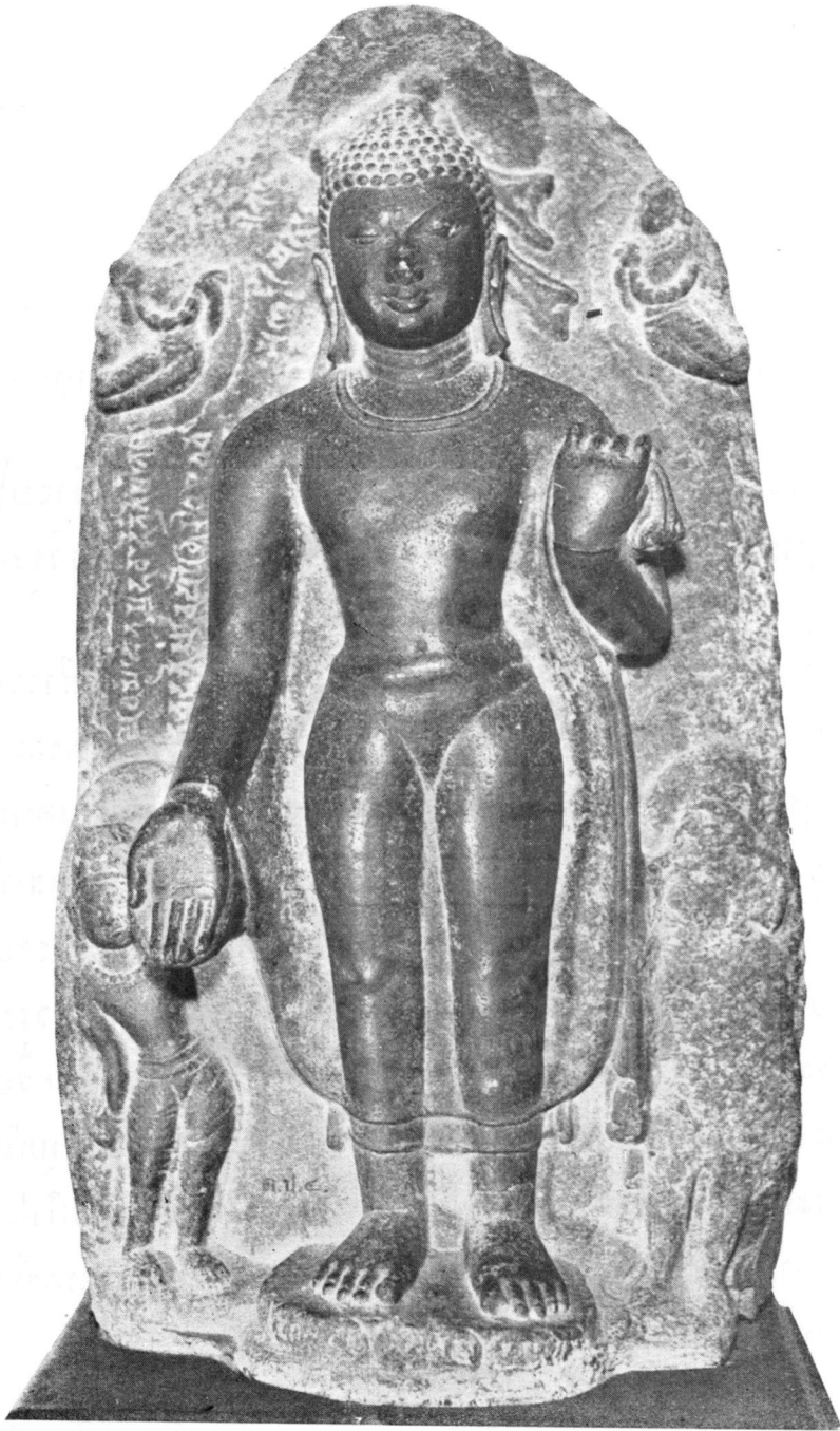
ปางที่ ๕๑ ประทานพร (ในพิพิธภัณฑสถานแห่งชาติ)