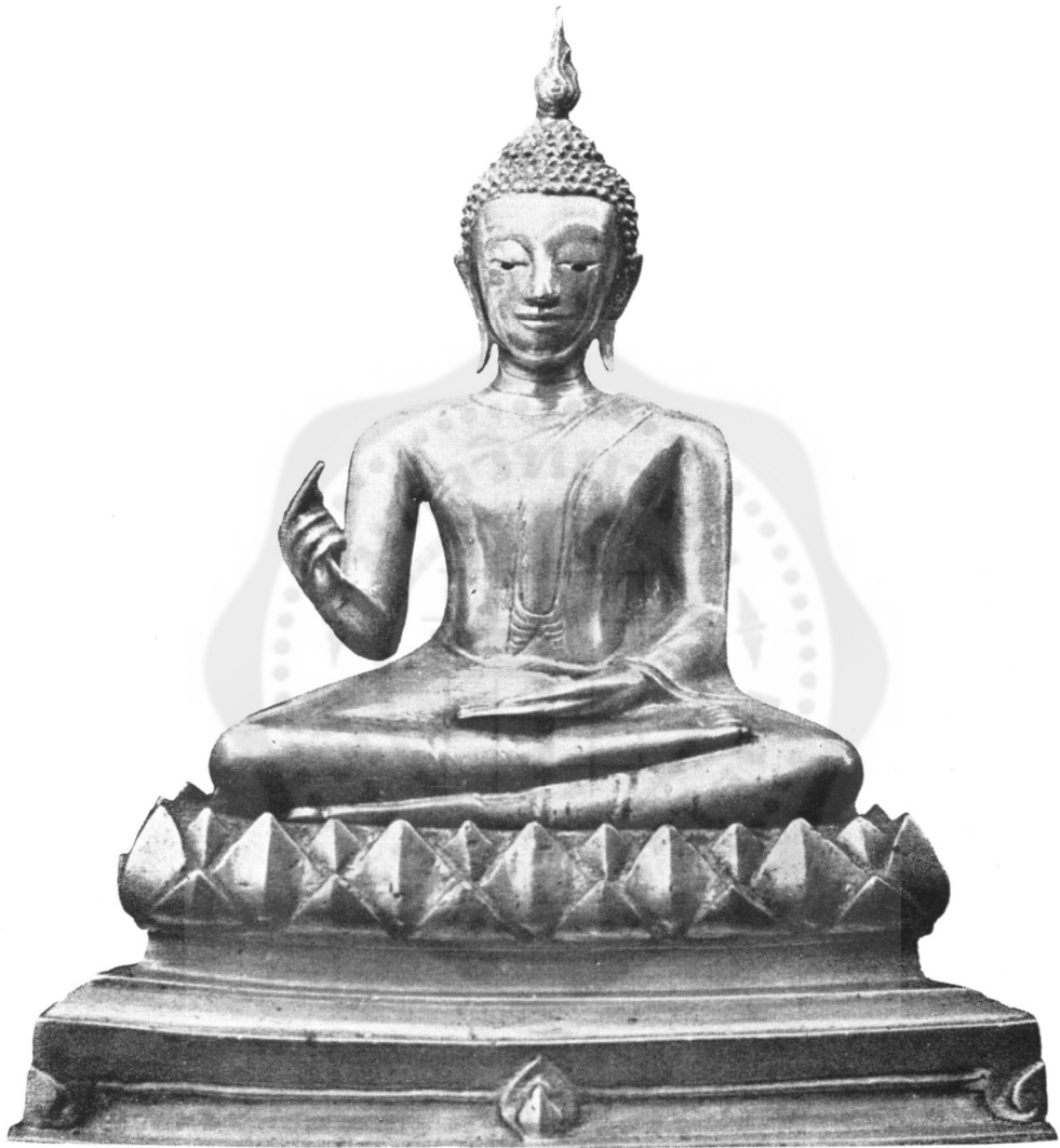
ปางที่ ๒๔ ชอัครสาวก