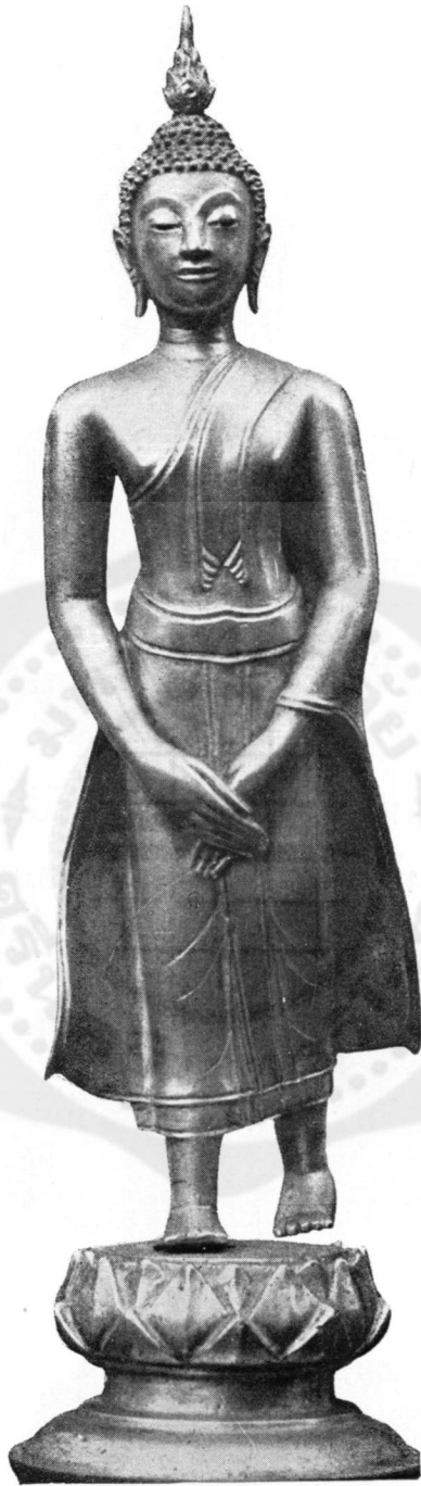
ปางที่ ๑๒ จกรมแก้ว