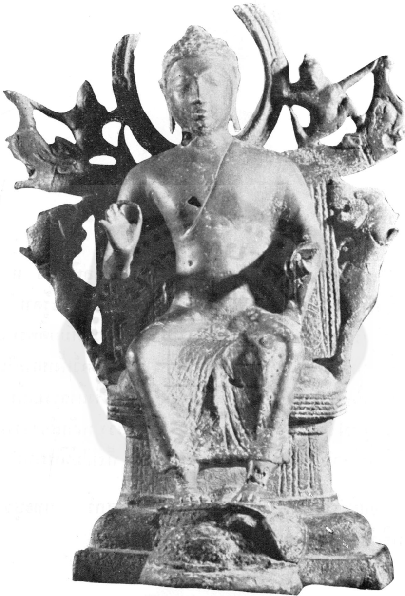
ปางที่ ๒๐ ปฐมเทศนา (ในพิพิธภันตสถานแห่งชาติ)