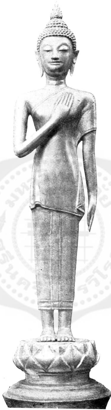
ปางที่ ๓๗ ทรงนำฝน