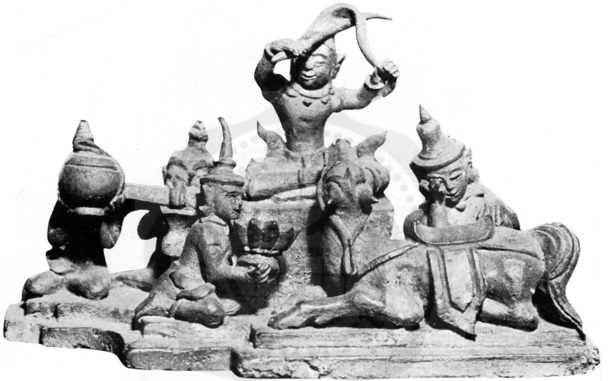
ปางที่ ๓ ตัดพระเมาลี (ในพิพิธภัณฑสถานแห่งชาติ)