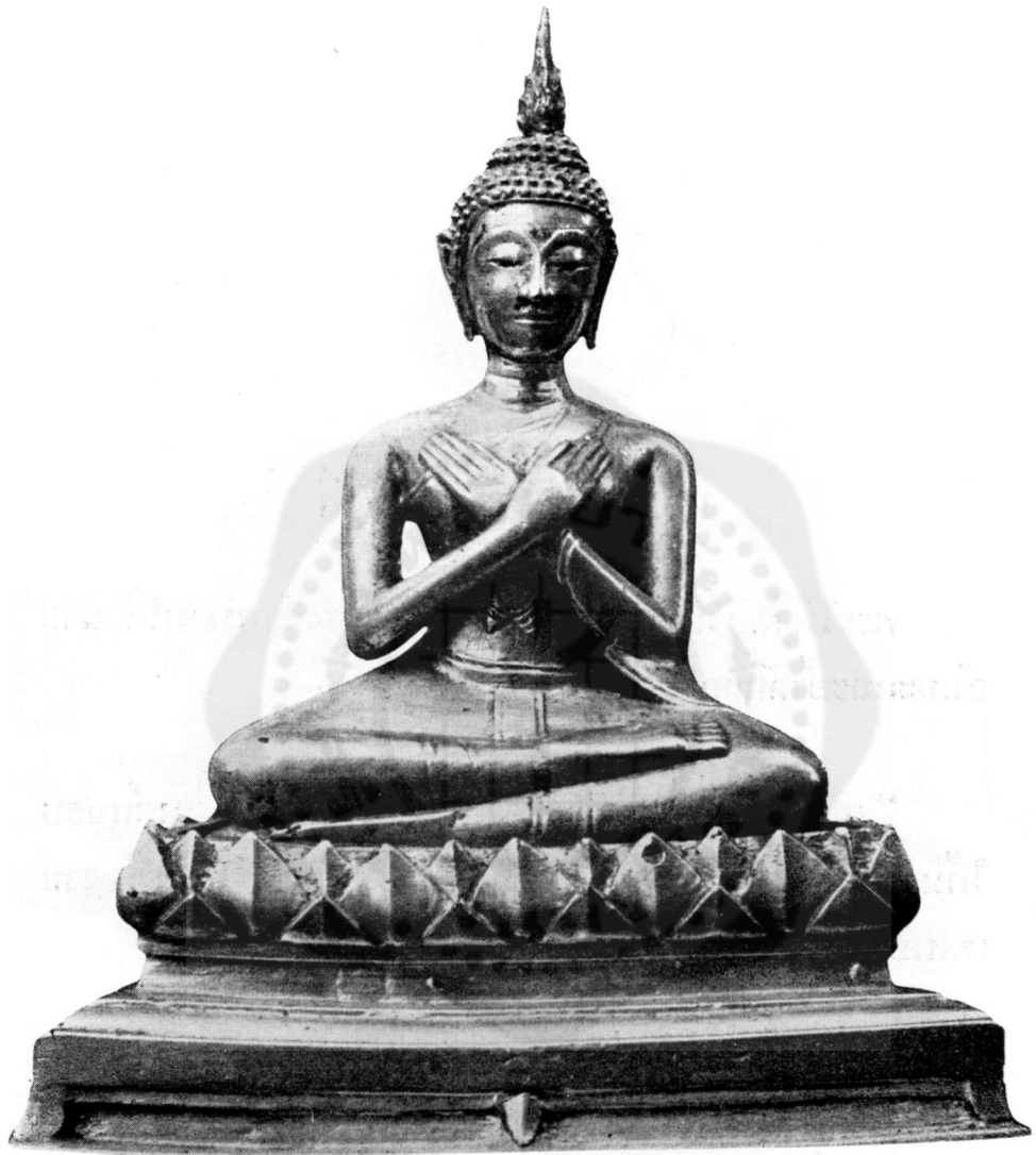
ปางที่ ๔ ทุกกรกิริยา (ในทอราชกรมานุสร วัดพระศรีรัตนศาสดาราม)