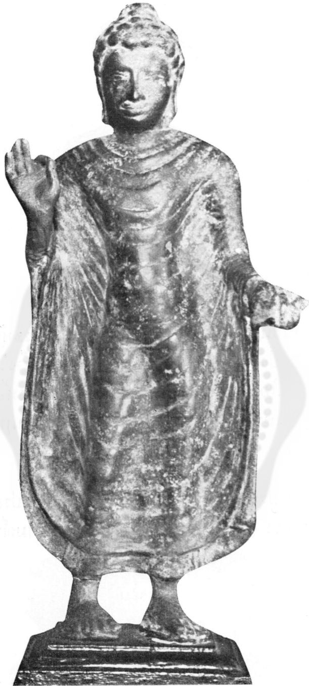
ปางที่ ๕๓ โปรดสัตว์ (ในพิพิธภัณฑ์สถานแห่งชาติ)