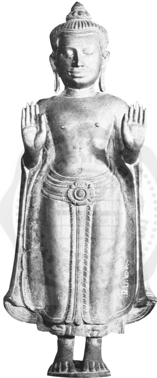
ปางที่ ๒๓ ห้ามสมุทร (ในพิพิธภัณฑ์สถานแห่งชาติ)