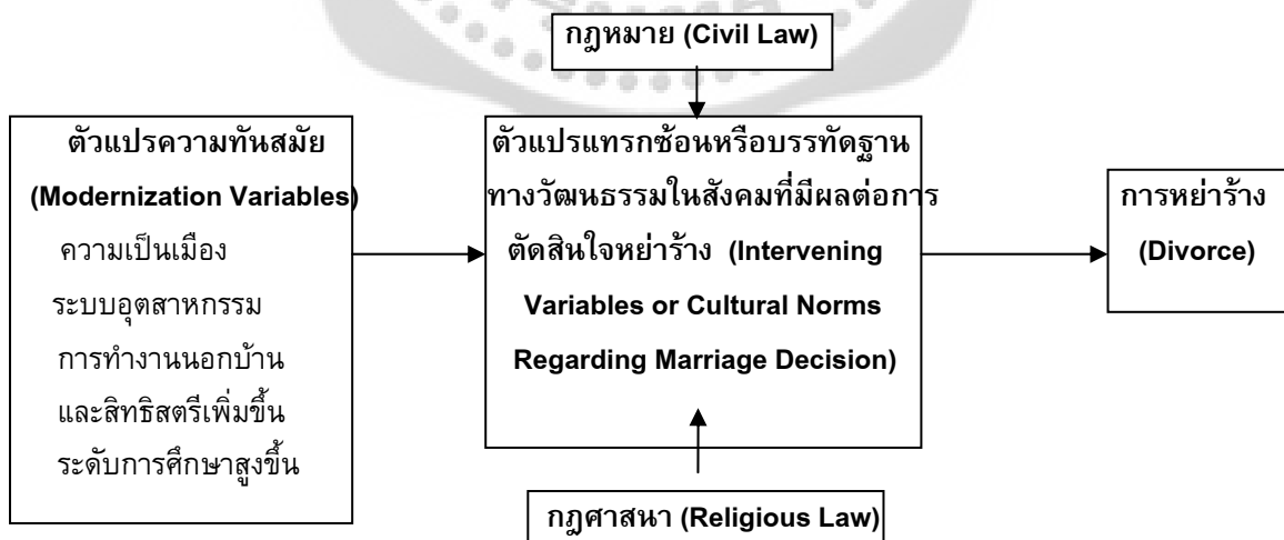
ภาพประกอบ 1 แบบจำลองทฤษฎีการตัดสินใจเปลี่ยนแปลงสถานภาพสมรส

แต่การที่ปัจจัยทางวัฒนธรรมเหล่านี้มีบทบาทมากน้อยเพียงไรนั้น ในการตัดสินใจเกี่ยวกับการเปลี่ยนแปลงการสมรส อาจจะขึ้นอยู่กับปัจจัยความทันสมัย ได้แก่ การศึกษา การมีประสบการณ์ในชุมชนแบบเมือง การใช้สื่อมวลชน การที่สตรีเข้าสู่ตลาดแรงงาน ลักษณะความทันสมัย ในแง่วัฒนธรรมของการสมรสจะเกิดขึ้นก็ต่อเมื่อ สมาชิกในสังคมได้นำเอาวิธีปฏิบัติในเรื่องการสมรสของสังคมอื่นมาเป็นแบบแผนของตนเอง ซึ่งลักษณะของสังคมดังกล่าว ไม่จำเป็นต้องมาจากสังคมต่างประเทศ อาจมาจากสังคมเมือง หรือคนที่มีเชื้อชาติต่างไปจากคนชาติเดียวกันในสังคมก็ได้ ภาพประกอบ 1 อธิบายว่าการตัดสินใจเปลี่ยนแปลงสถานภาพสมรส (หย่าร้าง) มีหลายปัจจัยที่เกี่ยวข้อง ได้แก่ ปัจจัยความทันสมัย บรรทัดฐานทางสังคม กฎหมาย ศาสนา เป็นต้น