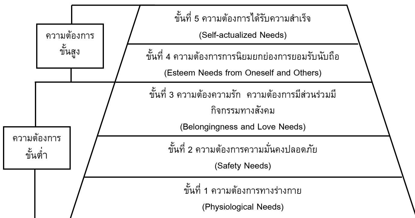
ภาพประกอบ 1 ระดับความต้องการของมนุษย์ตามทฤษฎีของมาสโลว์ ที่มา: Maslow. (1970). Motivation and Personality. หน้า 80-92.

มาสโลว์ (Maslow. 1970: 80-92) ได้กล่าวว่าความต้องการ คือ สภาพการณ์ขาดสมดุลภายในร่างกายมนุษย์ ซึ่งจะก่อให้เกิดแรงผลักดันให้มนุษย์ต่อสู้เพื่อสภาพความต้องการและกล่าวถึงลักษณะความต้องการของมนุษย์ไว้ดังนี้