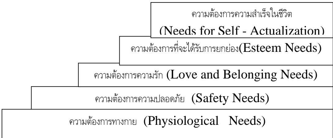
ภาพประกอบ 1 ลำดับขั้นความต้องการของมนุษย์ตามทฤษฎีความต้องการของมาสโลว์ ที่มา : (เบญจมาภรณ์ มะวิญชร. 2545 : 17)

พบว่า ความต้องการของมนุษย์มีความหลากหลาย และมนุษย์ทุกคนก็พยายามหาทางที่จะสนองความ ต้องการของตนเองทั้งสิ้น มาสโลว์ได้นำความต้องการของมนุษย์เรียงเป็นลำดับขั้น โดยกล่าวไว้ว่า ความต้องการของคนเรานั้นสามารถเรียงลำดับขั้นตอนได้ตามความสำคัญ และขั้นตอนความต้องการนี้ สามารถยืดหยุ่นได้ เมื่อความต้องการเบื้องต้นได้รับการสนองแล้วคนเราก็จะให้ความสนใจกับความ ต้องการในลำดับขั้นที่สูงต่อไป โดยมาสโลว์เริ่มต้นจากความต้องการขั้นมูลฐาน ได้แก่ ความต้องการ ทางกาย(Physiological Needs) เรื่อยไปจนถึงขั้นความต้องการที่จะเกิดความตระหนักแท้ในตนเอง (Needs for Self - Actualization) ไปจนถึงขั้นความต้องการทางด้านสุนทรียะ (Aesthetic Needs) (พงษ์พันธ์ พงษ์โสภา. 2542:144 ) ดังภาพ