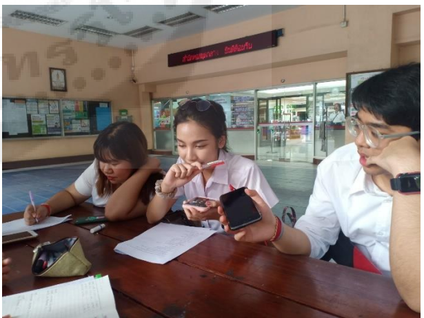
ภาพการให้สัมภาษณ์ของผู้ให้ข้อมูลหลัก