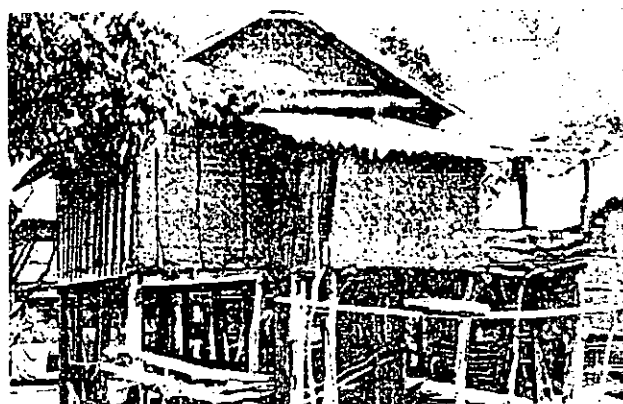
ภาพประกอบ 1 เรือน

จากข้อความข้างต้น ลาว คำหอม ได้แสดงให้เห็นว่าที่อยู่อาศัยของชาวชนบทมีลักษณะเป็นเพียงเรือนหลังเล็กๆ พอยู่ได้เท่านั้น ปลูกต้นไม้ยืนต้นไว้รอบบ้านเพื่อให้ร่มเงา ที่อยู่อาศัยของชาวอีสานเป็นพื้นไม้ฟาก ซึ่งไม้ฟากหมายถึง (ราชบัณฑิตยสถาน. 2546 : 812) ไม้ที่ไม่เป็นต้นที่ผ่าแล้วสับให้แตกออกเป็นอันเล็กๆ แต่ไม้ขาดออกจากกัน แล้วแบคว่าออกเป็นแผ่น โดยมากใช้ปูเป็นพื้นเรือน เมื่อเดินบนพื้นไม้จะมีเสียงดังออดแอด แสดงว่าเป็นที่อยู่อาศัยที่ไม่มั่นคงแข็งแรง ส่วนภาชนะที่ใส่น้ำเป็นลักษณะหม้อดิน ชาวอีสานต้องใช้น้ำอย่างประหยัดเพราะขาดแคลนน้ำ ถ้าน้ำหมดต้องไปตักไกลมาก ลักษณะเรือนของชาวอีสานดังภาพประกอบต่อไปนี้