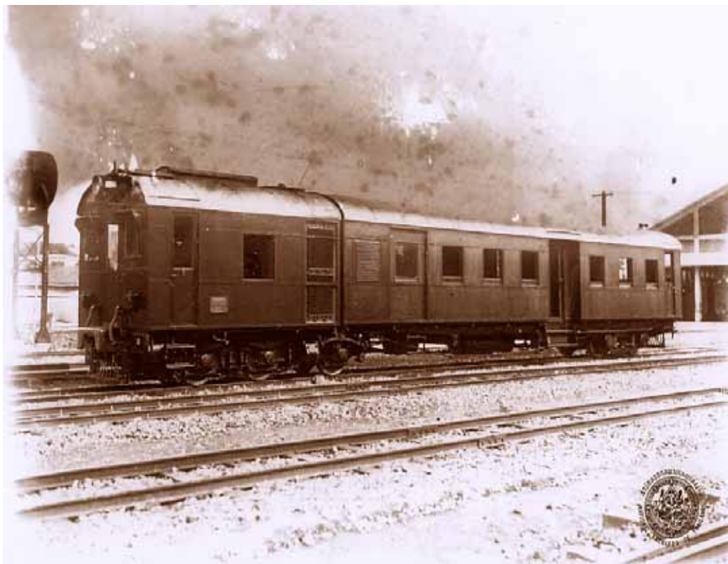
ภาพประกอบ 5 ตู้เสียบึงรถไฟ