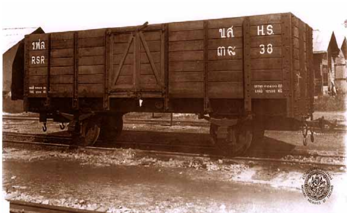
ภาพประกอบ 6 ตู้ขนส่งสินค้า