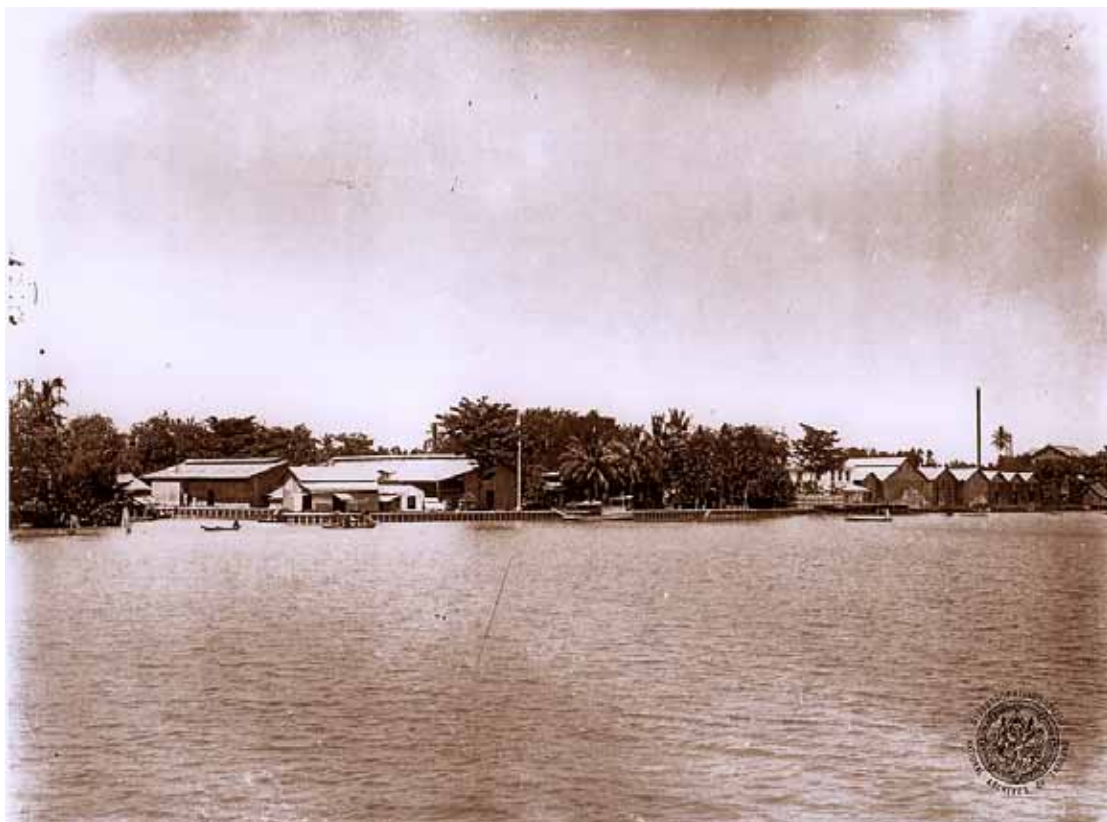
ภาพประกอบ 7 โรงสีข้าวด้วยเครื่องจักร