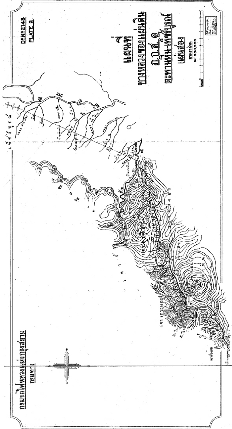
ภาพประกอบ 9 แผนที่การสร้างทางหลวงแผ่นดินจากตะพานหินถึงเพชรบูรณ์ แผ่นที่สอง