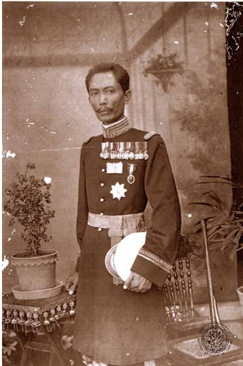
ภาพประกอบ 3 พระยาศรีสุริยราชวรานุวัตร (เชย กัลยาณมิตร) ข้าหลวงเทศาภิบาลมณฑล พิษณุโลกคนแรก (พ.ศ. 2437 – 2445)