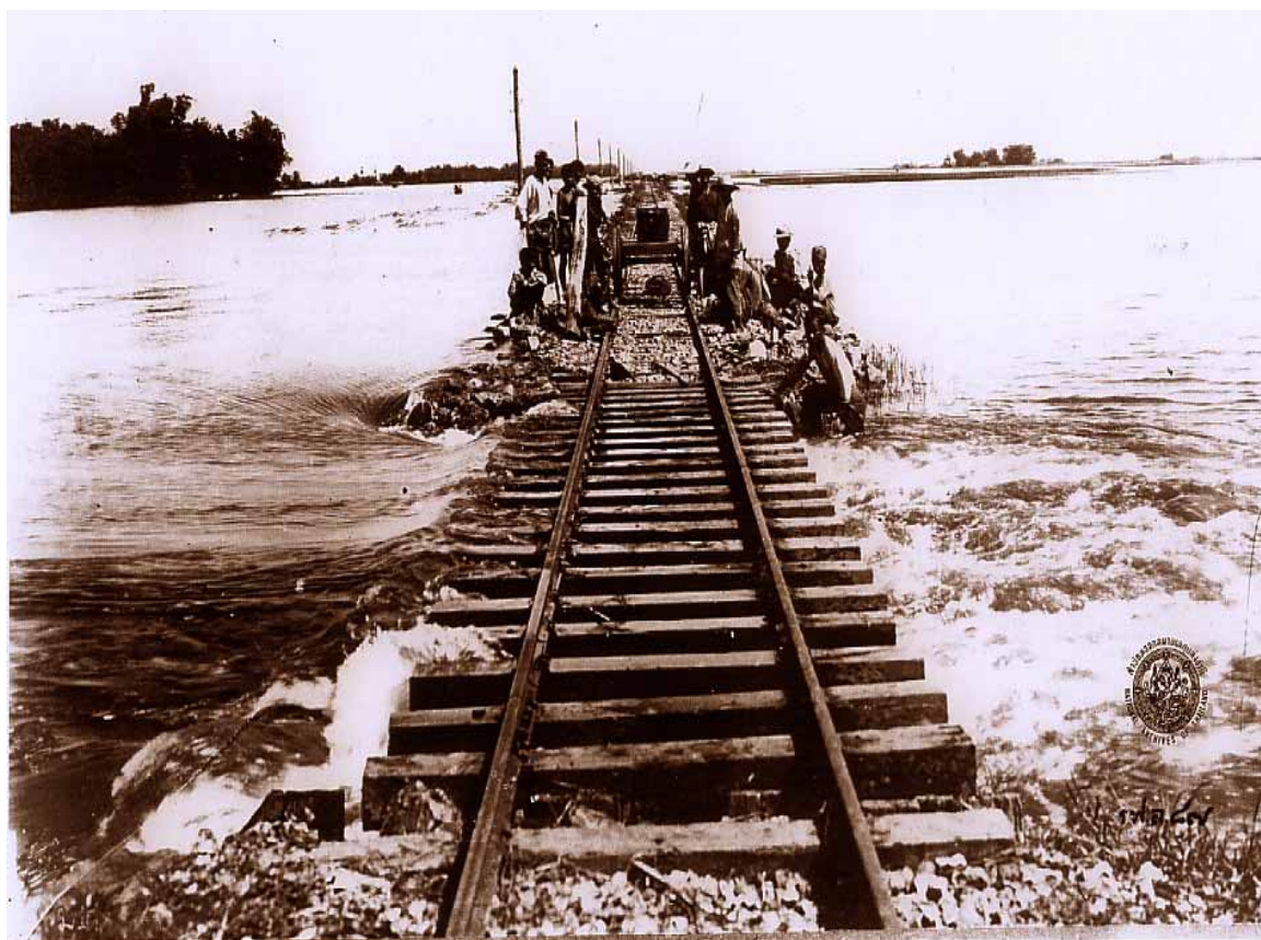
ภาพประกอบ 4 สภาพเส้นทางรถไฟสายเหนือช่วงปากน้ำโพ นครสวรรค์ถึงพิษณุโลก ในช่วงน้ำท่วม