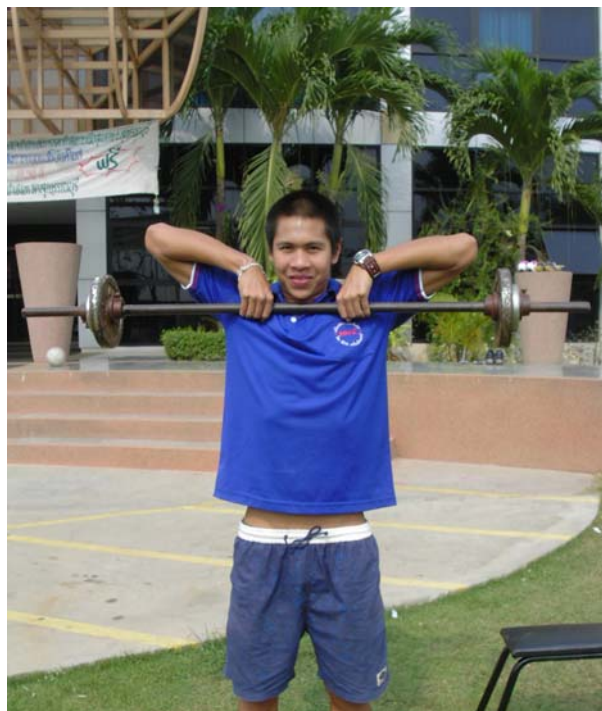
2.2 สถานีที่ 2 ฝึกด้วยน้ำหนักทำ อัฟไรท์ โรว์ (Upright Row)