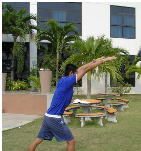
การฝึกพลัยโอเมตริกท่าแบคเวิร์ด โทว์ (Backward Throw)