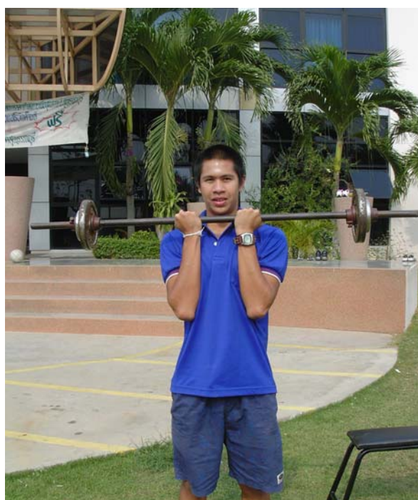
2.3 สถานีที่ 3 การฝึกด้วยน้ำหนักท่าไบเซพ เคิล (Bicep Curl)