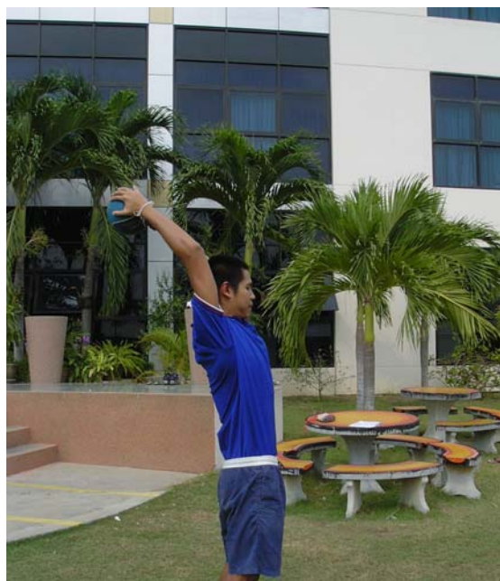
การฝึกพลัยโอเมตริกท่า โอเวอร์เฮด โทว์ (Overhead Throw)