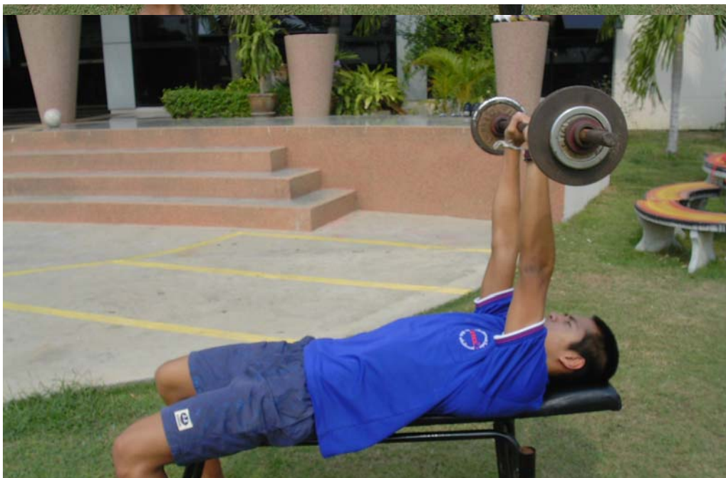
2.1 สถานีที่ 1 การฝึกด้วยน้ำหนักท่าเซสเพรส (Chest Press)