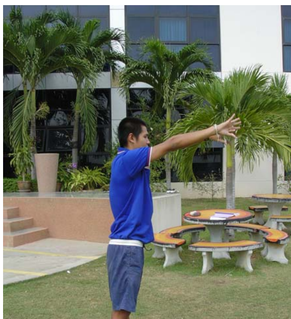
การฝึกพาสบอลด้วยท่าเซสพลาส (Chest Pass)