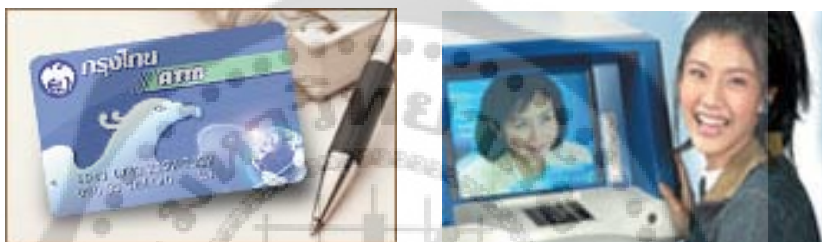
ภาพประกอบ 6 บัตรเครดิตกรุงไทย

ปี 2531 ธนาคารกรุงไทยเป็นธนาคารพาณิชย์แห่งเดียวที่มีสาขาและเครื่อง ATM อยู่ครบ ทั่วทุกจังหวัดของประเทศ และยังมีแผนงานขยายสาขาเพิ่มขึ้นอีก โดยเน้นการเปิดสาขา ในเขตรอบนอกที่ความเจริญกำลังขยายตัวออกไป และในปีเดียวกันนี้ธนาคารได้นำหุ้นเข้าจดทะเบียนในตลาดหลักทรัพย์แห่งประเทศไทย ซึ่งนับเป็นรัฐวิสาหกิจขนาดใหญ่แห่งแรก โดยมีการซื้อ-ขายหุ้นในตลาดหลักทรัพย์ฯ ในปี 2532 และปี 2533 มีการเปิดตัวบัตรเครดิตกรุงไทย นอกจากนี้ยังเป็นสถาบันแห่งแรกในประเทศไทยที่นำระบบเครือข่ายสื่อสารข้อมูล (K-NET) มาใช้ ปี 2534 ธนาคารกรุงไทยได้รับยกย่องให้เป็นบริษัทดีเด่นประจำปี 2534