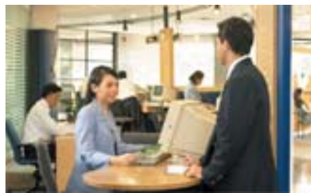
ภาพประกอบ 4 สถานที่สำนักงานใหญ่ของธนาคารเกษตร จำกัด

ผลการดำเนินงานของธนาคารได้ขยายตัวเติบโตขึ้นมาเป็นลำดับ ทำให้อาคารสำนักงานใหญ่เดิมคับแคบลงจนเกิดความไม่สะดวกและไม่คล่องตัวในการปฏิบัติงาน ธนาคารจึงได้ย้ายที่ทำการสำนักงานใหญ่ มาตั้งอยู่ ณ อาคารเลขที่ 35 ถนนสุขุมวิท เมื่อวันที่ 26 พฤศจิกายน 2525 และได้ใช้เป็นที่ทำการสำนักงานใหญ่มาจนถึงปัจจุบัน