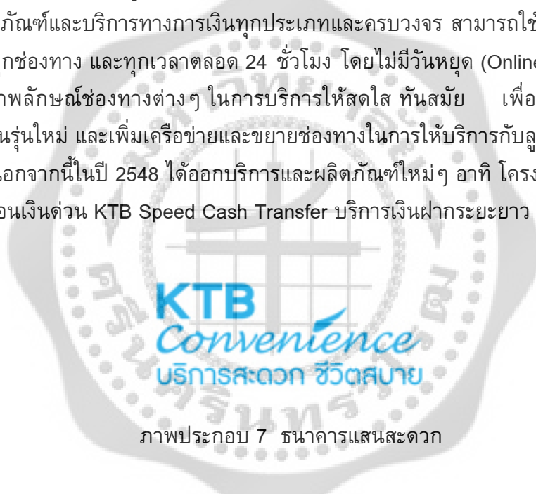
ภาพประกอบ 7 ธนาคารแสนสะดวก

ปี 2548 ธนาคารก้าวสู่การเป็น The Convenience Bank “ธนาคารแสนสะดวก” อย่างเต็มตัว มีผลิตภัณฑ์และบริการทางการเงินทุกประเภทและครบวงจร สามารถใช้บริการของธนาคารได้จากทุกที่ ทุกช่องทาง และตลอดเวลาตลอด 24 ชั่วโมง โดยไม่มีวันหยุด (Online Real Time) ได้มีการปรับเปลี่ยนภาพลักษณ์ช่องทางต่างๆ ในการบริการให้สดใส ทันสมัย เพื่อสอดคล้องกับความต้องการของคนรุ่นใหม่ และเพิ่มเครือข่ายและขยายช่องทางในการให้บริการกับลูกค้ากระจายไปตามแหล่งชุมชน นอกจากนี้ในปี 2548 ได้ออกบริการและผลิตภัณฑ์ใหม่ๆ อาทิ โครงการ KTB Exporter Club บริการโอนเงินด่วน KTB Speed Cash Transfer บริการเงินฝากระยะยาว 48 เดือน