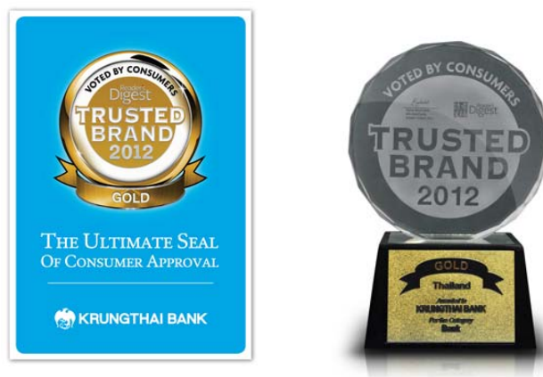
ภาพประกอบ 9 รางวัล Reader's Digest Trusted Brand GOLD Awards 2012

รางวัล Reader's Digest Trusted Brand GOLD Awards 2012 ในประเภทธนาคาร จากนิตยสาร Reader's Digest ซึ่งเป็นรางวัลที่ได้จากการสำรวจความคิดเห็นของผู้บริโภค ในเรื่องของความเชื่อมั่น คุณภาพ ความเข้าใจความต้องการของผู้บริโภค ความรับผิดชอบต่อสังคม และความคิดสร้างสรรค์