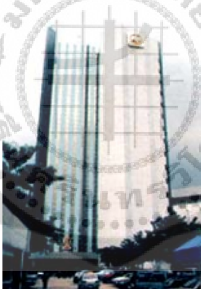
ภาพประกอบ 5 ธนาคารกรุงไทย จำกัด (มหาชน) สำนักงานใหญ่

ผลการดำเนินงานของธนาคารได้ขยายตัวเติบโตขึ้นมาเป็นลำดับ ทำให้อาคารสำนักงานใหญ่เดิมคับแคบลงจนเกิดความไม่สะดวกและไม่คล่องตัวในการปฏิบัติงาน ธนาคารจึงได้ย้ายที่ทำการสำนักงานใหญ่ มาตั้งอยู่ ณ อาคารเลขที่ 35 ถนนสุขุมวิท เมื่อวันที่ 26 พฤศจิกายน 2525 และได้ใช้เป็นที่ทำการสำนักงานใหญ่มาจนถึงปัจจุบัน