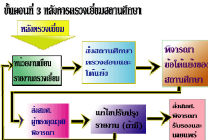
ภาพประกอบ 5 ขั้นตอนที่ 3 หลังการตรวจเยี่ยมสถานศึกษา

5. ประมวลและสรุปผลการตรวจเยี่ยมและให้ข้อเสนอแนะแก่สถานศึกษาเพื่อนำไป พัฒนาการจัดการศึกษาให้มีคุณภาพมากขึ้น