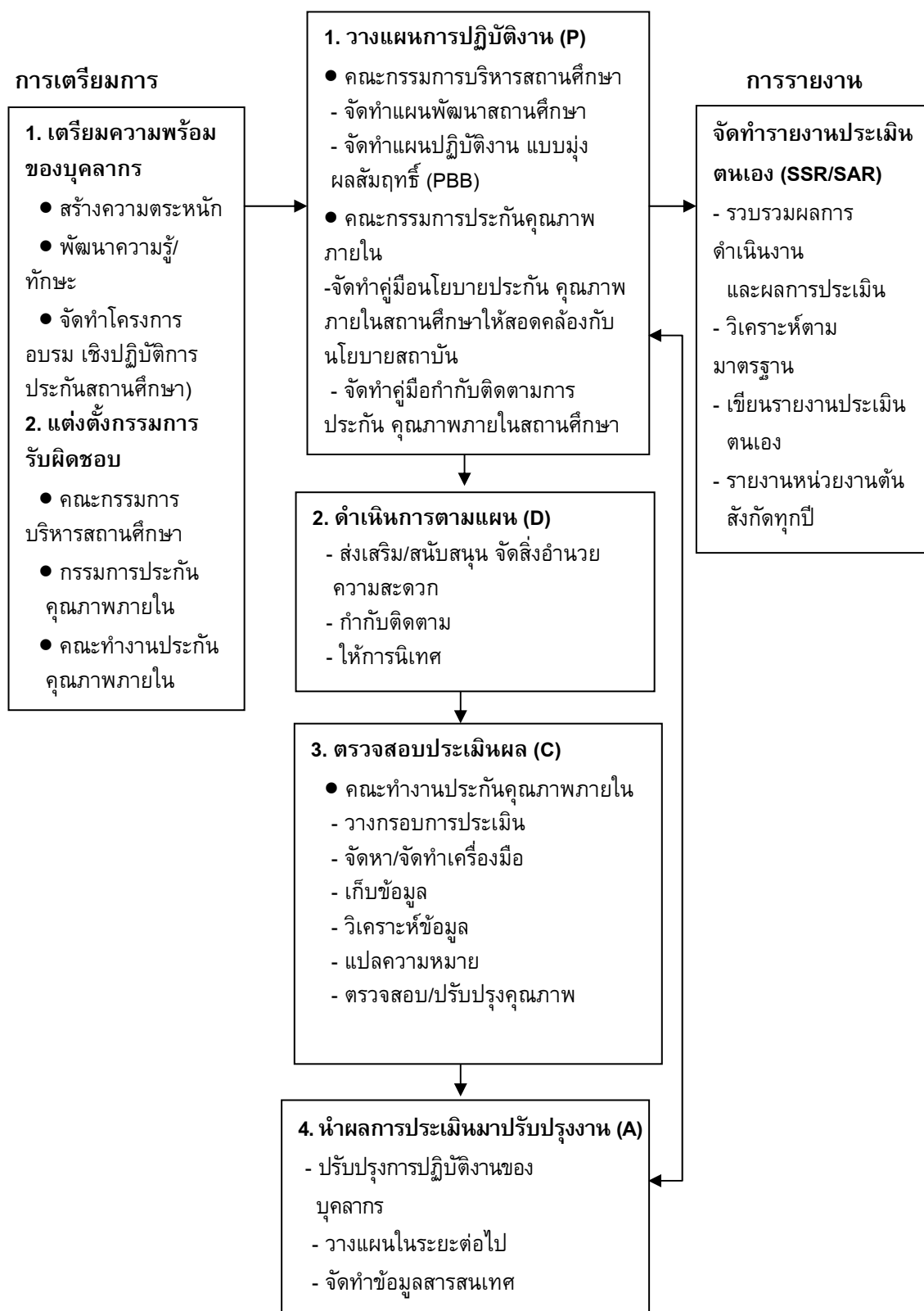
ภาพประกอบ 3 แผนภูมิขั้นตอนการดำเนินการประกันคุณภาพภายใน

บุคลากรทุกคนในสถานศึกษาและผู้เกี่ยวข้องจึงร่วมกันวางแผน ร่วมกันปฏิบัติร่วมกันตรวจสอบ และร่วมกันปรับปรุง โดยมีขั้นตอนการดำเนินงานทั้งหมด ดังที่เสนอในแผนภูมิ