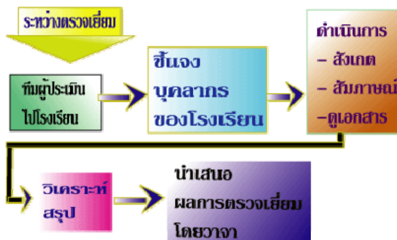
ภาพประกอบ 4 ขั้นตอนที่ 2 ระหว่างการตรวจเยี่ยมสถานศึกษา

ระหว่างการตรวจเยี่ยมซึ่งมีกำหนดเวลาประมาณ 3 วัน คณะผู้ประเมินภายนอกจะทำการประเมินคุณภาพสถานศึกษา ทั้งด้านการบริหารจัดการ การจัดการเรียนการสอนและอื่น ๆ ตามมาตรฐานการศึกษา เพื่อการประเมินคุณภาพภายนอก ทั้งนี้การตรวจเยี่ยมมิใช่การสร้างแรงกดดันให้กับสถานศึกษา คณะผู้ประเมินจะเข้าไปยังสถานศึกษาในลักษณะผู้ร่วมงานกับสถานศึกษาในการค้นหาสภาพความเป็นจริงของการพัฒนา รวมทั้งให้คำแนะนำมากกว่าที่จะเข้าไปในลักษณะผู้ตัดสินชี้ขาด สิ่งที่คณะผู้ประเมินตรวจสอบไม่ใช่สิ่งที่เป็นความลับของสถานศึกษา เนื่องจากจะใช้รายงานการประเมินตนเองที่สถานศึกษาส่งให้ สมศ. เป็นเอกสารหลักในการตรวจเยี่ยมตลอดเวลา ในระหว่างที่คณะผู้ประเมินอยู่ที่สถานศึกษา สถานศึกษาจะจัดเตรียมห้องให้ 1 ห้องเป็นห้องทำงานของคณะผู้ประเมิน รวมทั้งจัดเตรียมเอกสารต่างๆ ทั้งในส่วนที่ได้แจ้งไว้ล่วงหน้าและส่วนที่ขอเพิ่มเติม ตลอดจนจะต้องให้โอกาสแก่คณะผู้ประเมินในการพบปะหรือสัมภาษณ์บุคลากรและผู้ที่เกี่ยวข้อง