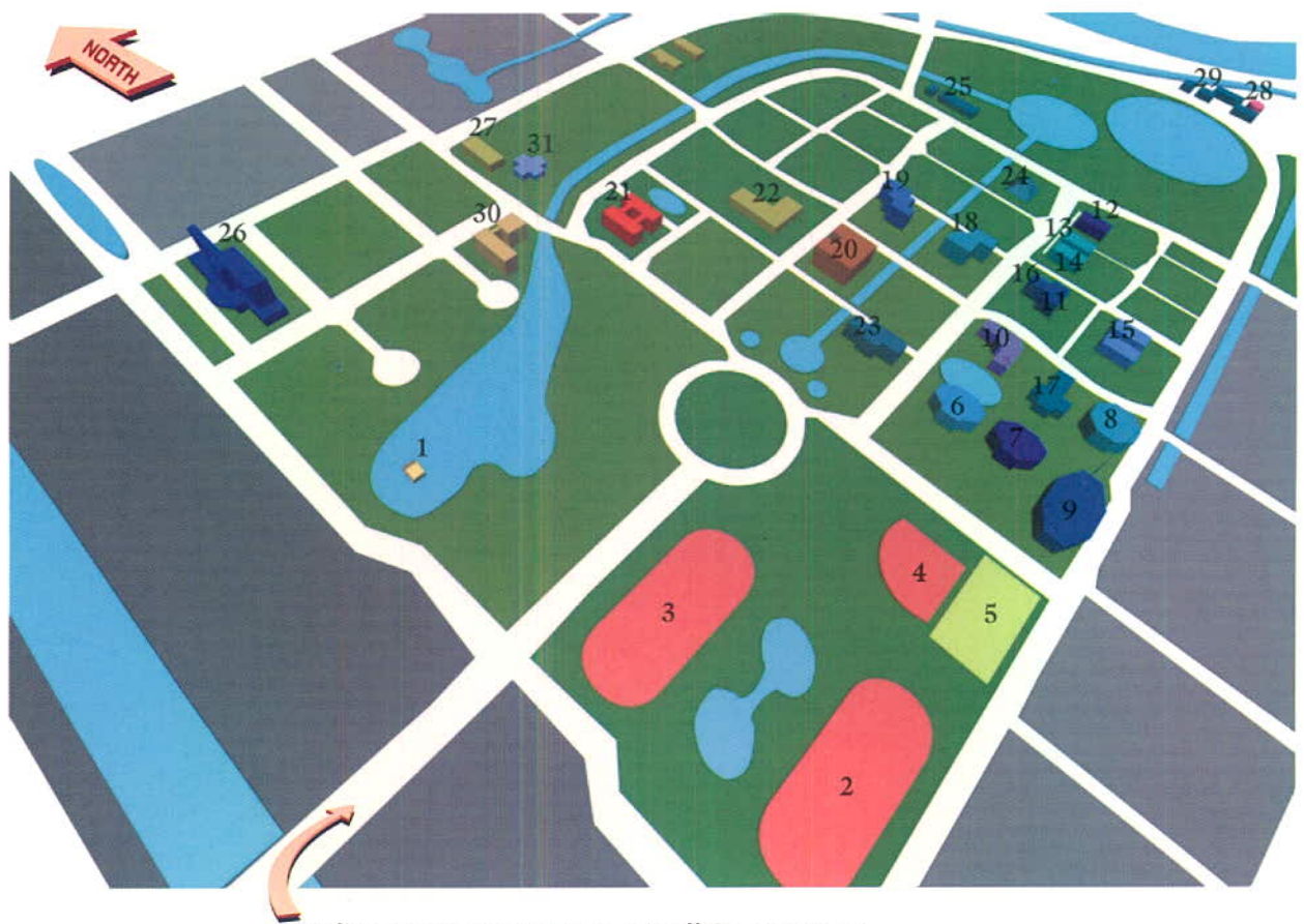
ทางเข้าจากทางหลวงหมายเลข 305 (รังสิต-นครนายก)