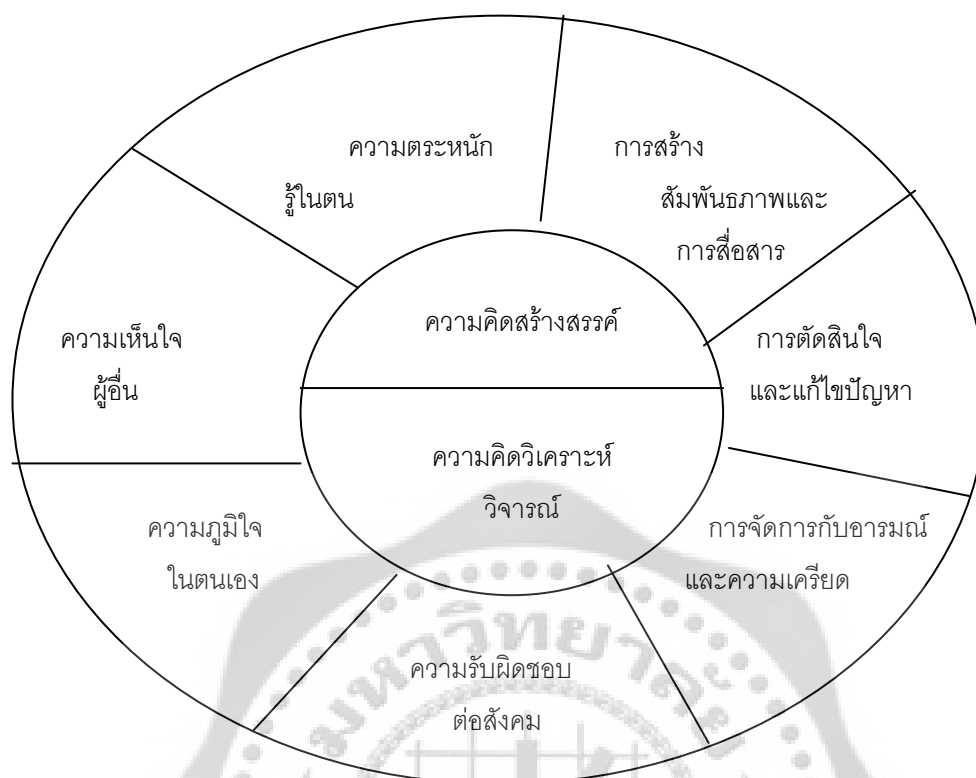
ภาพประกอบ 3 องค์ประกอบของทักษะชีวิต

จากภาพประกอบ 3 ส่วนที่เป็นแกนกลางจะเป็นองค์ประกอบด้านพุทธิพิสัย ซึ่งเป็นองค์ประกอบร่วมของทักษะชีวิตอื่น ๆ ทั้งหมด ส่วนในวงกลมรอบนอกจะเป็นด้านจิตพิสัย และทักษะพิสัยความสำคัญของทักษะชีวิต