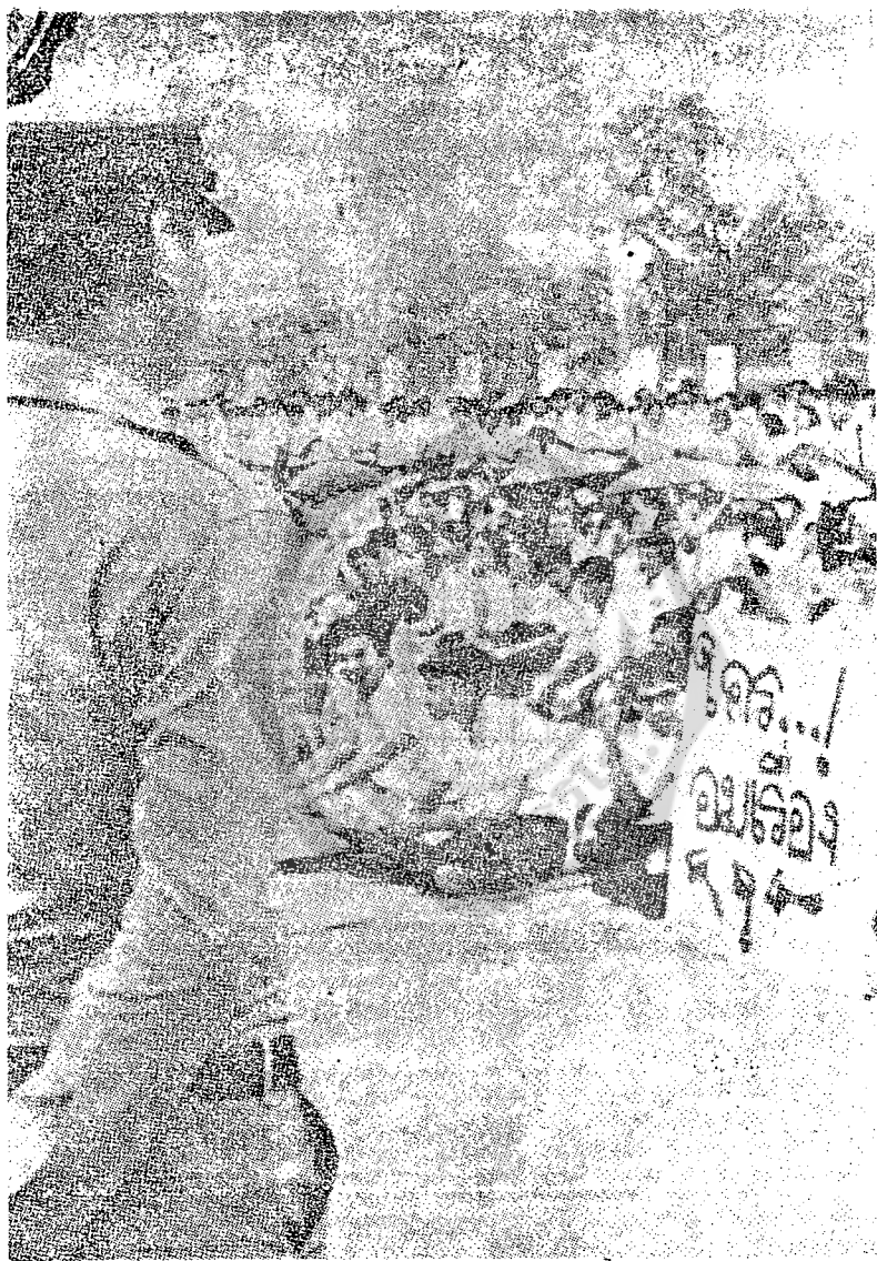
๕ เบื้องหลังการยกฐานะ วศ. เป็นมหาวิทยาลัย