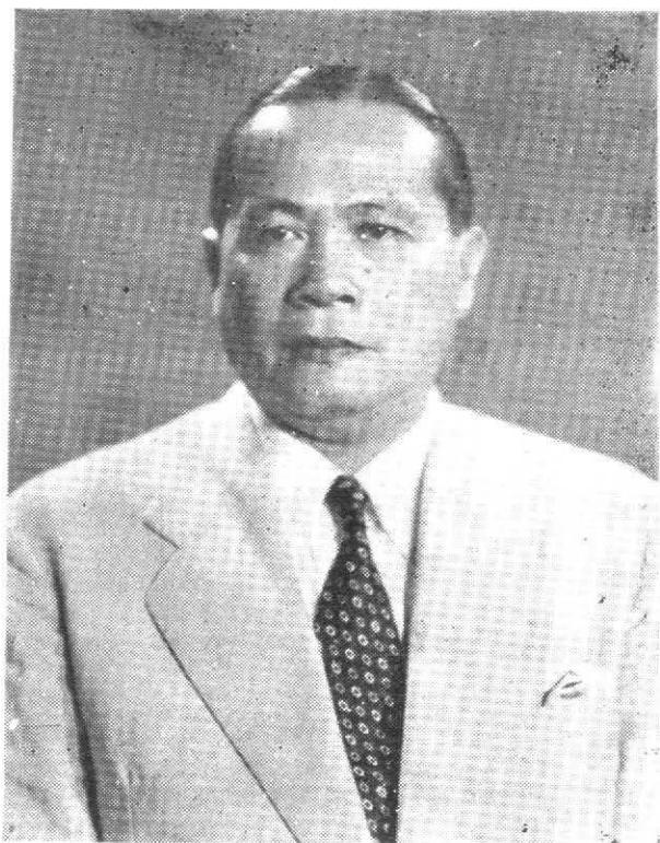
พลเอก มังกร พรหมโยธี รัฐมนตรีว่าการกระทรวงศึกษาธิการ ประธานกรรมการสภาวิทยาลัยวิชาการศึกษา