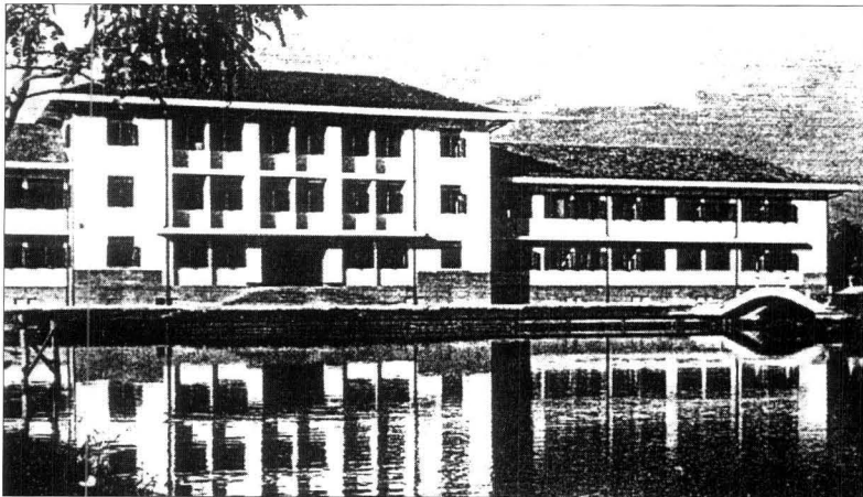
ตึก 2 ตึกโรงเรียนฝึกหัดครูชั้นสูง ที่ถนนประสานมิตร

ย้อนอดีตไปเมื่อกว่า 50 ปี ก่อนการก่อกำเนิดโรงเรียนฝึกหัดครูชั้นสูง ถนนประสานมิตร นั้น กระทรวงศึกษาธิการได้เริ่มการฝึกหัดครูมาก่อนแล้ว แต่ยังมีได้เป็นปีกแผ่นมันคงถาวร เนื่องจากสถาบันไม่มีสถานที่เป็นของตนเอง จึงต้องเร่ร่อนไปอาศัยสถานที่ของหน่วยงานอื่นๆ อยู่ตลอดเวลา จนกระทั่งในปี พ.ศ.2489 หม่อมหลวงปิ่น มาลากุล ซึ่งดำรงตำแหน่งอธิบดีกรมสามัญศึกษาในขณะนั้น ได้ดำเนินการจัดซื้อที่ดินจากเจ้าของที่