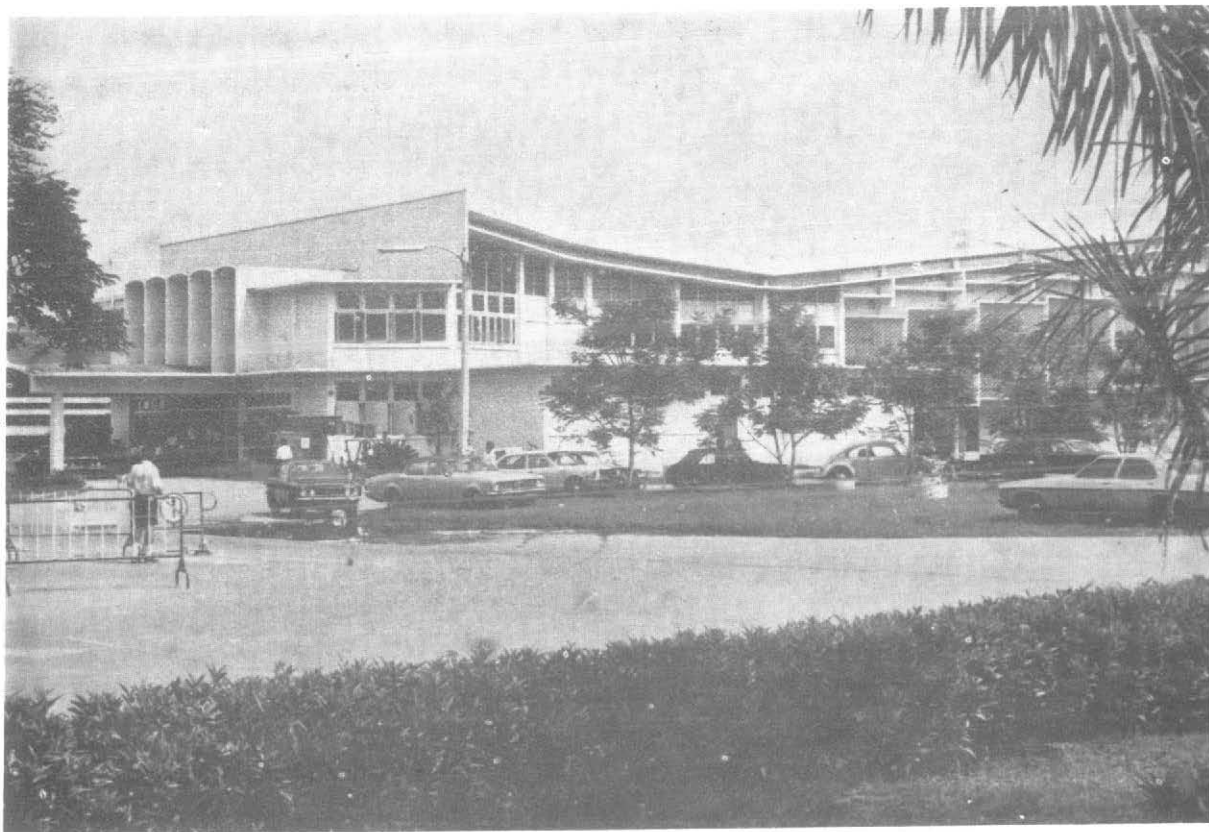
หอประชุมมหาวิทยาลัยศรีนครินทรวิโรฒ ประสานมิตร กรุงเทพฯ