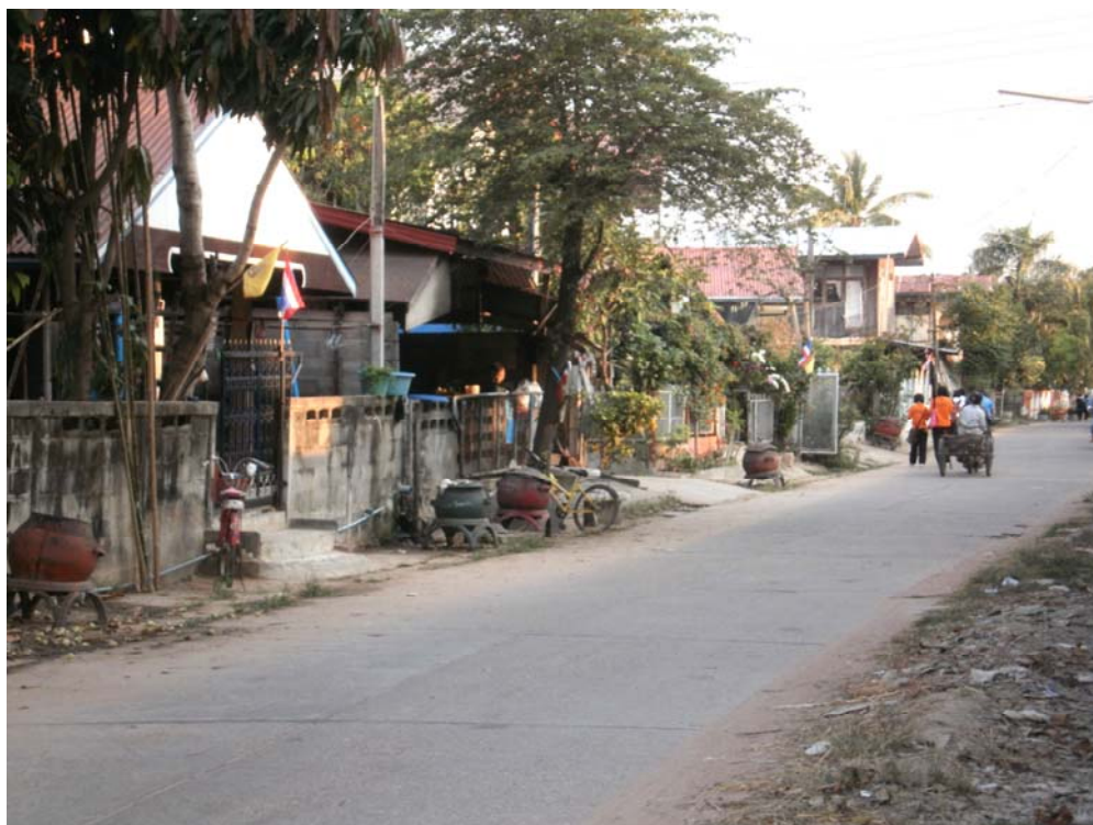
ภาพประกอบ 43 สภาพชุมชนบ้านโพนทัน 1