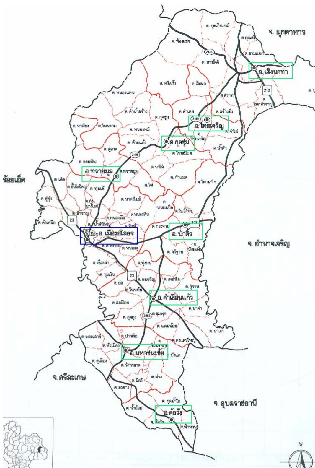
ภาพประกอบ 40 แผนที่จังหวัดยโสธร