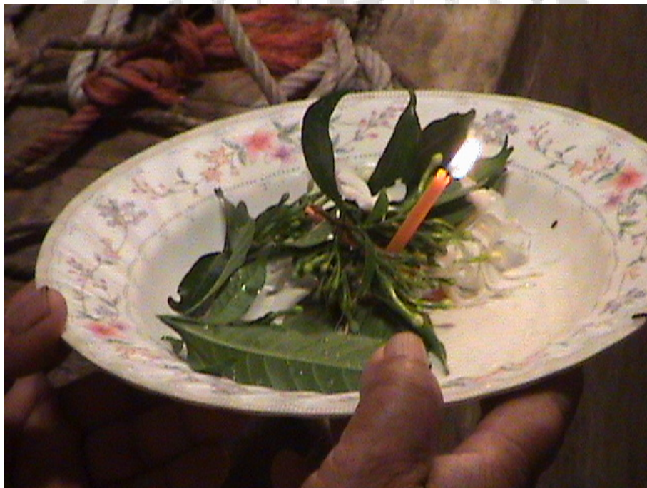
ภาพประกอบ 57 เครื่องไหวครูก่อนเริ่มทำการแสดง