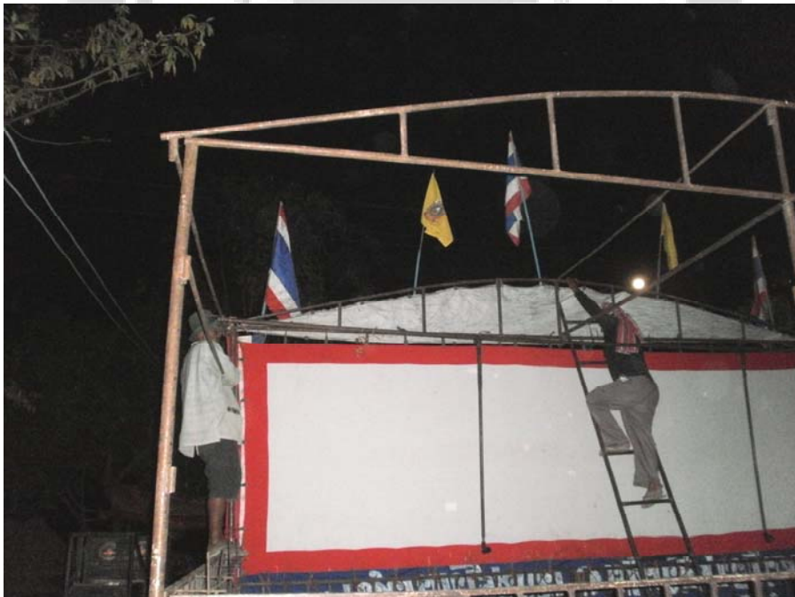
ภาพประกอบ 53 การจัดเตรียมโรงหนัง (ชั้นจอ)