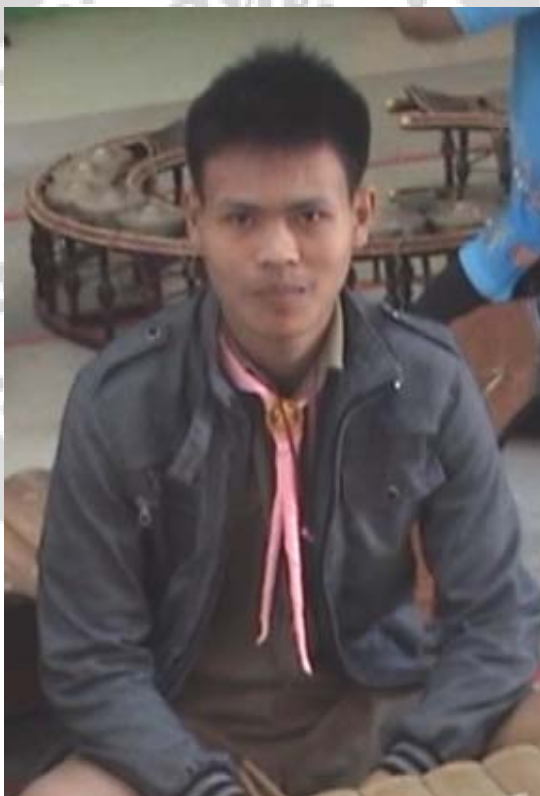
ภาพประกอบ 39 นายณัฐกร บัวลอย

นายณัฐวุฒิ กอพนันหา นอกเหนือจากความสามารถทางด้านการเชิดตัวหนังแล้ว ยังมี ความสามารถทางด้านดนตรีไทยอีกด้วย โดยมีตำแหน่งมีอระนาดเอก ประจำวงดนตรีไทยของ โรงเรียนโพ้นทันทเจริญวิทย์ โดยล่าสุดยังได้เข้าร่วมการประกวดการประกวดวงปี่พาทย์ไม้แข็งเครื่อง คู่ ระดับมัธยมศึกษาตอนต้น – ตอนปลาย (ประเภททีม) จากการแข่งขันทักษะงานศิลปหัตถกรรม นักเรียน ระดับเขตพื้นที่การศึกษา สพม. 28 ปีการศึกษา 2554 โดยได้รับรางวัล เกียรติบัตรระดับ เหรียญทอง ชนะเลิศ เป็นตัวแทนการแข่งขันระดับภาคตะวันออกเฉียงเหนือ เพื่อเข้าไปแข่งขันใน ระดับประเทศที่กรุงเทพมหานคร และจากผลการแข่งขันในระดับประเทศก็สามารถคว้ารางวัลลำดับ ที่ 9 มาครองได้เป็นผลสำเร็จ