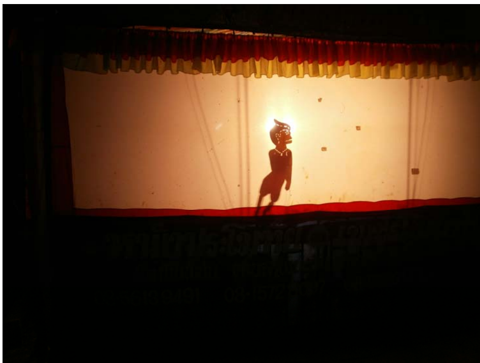
ภาพประกอบ 62 การออกกรุปักป้อง (ตัวตลกของคณะ)