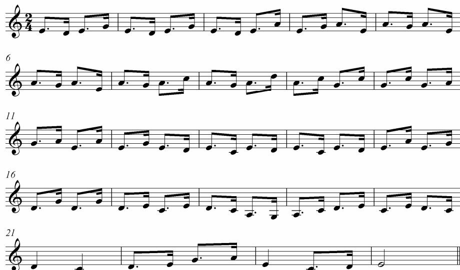
ภาพประกอบ 19 ดนตรีรับร้องบทไหว้ครู 1

ผู้เซ็ด เออ....เอย.....ผมจะขอคำนับจับเป็นตอน จกเอาบทละครมากล่าวว่า ผมจะขอคำนับจับ เป็นตอน ยกเอาบทละครแต่โบราณท่านมีมา