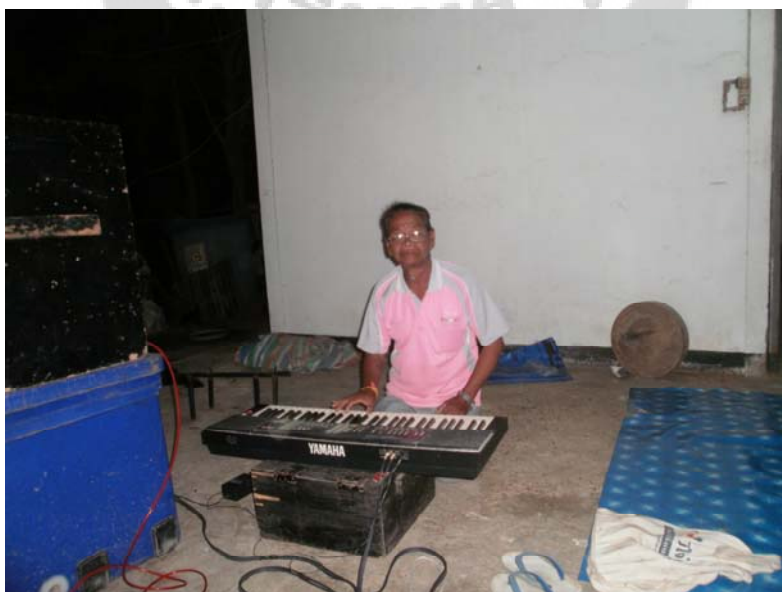
ภาพประกอบ 8 คีย์บอร์ด

คีย์บอร์ด หนังสือประโมทัยคณะเพชรโพทันทัน ได้เริ่มนำเอาเครื่องขยายเสียงเข้ามาช่วยในการพากย์ การขับร้องในปีพ.ศ. 2520 และในอีก 1 ปีต่อมาหนังสือประโมทัยคณะเพชรโพทันทัน จึงได้เริ่มนำเอาเครื่องดนตรีสากลมาช่วยในการบรรเลงประกอบการแสดง เช่น คีย์บอร์ด กลองชุด เบส กีตาร์ และกีตาร์ไฟฟ้า เข้ามาร่วมประสมในวงตามลำดับ ทำให้การแสดงหนังสือประโมทัยยุคหลังๆ มักจะเน้นไปทางหมอลำประยุกต์ หรือหมอลำซึ่งเป็นส่วนใหญ่ ทั้งนี้เนื่องมาจากความต้องการของผู้มาว่าจ้าง ที่ต้องการความสนุกสนานเร้าใจ และเหมือนได้ขอมไปด้วยในตัว เพราะนอกจากจะมี การแสดงหนังสือประโมทัยแล้ว ยังมีดนตรีสนุกสนานเร้าใจ บางงานอาจเพิ่มทางเครื่องเข้าไปด้วย ตามแต่ผู้ว่าจ้างจะกำหนดมา