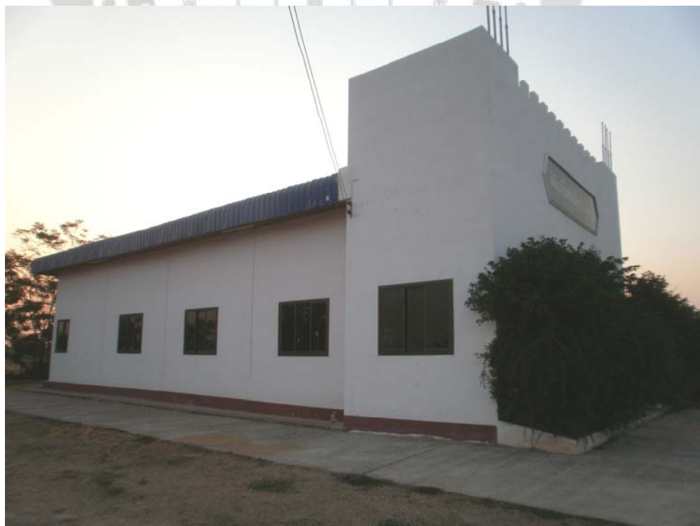
ภาพประกอบ 48 พิพิธภัณฑ์หนังประมอทัย บ้านโพนทัน 2