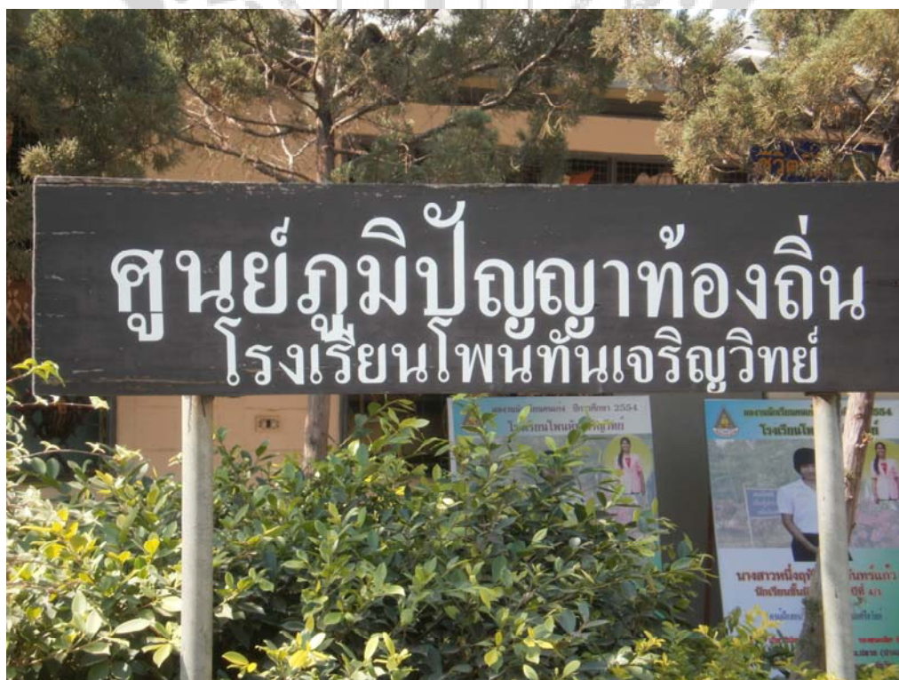
ภาพประกอบ 50 ศูนย์ภูมิปัญญาท้องถิ่นโรงเรียนโพนทันเจริญวิทย์