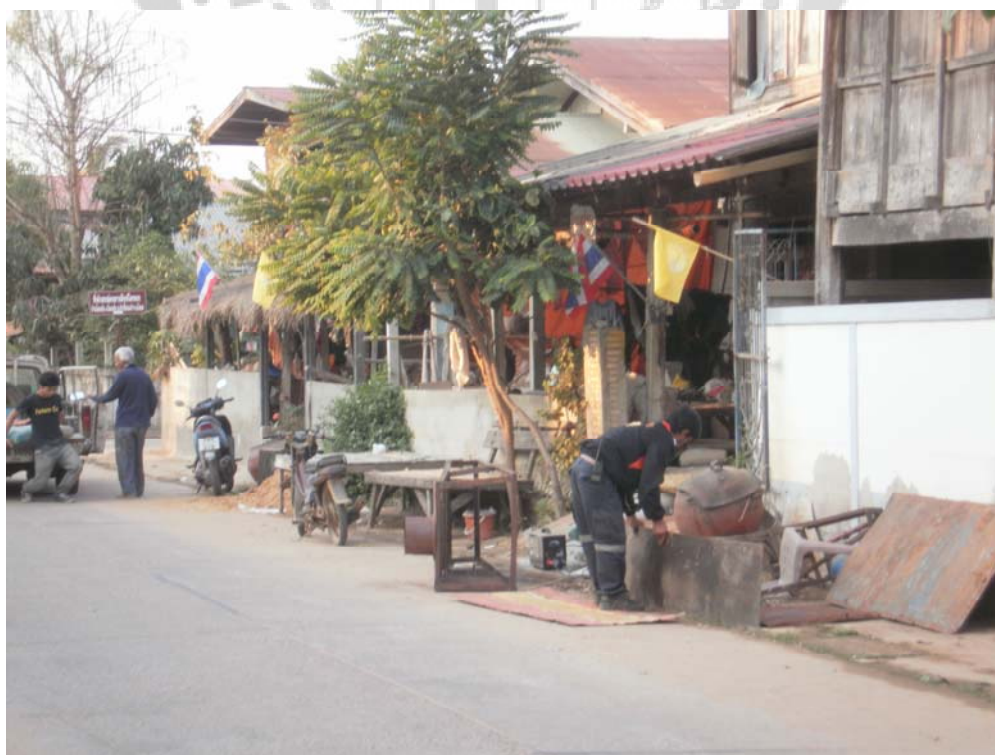
ภาพประกอบ 44 สภาพชุมชนบ้านโพนทัน 2