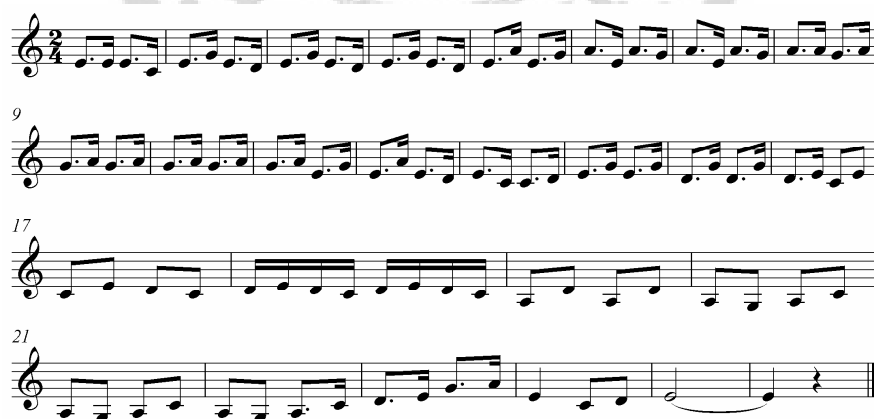
ภาพประกอบ 20 ดนตรีรับร้องบทไหว้ครู 2

ผู้เซ็ด ผมจะเล่นไปตามเรื่องที่มี มิได้แหกพระบาลีมากล่าวจา หากผมพลาดไปนิด ผิดพลาด ไปหน่อย ขอภัยแต่หน่อยเถิดคุณนายเจ้าขา เชิญดูเล่นพอให้เป็นขวัญตา ขอให้ดูเถิดว่าจะอย่างไร