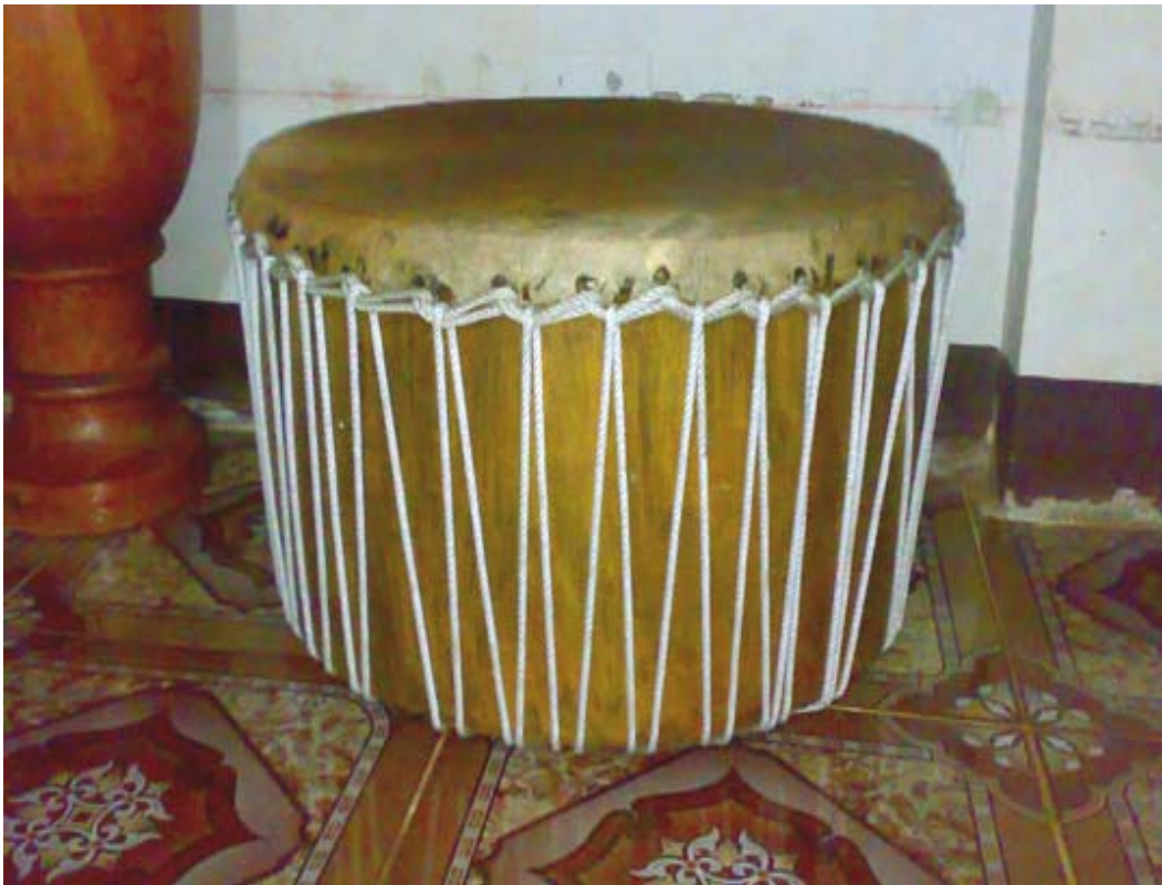
ภาพประกอบ 4 กลองตุ้ม