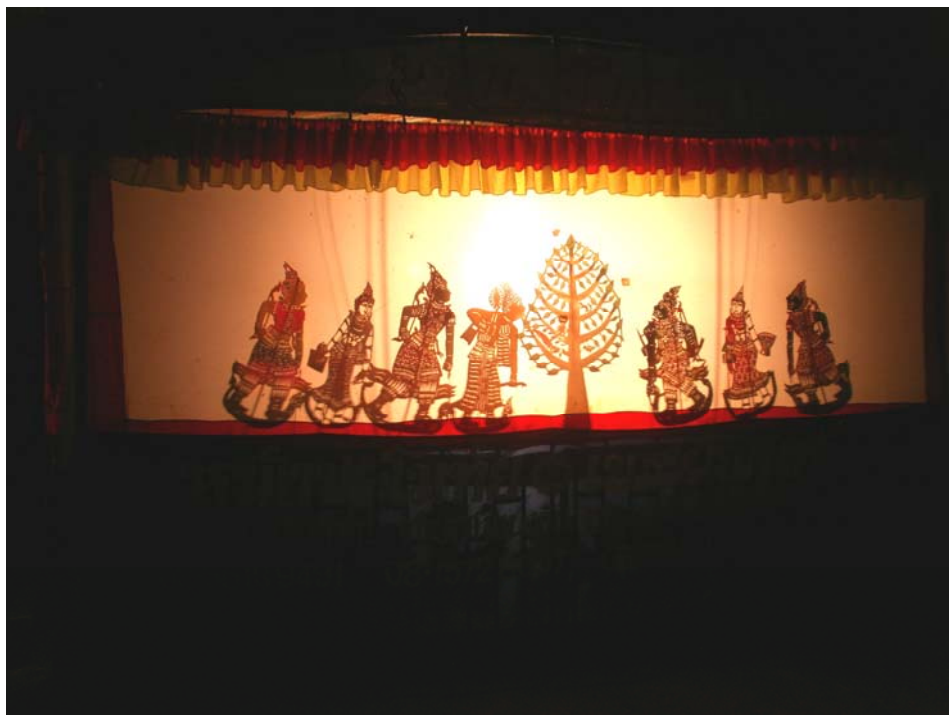
ภาพประกอบ 60 ด้านหน้าจอหนัง ขณะกำลังโหมโรง