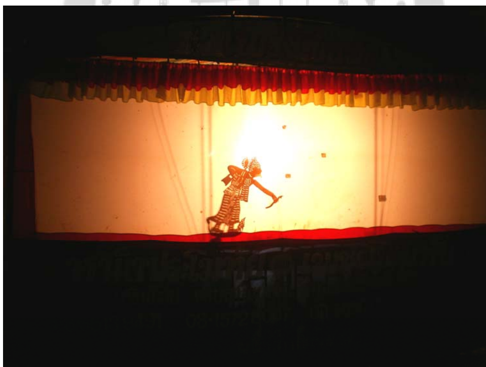
ภาพประกอบ 61 การออกรูปฤกษ์