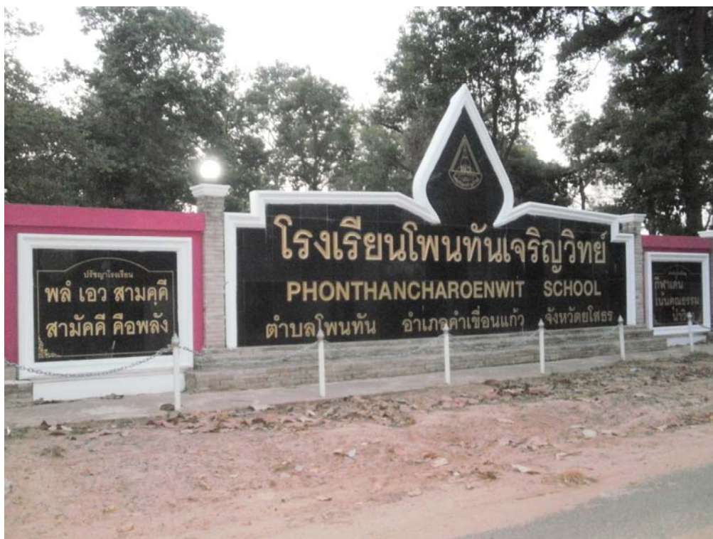
ภาพประกอบ 49 โรงเรียนโพนทันเจริญวิทย์