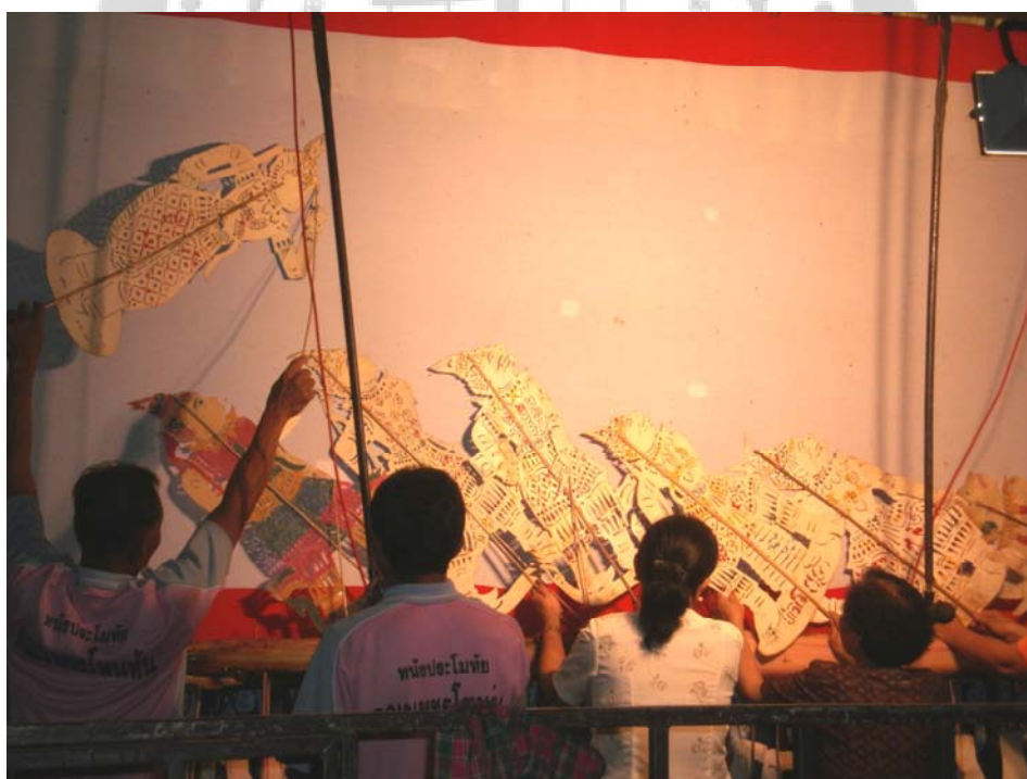
ภาพประกอบ 63 หลังจบขณะทำการเช็ดหนังต่อนสูรับ 1