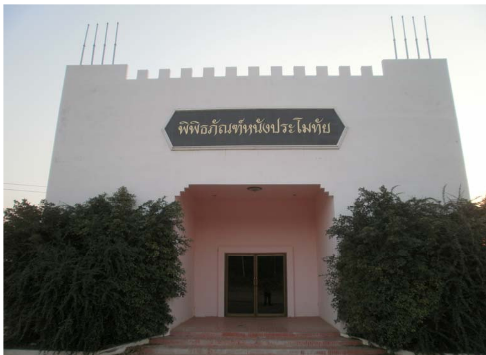
ภาพประกอบ 47 พิพิธภัณฑ์หนังประมอทัย บ้านโพนทัน 1