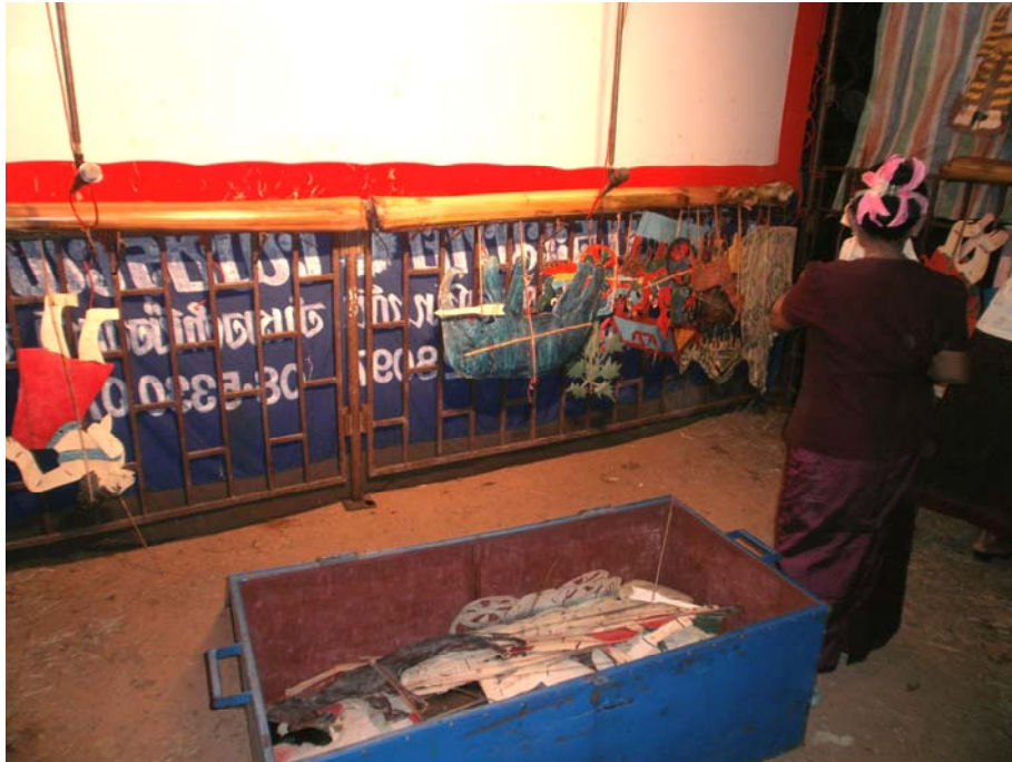
ภาพประกอบ 56 ขั้นตอนการเตรียมตัวหนังก่อนการแสดง 2