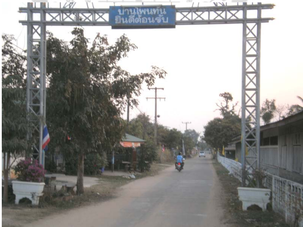
ภาพประกอบ 42 ทางเข้าบ้านโพนทัน