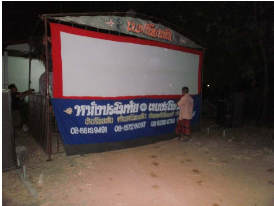
ภาพประกอบ 54 โรงหนังประจักษ์เมื่อเสร็จสมบูรณ์