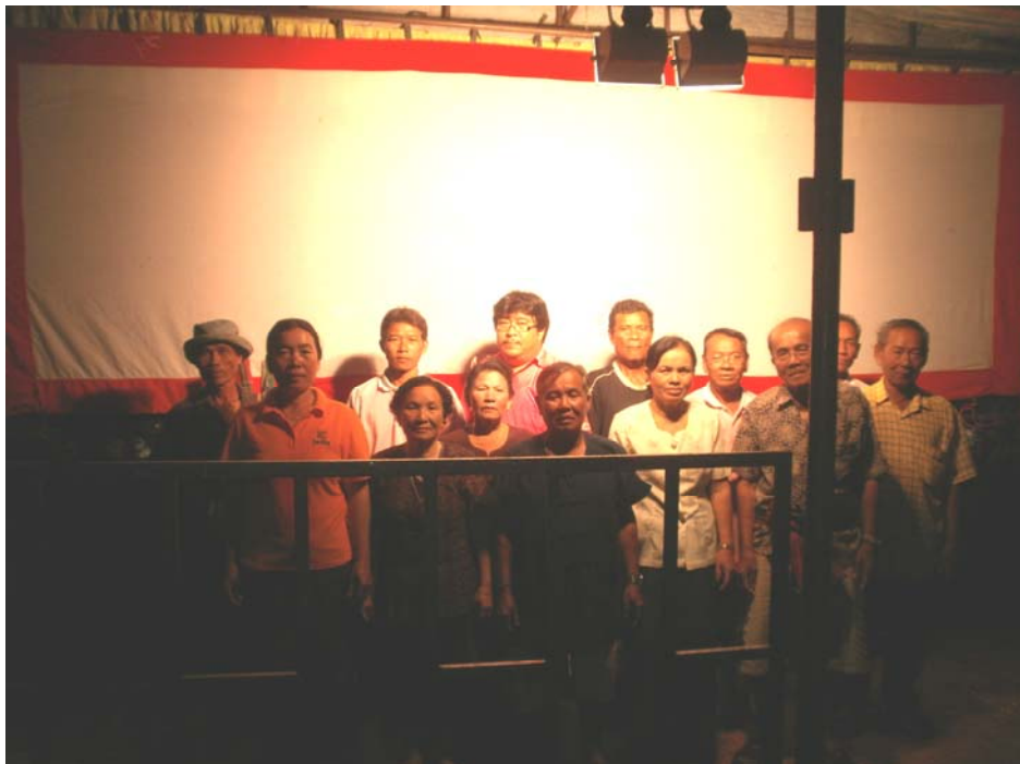
ภาพประกอบ 65 ผู้วิจัยและคณะนักเซตหน้า นักดนตรี คณะเพชรโพเนทัน