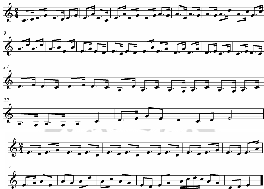
ภาพประกอบ 21 ดนตรีรับร้องบทไหว้ครู 3

ผู้เข็ด ผมจะได้เล่นลัดตัดฉัน ตัดเอาตอนสำคัญนั้นมากแล้ว ผมจะเล่นไปตามเรื่องที่มีมันมี มิได้แก่ พระบาลีมากแล้วจา