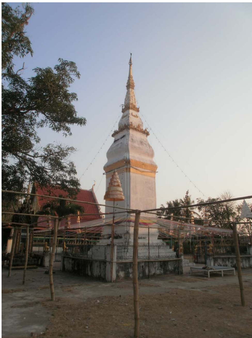
ภาพประกอบ 45 พระธาตุโพนทัน