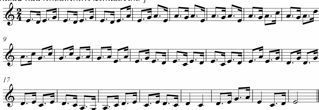
ภาพประกอบ 30 ดนตรีรับร้องรับพากย์

หล่อจริง ๆ สีเขียวนากะรินมันบินอยู่ต้นไม้ คนที่ใส่ชุดดำก็งามขำไม่หยอก คนที่ใส่ชุดลายดอกนั้นก็ ทันสมัย ผมมารักสีแดงก็เพราะเห็นแสงไกล ๆ”