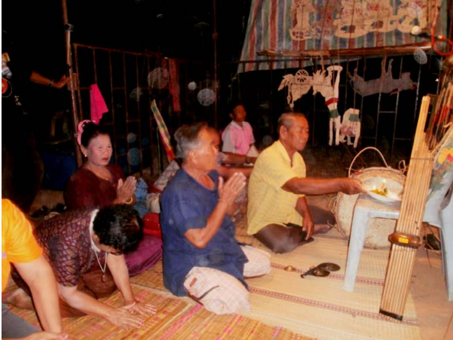
ภาพประกอบ 58 ไหว้ครูก่อนเริ่มทำการแสดง