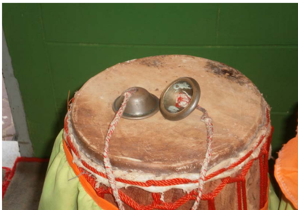
ภาพประกอบ 6 ฉิ่ง

ฉิ่ง เป็นเครื่องตีประเภทกำกับจังหวะ ทำด้วยโลหะ หล่อหนา เว้ากลาง ปากผายกลม รูปคล้ายถ้วยขามไม่มีก้น สำหรับหนึ่งมี ๒ ฝา เรียกตามลักษณะ นามว่า คู่ ตรงกลางที่เว้าเจาะรูสำหรับร้อยเชือก เพื่อสะดวกในการถือตี เวลาตีใช้มือขวาจับฉิ่งข้างหนึ่งให้คว่ำลง ยกขึ้นตีให้กระทบกับมืออีกข้างหนึ่ง ซึ่งจับ ฉิ่งหงายขึ้นรับ มีเสียงดัง 2 เสียง คือ เสียงฉิ่ง และเสียงฉับ ใช้ตีเป็นเครื่องกำกับหนัก-เบาที่สำคัญ ในวงปี่พาทย์ทุวง และยังเป็นเครื่องตีบอกอัตราของเพลงขณะบรรเลง ที่สำคัญที่สุด เป็นเครื่องควบคุมความช้า-เร็วของวงทำทำนองเพลงทุกคน ดังมีคำกล่าวที่ว่า ฉิ่งเป็นหลักของเนื้อทำนองเพลง ฉิ่งเป็นหลักของเครื่องกำกับจังหวะ