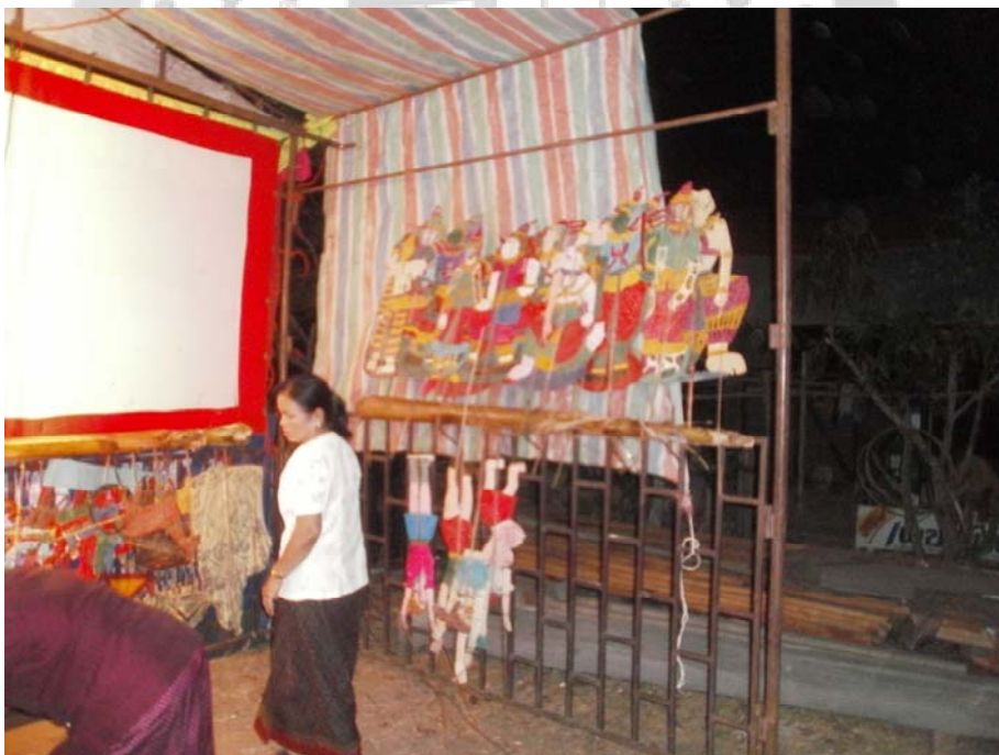
ภาพประกอบ 55 ขั้นตอนการเตรียมตัวหนังก่อนการแสดง 1