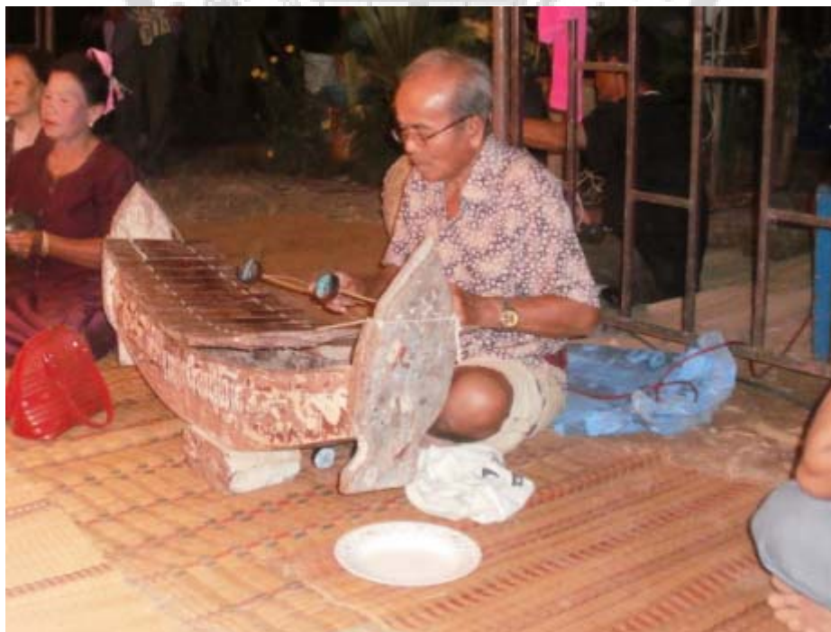
ภาพประกอบ 5 ระนาด