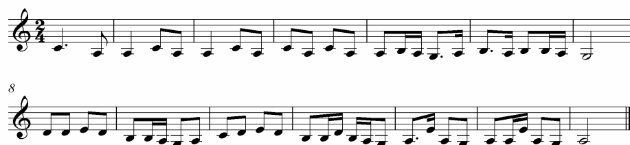
ภาพประกอบ 24 ดนตรีรับร้องบทไหว้ครู 5 (ท่อนซ้ำ)