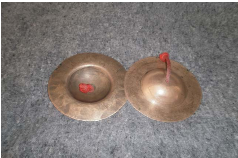
ภาพประกอบ 7 ฉาบเล็ก

คีย์บอร์ด หนังสือประโมทัยคณะเพชรโพทันทัน ได้เริ่มนำเอาเครื่องขยายเสียงเข้ามาช่วยในการพากย์ การขับร้องในปีพ.ศ. 2520 และในอีก 1 ปีต่อมาหนังสือประโมทัยคณะเพชรโพทันทัน จึงได้เริ่มนำเอาเครื่องดนตรีสากลมาช่วยในการบรรเลงประกอบการแสดง เช่น คีย์บอร์ด กลองชุด เบส กีตาร์ และกีตาร์ไฟฟ้า เข้ามาร่วมประสมในวงตามลำดับ ทำให้การแสดงหนังสือประโมทัยยุคหลังๆ มักจะเน้นไปทางหมอลำประยุกต์ หรือหมอลำซึ่งเป็นส่วนใหญ่ ทั้งนี้เนื่องมาจากความต้องการของผู้มาว่าจ้าง ที่ต้องการความสนุกสนานเร้าใจ และเหมือนได้ขอมไปด้วยในตัว เพราะนอกจากจะมี การแสดงหนังสือประโมทัยแล้ว ยังมีดนตรีสนุกสนานเร้าใจ บางงานอาจเพิ่มทางเครื่องเข้าไปด้วย ตามแต่ผู้ว่าจ้างจะกำหนดมา