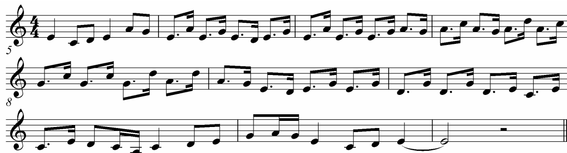
ภาพประกอบ 33 ดนตรีรับบทสนทนา