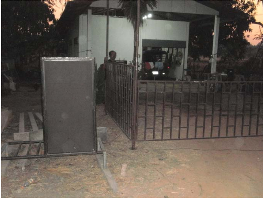
ภาพประกอบ 52 การจัดเตรียมโรงหนังประโมทัย