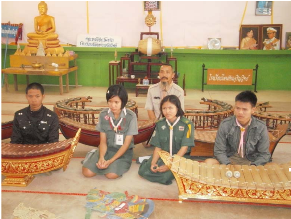
ภาพประกอบ 51 กลุ่มนักเรียนที่ได้รับการสืบทอดหนังประโมทัย