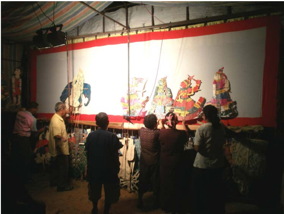
ภาพประกอบ 64 หลังจอบริการทำการเซตหน้าต่อนักรบ 2