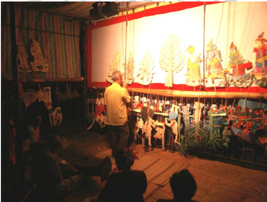
ภาพประกอบ 59 ด้านหลังจอหนัง ขณะกำลังไหมโรง