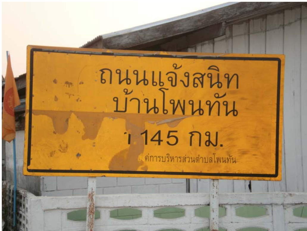
ภาพประกอบ 41 ป้ายบอกเส้นทางเข้าสู่บ้านโพนทัน