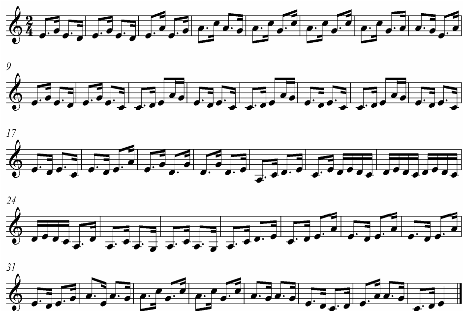
ภาพประกอบ 23 ดนตรีรับร้องบทไหว้ครู 4