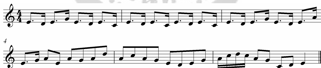
ภาพประกอบ 22 ดนตรีรับร้องบทไหว้ครู 4

ผู้เข็ด นี่แหละเขาเรียกหนังประโมทัย ที่มีมาตั้งแต่กรุงศรีอยุธยากรุงไกร