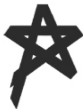
ภาพที่ 2 แสดงสัญลักษณ์วิชาชีพเภสัชกรรม

สัญลักษณ์ของวิชาชีพเภสัชกรรมมีความแตกต่างกันไปตามสถานที่และภูมิภาคเภสัชกรรมนั้นๆ สัญลักษณ์สากลทั่วไปสำหรับเภสัชกรรมคือ โกร่งบดยาและเรซิพี (Rx) เภสัชกรรมในประเทศที่ใช้ภาษาอังกฤษมักใช้ไขว่โกลบซึ่งเป็นโคมไฟแควนเป็นสัญลักษณ์ของร้านยาในสมัยโบราณ ปัจจุบันองค์กรทางเภสัชกรรมทั่วโลกใช้สัญลักษณ์สากลสำคัญได้แก่ ถ้วยตวงยา ถ้วยยาไฮเกีย และคทาจูไซว้ แต่ในภูมิภาคหรือบางประเทศมีสัญลักษณ์ทางเภสัชกรรมท้องถิ่น อาทิ ประเทศฝรั่งเศส อาร์เจนตินา สหราชอาณาจักร เบลเยียม และอิตาลีใช้สัญลักษณ์กากบาทเขียว ในประเทศเยอรมนีและออสเตรียใช้สัญลักษณ์คล้ายอักษร A ในภาษาอังกฤษซึ่งย่อมาจากคำว่า Apotheke ในภาษาเยอรมัน และในประเทศไทยใช้เฉลวเป็นสัญลักษณ์ของเภสัชกรรมไทย ( http://th.wikipedia.org/wiki )