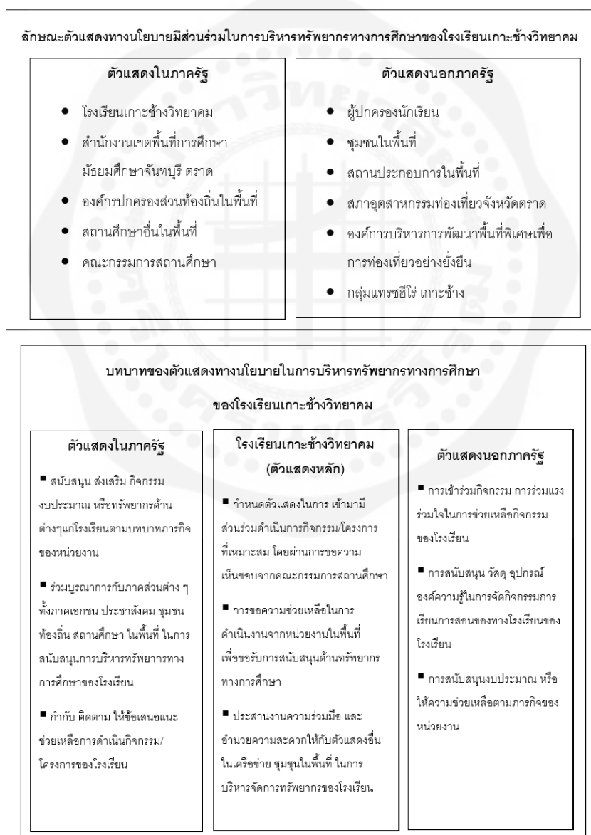
ภาพที่ 2 แสดงลักษณะและบทบาทของตัวแสดงทางนโยบายมีส่วนร่วมในการบริหารทรัพยากรทางการศึกษา ของโรงเรียนเกาะช้างวิทยาคม