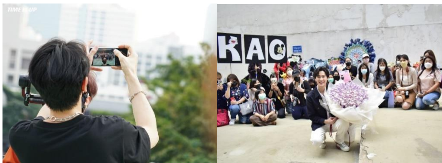
ภาพที่ 6 กลุ่มแฟนคลับของนักแสดง เก้า นพเก้า และ อัฟ ภูมิพัฒน์