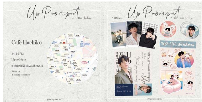
ภาพที่ 3 ตัวอย่างโปรเจกต์วันเกิดที่แฟนคลับฮ่องกงจัดให้กับอัฟ ภูมิพัฒน์

เมื่อเข้าสู่ช่วงเวลาประมาณปี พ.ศ.2561-2564 เป็นช่วงที่ทั้งตัวของนิยายวายและซีรีส์วายต่างได้รับความนิยมเป็นอย่างมาก สื่อเริ่มหยิบนิยายวายมาผลิตเป็นซีรีส์วายให้แฟนคลับได้รับชม ซึ่งแฟนคลับวายเป็นกลุ่มเป้าหมายใหม่ของตลาดการผลิตสื่อ รวมถึงวัฒนธรรมวายเองก็เริ่มมีการเปลี่ยนแปลงในวงกว้างมากขึ้น เริ่มเป็นที่รู้จัก และยังสามารถแสดงออกต่อสาธารณะได้มากขึ้น จนเกิดมิติในการแจ้งเกิดของนักแสดงวัยรุ่นใหม่ๆ ซึ่งสิ่งเหล่านี้สามารถสะท้อนให้เห็นว่า ณ ปัจจุบันกลุ่มแฟนคลับวายได้ขยายตัวกลายเป็นแฟนคลับขนาดใหญ่กว่าในอดีต ที่พร้อมผลักดันให้นักแสดงวัยรุ่นที่ตนเองชื่นชอบเข้าไปใกล้สปอตไลท์มากที่สุด ซึ่งแน่นอนว่าที่ซีรีส์วายมีฐานแฟนคลับมากจนถึงในปัจจุบันก็สืบเนื่องมาจากวัฒนธรรมซีรีส์วายจากทั้งเกาหลีใต้ จีน ญี่ปุ่น หรือไทย ที่โอนถ่ายและไหลเวียนเปลี่ยนไปมาระหว่างกัน หากลองสังเกตรอบๆ ตัว จะเห็นได้ชัดเจนว่ามีทั้งเพจ Cute Boy ตามมหาวิทยาลัยต่างๆ เกิดขึ้น จนอาจกล่าวได้ว่าวัฒนธรรมคู่ใจ และความวายได้เปลี่ยนถ่ายสู่วิถีชีวิตของเราในทุกๆ ด้านเป็นที่เรียบร้อยแล้ว และนับได้ว่าวัฒนธรรมวายเองก็ได้กลายเป็นอุตสาหกรรมบันเทิงนานาชาติไปด้วยเช่นกัน (Peeranat chansakoolnee, 2563)