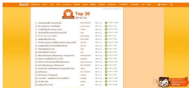
ภาพที่ 2 20 อันดับหมวดหมู่นิยายวายบนเว็บไซต์ Dek-D

ช่วงเวลาต่อมาในปี พ.ศ. 2557-2558 เป็นช่วงเวลาที่แฟนฟิคค่อยๆ พัฒนาเป็นนิยายวายที่ผู้แต่งคิดพล็อตเนื้อเรื่องเอง ซึ่งพล็อตที่ได้รับความนิยมมากที่สุด เป็นพล็อตที่มีแก่นเรื่องความรัก ความสัมพันธ์ของผู้มีเพศสภาพ (Gender) เดียวกัน และเลื่อมใสเพศวิถี (Sexuality) มีความรักในรูปแบบชายรักชาย, หญิงรักหญิง โดยอาจเริ่มต้นจากมิตรภาพหรือศัตรู แต่ท้ายที่สุดจะขยับไปสู่สถานะที่มากกว่าเพื่อน พี่ และน้อง ซึ่งก็คือคนรัก The potential (2564) ซึ่งการแสดงออกในวัฒนธรรมมวยไทยก็ขยายออกไปในวงกว้างมากขึ้นจากแต่เดิม แต่ก็ยังอยู่ในขอบเขตบนโลกออนไลน์หรือสื่อออนไลน์เพียงเท่านั้น ในพื้นที่สาธารณะยังไม่สามารถแสดงความชอบได้อย่างเปิดเผยได้มากนัก ต่อมาเมื่อนิยายวายได้รับความนิยมจากผู้อ่านบนโลกออนไลน์ก็ถูกดึงนำไปผลิตซีรีส์วาย ซึ่งซีรีส์วายไทยเรื่องแรกคือ Love Sick The Series รักวุ่นวายรุ่นสับ ทำให้เกิดกระแสวายที่ถูกขยายเพิ่มมากขึ้น วัฒนธรรมมวยเองก็ถูกทำความเข้าใจและเรียนรู้จากสังคมมากขึ้น