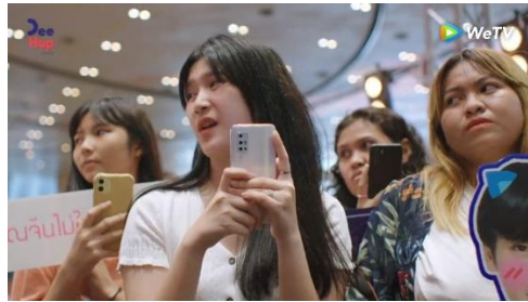
ภาพที่ 4 กลุ่มแฟนคลับสิบเอ๋ย VS สิบจีน