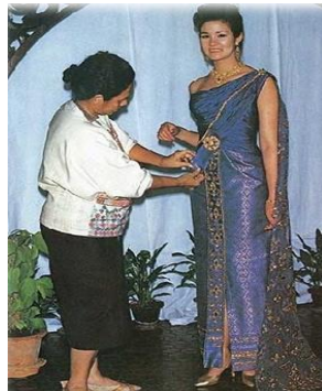
ภาพที่ 2 ชุดไทยประยุกต์โดยการออกแบบของห้องเสื้อระพี ที่มา: (लयค์ บุญยรัตพันธ์, 2531)

ห้องเสื้อระพีออกแบบชุดประจำชาติไทยชุดแรกเพื่อใช้ในการประกวดมิสยูนิเวิร์ส พ.ศ. 2531 ณ กรุงไทเป สาธารณรัฐจีน เพื่อให้ ภรณ์ทิพย์ นาคหิรัญกนก เป็นผู้สวมใส่ ชุดประจำชาติไทยที่ห้องเสื้อระพีออกแบบให้เป็นชุดไทยจักรีประยุกต์สีม่วงเม็ดมะปราง (สีม่วงอมแดง) ได้รับแรงบันดาลใจมาจากพระบรมฉายาลักษณ์ของสมเด็จพระนางเจ้าฯ พระบรมราชินีนาถ ตัดเย็บโดยใช้ผ้ายกดินทองสีม่วงเม็ดมะปราง ลวดลายสีเหลี่ยมข้าวหลามตัดดอกใหญ่ ประยุกต์เข้ากับตัวเสื้อจับเดรปแทนการห่มสไบ แต่ยังคงผ้าสไบด้านหลังไว้ สร้างความโดดเด่นด้วยการปักด้วยดินทองปักกลีบปิดทับตัวชุดให้มีความสวยงาม (ไทยรัฐ, 2531, 17 พฤษภาคม) เป็นชุดที่เรียบง่ายและสวยงาม อีกทั้งยังเสริมบุคลิกให้กับผู้สวมใส่ ทำให้ชุดไทยประยุกต์ชุดนี้ได้รับรางวัลชนะเลิศการประกวดชุดแต่งกายประจำชาติเป็นครั้งที่สอง ประกอบกับภรณ์ทิพย์ นาคหิรัญกนก ได้รับตำแหน่งมิสยูนิเวิร์ส พ.ศ. 2531 ส่งผลให้ห้องเสื้อระพีมีชื่อเสียงและเป็นที่รู้จักในฐานะผู้ออกแบบชุดแต่งกายประจำชาติให้กับมิสยูนิเวิร์ส