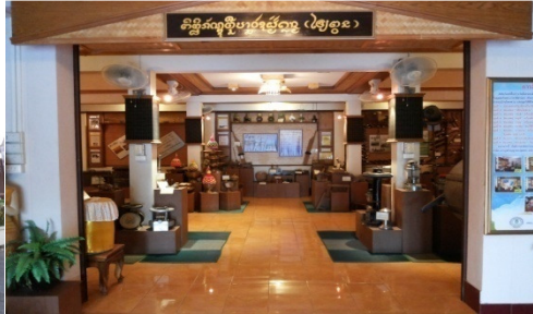
ภาพที่ 3 ภายในพิพิธภัณฑ์พื้นบ้าน วัดฝั่งคลอง