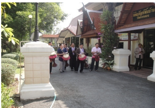
ภาพที่ 8 การตีกลองยาวต้อนรับ

... ที่ศูนย์วัฒนธรรมฯ นี้ ทุกคณะที่มาจะมีการต้อนรับตีกลองยาว ตั้งแต่เข้ามาเลย แล้วก็รำกันเข้ามาในห้องบรรยาย ก็จะเล่าเรื่องราวคนพวนมาying ینگ จากนั้น มีรำโขน ลำพวน ลำตัดแต่เป็นภาษาพวน ตอนนี้พวกผมก็ดำเนินการกันอยู่ยังรักษา ยังมีการแสดงให้เห็นตลอด ก่อนเข้าชมพิพิธภัณฑ์ฯ ผมจะบอกทุกคณะ ทุกหมู่ที่มา อยู่ข้างนอกนี่ก็เป็นไทยนะครับ พอหลุดประตูเข้าไปเป็นพวนแล้ว (จากคำสัมภาษณ์ของผู้ให้ข้อมูลคนที่ 13)