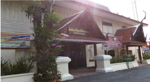
ภาพที่ 2 พิพิธภัณฑ์พื้นบ้าน วัดฝั่งคลอง

มุมที่ 9 จัดแสดง “ของสะสม” ในการใช้ชีวิตประจำวันของชาวไทยพวนในอดีต