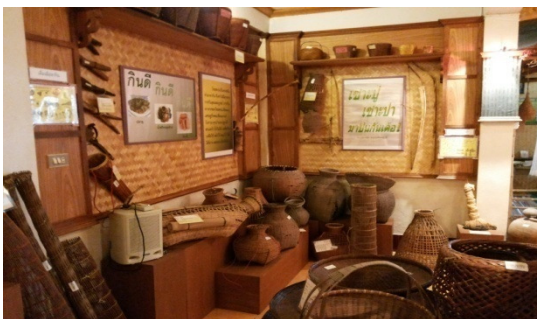
ภาพที่ 6 มุมจัดแสดงสิ่งของเครื่องใช้

เมื่อวิเคราะห์การจัดแสดงสิ่งของเครื่องใช้โบราณในพิพิธภัณฑ์พื้นบ้านวัดฝั่งคลอง พบว่า เป็นการจัดวางสิ่งของให้เป็นหมวดหมู่ มีการระบุชื่อสิ่งของนั้นเป็นภาษาพวน ภาษาไทย และภาษาอังกฤษ การเขียนชื่อสิ่งของเป็นอักษรไทยน้อย รวมถึงการอธิบายวัสดุที่ใช้ทำ ประโยชน์ และวิธีการใช้ ทั้งภาษาไทยและภาษาอังกฤษ ทำให้ผู้เยี่ยมชมได้รับความรู้ในสิ่งของนั้นมากขึ้น หากแต่สิ่งของเครื่องใช้ที่จัดแสดงนั้นมิได้มีป้ายบรรยายทุกชิ้น บางชิ้นมีเพียงป้ายชื่อภาษาไทยติดไว้เท่านั้น