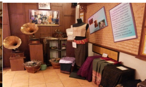
ภาพที่ 5 มุมเครื่องแต่งกายชาวไทยพวน

เมื่อวิเคราะห์การจัดแสดงสิ่งของเครื่องใช้โบราณในพิพิธภัณฑ์พื้นบ้านวัดฝั่งคลอง พบว่า เป็นการจัดวางสิ่งของให้เป็นหมวดหมู่ มีการระบุชื่อสิ่งของนั้นเป็นภาษาพวน ภาษาไทย และภาษาอังกฤษ การเขียนชื่อสิ่งของเป็นอักษรไทยน้อย รวมถึงการอธิบายวัสดุที่ใช้ทำ ประโยชน์ และวิธีการใช้ ทั้งภาษาไทยและภาษาอังกฤษ ทำให้ผู้เยี่ยมชมได้รับความรู้ในสิ่งของนั้นมากขึ้น หากแต่สิ่งของเครื่องใช้ที่จัดแสดงนั้นมิได้มีป้ายบรรยายทุกชิ้น บางชิ้นมีเพียงป้ายชื่อภาษาไทยติดไว้เท่านั้น