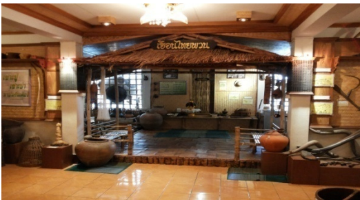
ภาพที่ 4 มุมเรือนไทยพวน