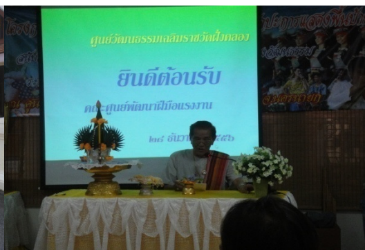
ภาพที่ 9 การทำพิธีบายศรีสู่ขวัญ

นอกจากนี้ ศูนย์วัฒนธรรมเฉลิมราชวัดฝิ่งคลองริเริ่มทำโครงการมัคคุเทศก์ชุมชน และจัดทำคู่มือการท่องเที่ยวชุมชนด้วย โดยนำชาวบ้านและเด็กๆ มาเป็นอบรบการเป็นมัคคุเทศก์เรียนรู้เรื่องราวและวิถีชีวิตของชุมชนไทยพวน ซึ่งได้รับการสนับสนุนงบประมาณสำนักงานวัฒนธรรมจังหวัดนครนายก ดังผู้ให้ข้อมูลคนที่ 16 กล่าวว่า “มีการอบรมมัคคุเทศก์ทั้งที่เป็นผู้ใหญ่และเด็กในชุมชน เพื่อดึงเรื่องราวชุมชนขึ้นมา และจัดทำคู่มือการท่องเที่ยวในชุมชนด้วย” สอดคล้องกับผู้ให้ข้อมูลคนที่ 17 ว่า