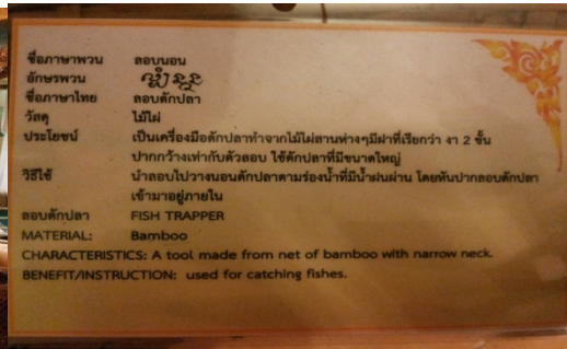
ภาพที่ 7 ป้ายบรรยายสิ่งของเครื่องใช้