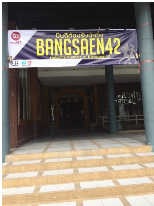
ภาพที่ 8 ป้ายต้อนรับนักวิ่งหน้าโรงแรม ในบริเวณเส้นทางวิ่ง