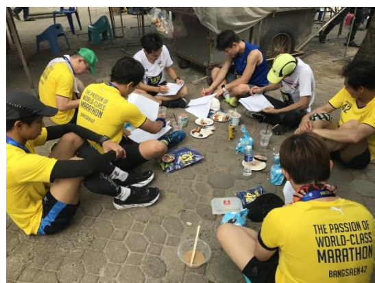
ภาพที่ 5 บรรยากาศการทำแบบสอบถาม