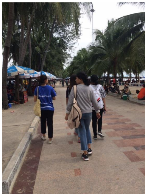
ภาพที่ 9 ผู้วิจัยสำรวจบริเวณโดยรอบถนน