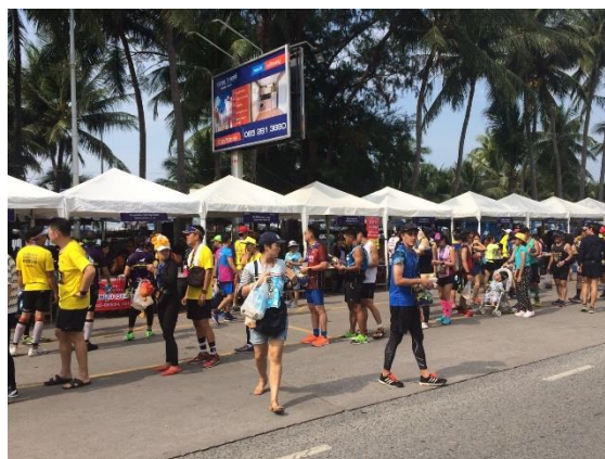
ภาพที่ 4 บรรยากาศจุดแลก