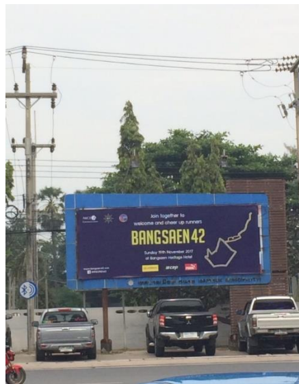
ภาพที่ 2 ป้ายงานวิ่งมาราธอน