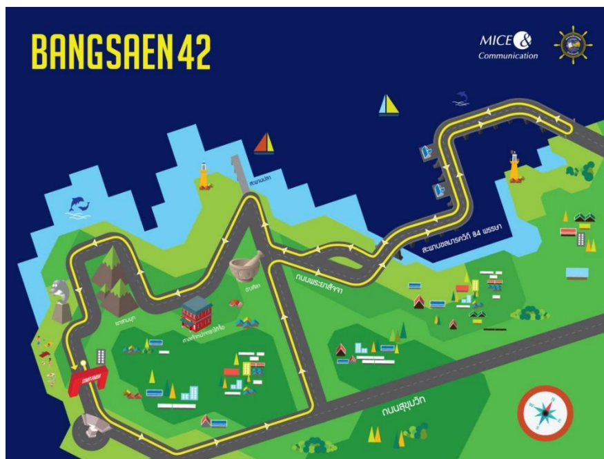
ภาพที่ 1 แผนที่เส้นทางในงานวิ่งมาราธอนบางแสน42