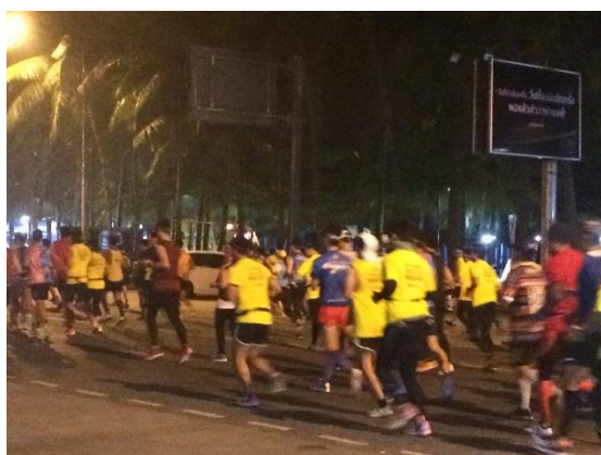
ภาพที่ 3 บรรยากาศช่วงปล่อย