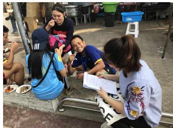
ภาพที่ 6 บรรยากาศการทำแบบสัมภาษณ์