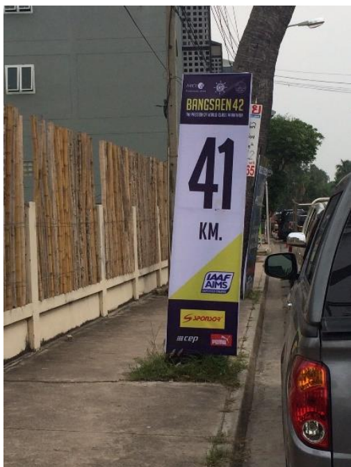
ภาพที่ 7 ป้ายกำกับระยะ