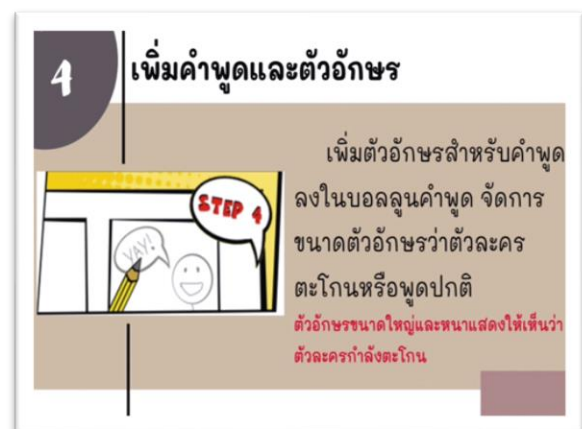
ภาพที่ 2 วีดิทัศน์เรื่องการเขียนการ์ตูนช่องสร้างสรรค์