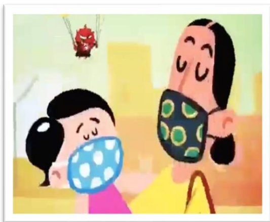
ภาพที่ 1 วีดิทัศน์การ์ตูนCOVID-19.

การจัดกิจกรรมการเรียนการสอนในรูปแบบออนไลน์ เรื่อง การเขียนการ์ตูนช่องสร้างสรรค์ ผู้สอนใช้สื่อการเรียนการสอนในรูปแบบวีดิทัศน์ ได้แก่ วีดิทัศน์การ์ตูนCOVID-19 วีดิทัศน์เรื่องการเขียนการ์ตูนช่องสร้างสรรค์และใช้เครื่องมือต่าง ๆ ใน Microsoft teams ได้แก่ การอัปโหลดสื่อการสอนต่าง ๆ ไว้ใน files เพื่อให้นักเรียนสามารถเข้ามาเปิดดูย้อนหลัง และการสร้าง Assignment เพื่อให้นักเรียนส่งงานและรับผลย้อนกลับ (feedback) จากครูผู้สอนเพื่อปรับปรุงพัฒนาทักษะด้านต่าง ๆ ต่อไป