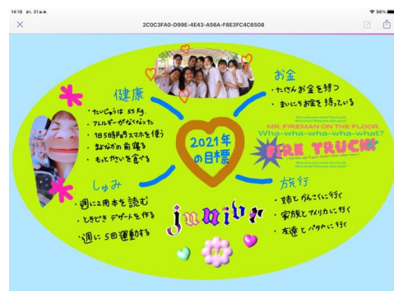
(ตัวอย่างแผนผังความคิดของผู้เรียน)