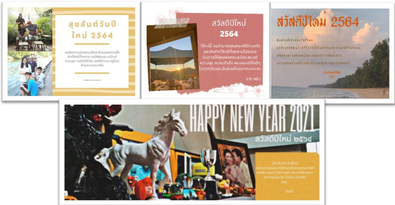
ภาพที่ 5-8 ตัวอย่างผลงานนักเรียน