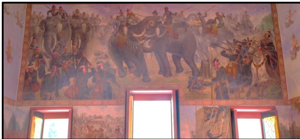
ภาพที่ 5 : สมเด็จพระนเรศวรมหาราชทรงทำยุทธหัตถีกับพระมหาอุปราชา

(หนังสือเรียนรายวิชาพื้นฐานภาษาไทย วรรณคดีวิจักษ์ ชั้นมัธยมศึกษาปีที่ 5. 2557 : 61)