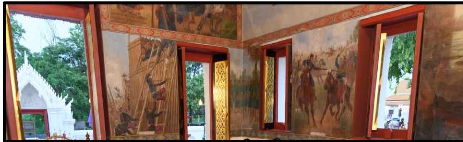
ภาพที่ 2 : ภาพเขียนผนังในพระวิหาร

ภาพเขียนผนังพระวิหาร วัดสุวรรณดารารามแสดงพระราชภารกิจของสมเด็จพระนเรศวรมหาราช