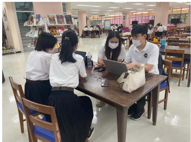
ภาพประกอบที่ 3 การทำงานร่วมกัน