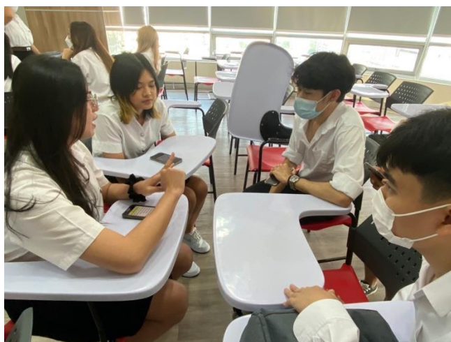
ภาพประกอบที่ 2 การสัมภาษณ์นิสิตระดับปริญญาตรี ชั้นปีที่ 1 - 4