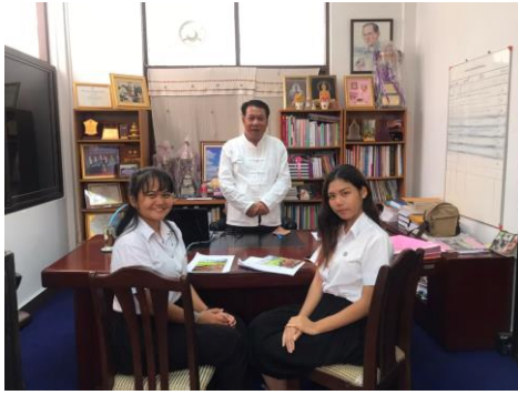
ภาพขณะเก็บข้อมูลที่ สำนักวัฒนธรรม จังหวัดน่าน