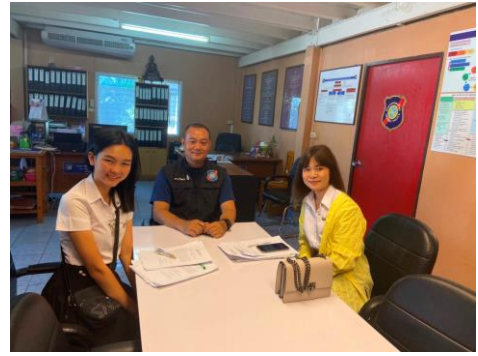
ภาพขณะเก็บข้อมูลที่ สถานีตำรวจท่องเที่ยว น่าน