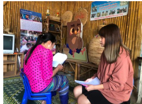
ภาพขณะเก็บข้อมูลที่ กลุ่มวิสาหกิจชุมชนกลุ่มจักรสานผู้สูงอายุ