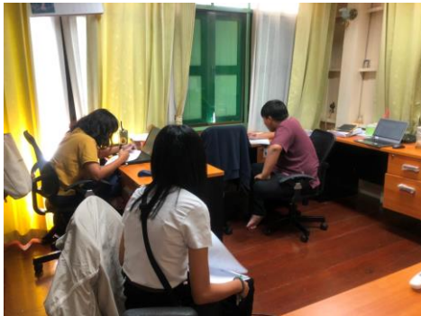
ภาพขณะเก็บข้อมูลที่ อพท.สำนักงานพื้นที่พิเศษเมืองเก่า น่าน