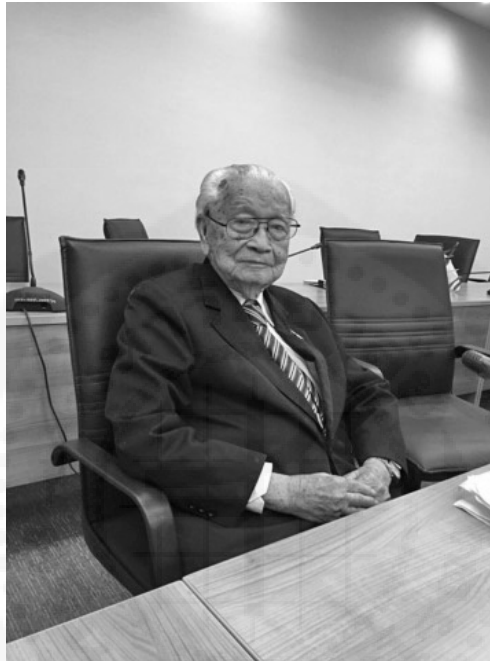
ศาสตราจารย์ ดร.ประเสริฐ ณ นคร ในวัย 99 ปี

ผลงานของ ศ. ดร.ประเสริฐมีมากมายหลายด้าน เช่น ประวัติศาสตร์สุโขทัย อยุธยา ล้านนา การอ่านจารึก วรรณกรรม ประพันธ์เนื้อเพลง ทำนองเพลงพระราชนิพนธ์ และทั่วไป ซึ่งยากจะกล่าวถึงให้ครอบคลุมได้ในบทความสั้น ๆ นี้ จึงขอกล่าวถึงเฉพาะผลงานที่เป็นความก้าวหน้าในการศึกษาประวัติศาสตร์สุโขทัยที่เป็นที่ยอมรับและใช้สอนในวิชาประวัติศาสตร์ของนักเรียนชั้นประถมศึกษา มัธยมศึกษา ตลอดจนมหาวิทยาลัย