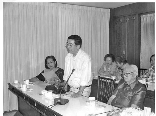
การสอบค้นเมืองฉอดโบราณของขุนสามชนใน พ.ศ. 2533 ของสมาคมประวัติศาสตร์ฯ