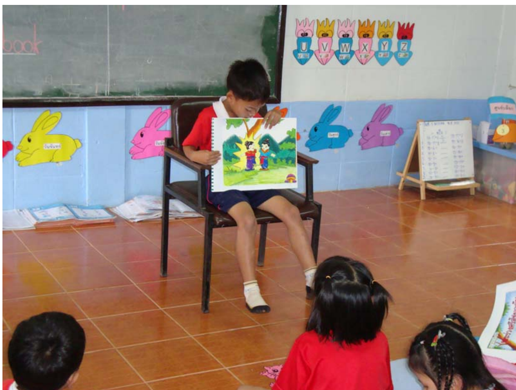
ตัวอย่างหนังสือและภาพการจัดกิจกรรมการเล่านิทานพื้นบ้านจังหวัดสุโขทัย