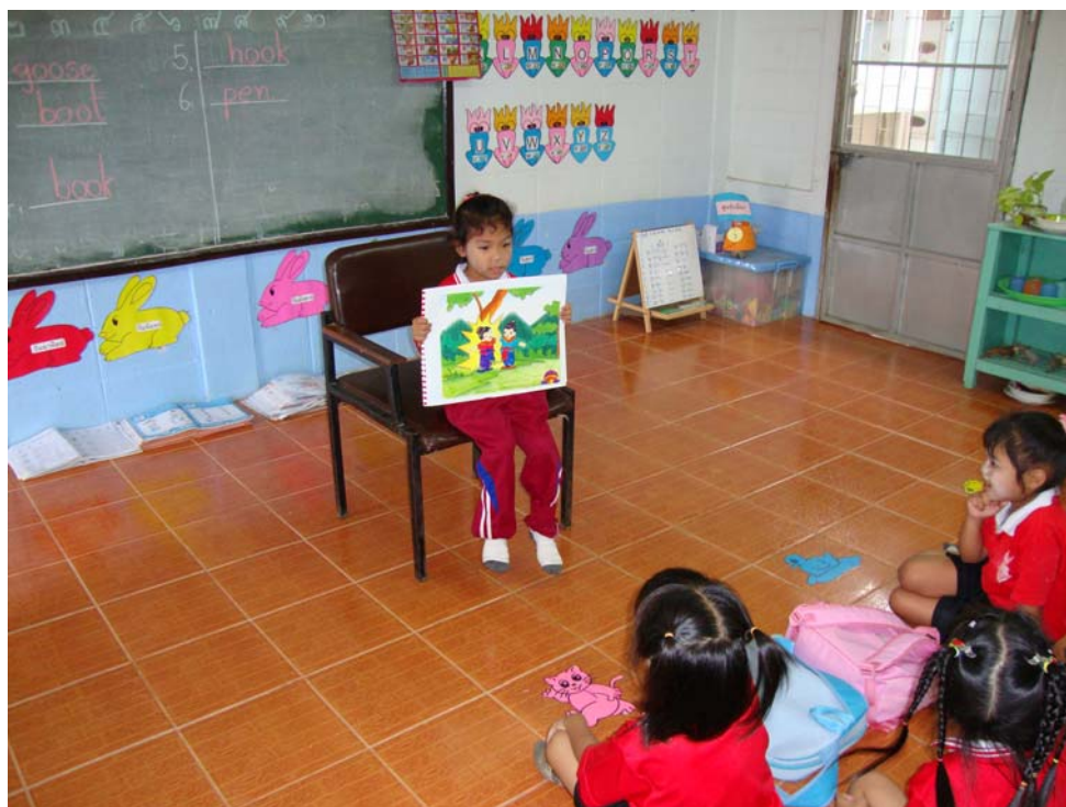
ตัวอย่างหนังสือและภาพการจัดกิจกรรมการเล่านิทานพื้นบ้านจังหวัดสุโขทัย