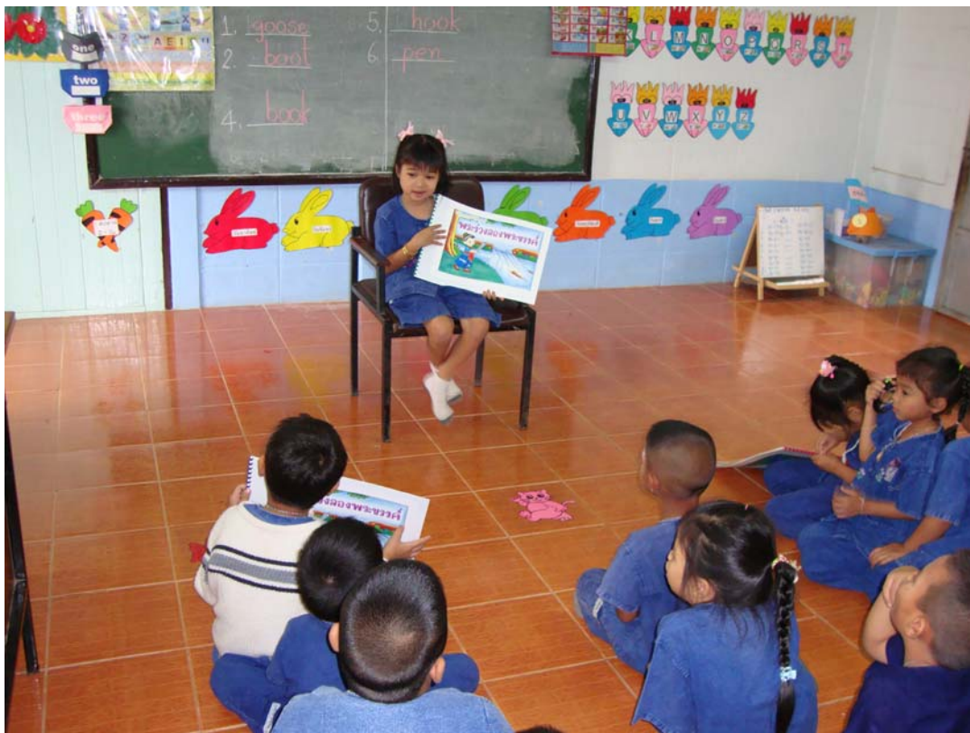
ตัวอย่างหนังสือและภาพการจัดกิจกรรมการเล่านิทานพื้นบ้านจังหวัดสุโขทัย