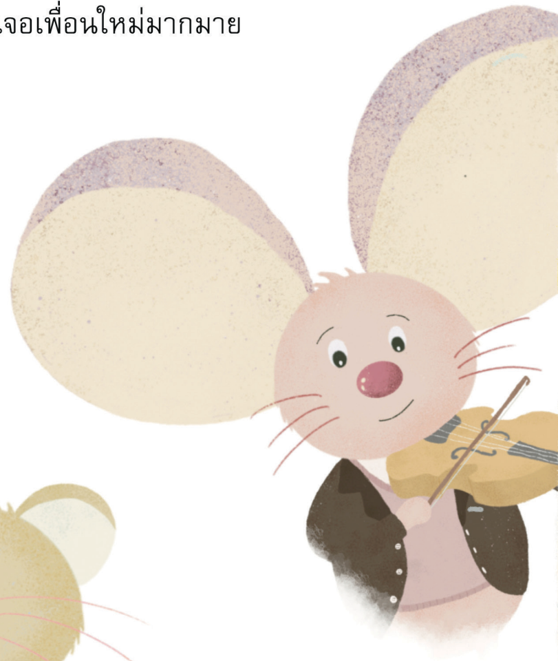
และเจ้าหูกาง