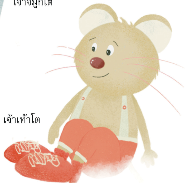
เจ้าเท้าโต