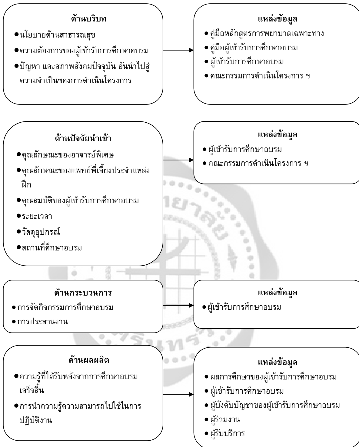
ภาพประกอบ 1 กรอบแนวคิดในการวิจัย