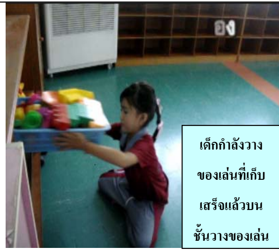
เด็กกำลังวาง ของเล่นที่เก็บ เสร็จแล้วบน ชั้นวางของเล่น