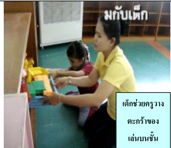
เด็กช่วยครูวาง ตะกร้าของ เล่นบนชั้น