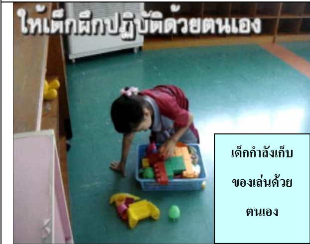
เด็กกำลังเก็บ ของเล่นด้วย ตนเอง