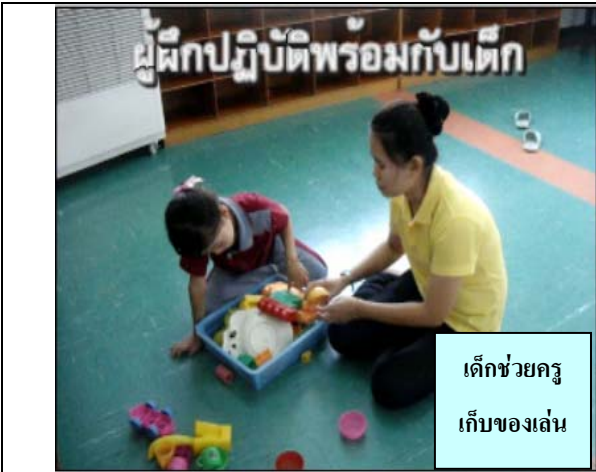
เด็กช่วยครู เก็บของเล่น