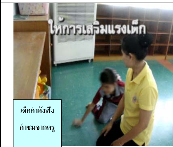
เด็กกำลังฟัง คำชมจากครู