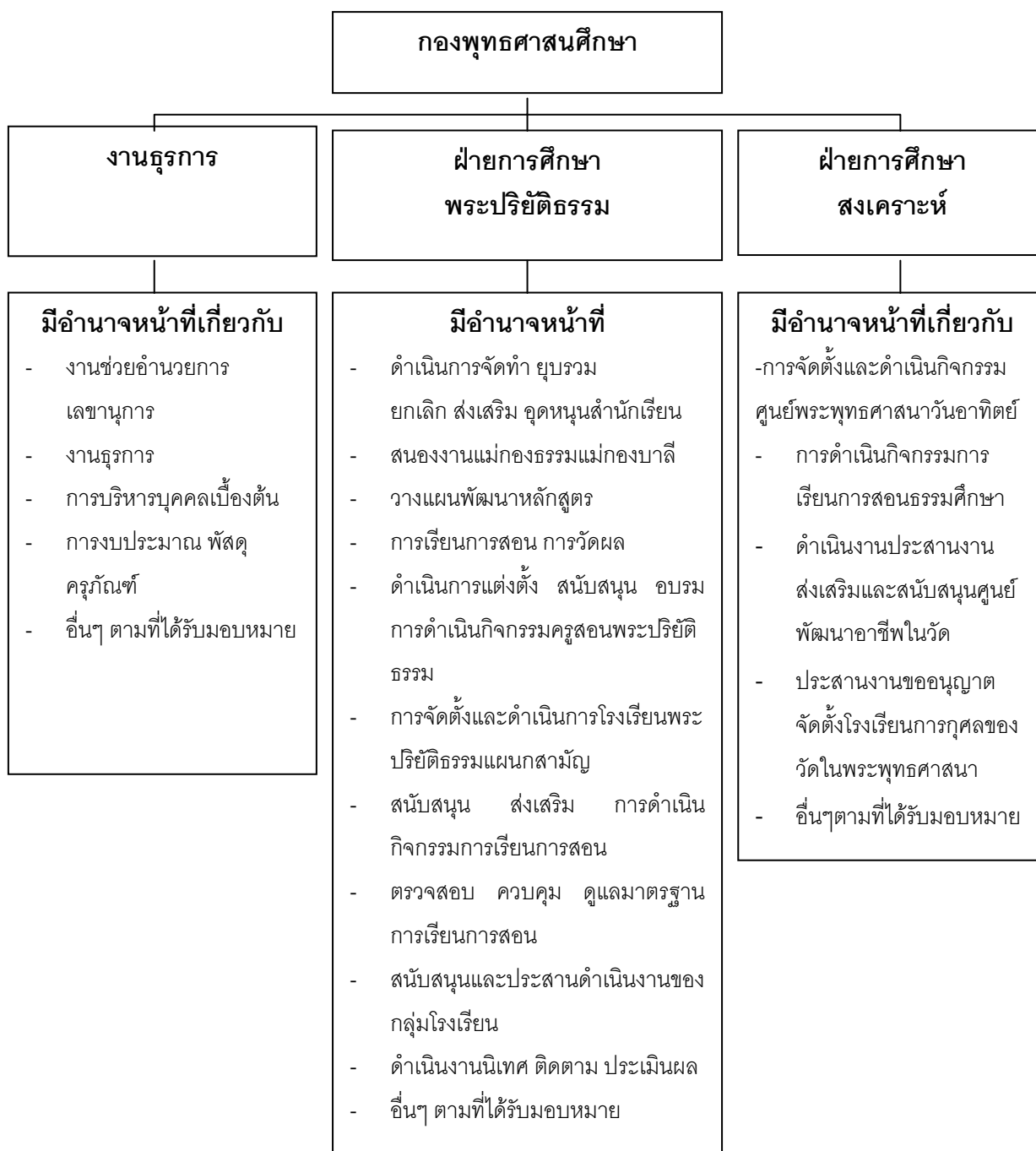
ภาพประกอบ 2 แผนภูมิกองพุทธศาสนศึกษา

สามัญศึกษา การพัฒนาบุคลากรทางการศึกษาการประสานงานการดำเนินงานกับกลุ่มโรงเรียนเป็น ต้น