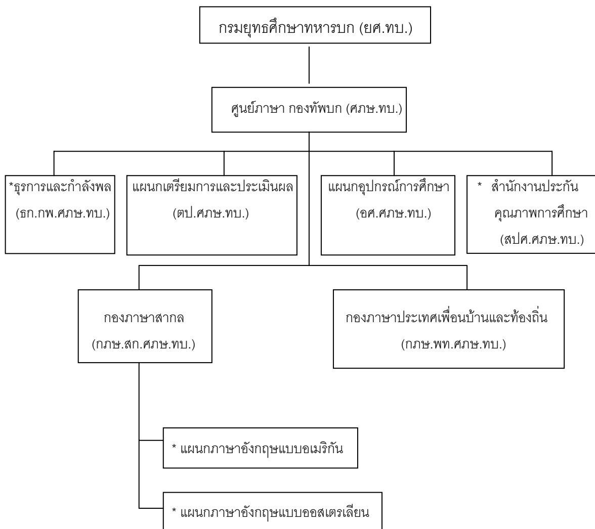
ภาพประกอบ 3 การจัดโครงสร้างภายในของ ศภษ.ทบ.

ที่มา: ศูนย์ภาษา กองทัพบก. (2551, 29 สิงหาคม). ระเบียบว่าด้วย การอำนวยการ การปกครอง และการบังคับบัญชาผู้เข้ารับการศึกษา หรืออบรม พ.ศ.2551: 1