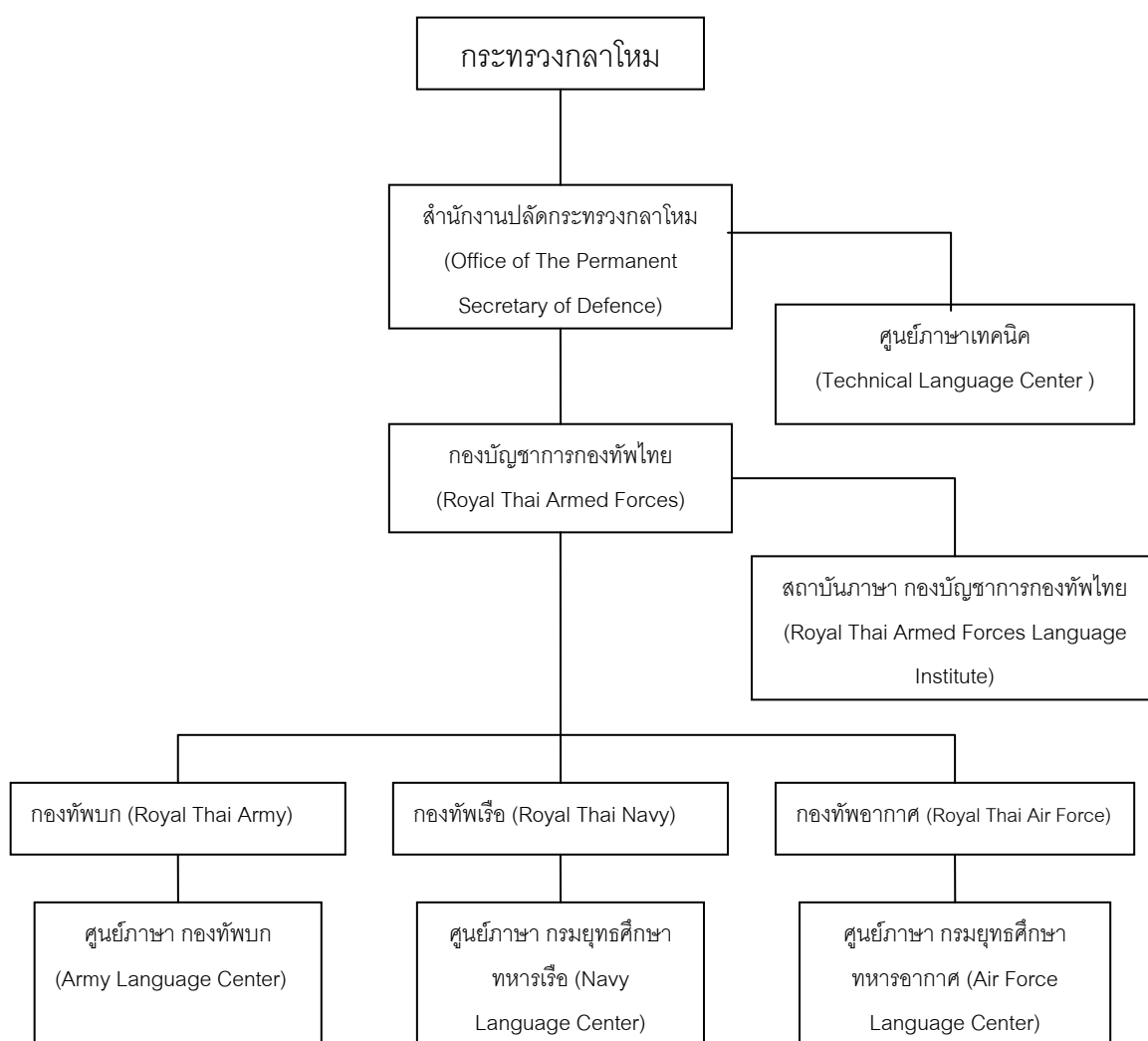
ภาพประกอบ 2 โครงสร้างศูนย์ภาษา สังกัด กระทรวงกลาโหม

ที่มา: สถาบันภาษา กองบัญชาการกองทัพไทย. (2551). Commander Officers' Regional English Language Seminar V ณ กรุงเทพฯ . (เอกสารประกอบการประชุม). ไม่ปรากฏเลขหน้า.