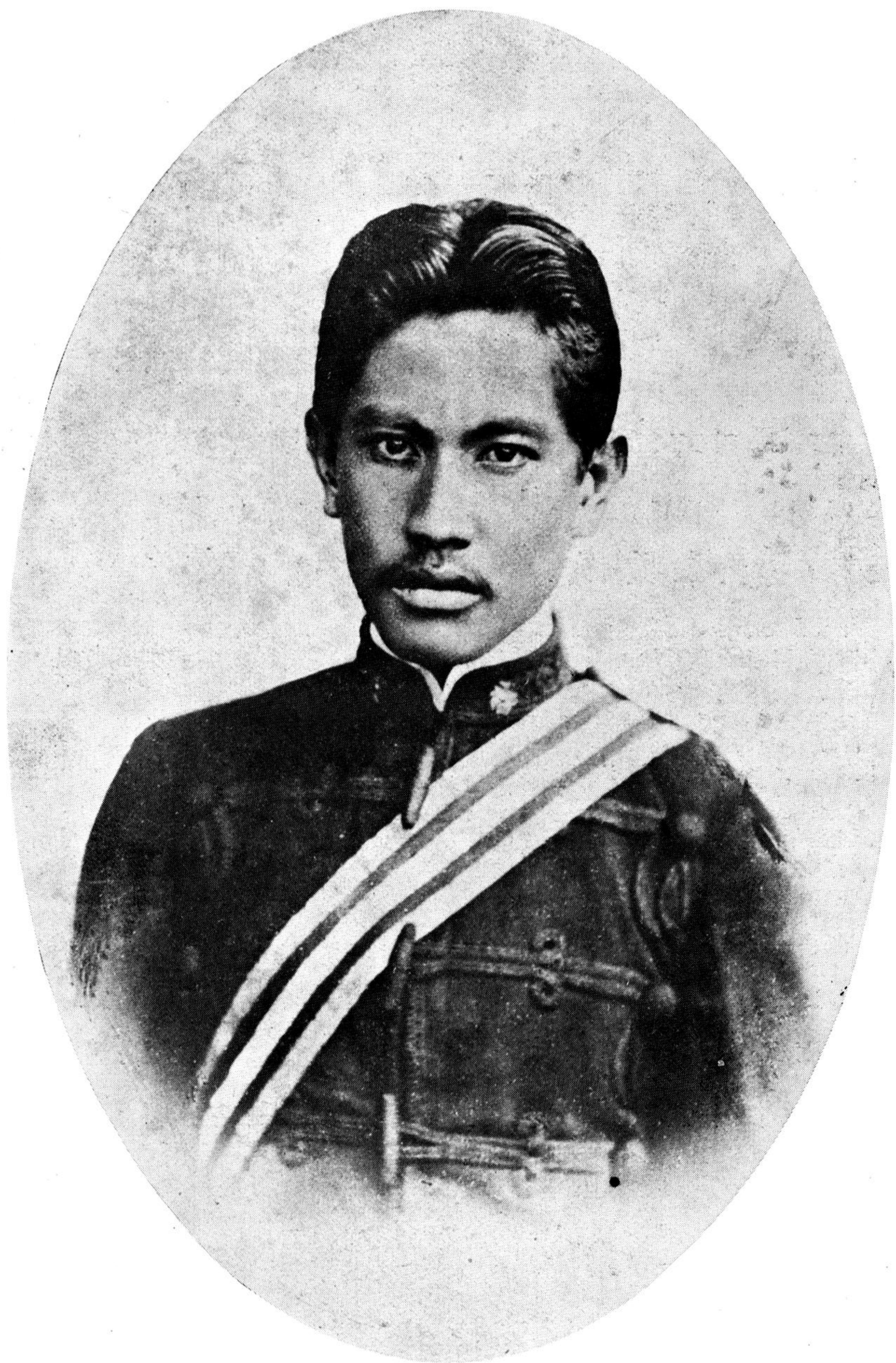
เมื่อยยศชนนายร้อย ในกรมทหารมหาดเล็ก ๆ