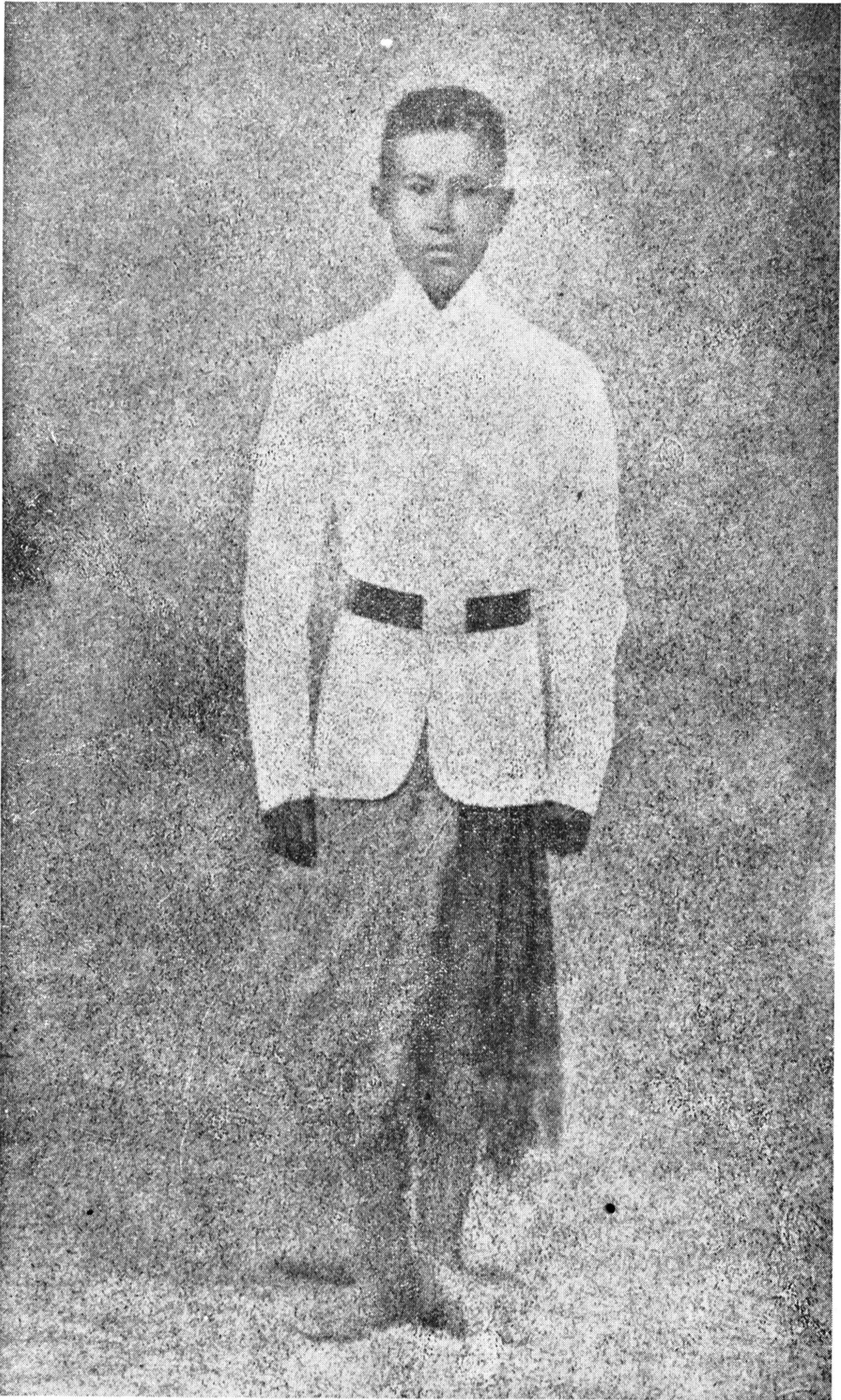
เจ้าพระยาราชศุภมิตร เมื่อเป็นพลทหารมหาดเล็กรักษาพระองค์