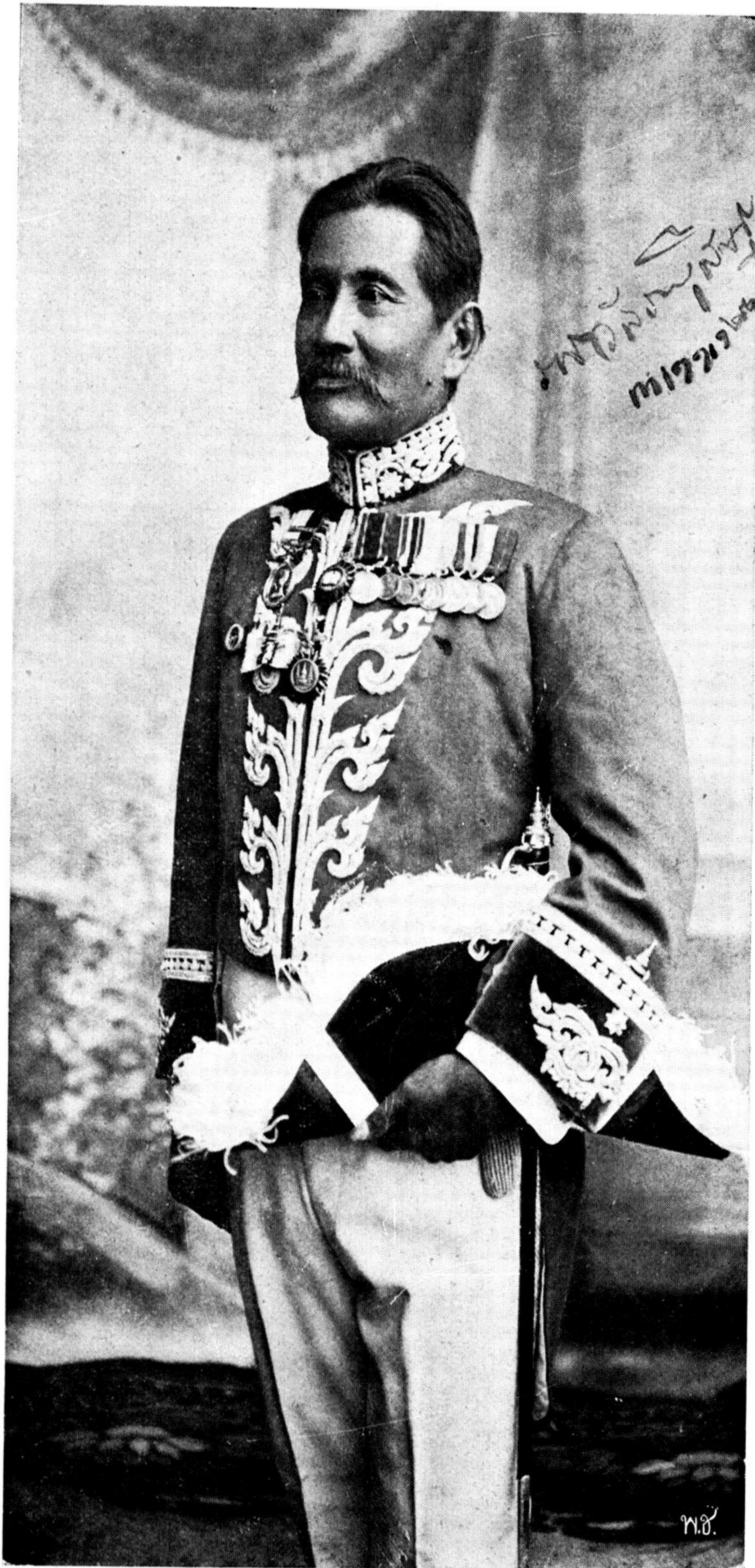
๕ ๓๐ ๑ ๙ ๒ เมอมตาแหน่งเบ็นเจ้ากรมวัง